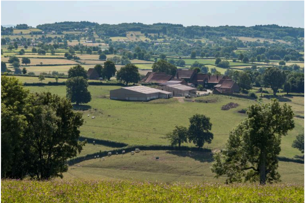
Vue du hameau des Bouffiers