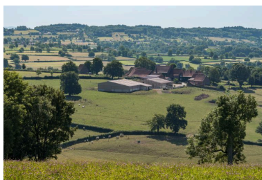
Vue du hameau des Bouffiers IVR26_20187100139NUC4A