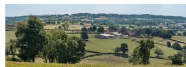
Vue du hameau des Bouffiers