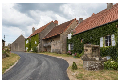
Vue de l'alignement des maisons du hameau des Bouffiers IVR26_20187100157NUC4A