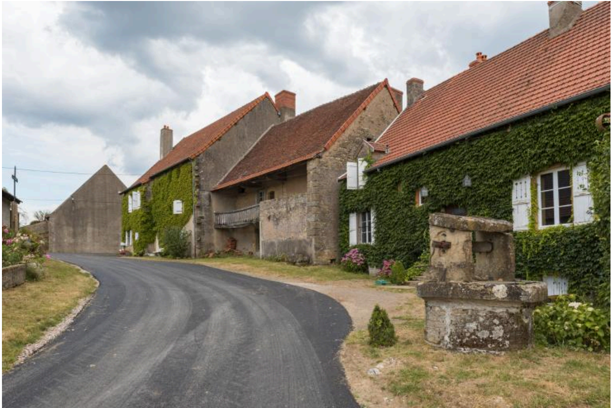
Vue de l'alignement des maisons du hameau des Bouffiers