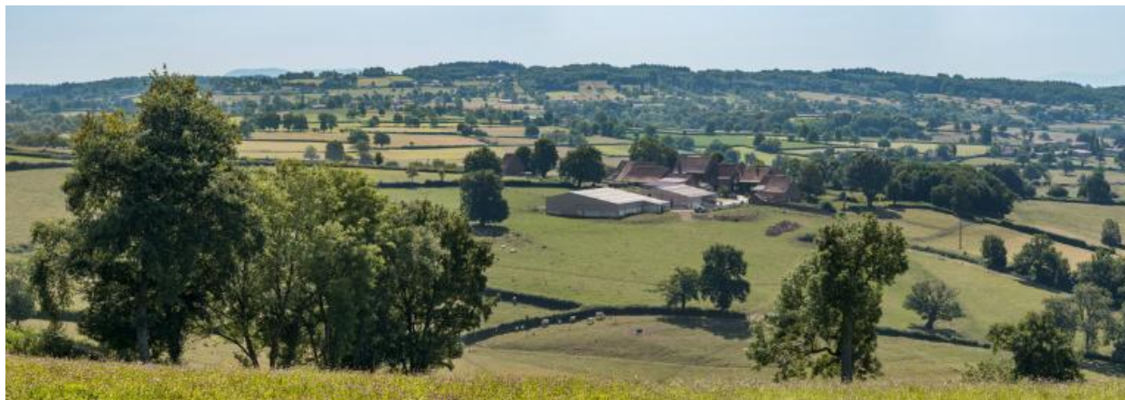
Vue du hameau des Bouffiers