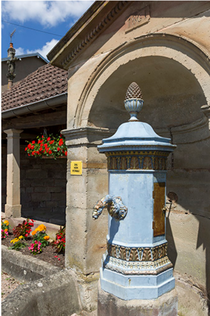
Vue de trois quart.