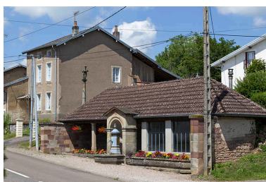
Vue d'ensemble depuis la Grande Rue. IVR43_20157001034NUC2A