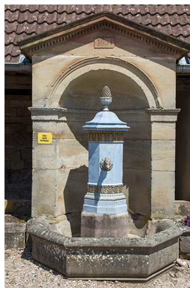
La borne fontaine. IVR43_20157001035NUC2A