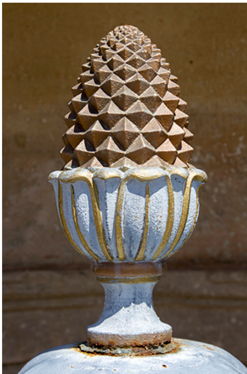
Détail de la pomme de pin sur la borne.