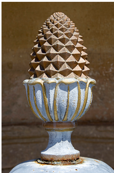
Détail de la pomme de pin sur la borne. IVR43_20157001037NUC2A