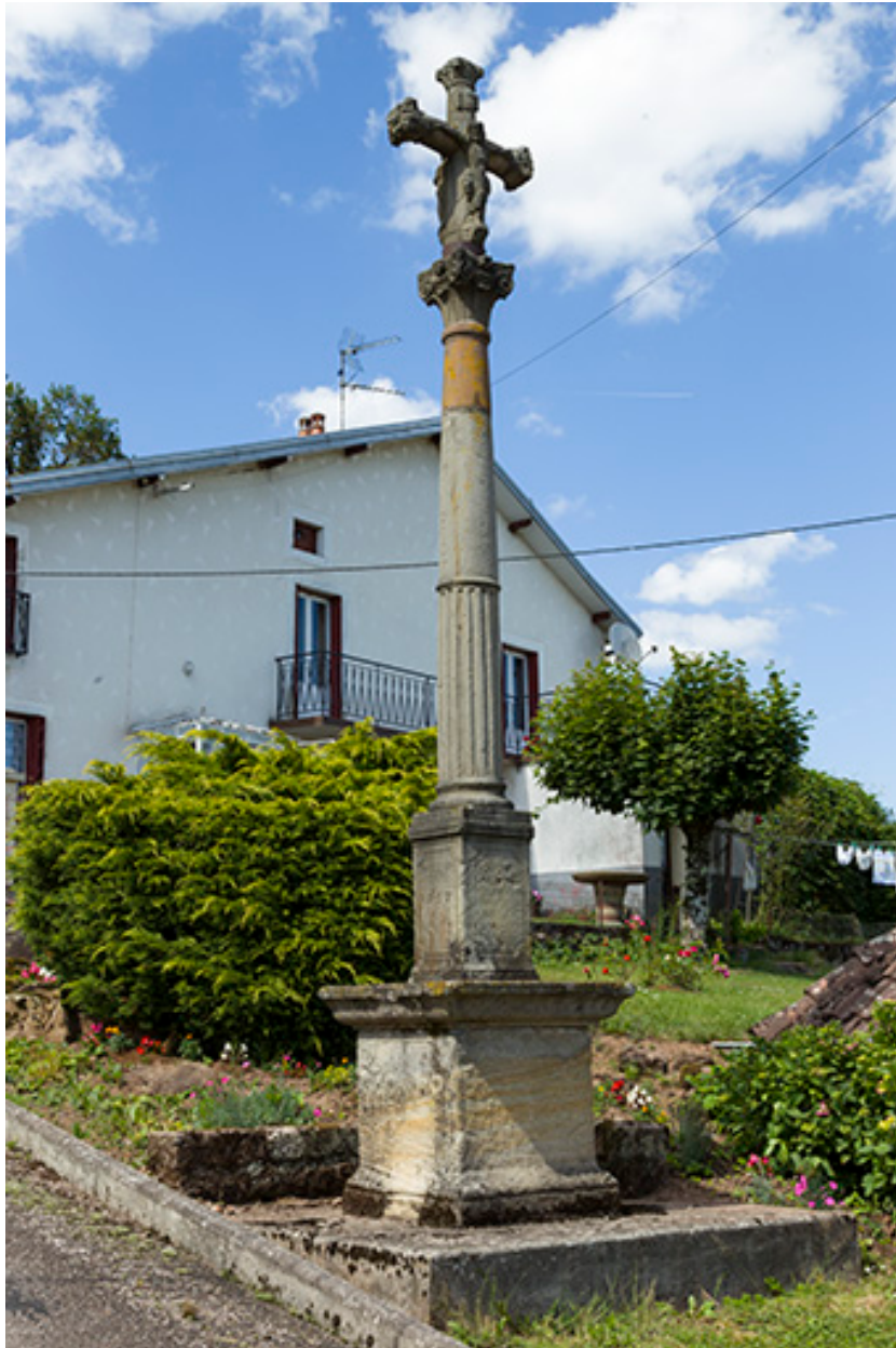
Vue générale sur la croix à proximité de la fontaine.