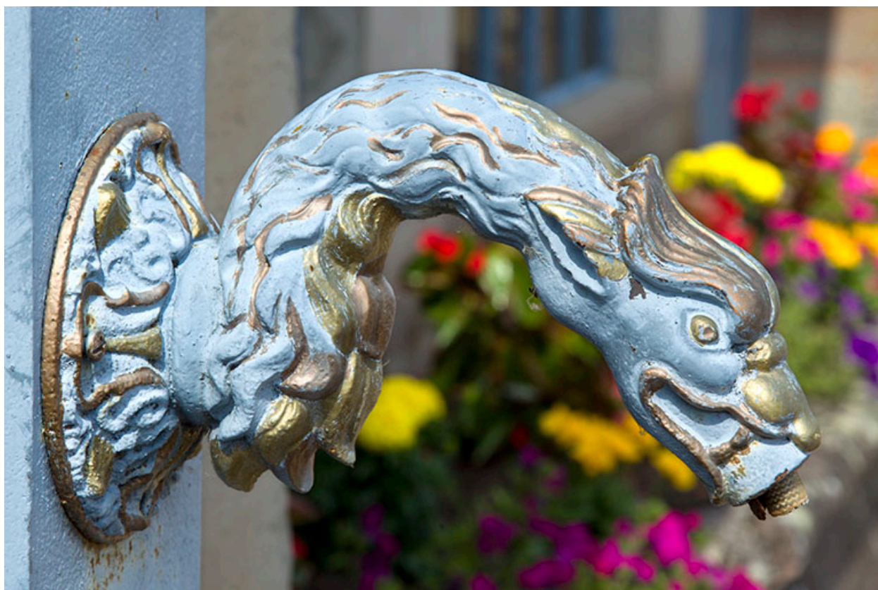
Détail du bec de la fontaine.