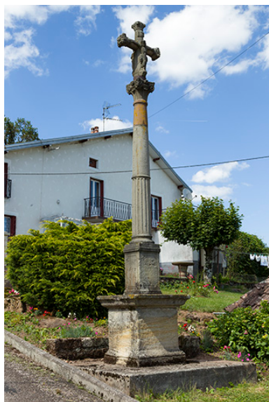
Vue générale sur la croix à proximité de la fontaine. IVR43_20157001039NUC2A