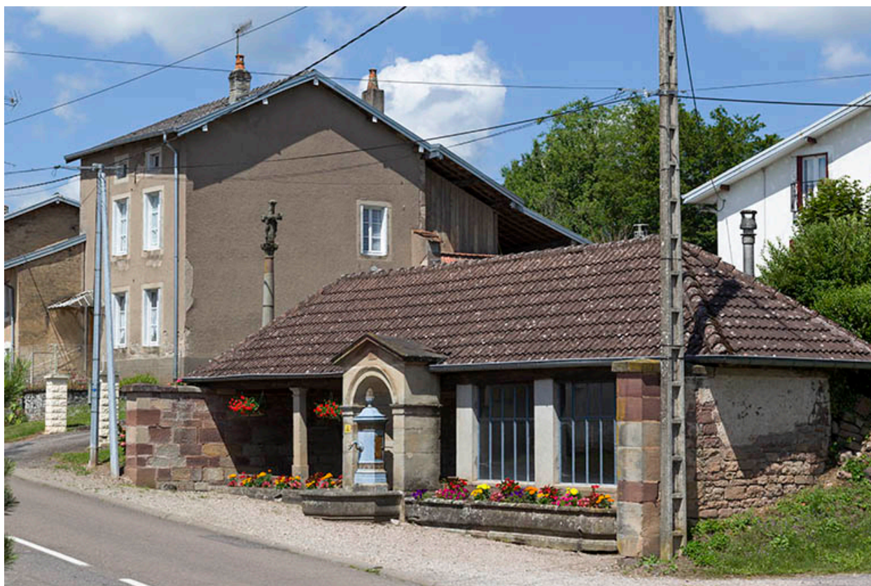
Vue d'ensemble depuis la Grande Rue.