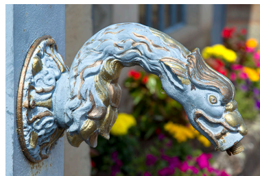
Détail du bec de la fontaine. IVR43_20157001038NUC2A