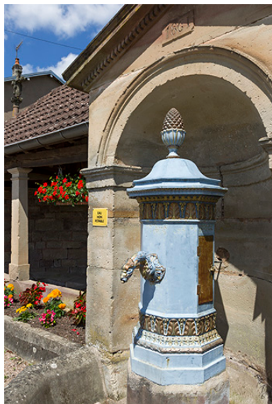
Vue de trois quart. IVR43_20157001036NUC2A