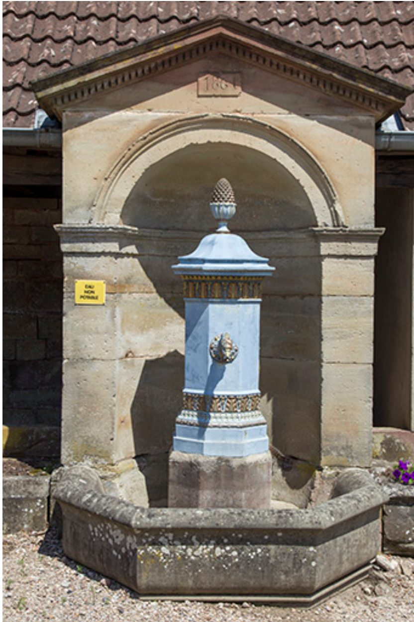
La borne fontaine.