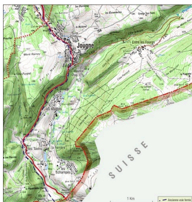
Tracé de la voie ferrée. Extrait de la carte IGN, 1/25 000.