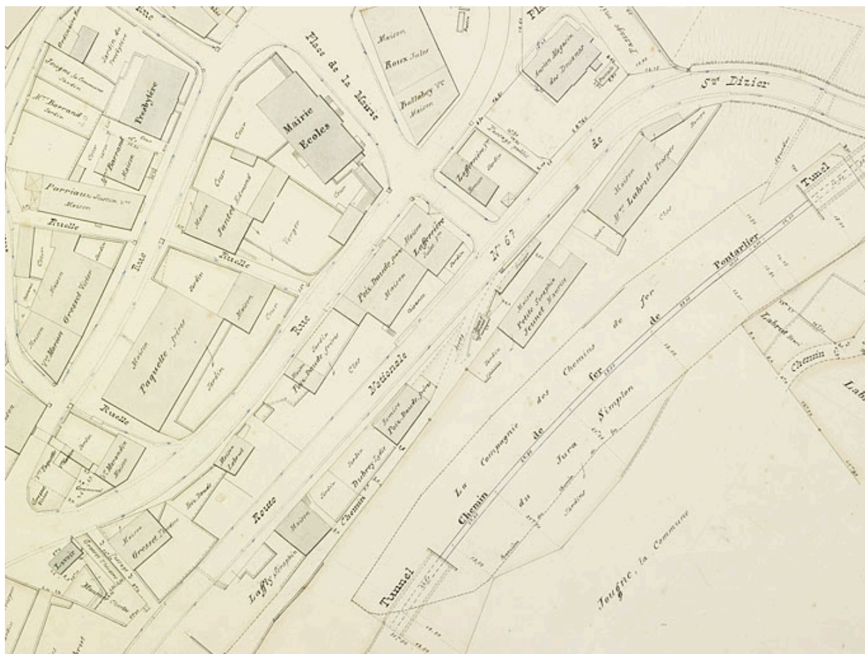
Village de Jougne. 3e feuille [localisation des deux tunnels], [1903].