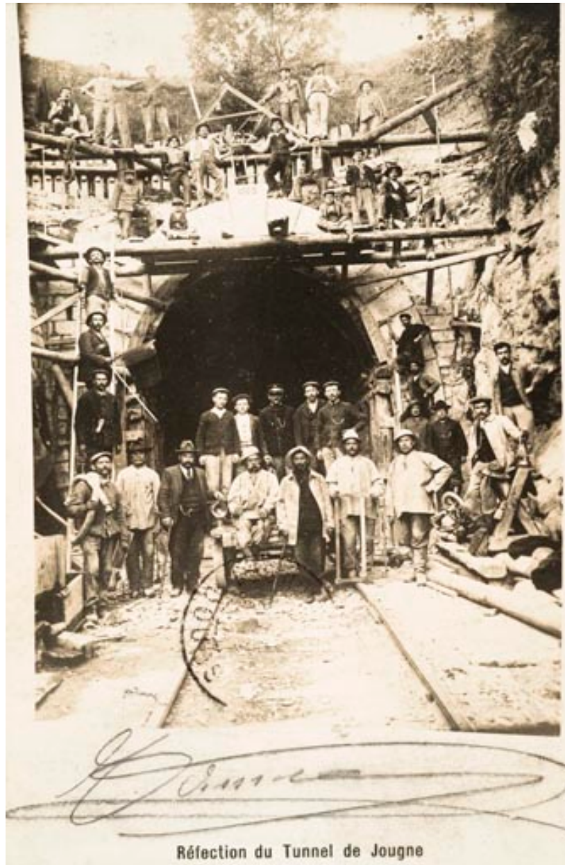
Réfection du tunnel de Jougne, 1909.