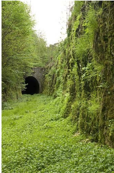
Tunnel et tranchée. IVR43_20092500491NUC2A