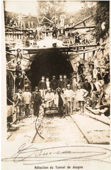
Réfection du tunnel de Jougne, 1909.