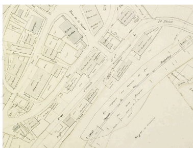
Village de Jougne. 3e feuille [localisation des deux tunnels], [1903].

Phot. Jérôme Mongreville, Autr. Henri Lucas