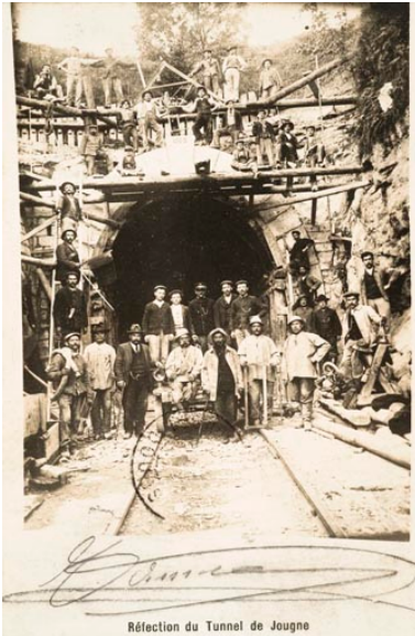
Réfection du tunnel de Jougne, 1909.