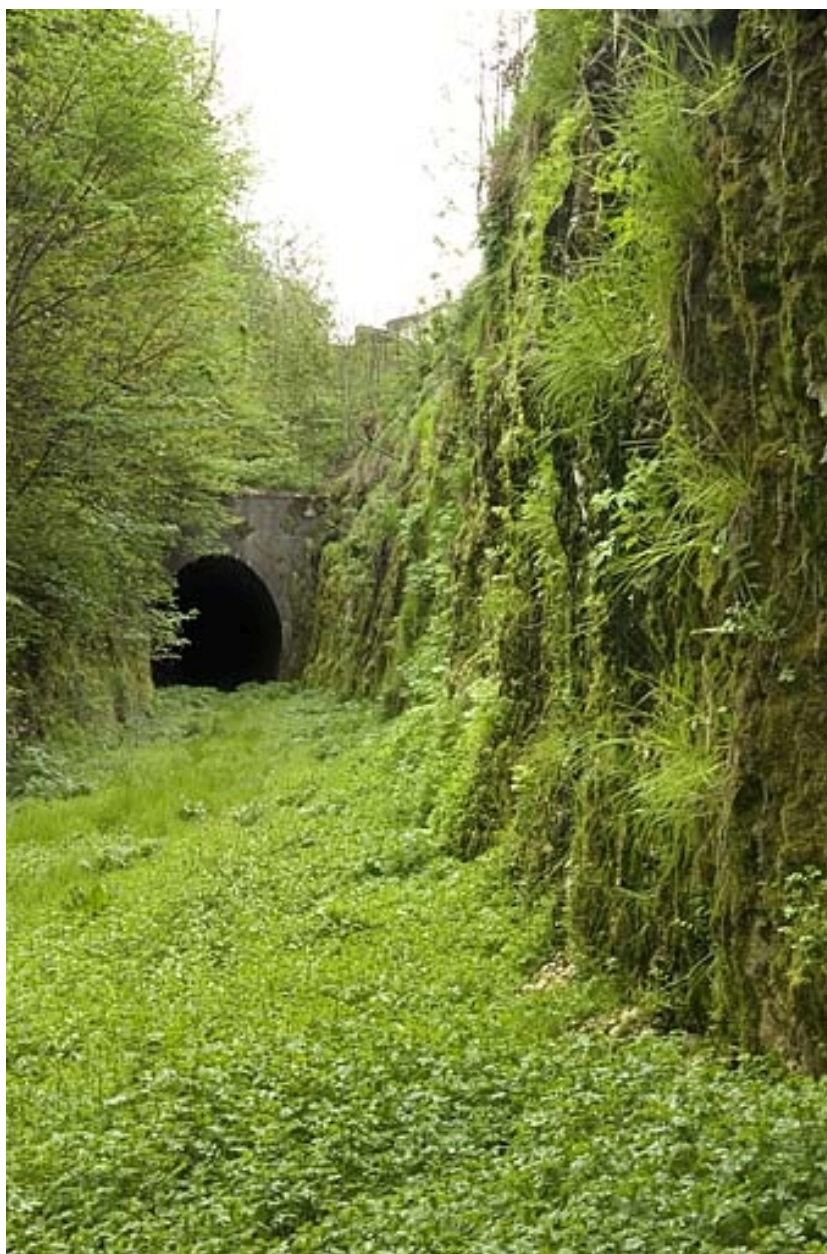
Tunnel et tranchée.