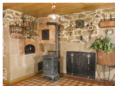
Cuisine du rez-de-chaussée : intérieur. IVR43_20092500090NUC2A