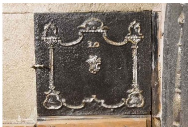
Plaque de cheminée. IVR43_20092500086NUC2A