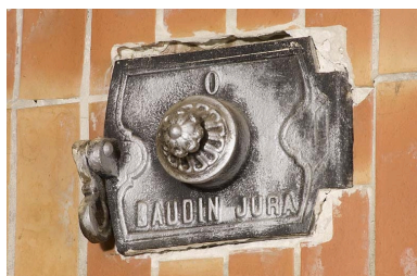
Plaque d'obturation marquée Baudin Jura. IVR43_20092500088NUC2A