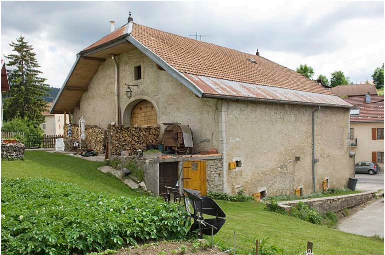
Façade postérieure et façade latérale gauche.