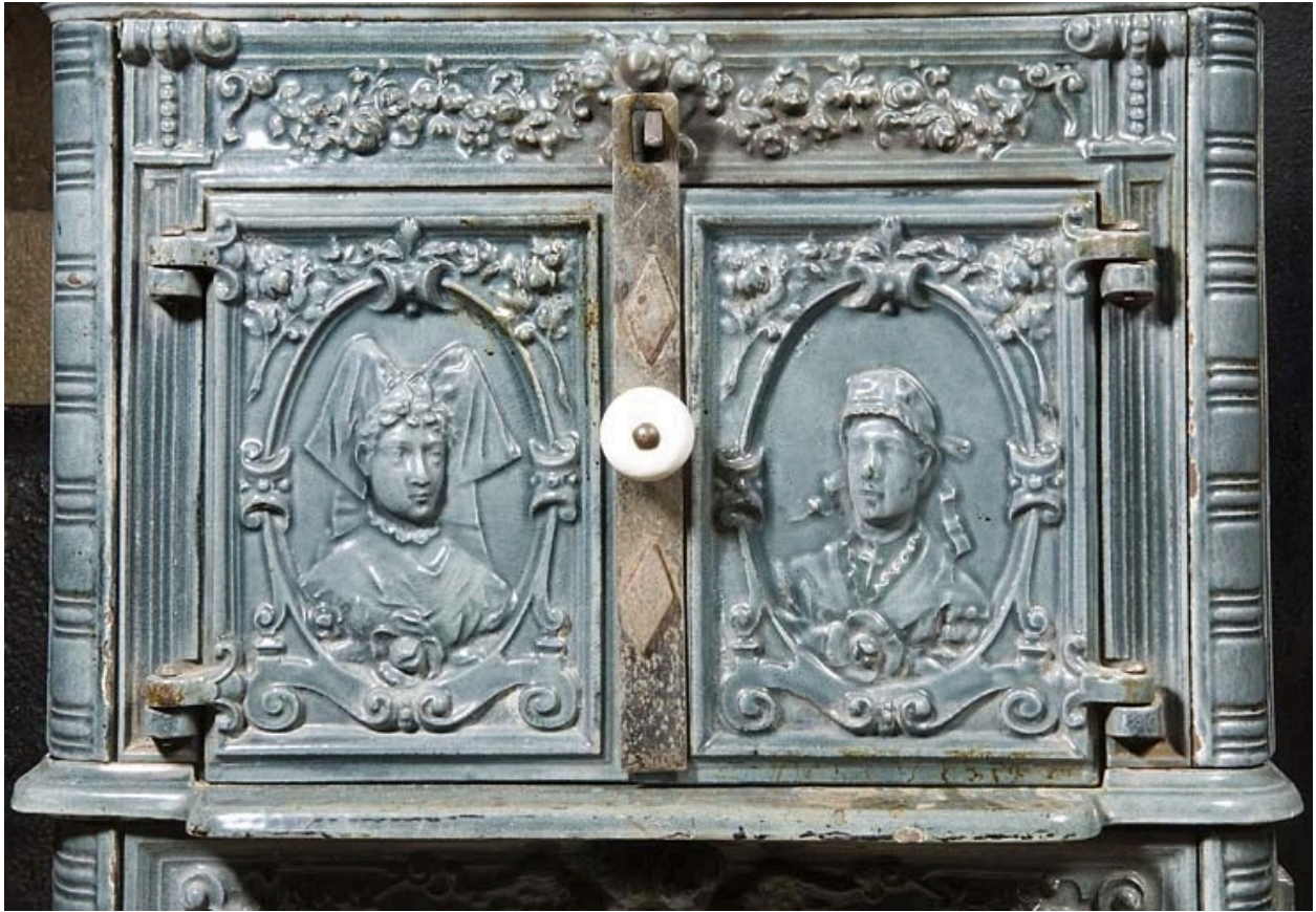
Poêle en faïence : décor de personnages alsaciens.