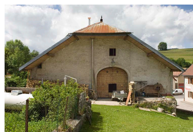
Façade postérieure.