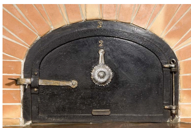
Porte de four. IVR43_20092500089NUC2A