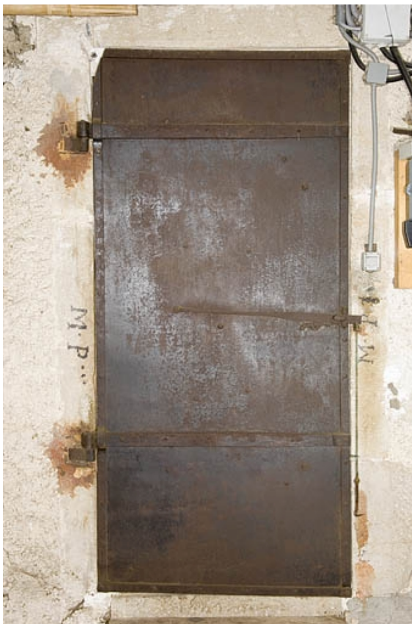
Porte coupe-feu fermée.