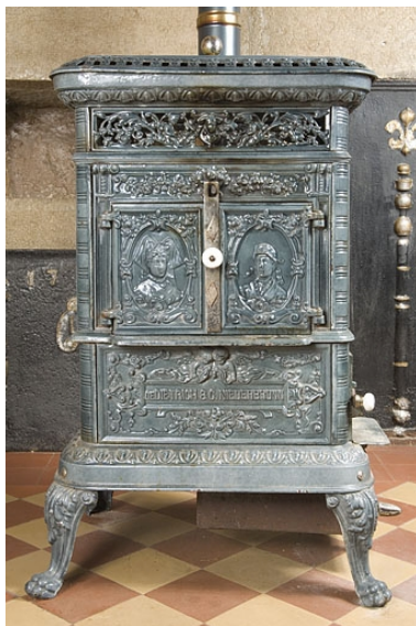
Poêle en faïence, de face. IVR43_20092500080NUC2A