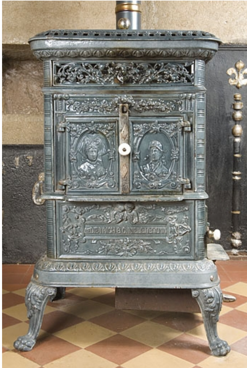
Poêle en faïence, de face.