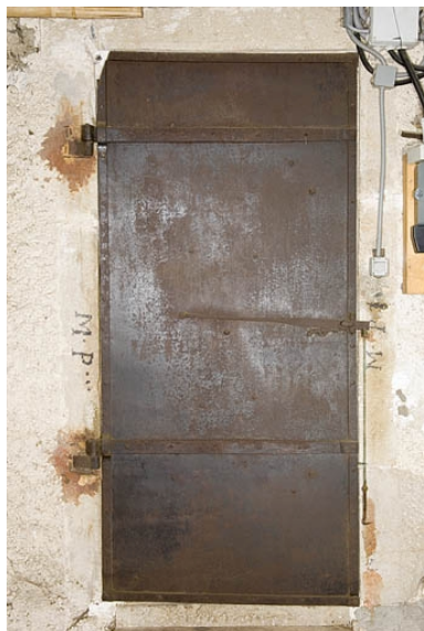
Porte coupe-feu fermée.