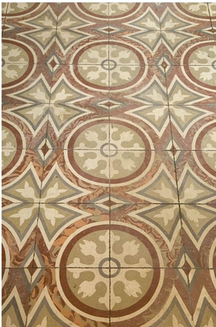
Carreaux au sol.