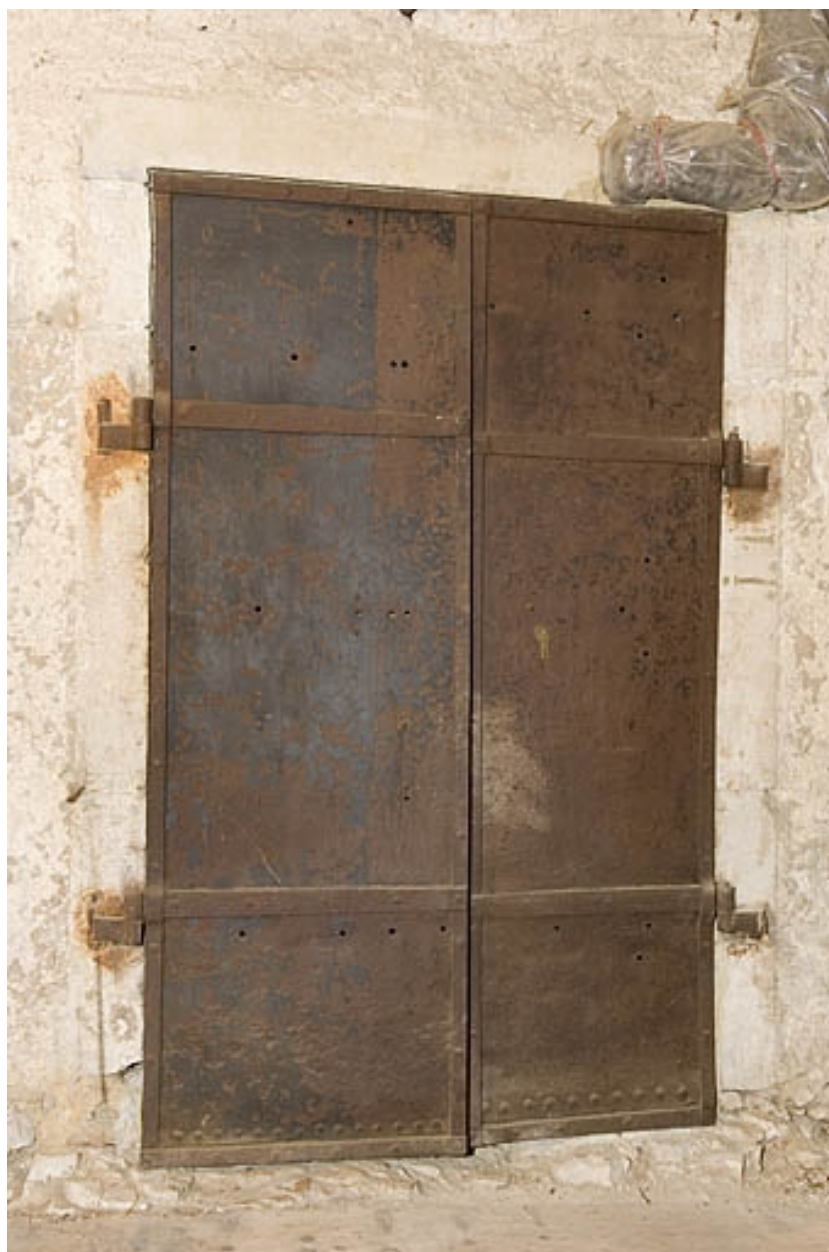
Porte coupe-feu à deux vantaux, fermée.