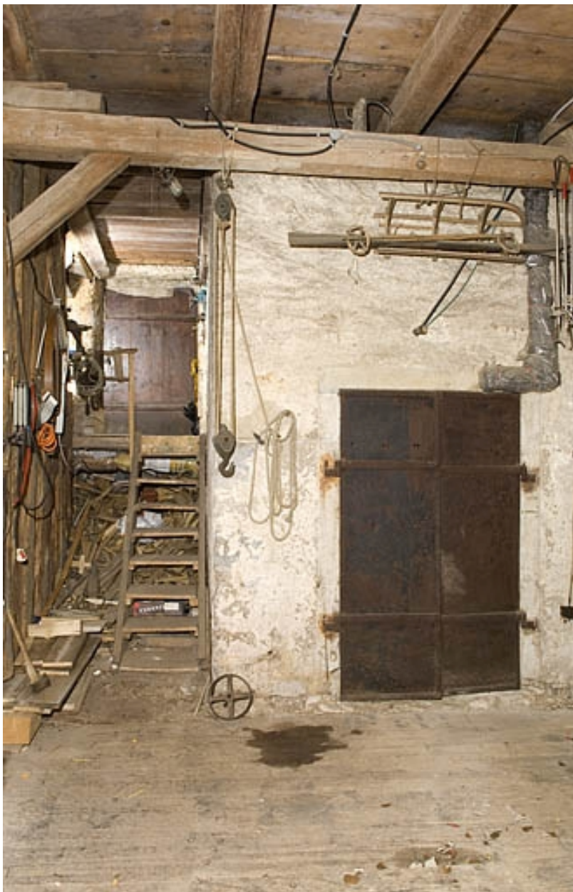
Porte coupe-feu à deux vantaux, vue du côté parties agricoles.