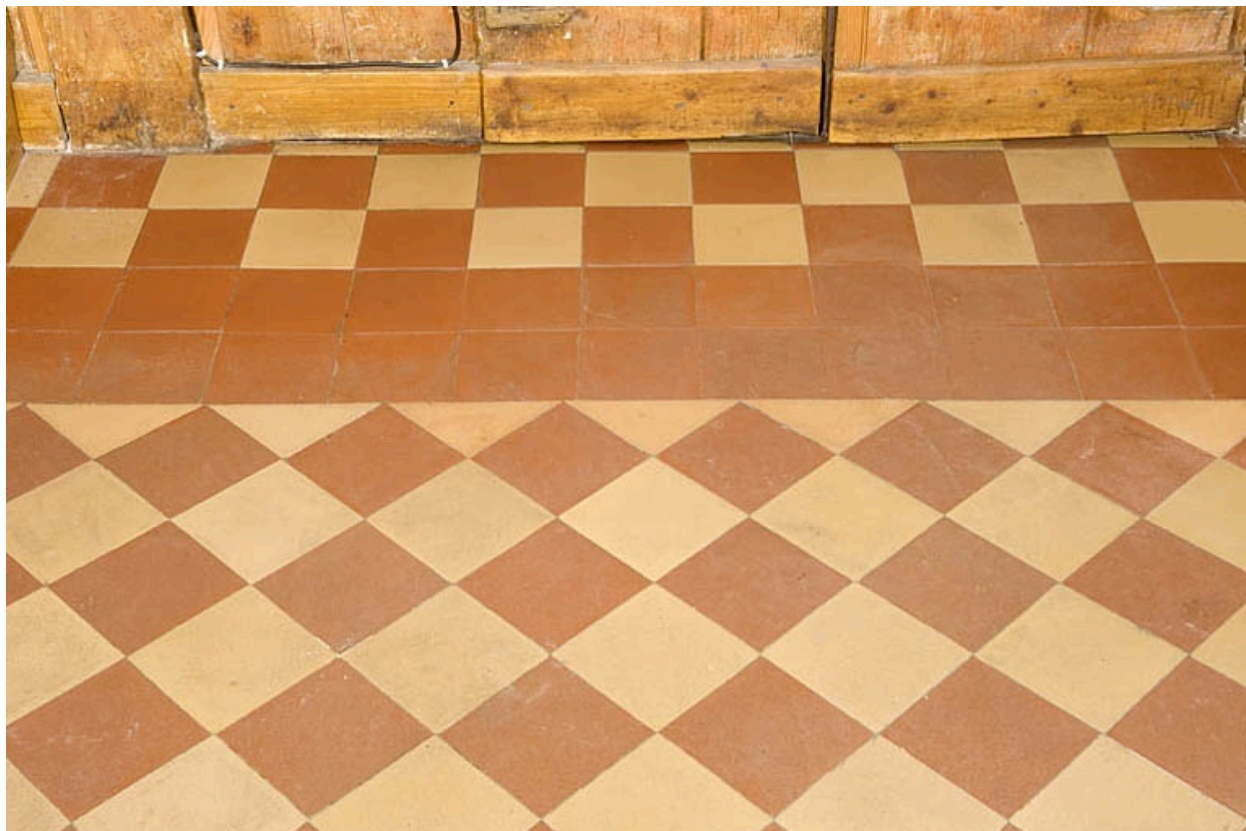
Cuisine du rez-de-chaussée : carreaux au sol.