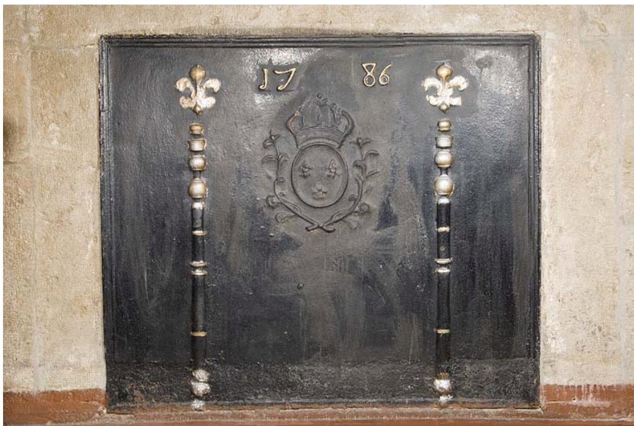
Plaque de cheminée portant la date 1786.