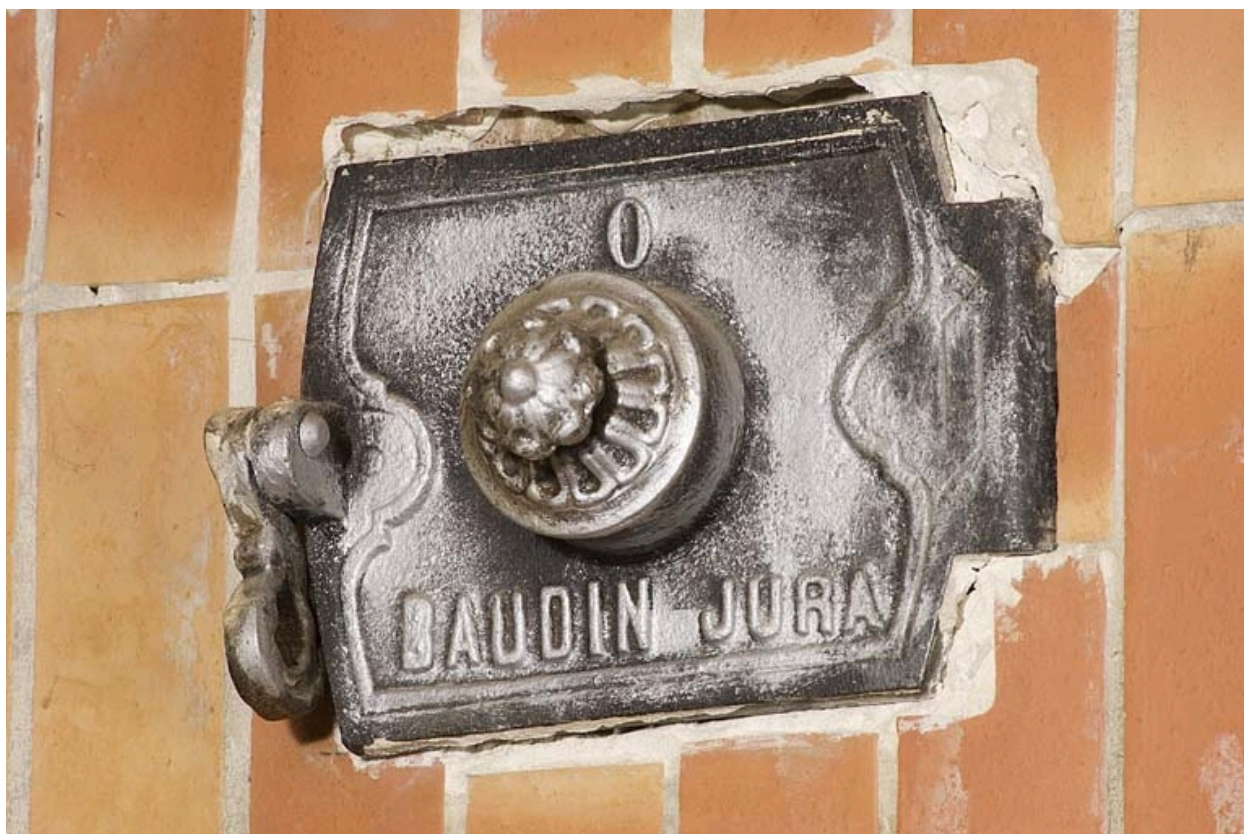
Plaque d'obturation marquée Baudin Jura.