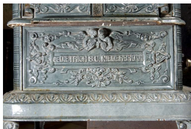
Poêle en faïence : inscription. IVR43_20092500082NUC2A