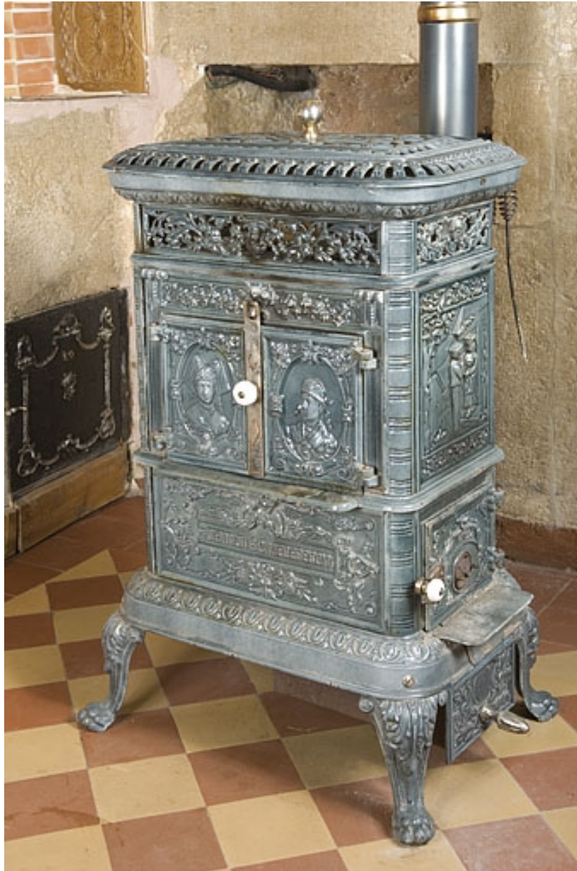
Poêle en faïence.