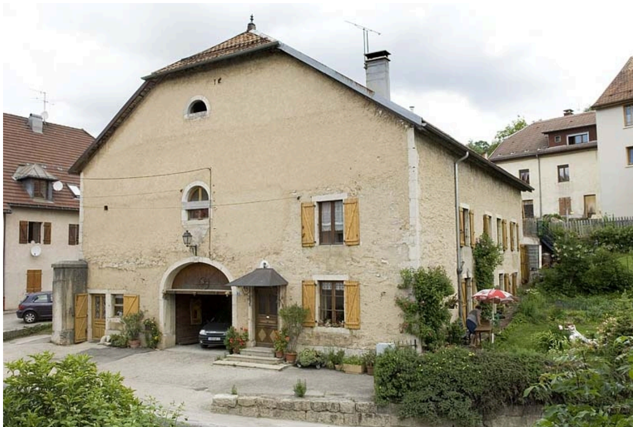
Façade antérieure, route des Alpes.