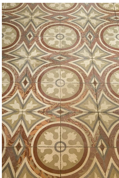
Carreaux au sol. IVR43_20092500092NUC2A