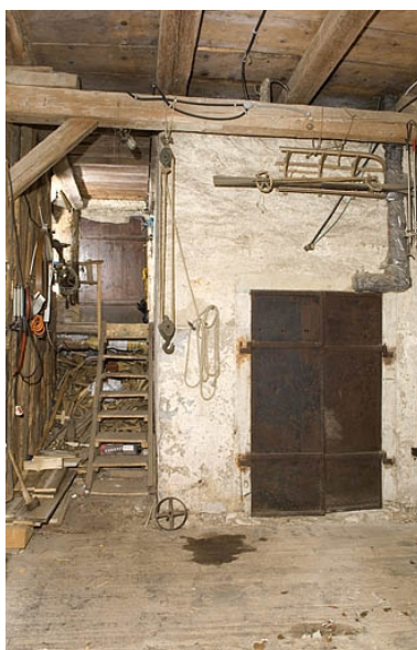
Porte coupe-feu à deux vantaux, vue du côté parties agricoles.