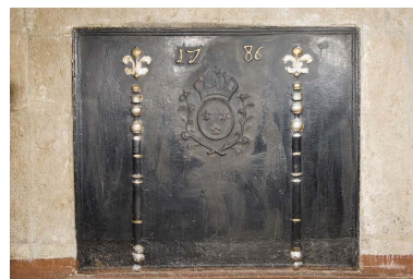
Plaque de cheminée portant la date 1786. IVR43_20092500084NUC2A