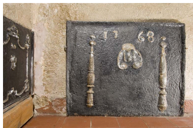
Plaque de cheminée portant la date 1768.