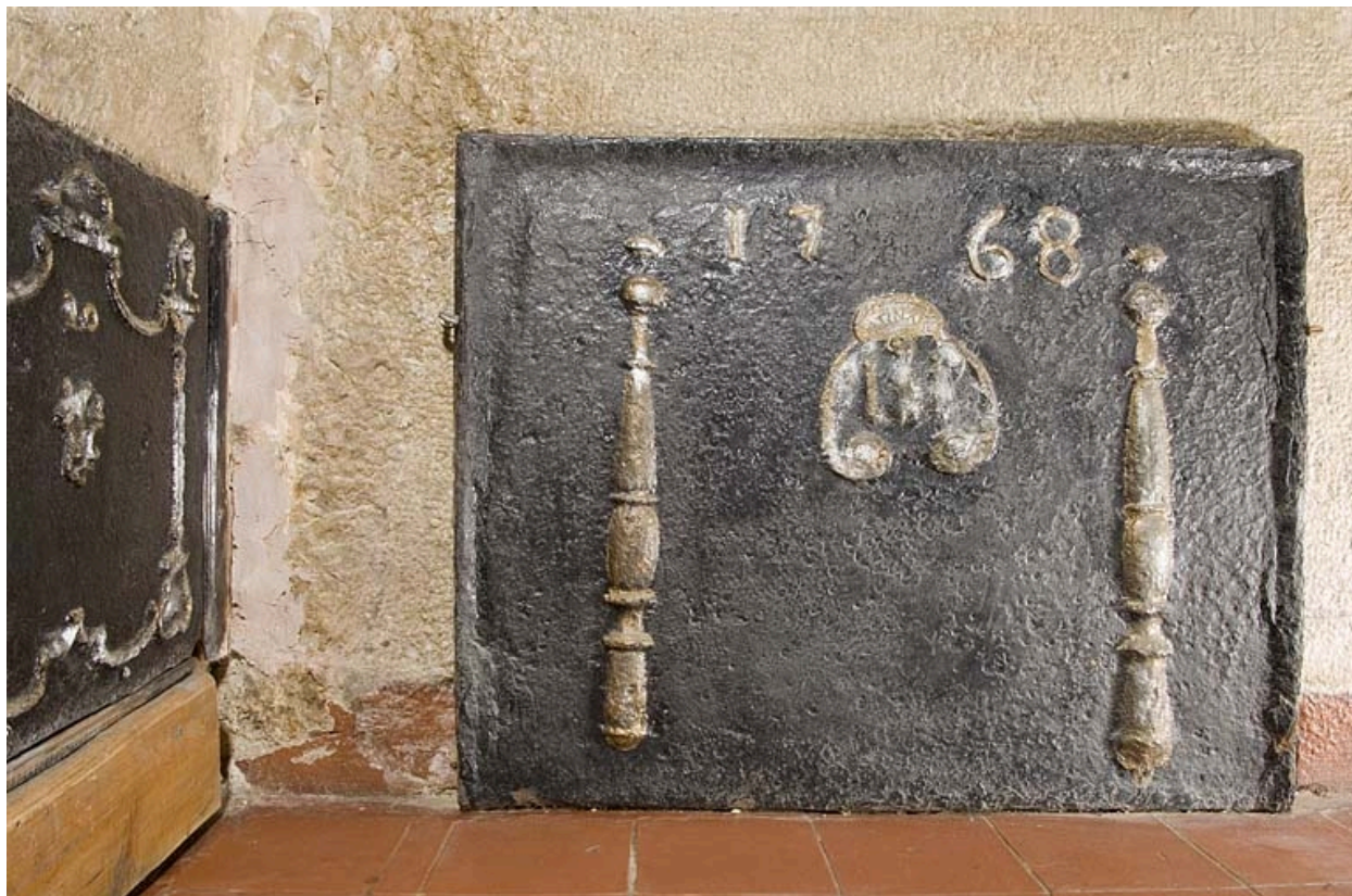
Plaque de cheminée portant la date 1768.