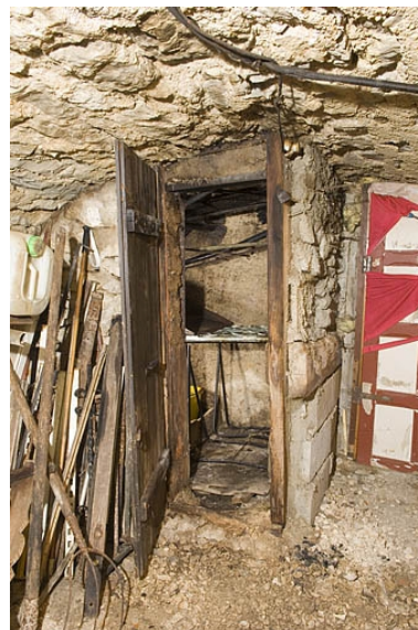
Pièce voûtée. IVR43_20092500097NUC2A