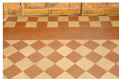
Cuisine du rez-de- chaussée : carreaux au sol. IVR43_20092500091NUC2A