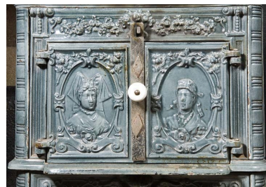
Poêle en faïence : décor de personnages alsaciens. IVR43_20092500081NUC2A