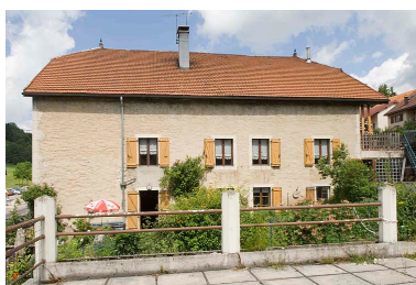
Façade latérale droite. IVR43_20092500788NUC2A