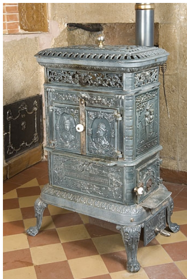
Poêle en faïence. IVR43_20092500079NUC2A