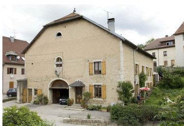
Façade antérieure, route des Alpes. IVR43_20092500789NUC2A