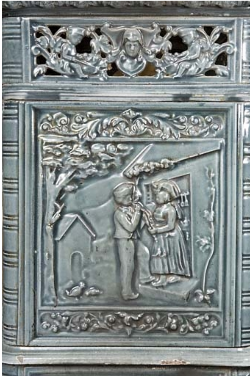
Poêle en faïence : décor de personnages alsaciens.