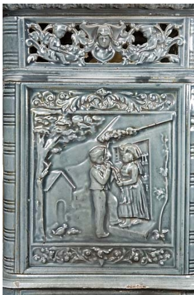
Poêle en faïence : décor de personnages alsaciens. IVR43_20092500083NUC2A