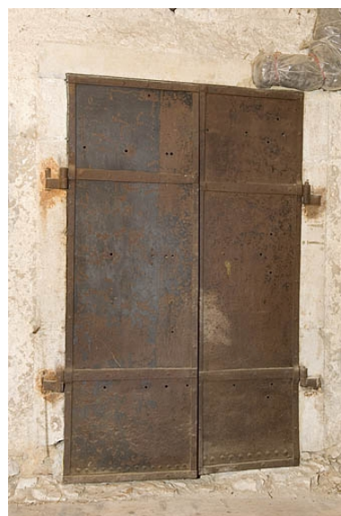
Porte coupe-feu à deux vantaux, fermée. IVR43_20092500095NUC2A