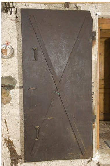
Porte coupe-feu ouverte. IVR43_20092500094NUC2A