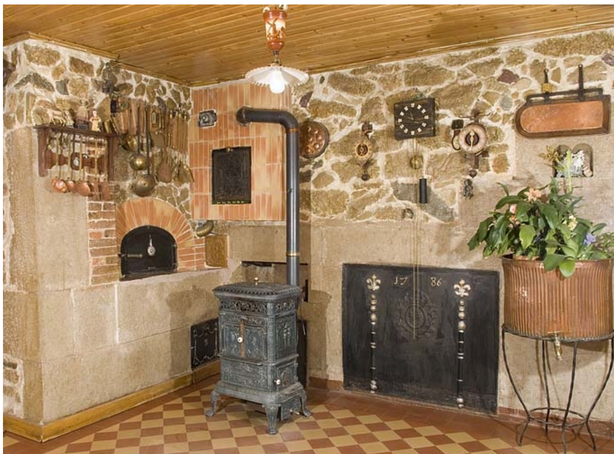
Cuisine du rez-de-chaussée : intérieur.