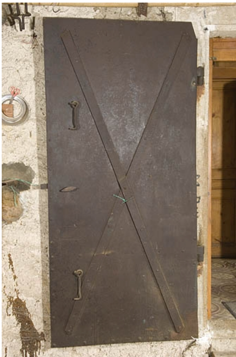
Porte coupe-feu ouverte.