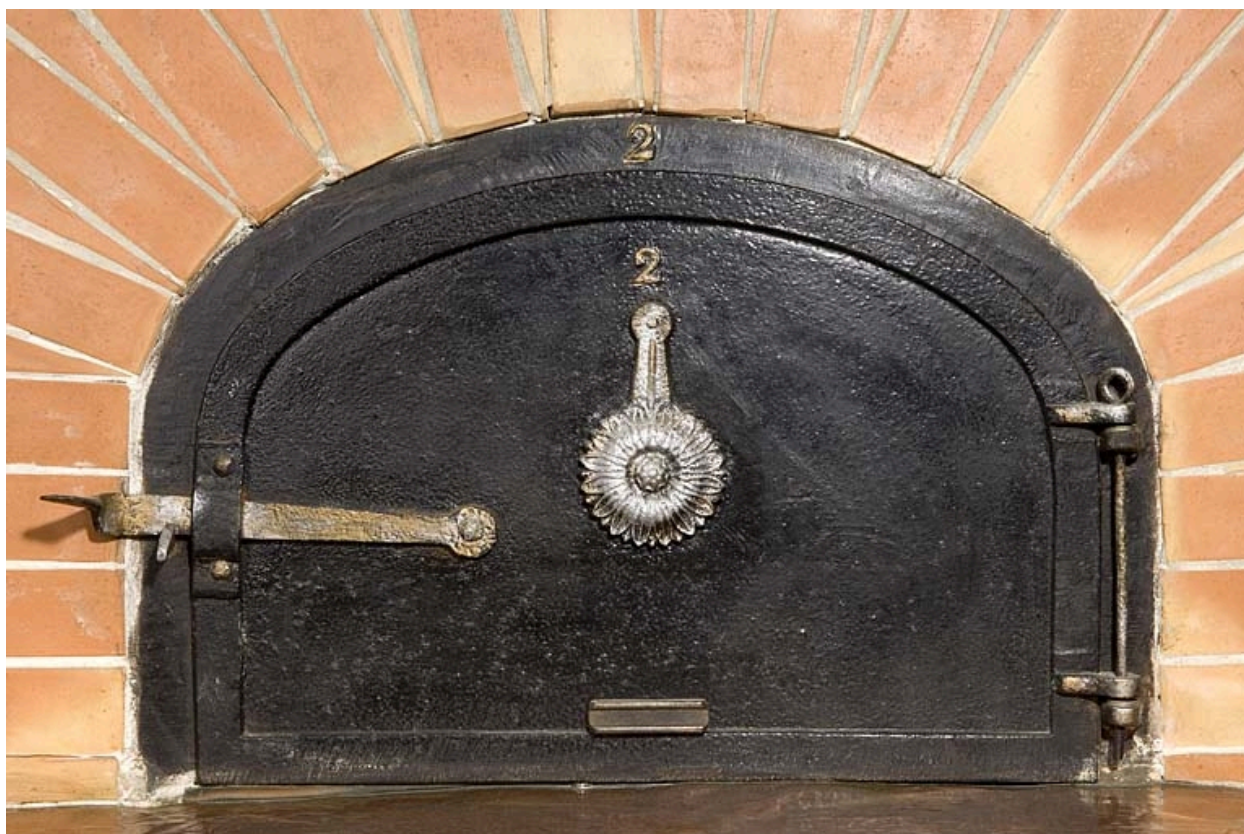
Porte de four.