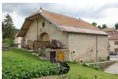
Façade postérieure et façade latérale gauche. IVR43_20092500790NUC2A