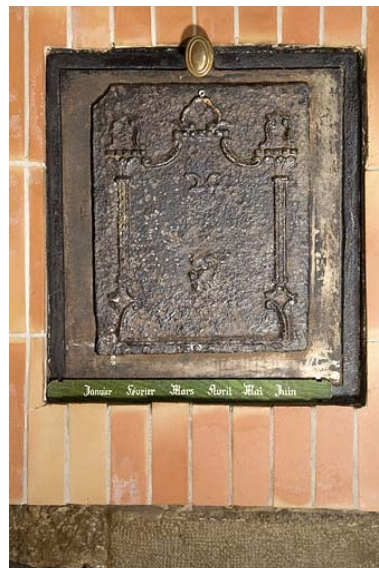
Plaque. IVR43_20092500087NUC2A