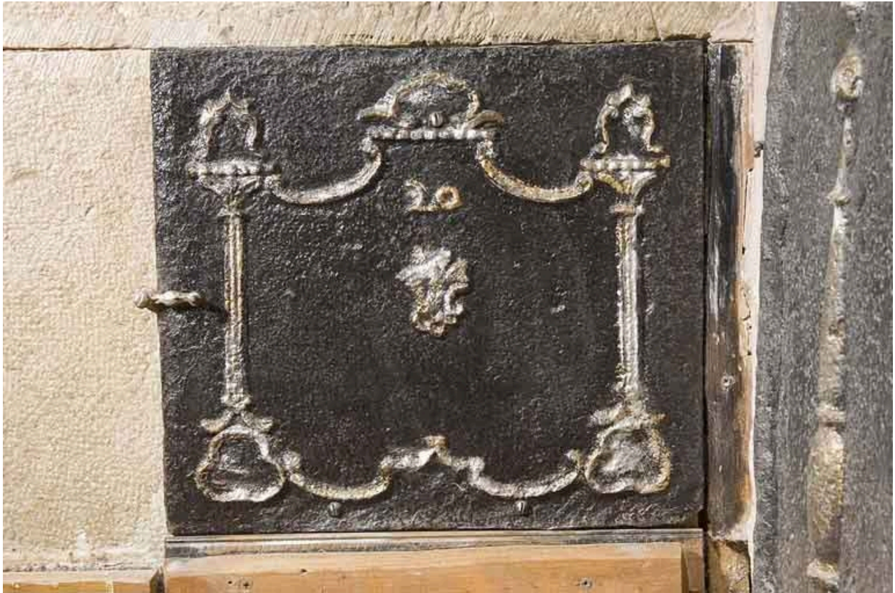
Plaque de cheminée.