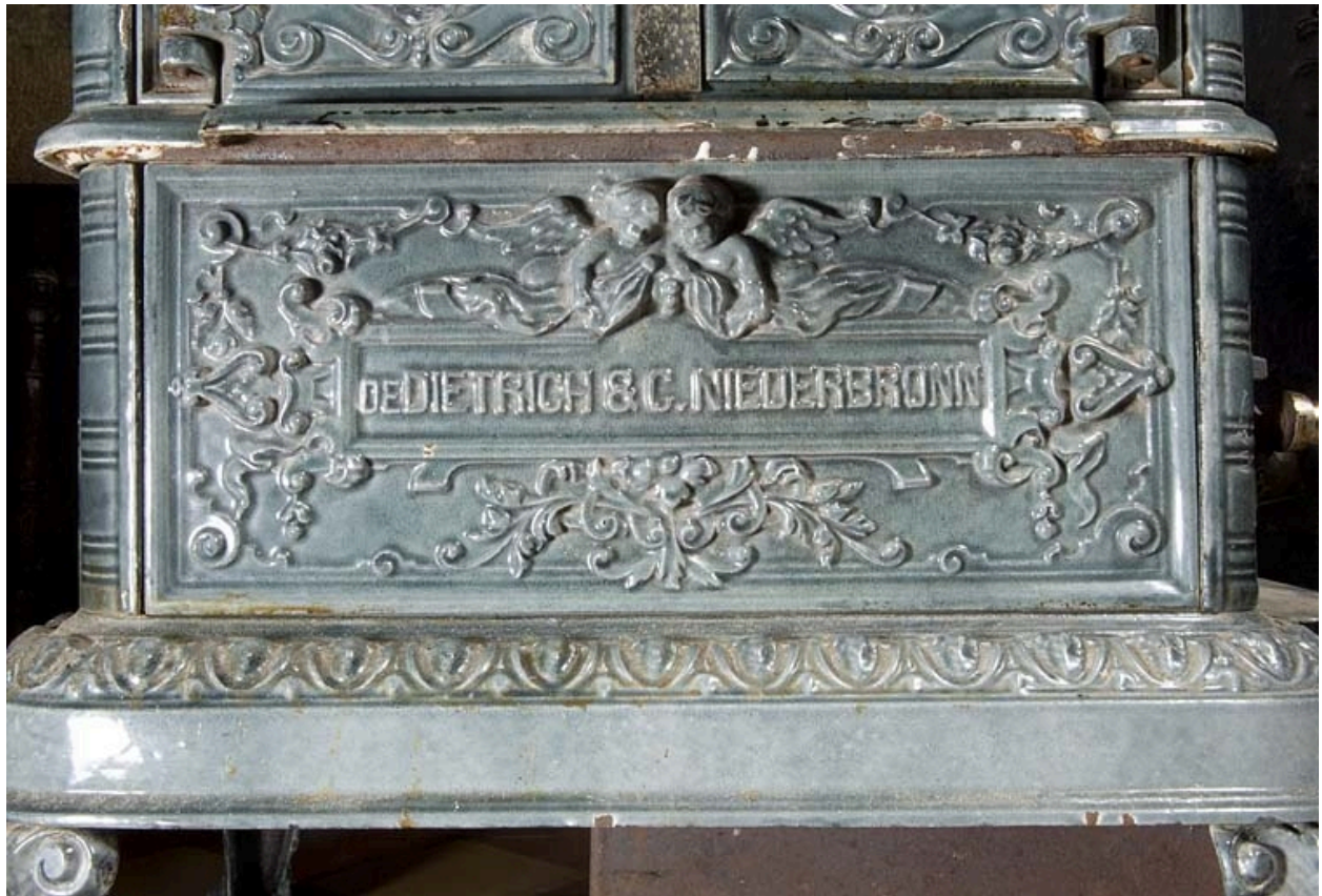
Poêle en faïence : inscription.