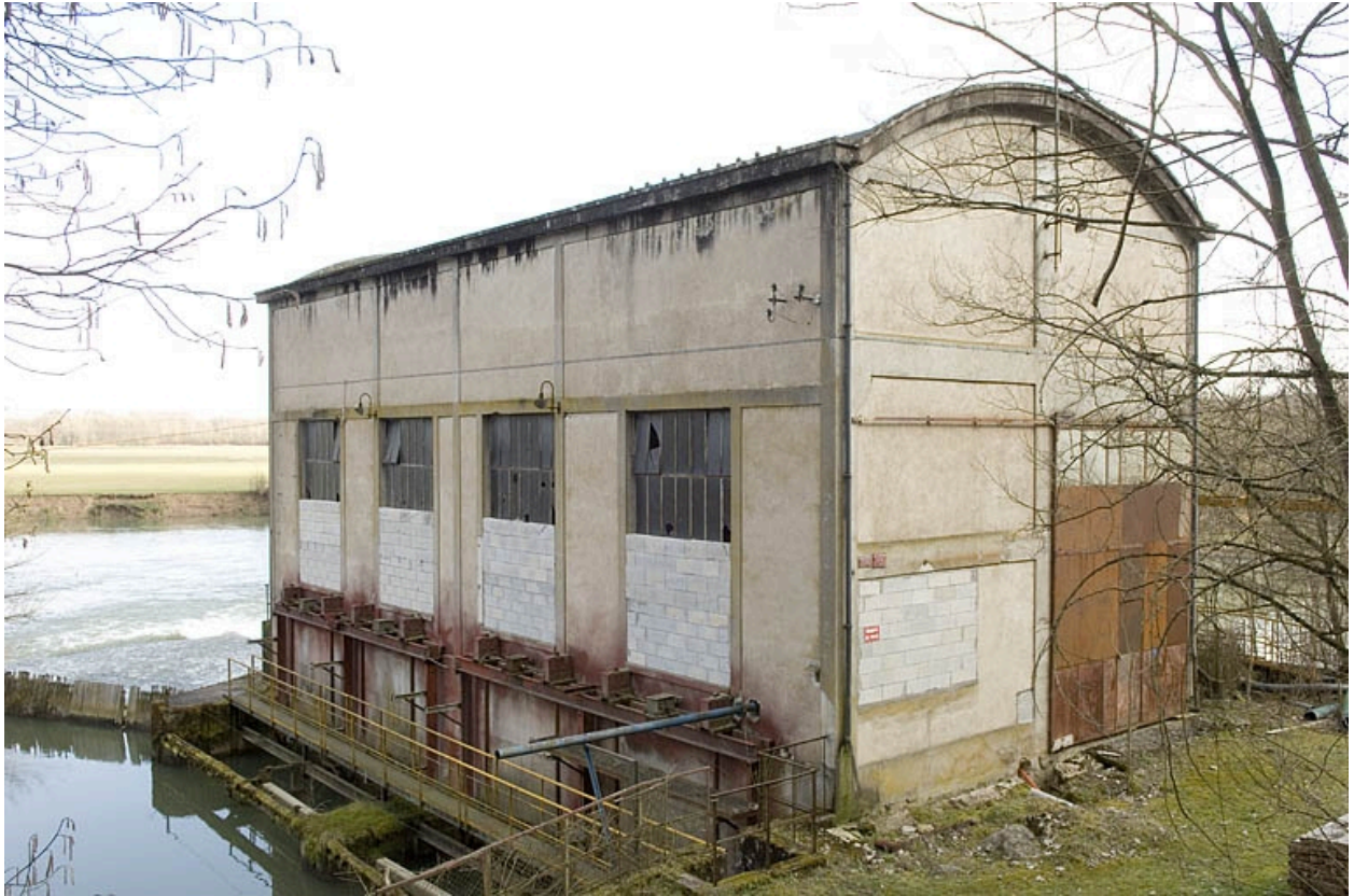
La centrale hydroélectrique vue depuis le nord.