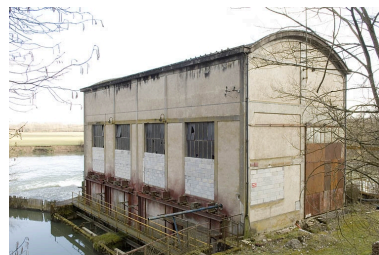
La centrale hydroélectrique vue depuis le nord.