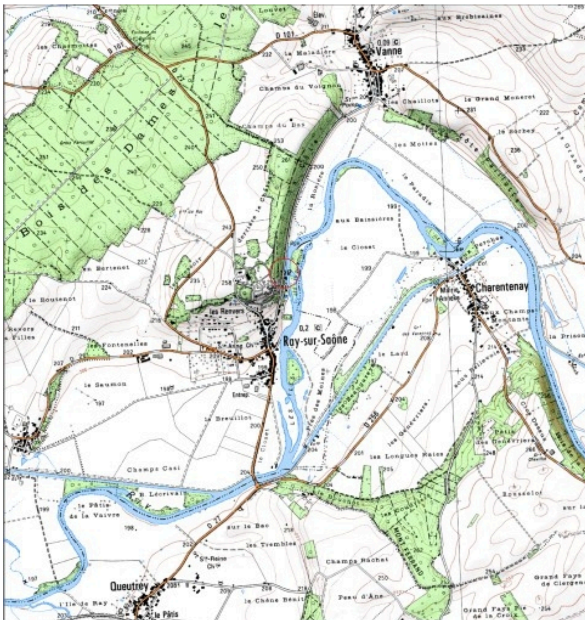
Carte de localisation. Carte topographique au 1:25000, I.G.N., Dampierre-sur-Salon, 3221 E. SCAN 25 © IGN - 2008, Licence n°2008CISE29-68.