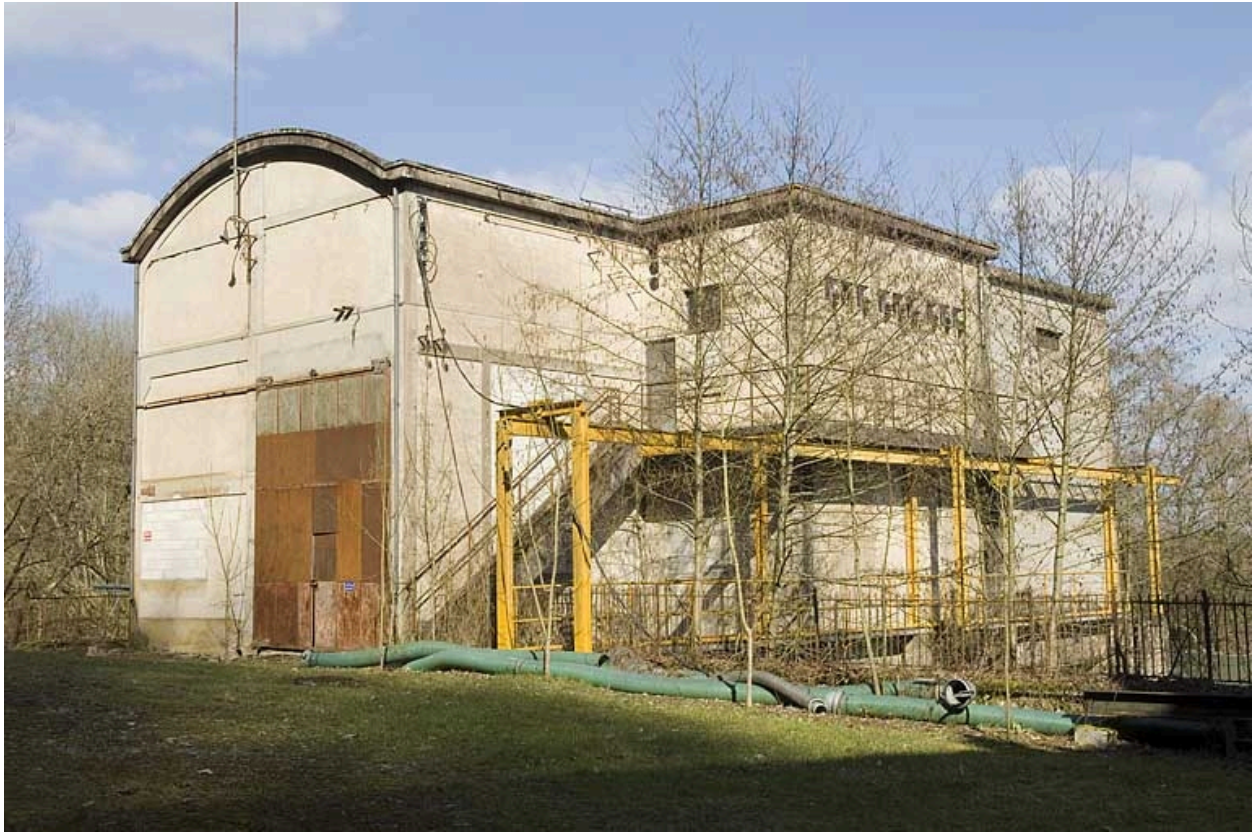
La centrale hydroélectrique vue de trois quarts.