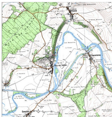
Carte de localisation. Carte topographique au 1:25000, I.G.N., Dampierre-sur-Salon, 3221 E. SCAN 25 © IGN - 2008, Licence n°2008CISE29-68. Dess. André Céréza