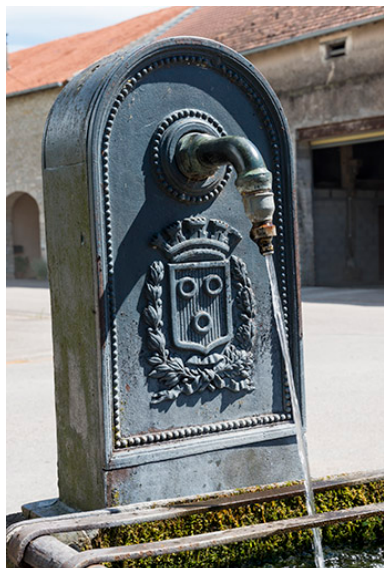
Vue rapprochée de la borne-fontaine située à l'extrémité sud du village.

Phot. Jérôme Mongreville IVR43_20177000771NUC4A