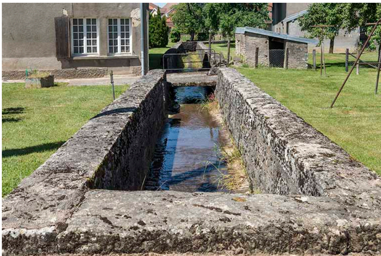
Le ruisseau canalisé qui traverse le village.