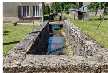
Le ruisseau canalisé qui traverse le village.