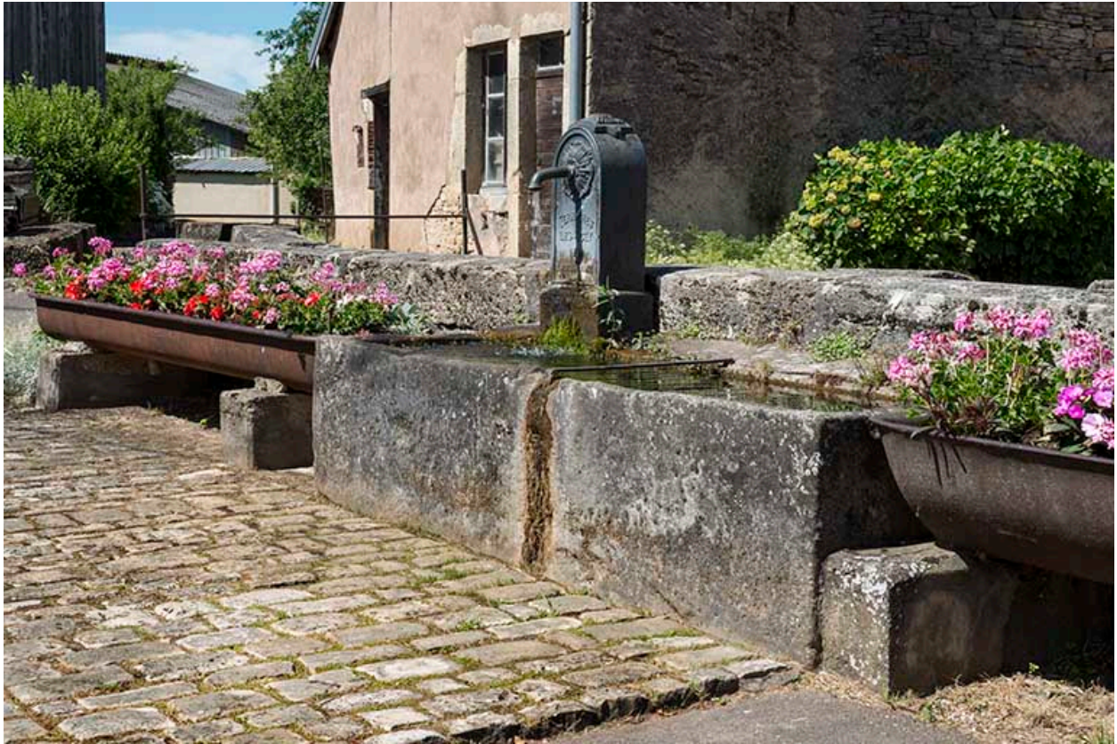
Borne-fontaine et auges d'abreuvoir en fonte rue de la Prairie.