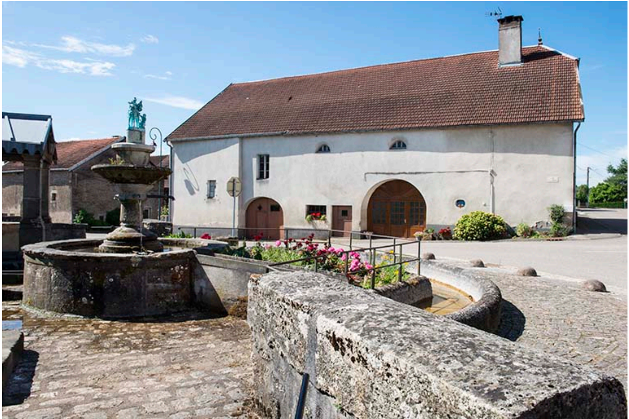
Fontaine principale située au centre du village.