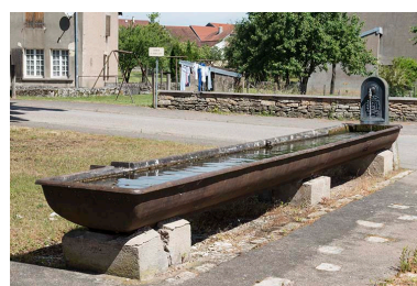
Borne-fontaine et auge d'abreuvoir en fonte situées à l'extrémité sud du village.