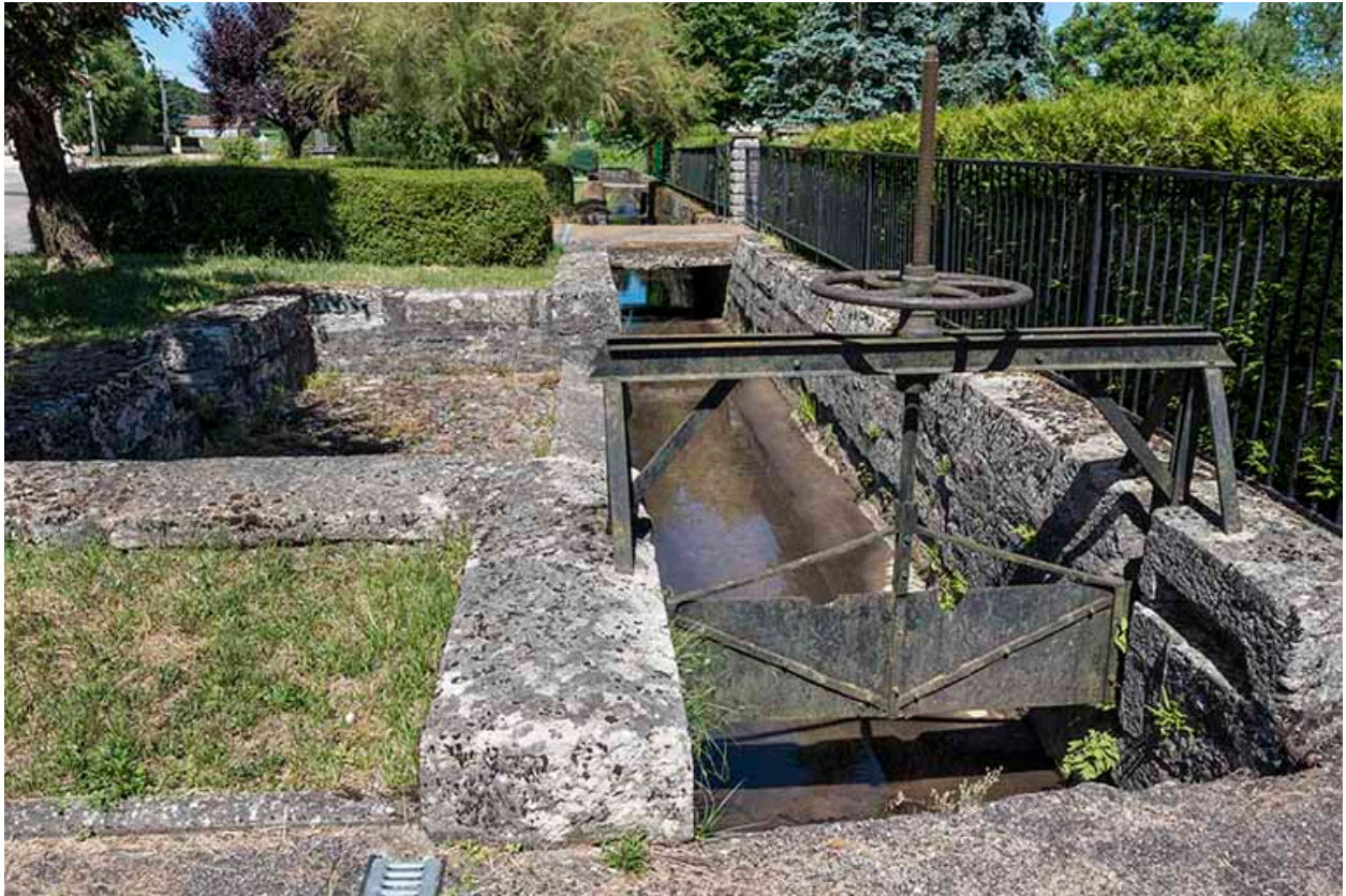
Détail de la vanne située en aval sud de la remise de matériel d'incendie et d'un lavoir en pierre.