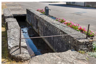
Le ruisseau canalisé alimentant les bornes fontaines.

Phot. Jérôme Mongreville IVR43_20177000758NUC4A