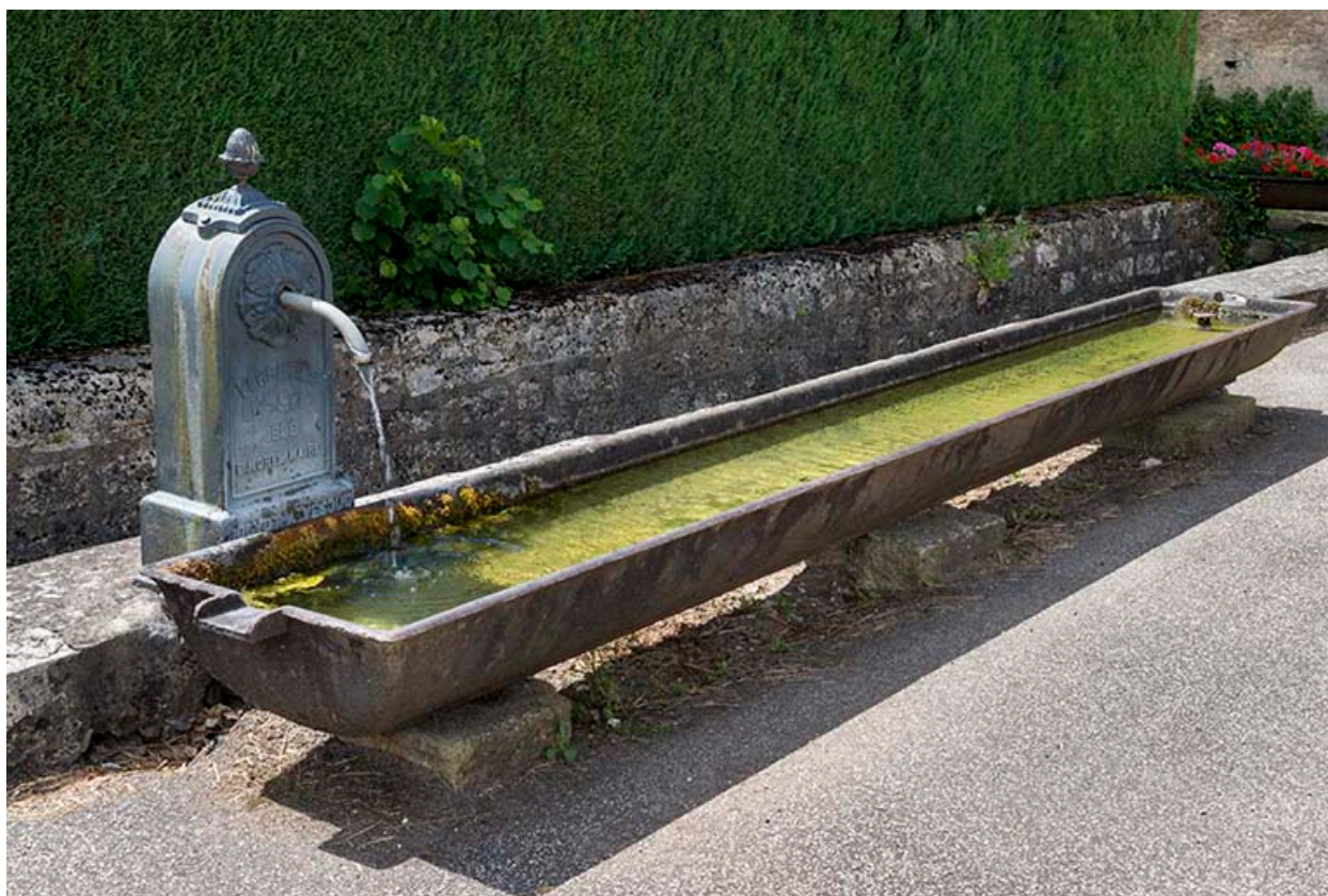
Borne-fontaine et auge d'abreuvoir en fonte situées route de Port-sur-Saône.