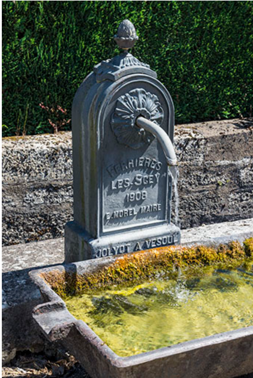
Détail de la borne-fontaine située route de Port-sur-Saône.