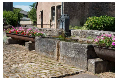
Borne-fontaine et auges d'abreuvoir en fonte rue de la Prairie.