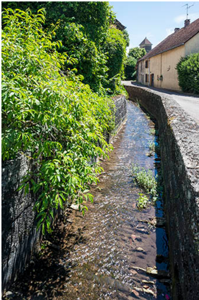
Le ruisseau canalisant traversant le village.