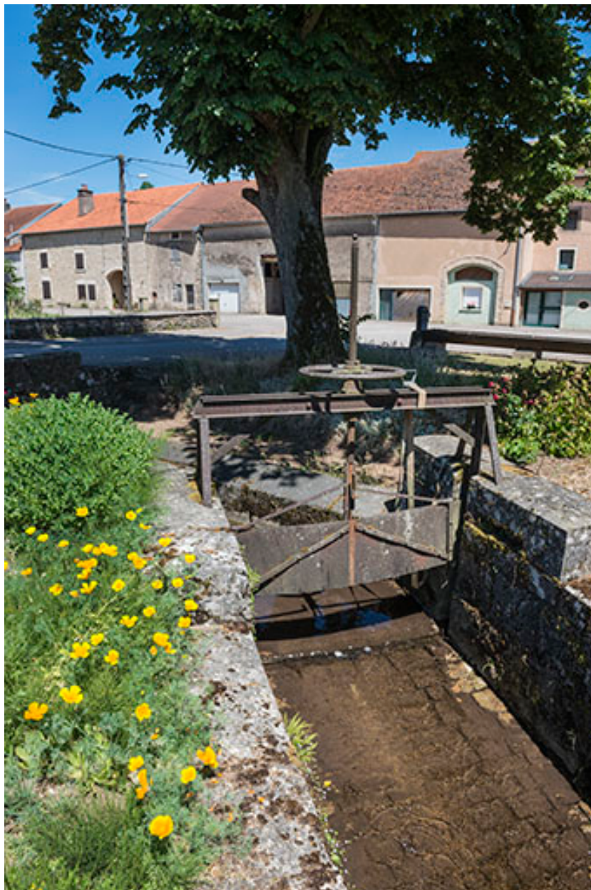
Vanne située à l'extrémité sud du village.