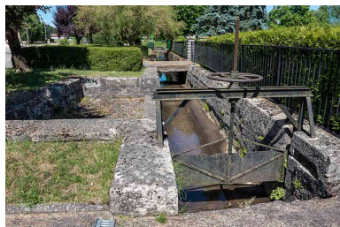
Détail de la vanne située en aval sud de la remise de matériel d'incendie et d'un lavoir en pierre.