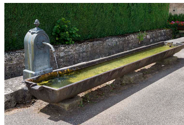
Borne-fontaine et auge d'abreuvoir en fonte situées route de Port-sur-Saône.