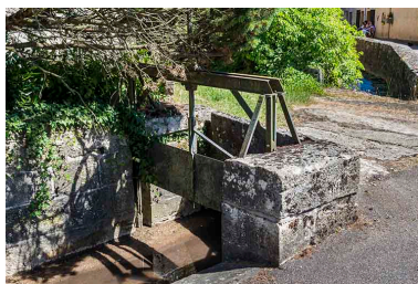
Vanne située à l'angle de l'impasse du château. IVR43_20177000829NUC4A