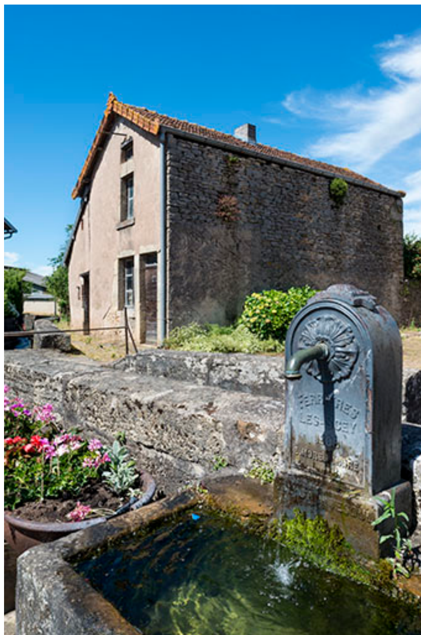
Détail de la borne-fontaine située rue de la Prairie.