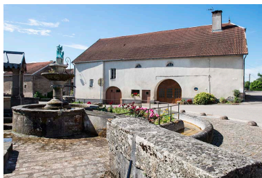
Fontaine principale située au centre du village.