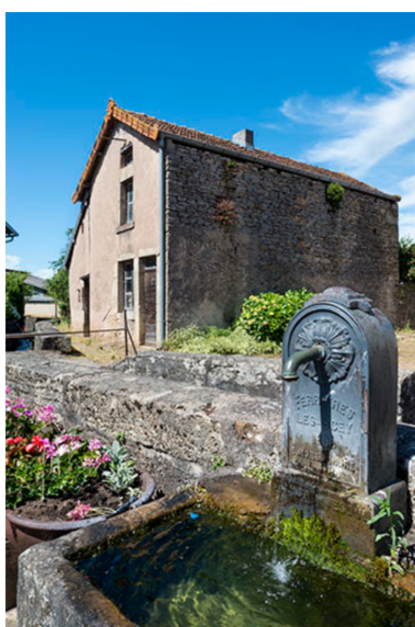
Détail de la borne-fontaine située rue de la Prairie.