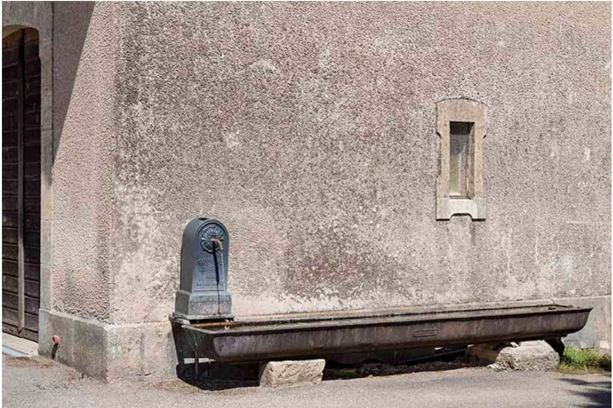
Borne-fontaine et auge d'abreuvoir en fonte situées contre la façade sud de la remise de matériel d'incendie.