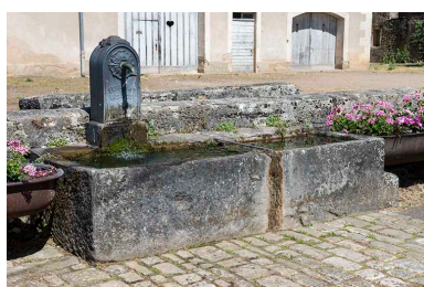
Borne-fontaine située rue de la Prairie.