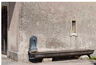
Borne-fontaine et auge d'abreuvoir en fonte situées contre la façade sud de la remise de matériel d'incendie. IVR43_20177000814NUC4A