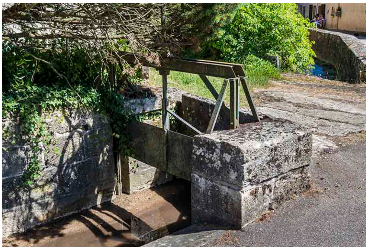
Vanne située à l'angle de l'impasse du château.