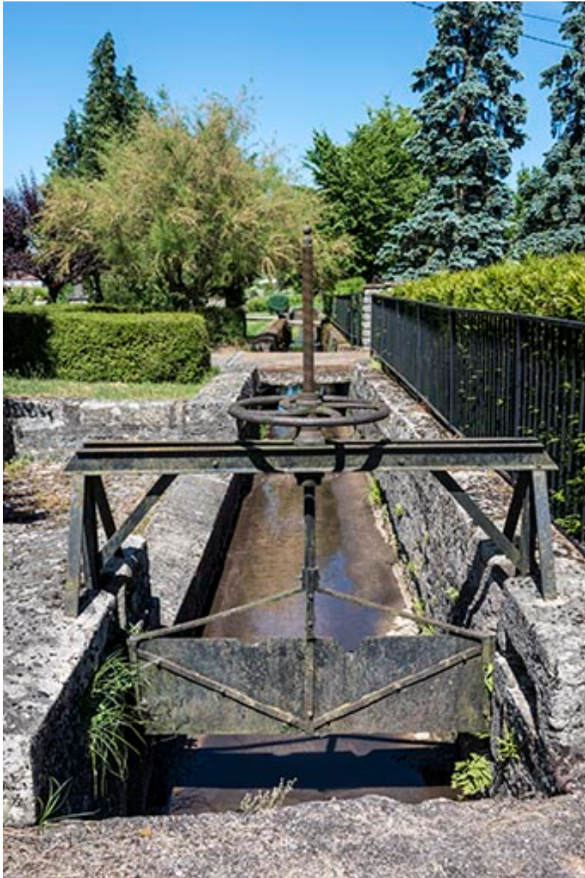
Vanne située en aval sud de la remise de matériel d'incendie, à l'entrée du village.