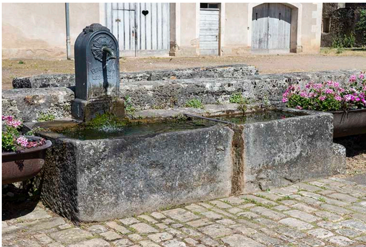
Borne-fontaine située rue de la Prairie.