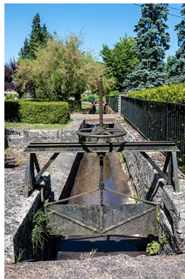
Vanne située en aval sud de la remise de matériel d'incendie, à l'entrée du village. IVR43_20177000826NUC4A