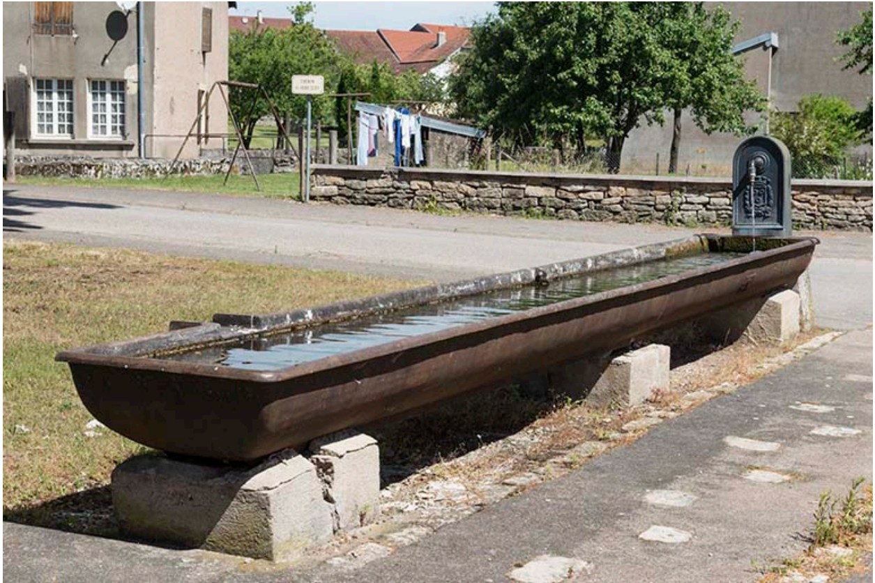
Borne-fontaine et auge d'abreuvoir en fonte situées à l'extrémité sud du village.