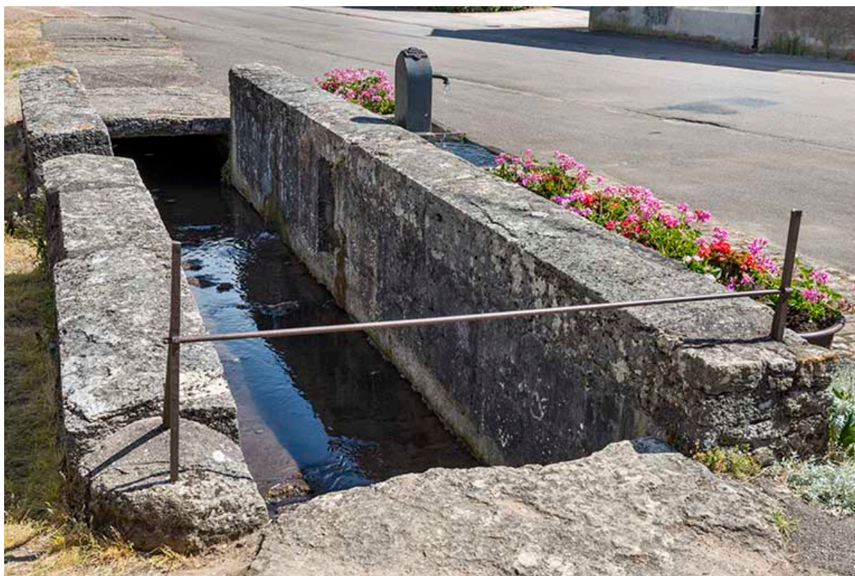
Le ruisseau canalisé alimentant les bornes fontaines.