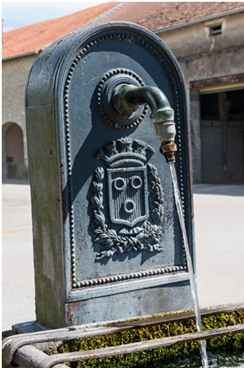
Vue rapprochée de la borne-fontaine située à l'extrémité sud du village.