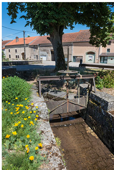
Vanne située à l'extrémité sud du village.