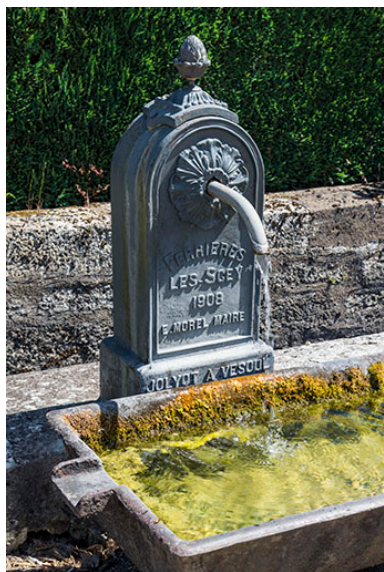
Détail de la borne-fontaine située route de Port-sur-Saône. IVR43_20177000828NUC4A