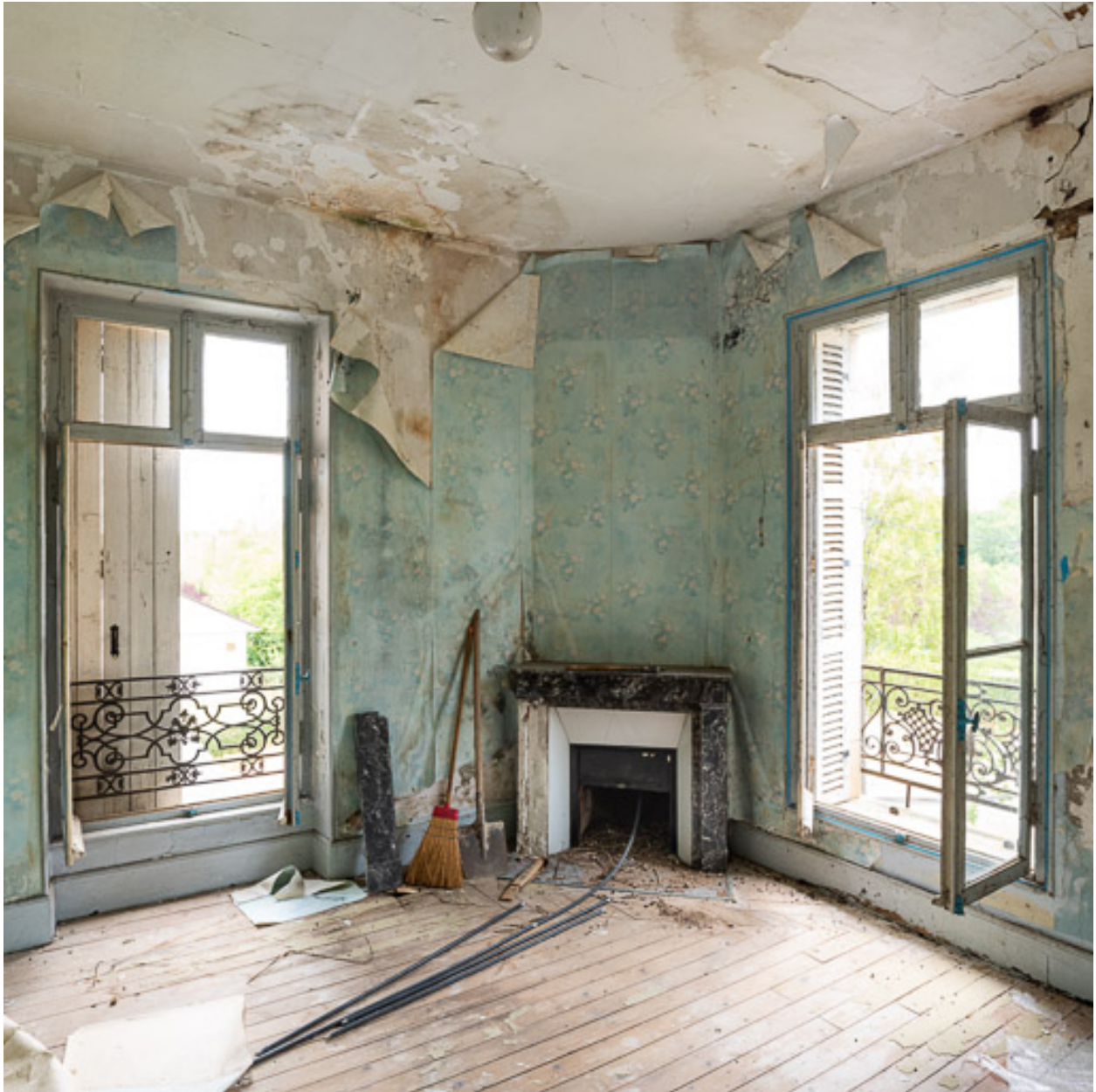
Chambre au premier étage avec deux fenêtres et une cheminée dans l'angle.