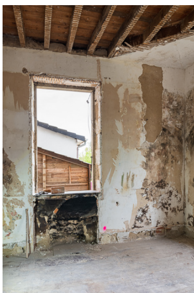
Salon au rez-de-chaussée avec vestige d'une cheminée sous baie. IVR26_20205800436NUC4A