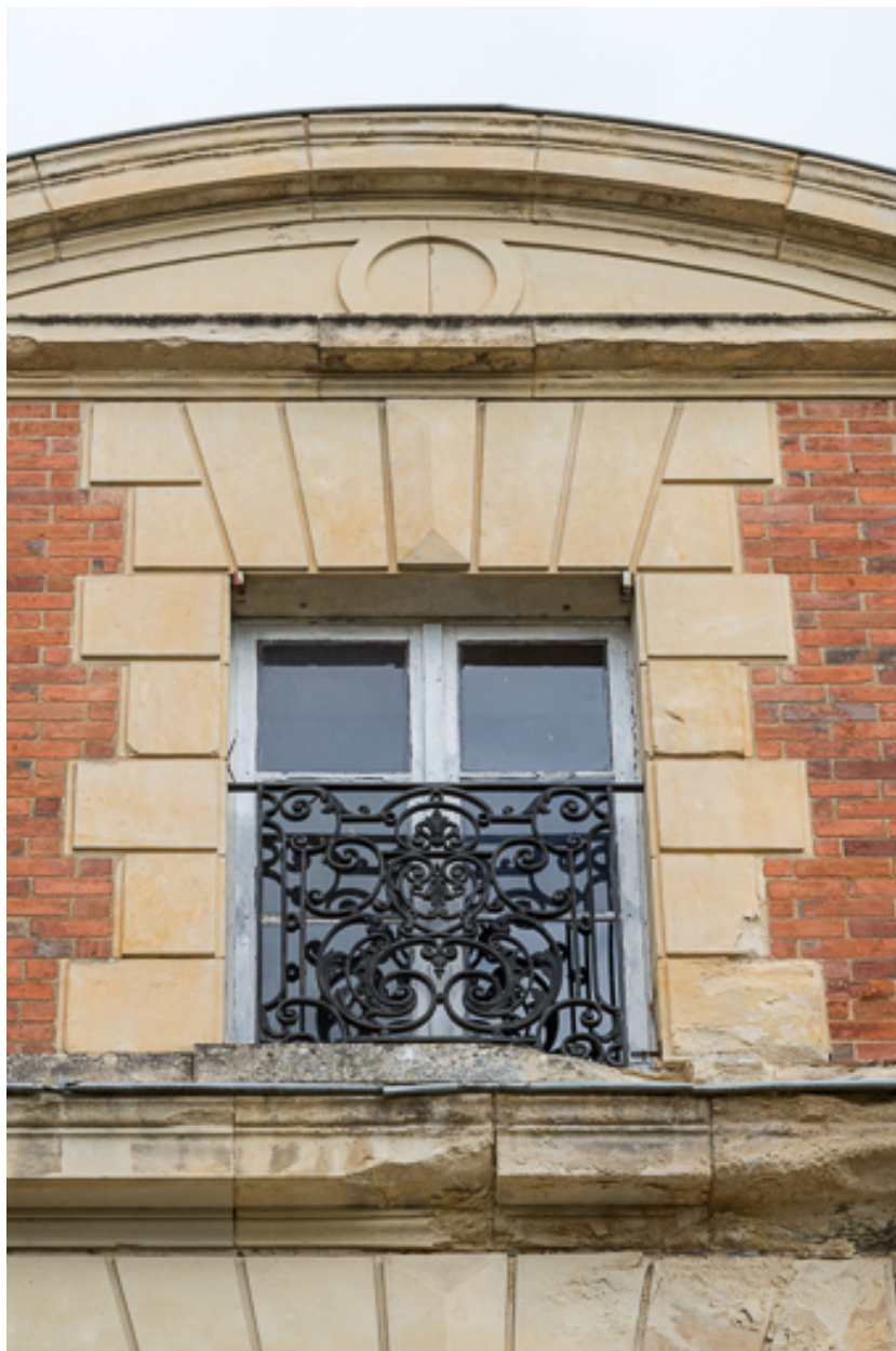
Façade sur l'avenue de Paris, détail, baie de la lucarne-pignon.