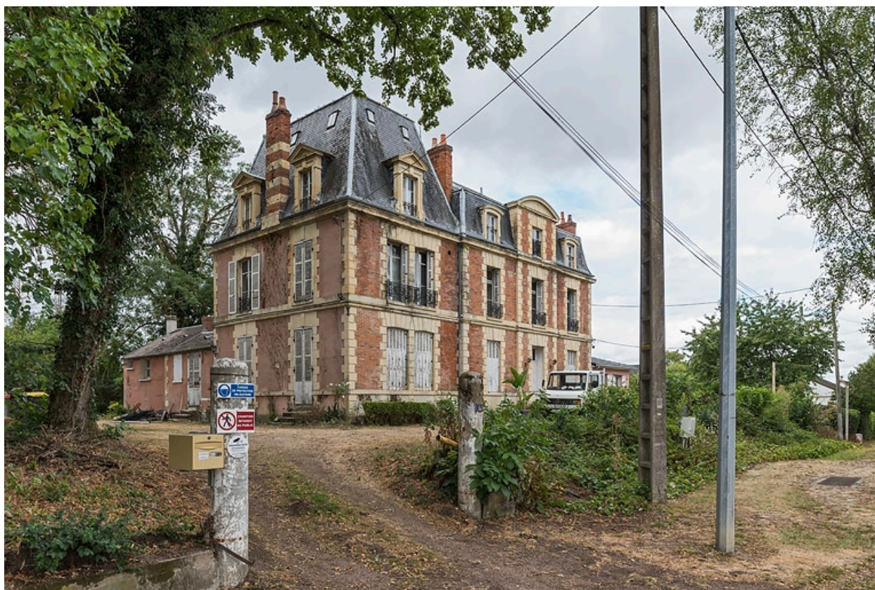
Vue d'ensemble depuis l'accès sur l'avenue de Paris.