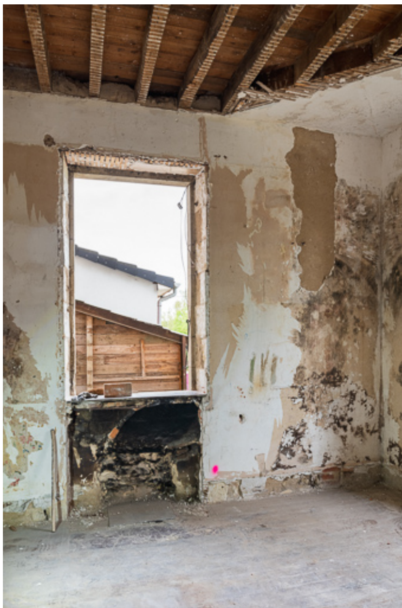
Salon au rez-de-chaussée avec vestige d'une cheminée sous baie.