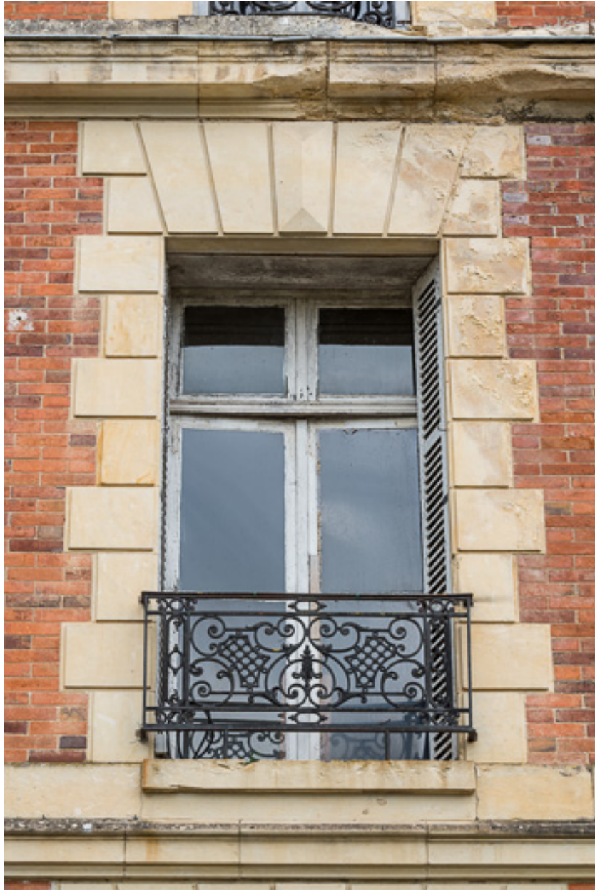
Façade sur l'avenue de Paris, détail, baie du premier étage.