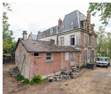
Extension à l'arrière du pavillon sud. IVR26_20205800431NUC4A