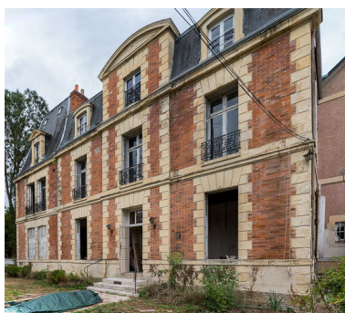
Façade sur l'avenue de Paris, vue de trois-quarts depuis le nord. IVR26_20205800433NUC4AQ