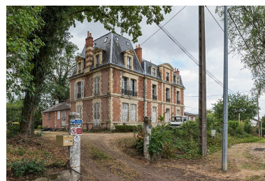
Vue d'ensemble depuis l'accès sur l'avenue de Paris. IVR26_20205800427NUC4A