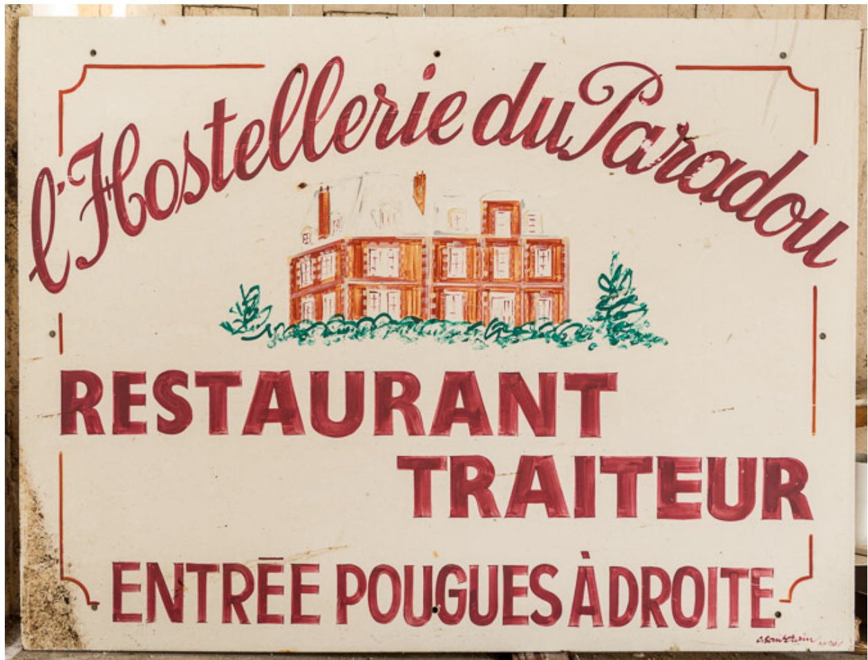
Enseigne de l'Hostellerie du Paradou, restaurant-traiteur, signée par Christian Souverain (de Nevers).