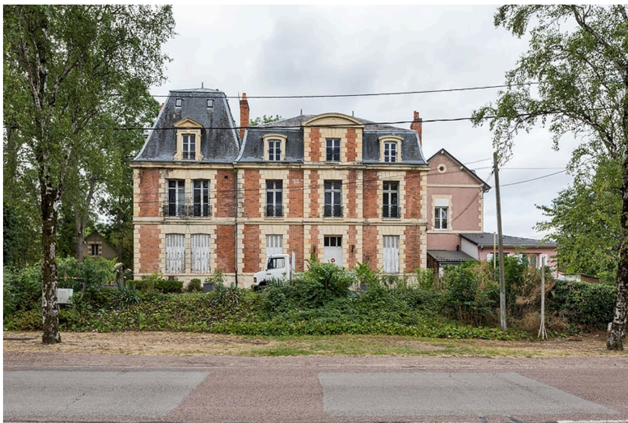
Façade sur l'avenue de Paris, vue de face.