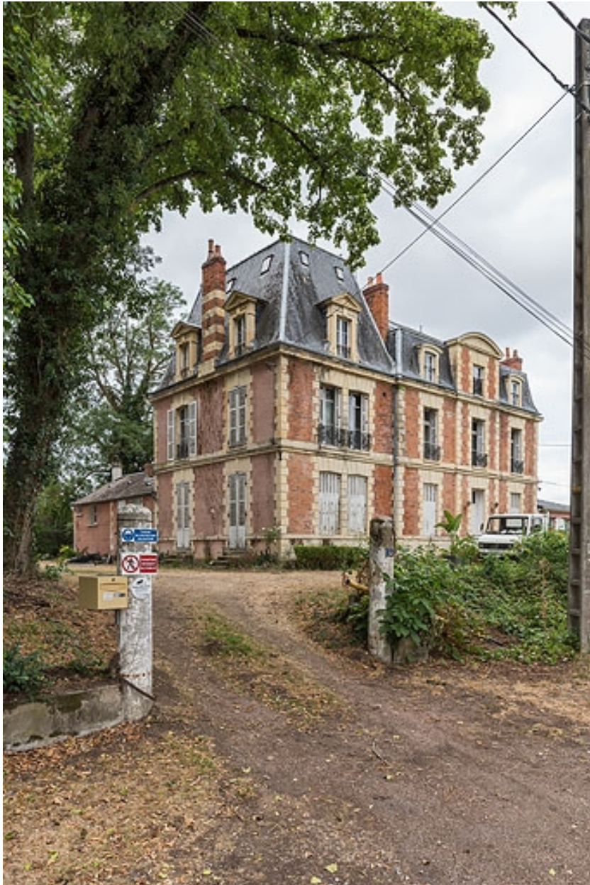
Vue d'ensemble depuis l'accès sur l'avenue de Paris.