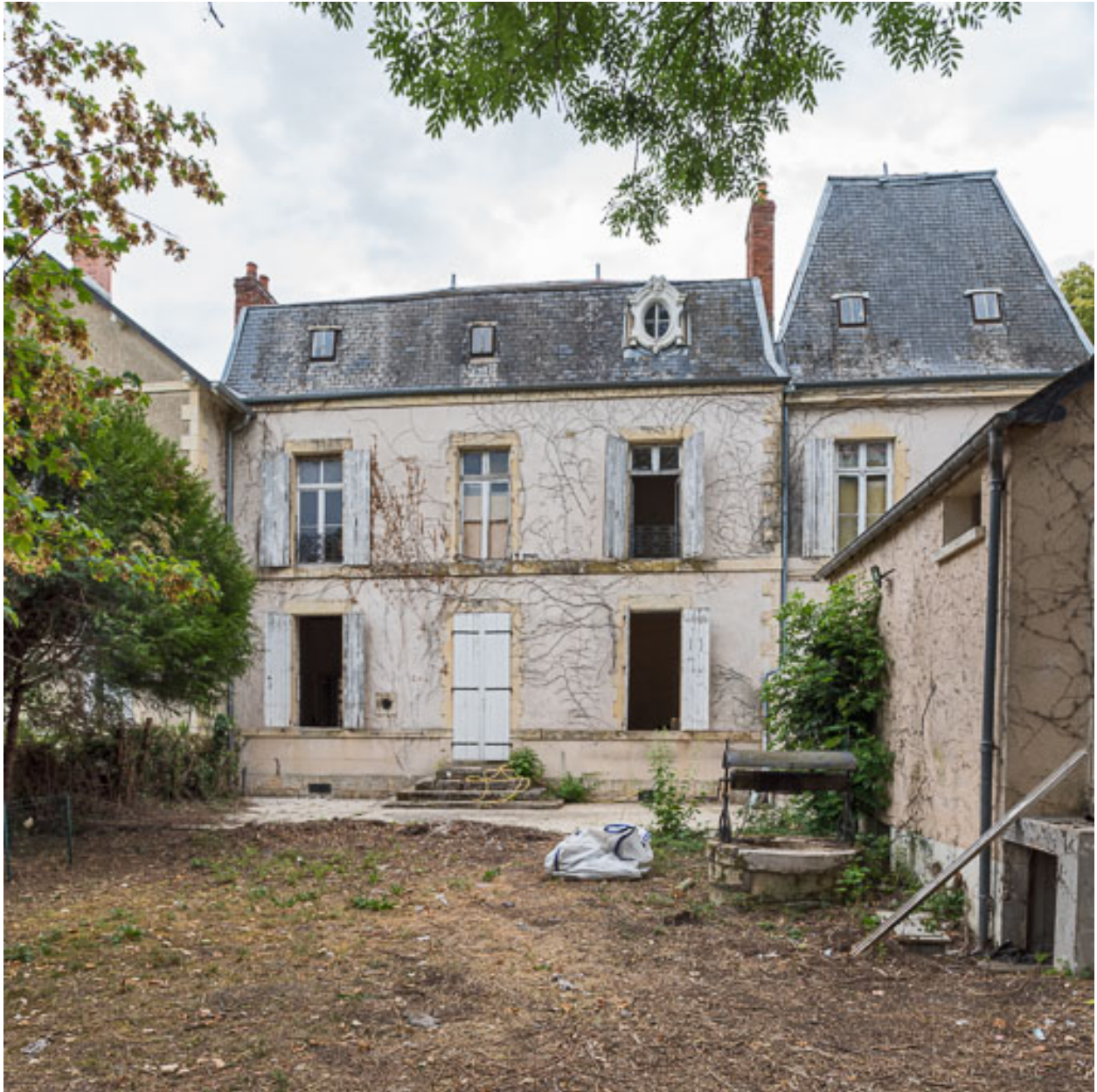
Façade sur le jardin, vue de face.