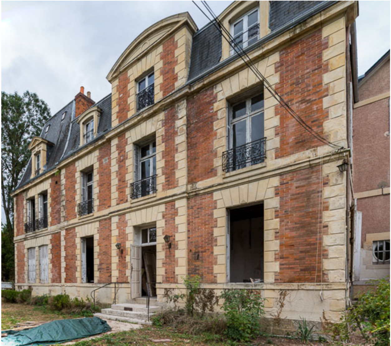
Façade sur l'avenue de Paris, vue de trois-quarts depuis le nord.