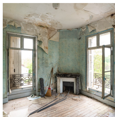
Chambre au premier étage avec deux fenêtres et une cheminée dans l'angle. IVR26_20205800437NUC4A