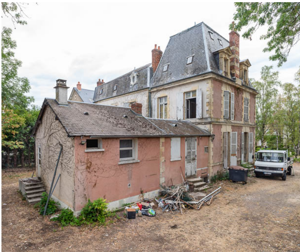
Extension à l'arrière du pavillon sud.