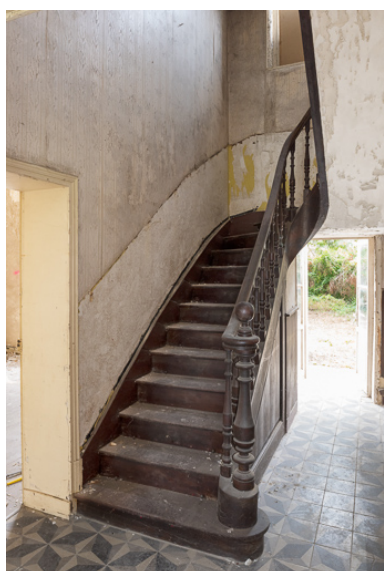
Escalier du corps principal, rez-de-chaussée. IVR26_20205800438NUC4A