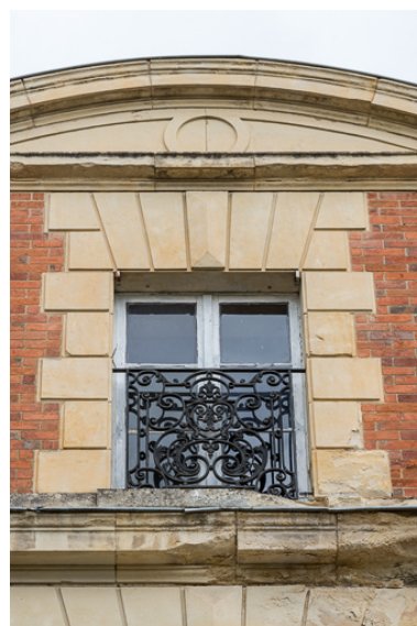
Façade sur l'avenue de Paris, détail, baie de la lucarne-pignon.