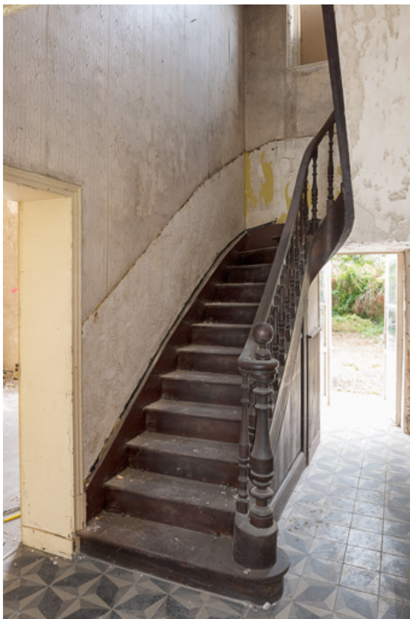
Escalier du corps principal, rez-de-chaussée.