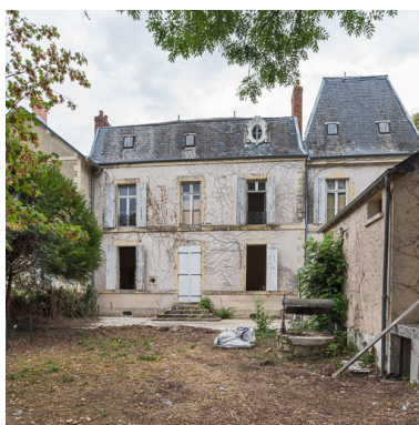
Façade sur le jardin, vue de face. IVR26_20205800432NUC4A