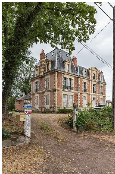
Vue d'ensemble depuis l'accès sur l'avenue de Paris. IVR26_20205800426NUC4A