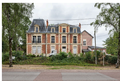
Façade sur l'avenue de Paris, vue de face.