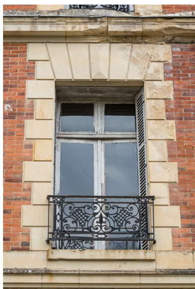
Façade sur l'avenue de Paris, détail, baie du premier étage. IVR26_20205800434NUC4A