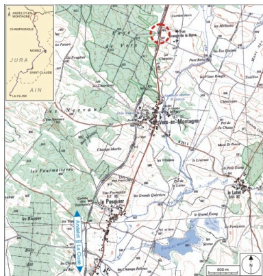
Carte et schéma de localisation. Carte topographique, IGN, 2000, dalle F087_047, échelle 1:25 000. Scan 25, licence n° 2008/CISE/2968. IVR43_20073900410NUDA