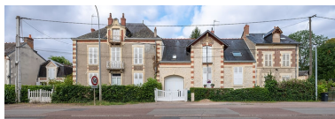
Vue d'ensemble.