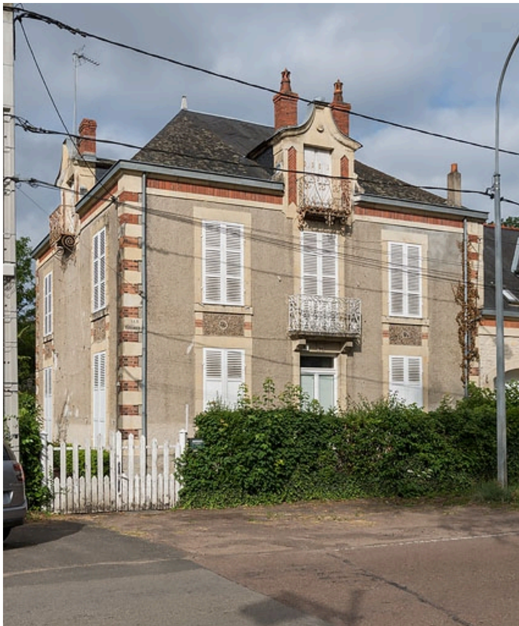
Façade de la demeure 16 avenue de Paris.