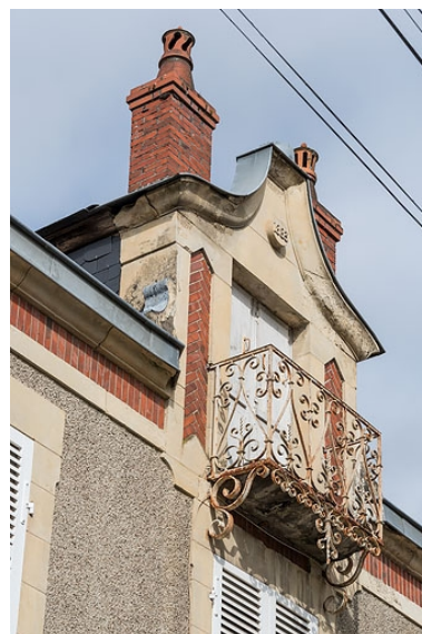
Lucarne portant la date ("1883").