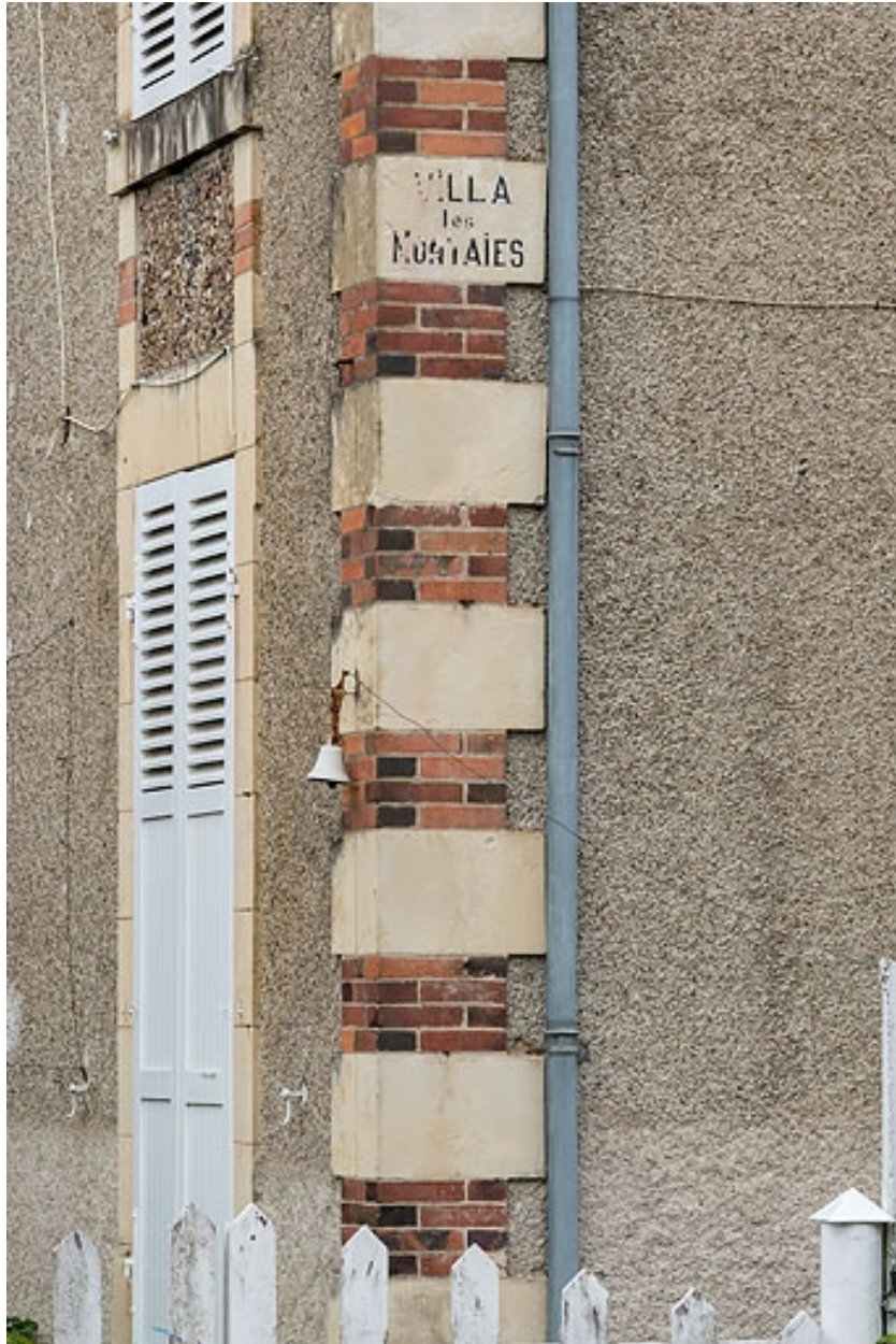
Chaîne d'angle portant le nom ("Villa Les Nontaies").