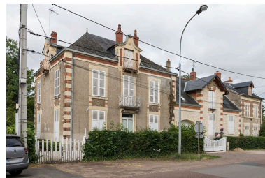
Vue d'ensemble. IVR26_20205800458NUC4A