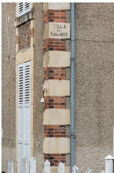
Chaîne d'angle portant le nom ("Villa Les Nontaies"). IVR26_20205800461NUC4A