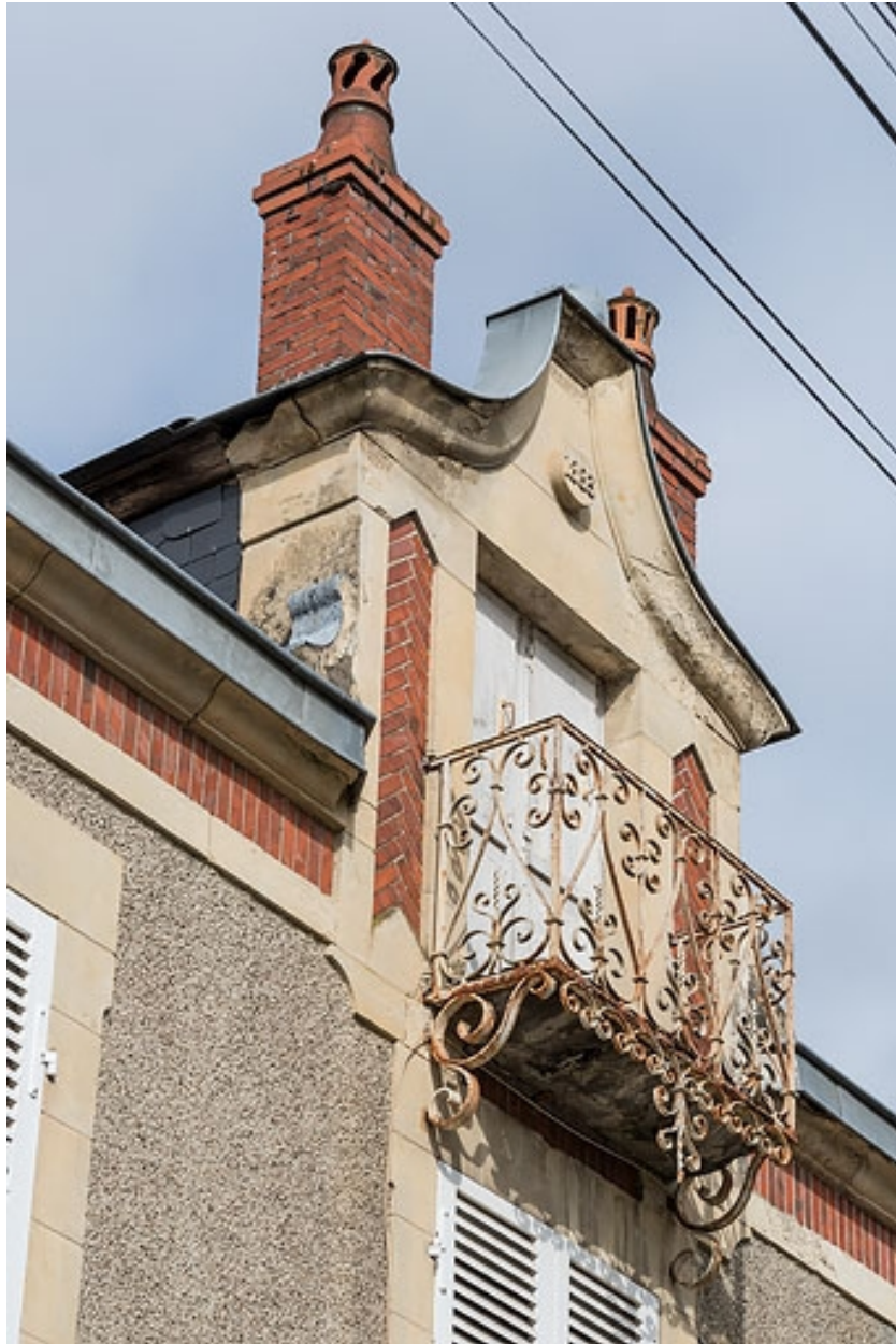
Lucarne portant la date ("1883").