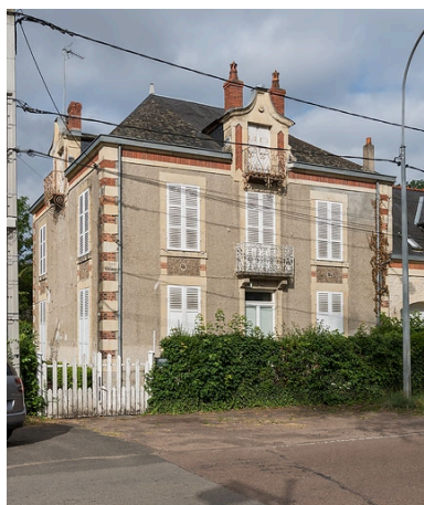
Façade de la demeure 16 avenue de Paris. IVR26_20205800459NUC2A