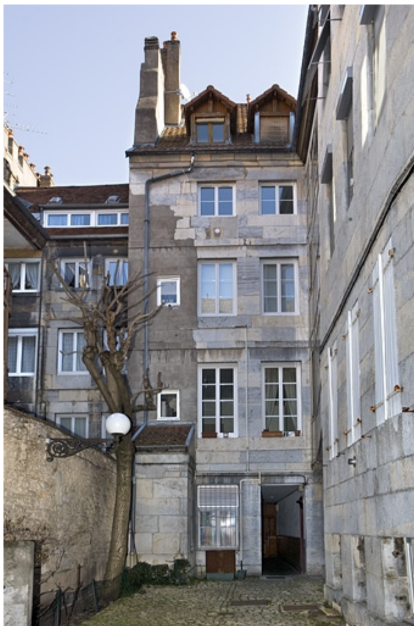
Vue d'ensemble de la façade postérieure du logis principal.