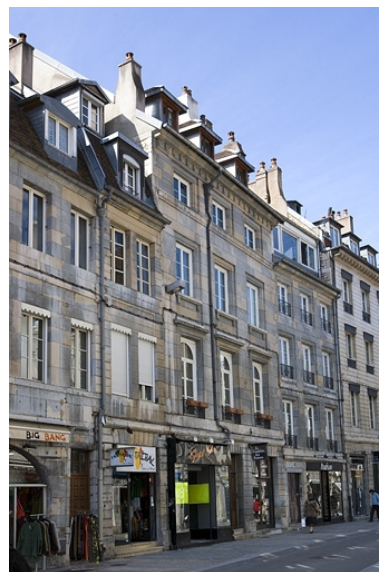
Vue d'ensemble de la façade sur rue de trois quarts gauche. IVR43_20082500285NUC2A