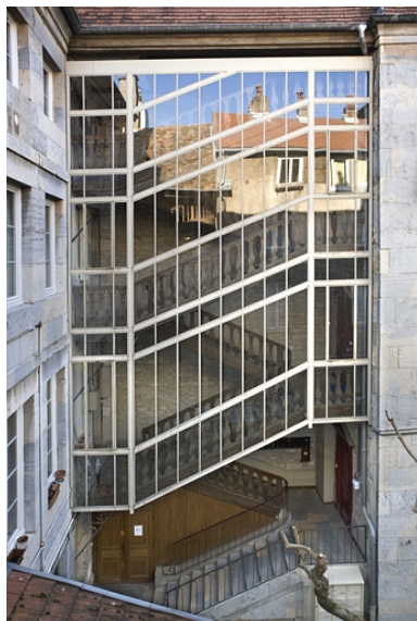
Vue d'ensemble premier escalier à cage ouverte, de face. IVR43_20082500293NUC2A