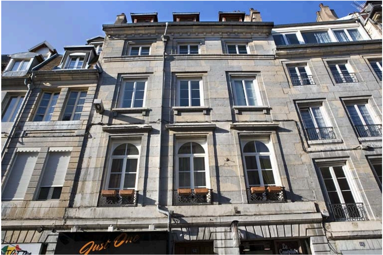
Détail de la façade sur rue au-dessus du rez-de-chaussée, de face.