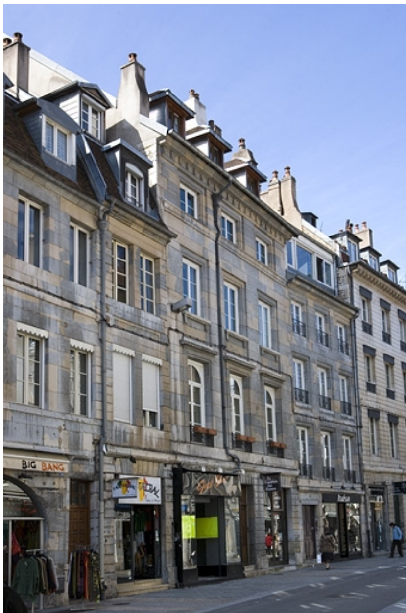
Vue d'ensemble de la façade sur rue de trois quarts gauche.