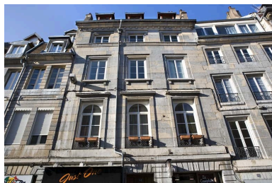
Détail de la façade sur rue au-dessus du rez-de-chaussée, de face.