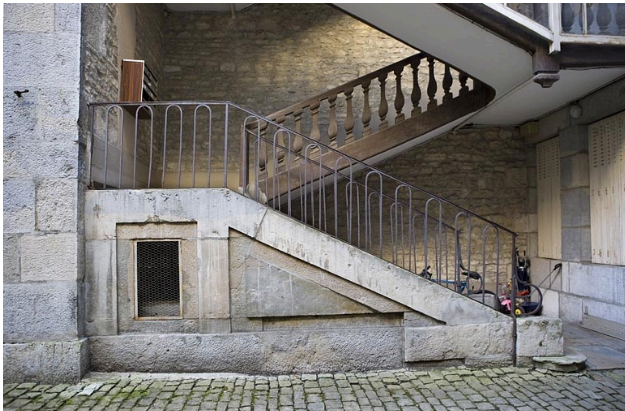
Détail du départ du premier escalier à cage ouverte depuis la cour.