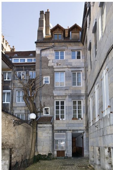
Vue d'ensemble de la façade postérieure du logis principal.