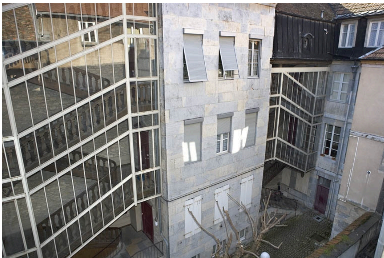
Bâtiment à gauche de la première cour : vue rapprochée.