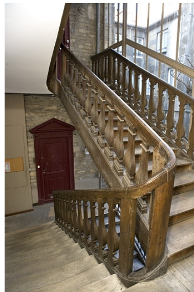
Détail du premier escalier à cage ouverte depuis l'intérieur de la cage. IVR43_20082500287NUC2A