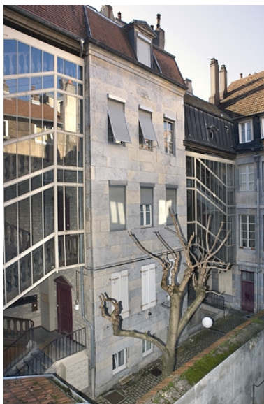
Vue d'ensemble du bâtiment encadrant les deux escaliers à cage ouverte situés dans la première cour. IVR43_20082500292NUC2A