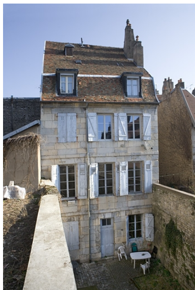
Vue d'ensemble de la façade postérieure du logis secondaire. IVR43_20082500291NUC2A