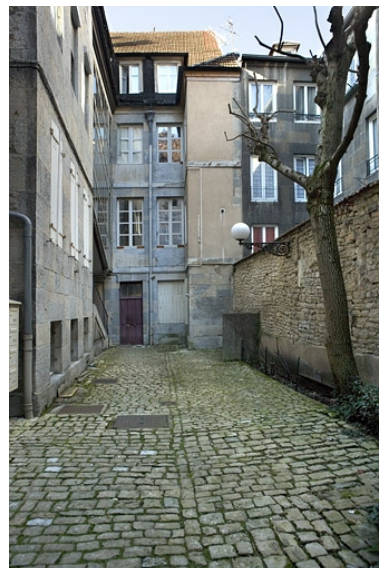
Vue d'ensemble de la façade antérieure du logis secondaire.