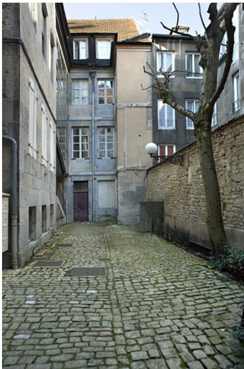
Vue d'ensemble de la façade antérieure du logis secondaire.