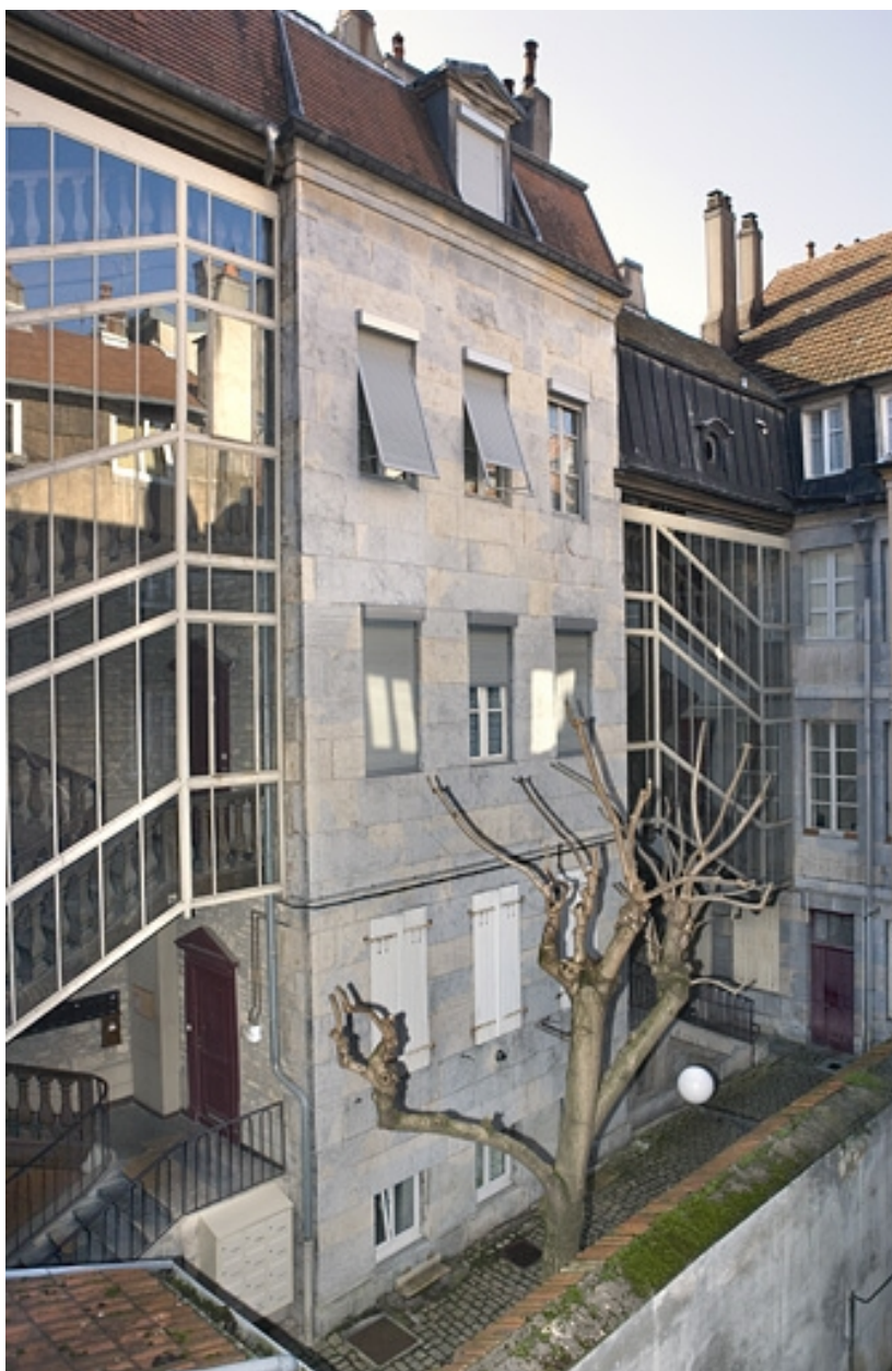
Vue d'ensemble du bâtiment encadrant les deux escaliers à cage ouverte situés dans la première cour.