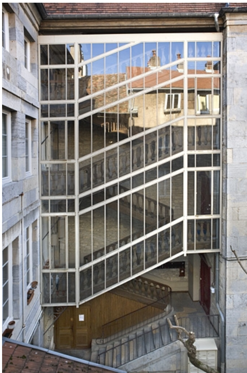
Vue d'ensemble premier escalier à cage ouverte, de face.