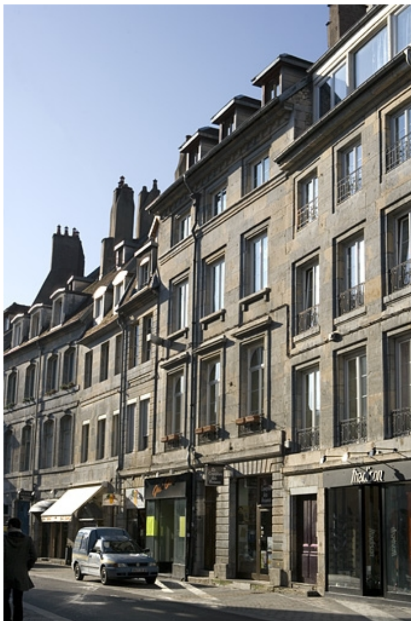
Vue éloignée de la maison dans l'alignement de la rue.