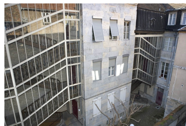
Bâtiment à gauche de la première cour : vue rapprochée. IVR43_20082500294NUC2A