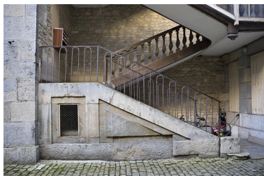
Détail du départ du premier escalier à cage ouverte depuis la cour.