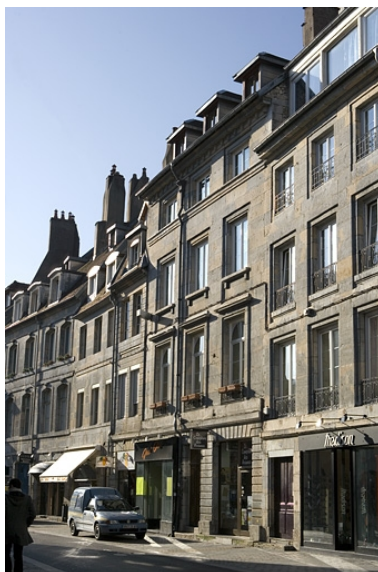
Vue éloignée de la maison dans l'alignement de la rue.