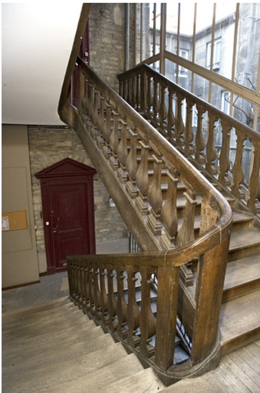
Détail du premier escalier à cage ouverte depuis l'intérieur de la cage.