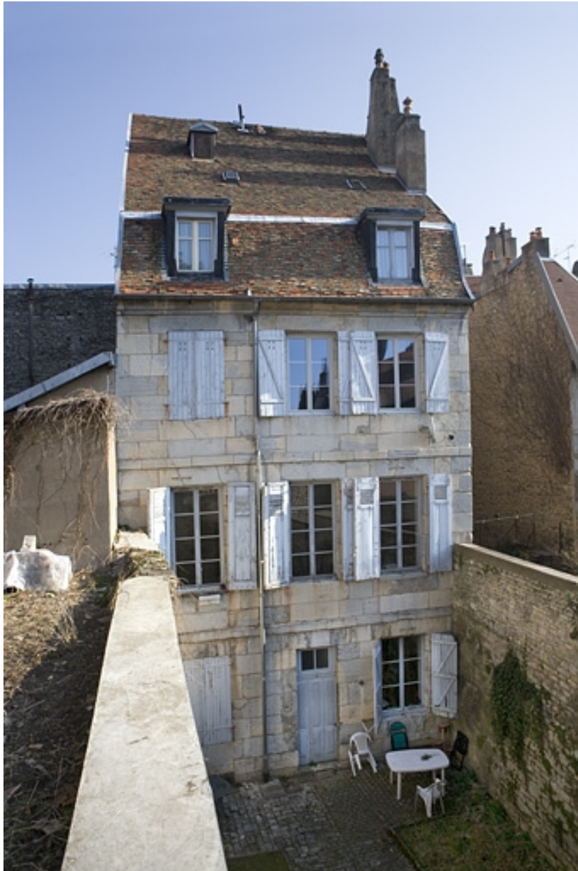
Vue d'ensemble de la façade postérieure du logis secondaire.