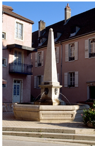
Vue d'ensemble. IVR43_19987000043ZA