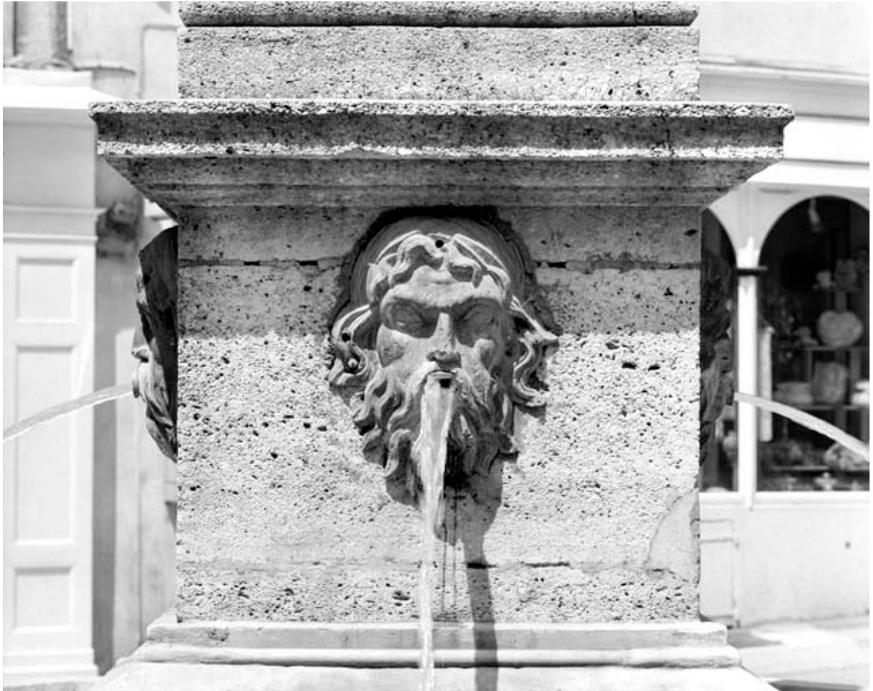
Détail : socle de l'obélisque, tête d'homme bouche fermée.