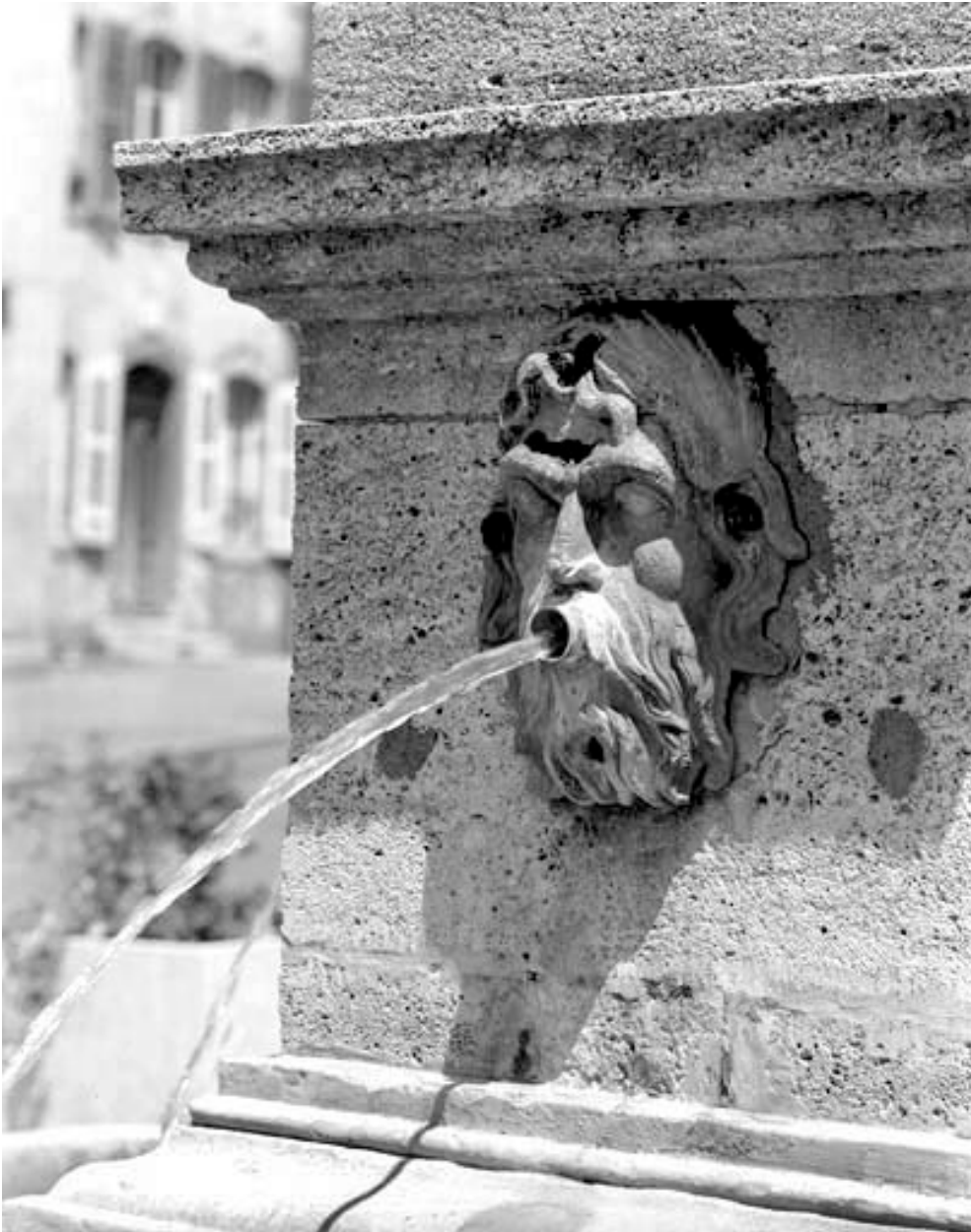
Détail : tête d'homme bouche ouverte, de trois quarts droit, avec angle du socle.