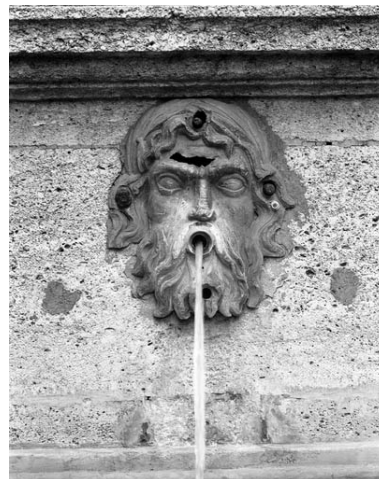
Détail : tête d'homme bouche ouverte sur le socle de l'obélisque, de face. IVR43_19897000233X