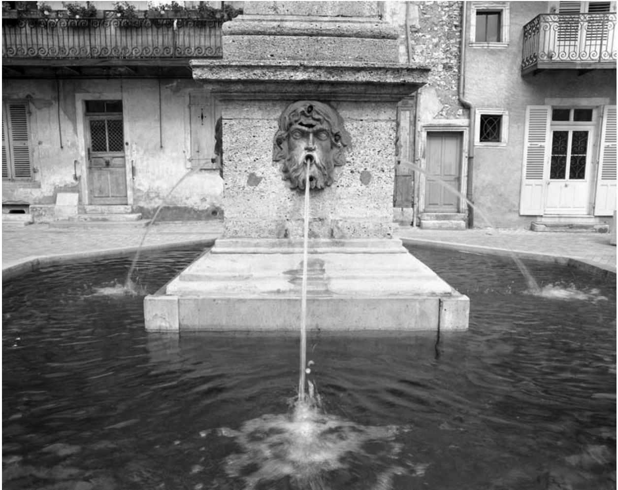
Détail du socle de l'obélisque.