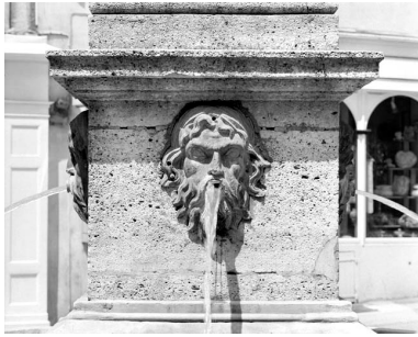
Détail : socle de l'obélisque, tête d'homme bouche fermée.