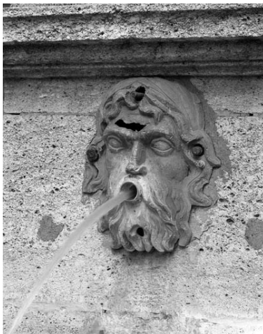
Détail : tête d'homme bouche ouverte, sur le socle de l'obélisque, de trois quarts droit. IVR43_19897000232X