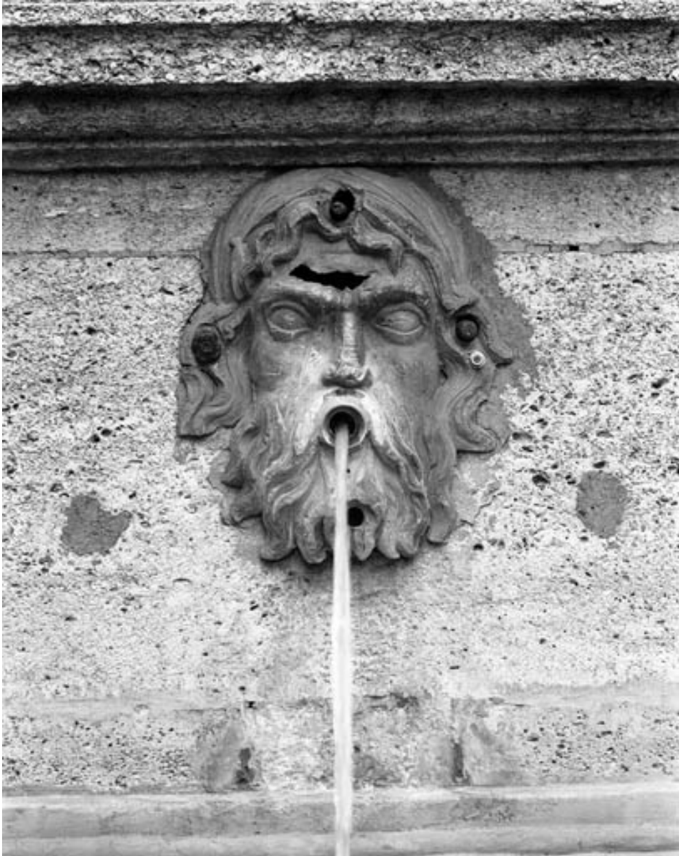
Détail : tête d'homme bouche ouverte sur le socle de l'obélisque, de face.