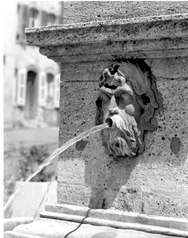
Détail : tête d'homme bouche ouverte, de trois quarts droit, avec angle du socle.