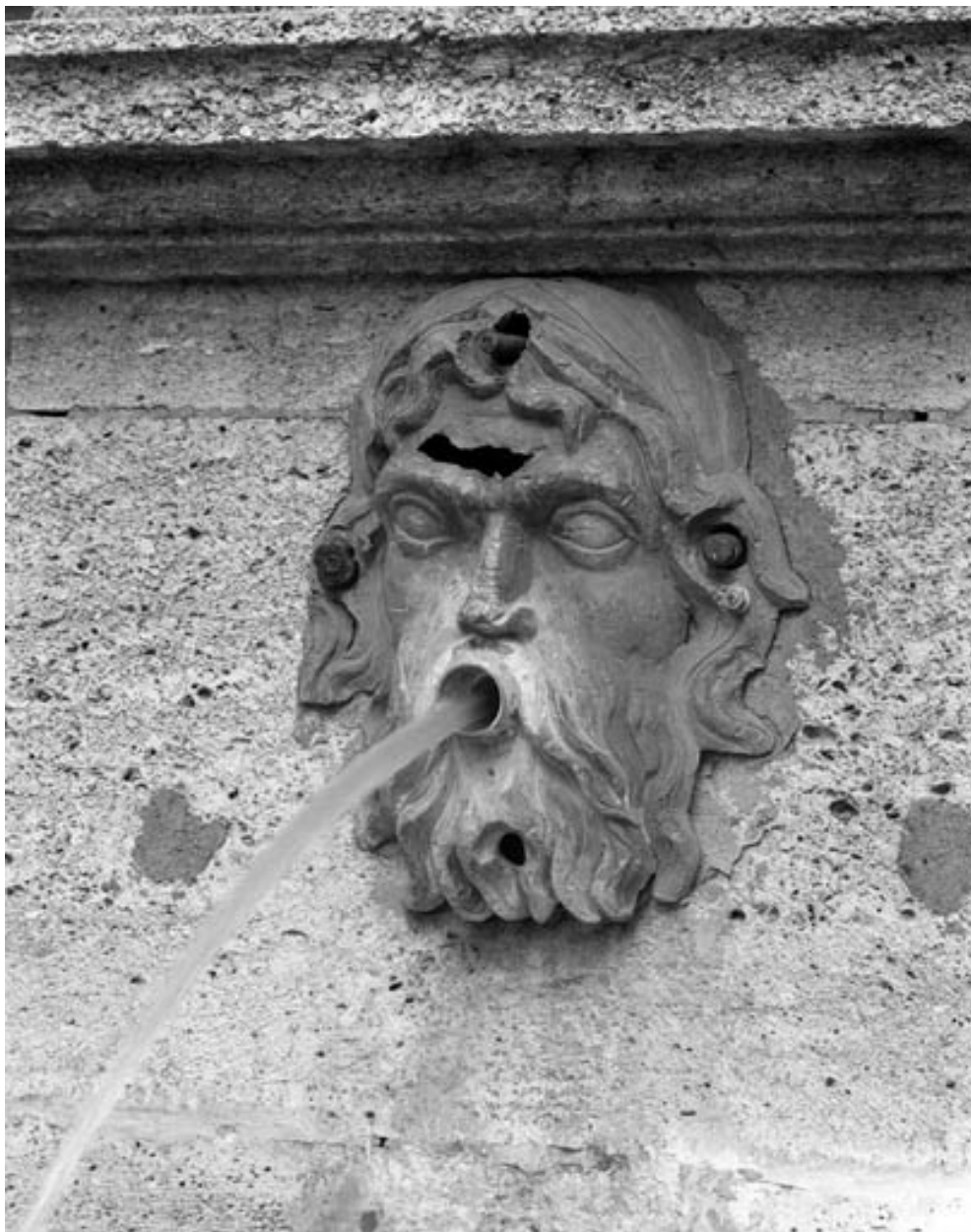
Détail : tête d'homme bouche ouverte, sur le socle de l'obélisque, de trois quarts droit.