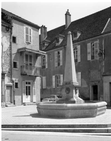
Vue d'ensemble. IVR43_19897000230V