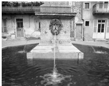
Détail du socle de l'obélisque. IVR43_19897000231X