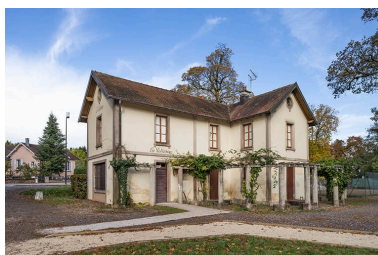
Vue depuis le sud-est. IVR43_20207000717NUC4A