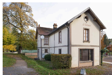
Vue depuis le sud-ouest. IVR43_20207000719NUC4A