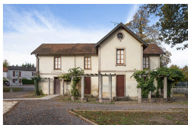
Vue depuis l'est. IVR43_20207000718NUC4A