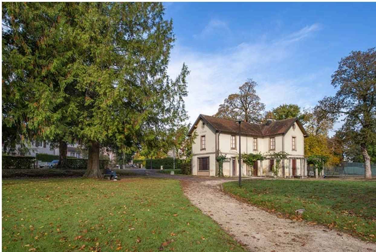
Situation de l'édifice, en bordure du parc thermal.