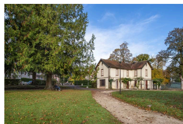
Situation de l'édifice, en bordure du parc thermal. IVR43_20207000720NUC4A