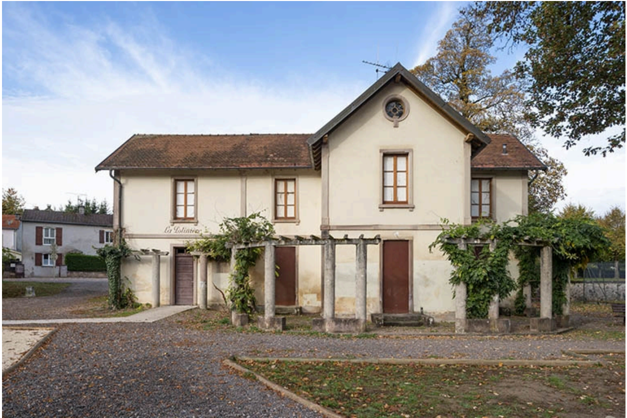
Vue depuis l'est.