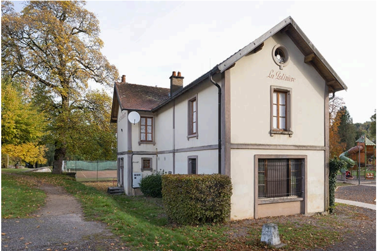
Vue depuis le sud-ouest.