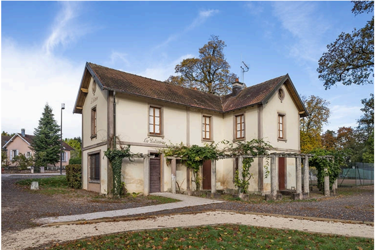
Vue depuis le sud-est.