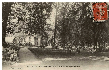
Vue ancienne. IVR43_20207000749NUC4A