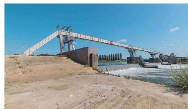
Le barrage d'Ormes vu depuis la pile ovale reliant ses deux parties.