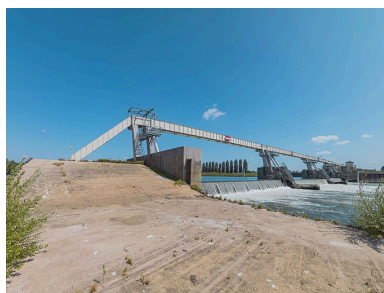
Le barrage d'Ormes vu depuis la pile ovale reliant ses deux parties. IVR26_20217100403NUC4A