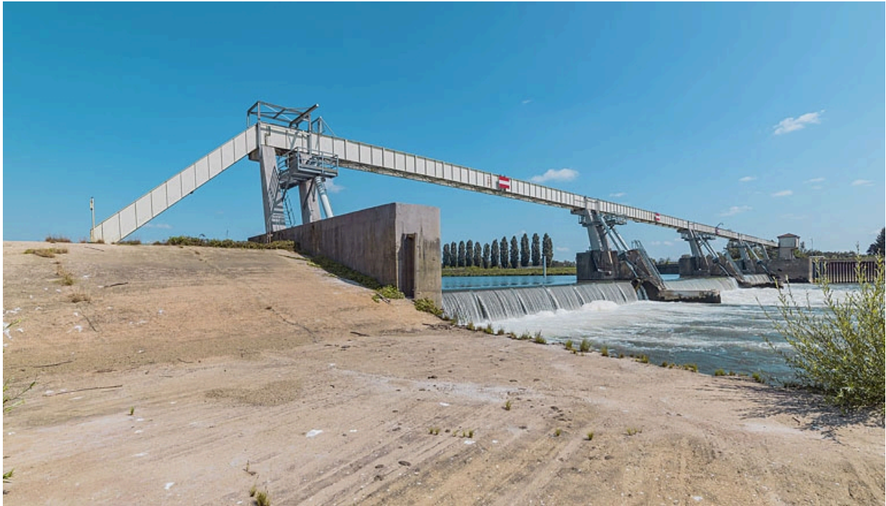
Le barrage d'Ormes vu depuis la pile ovale reliant ses deux parties.