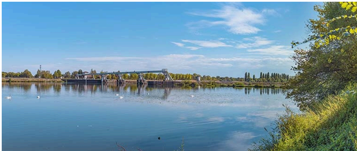
Le barrage, vu d'amont.