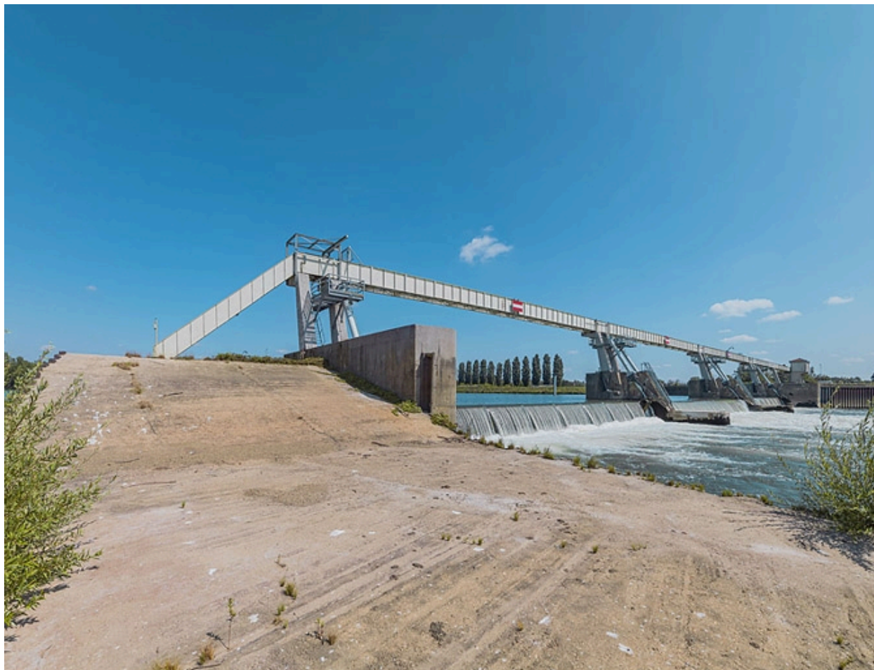
Le barrage d'Ormes vu depuis la pile ovale reliant ses deux parties.