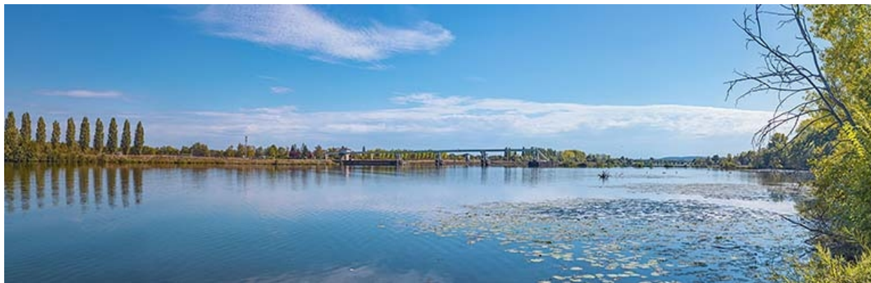
Le barrage, vu d'amont.