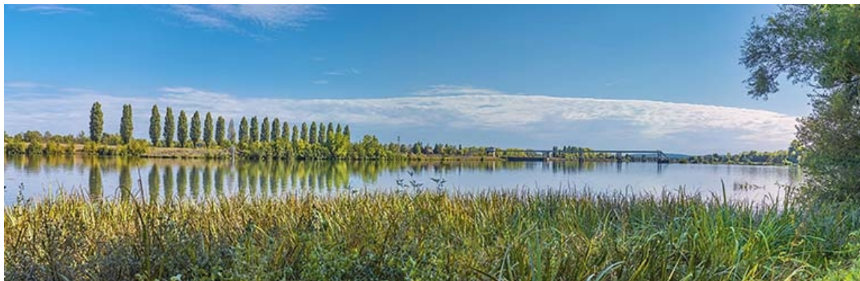
Le barrage, vu d'amont.