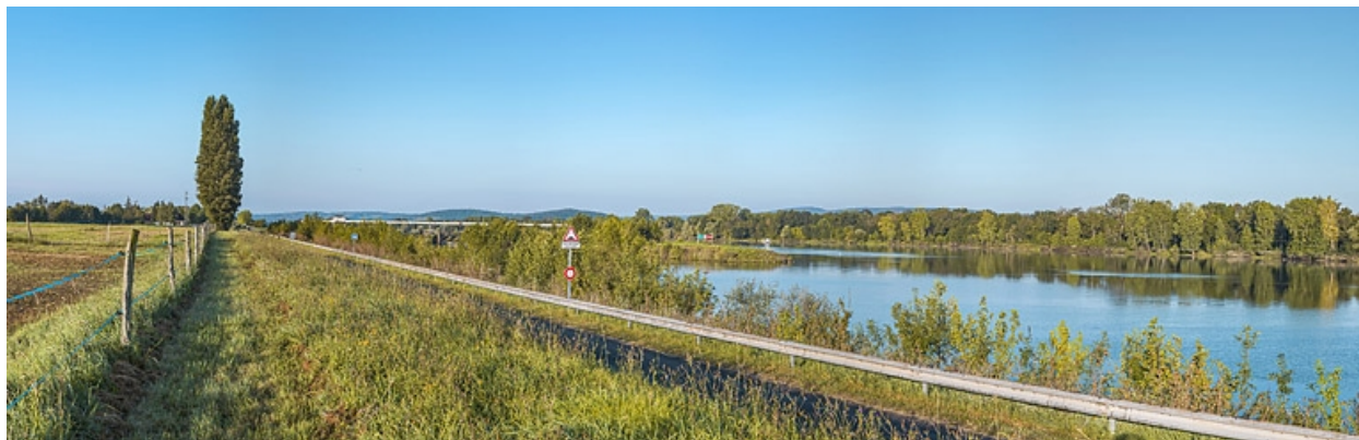
La Saône en amont du barrage d'Ormes.