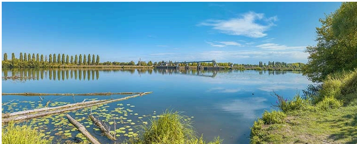
Vue d'ensemble du barrage depuis la rive opposée.