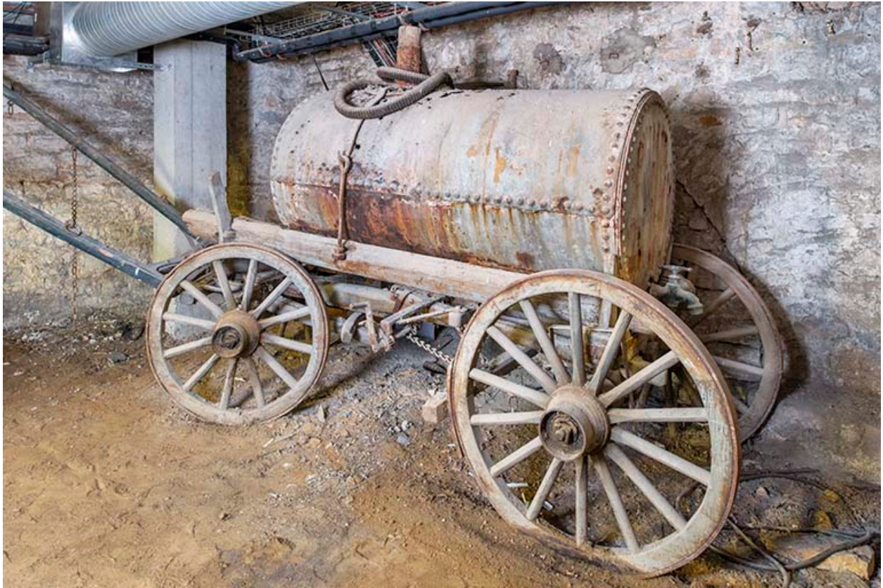
Vue de trois quarts depuis l'arrière.