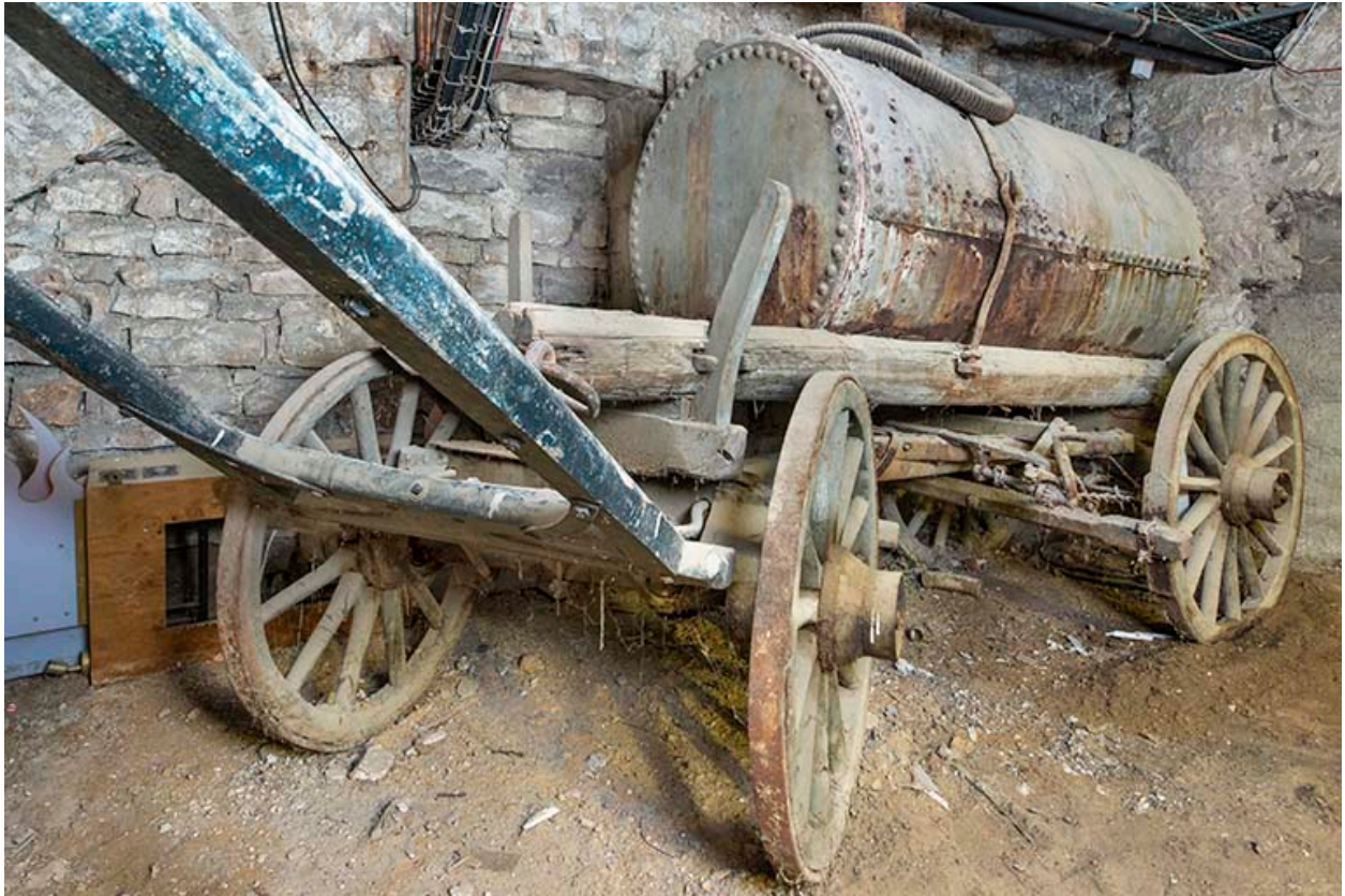
Vue de trois quarts depuis l'avant.