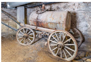
Vue de trois quarts depuis l'arrière.

Phot. Jérôme Mongreville IVR43_20232500382NUC4A