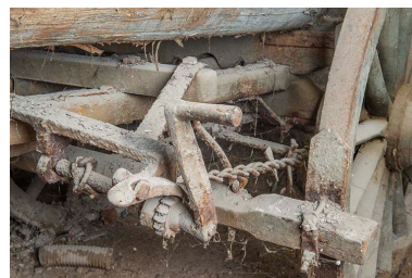
Détail, manivelle de frein (?).

IVR43_20232500386NUC4A