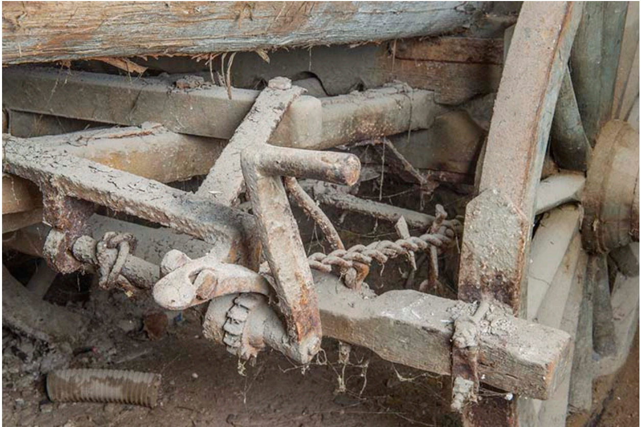
Détail, manivelle de frein (?).