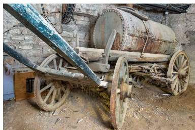
Vue de trois quarts depuis l'avant.

Phot. Jérôme Mongreville IVR43_20232500384NUC4A