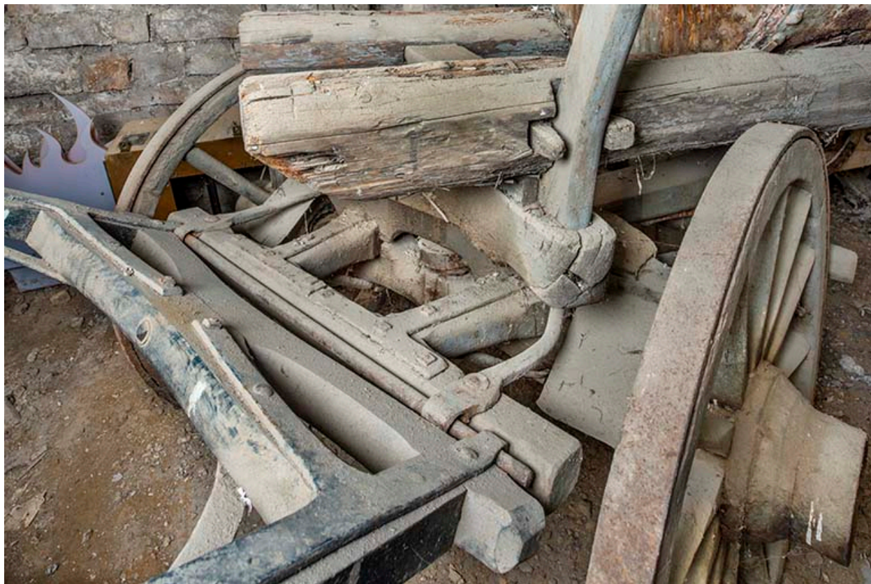
Détail, essieu avant.