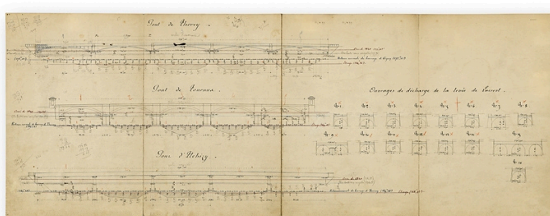
Ponts de Thorey, de Tournus et d'Uchizy. Elévations d'aval. [Elévation du pont d'Uchizy]. 1899.