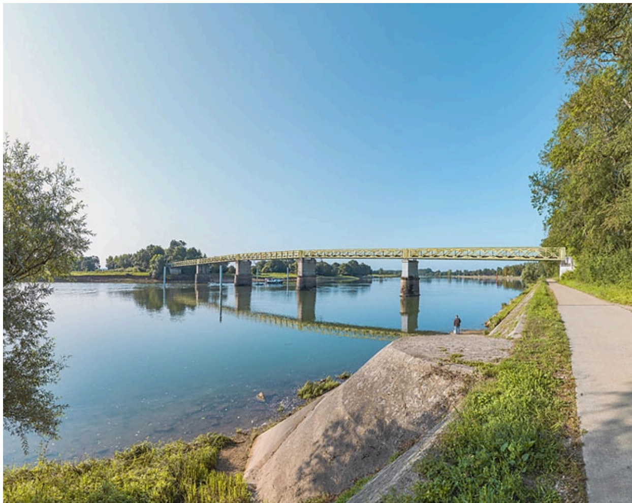
Vue d'ensemble du pont d'amont et depuis la rive droite. Perrés et rampe au premier plan.