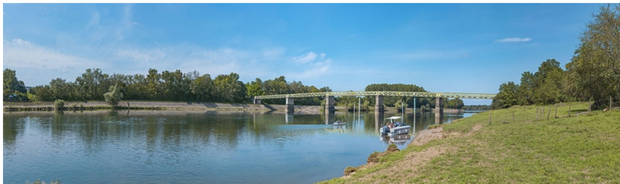
Le pont vu d'aval depuis la rive gauche.