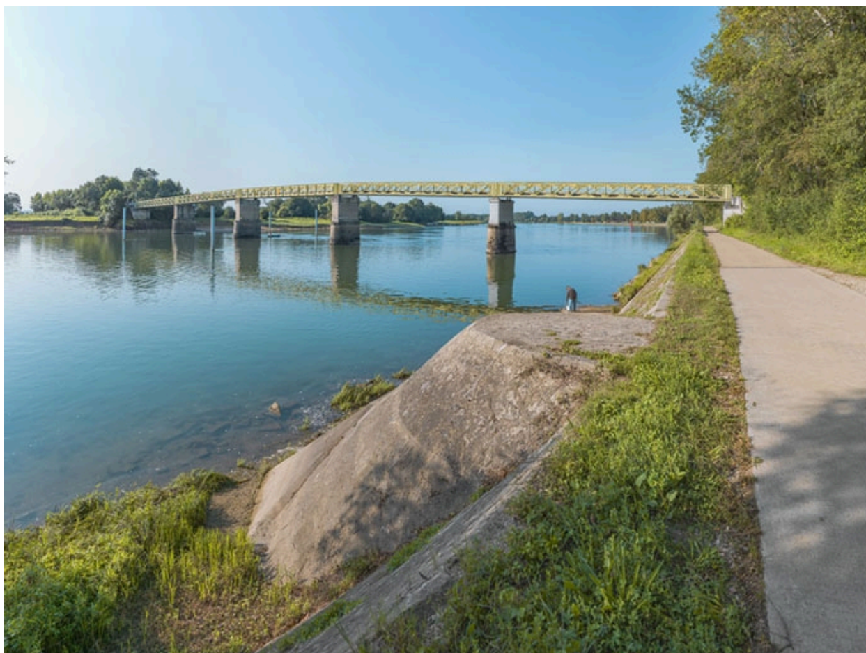
Vue d'ensemble du pont d'amont et depuis la rive droite. Perrés et rampe au premier plan.