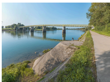
Vue d'ensemble du pont d'amont et depuis la rive droite. Perrés et rampe au premier plan.