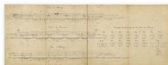
Ponts de Thorey, de Tournus et d'Uchizy. Elévations d'aval. [Elévation du pont d'Uchizy]. 1899. IVR26_20197100725NUC4A