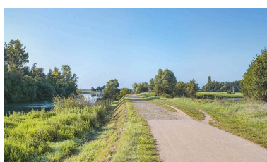
Le passage de l'île d'Uchizy, en amont du pont, rive droite. À gauche, la Saône et à droite, la lône.