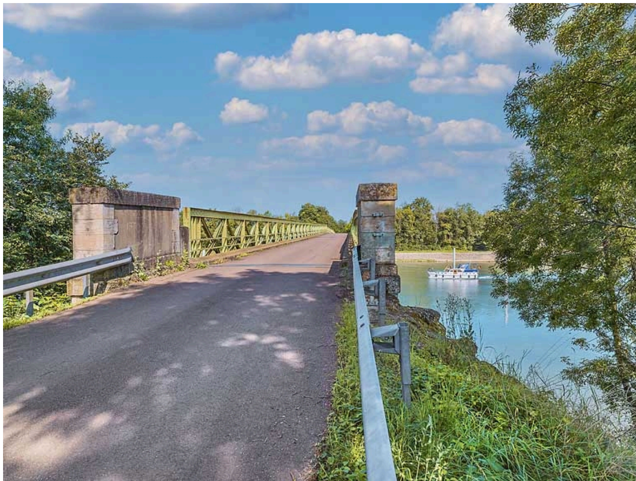
Vue du dessus du pont, rive gauche.