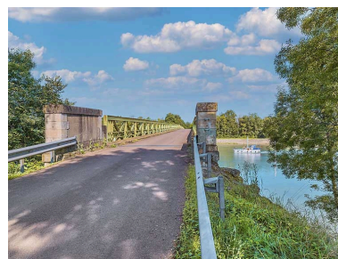
Vue du dessus du pont, rive gauche. IVR26_20217100497NUC4A