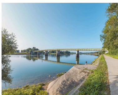
Vue d'ensemble du pont d'amont et depuis la rive droite. Perrés et rampe au premier plan.