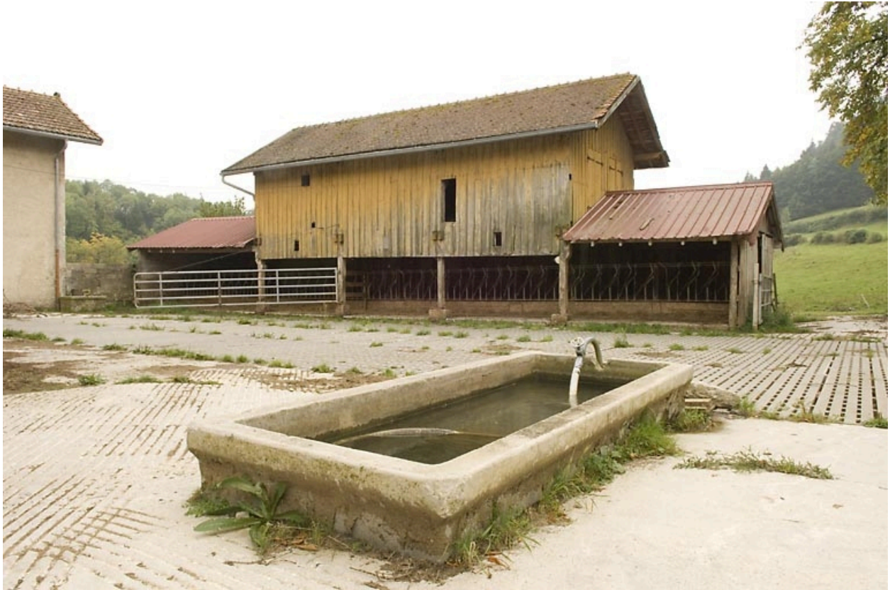
Etable (stabulation) et fontaine en béton.