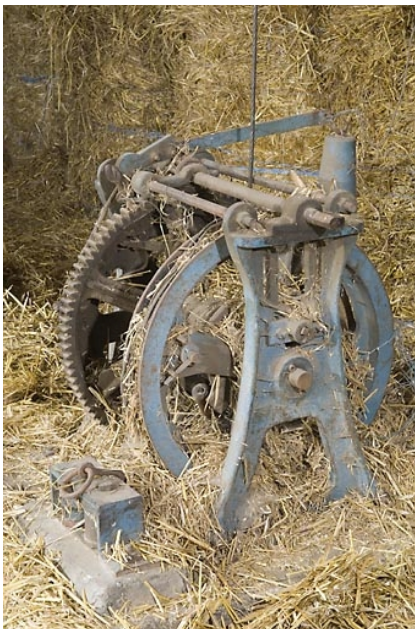
Grange haute : treuil de la déchargeuse.