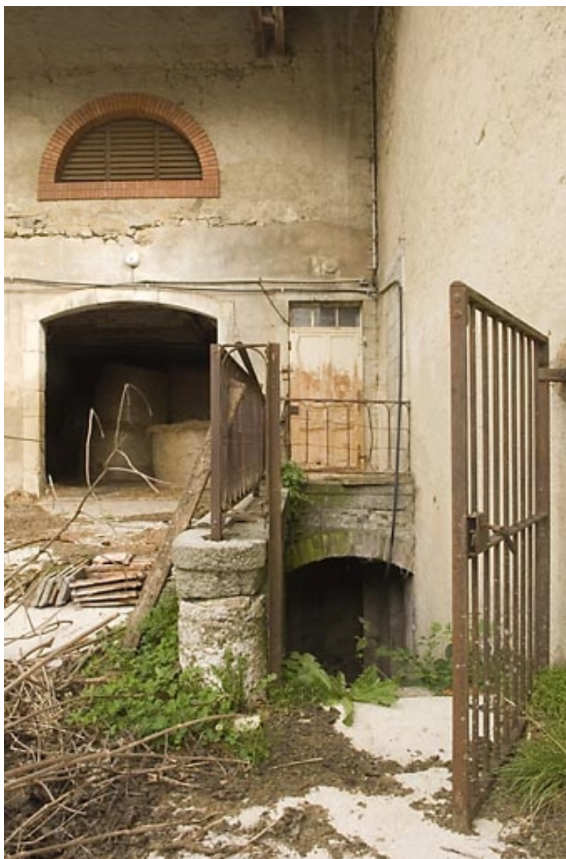
Habitation : façade postérieure, descente de cave.