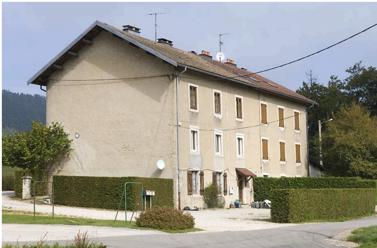
Immeuble de logements, au nord-ouest.