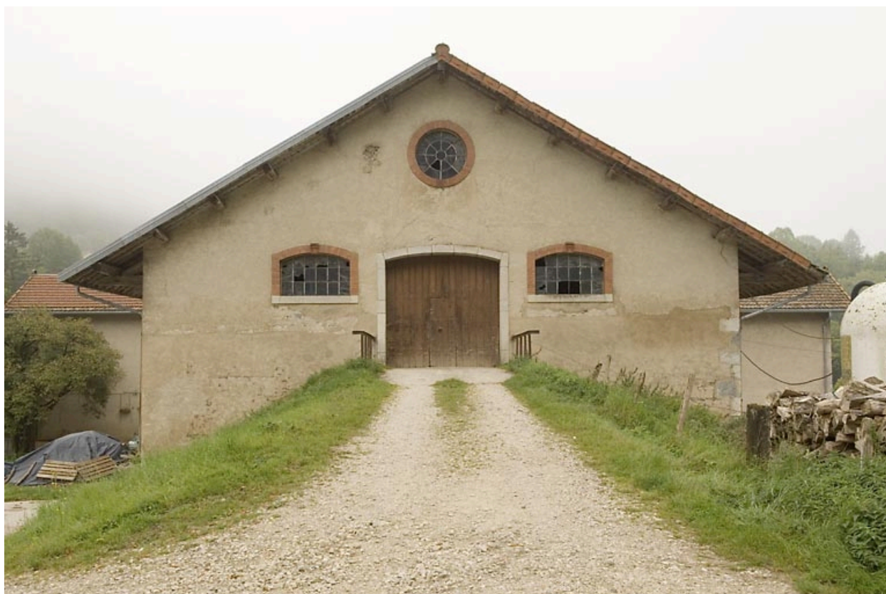
Etables et granges : façade postérieure, avec accès à la grange haute.