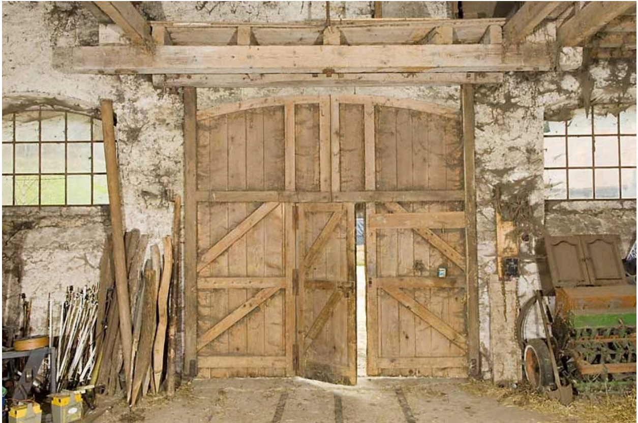
Grange haute : porte vue de l'intérieure.