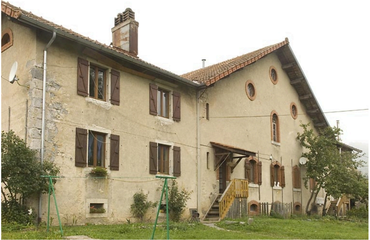
Habitation : façade antérieure, de trois quarts gauche.