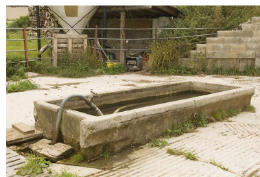
Fontaine en béton. IVR43_20082501100NUC2A