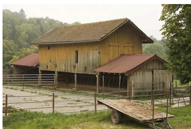
Etable (stabulation).