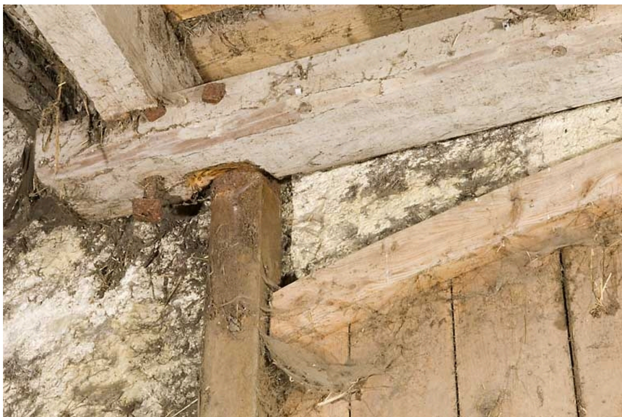
Grange haute : fixation du pivotement haut d'un vantail de la porte.