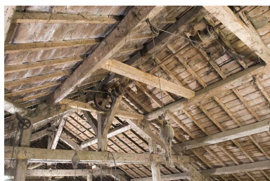
Grange haute : poulies et contreponds de la déchargeuse dans la charpente.