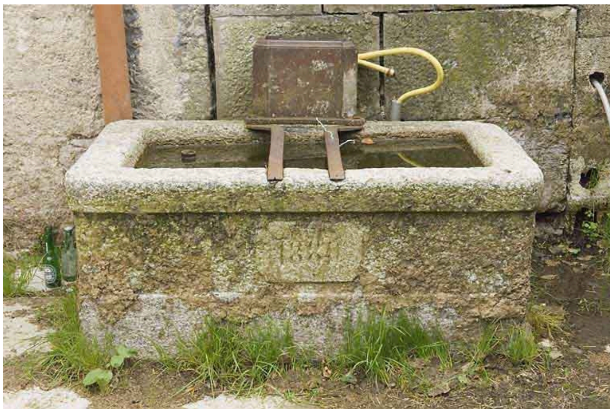
Fontaine en pierre, portant la date 1880.