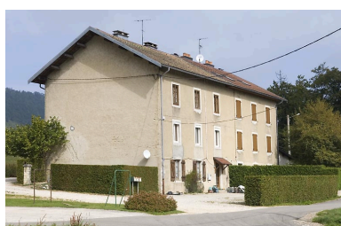
Immeuble de logements, au nord-ouest. IVR43_20082501108NUC2A