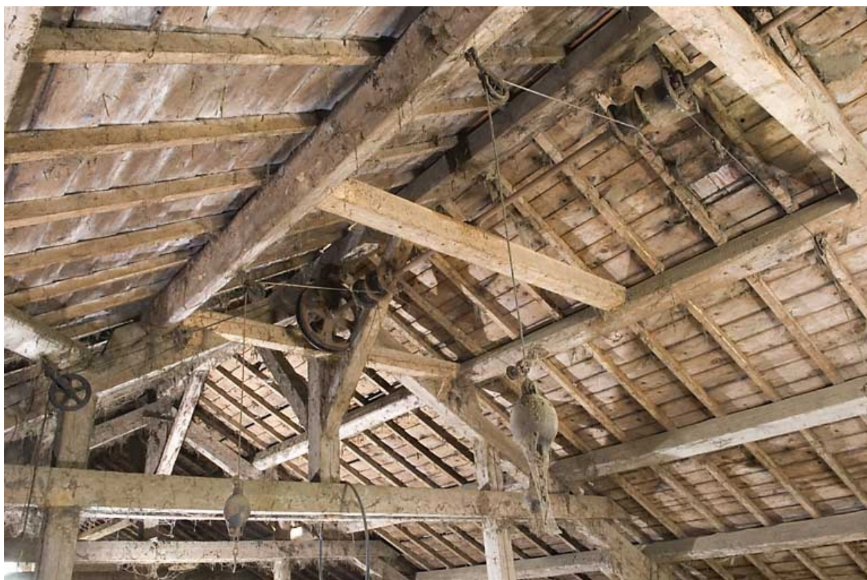
Grange haute : poulies et contrepois de la déchargeuse dans la charpente.