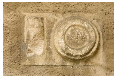
Habitation : façade antérieure, cartouche millésimé 1752.