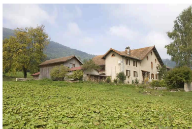
Vue d'ensemble, depuis le sud. IVR43_20082501106NUC2A