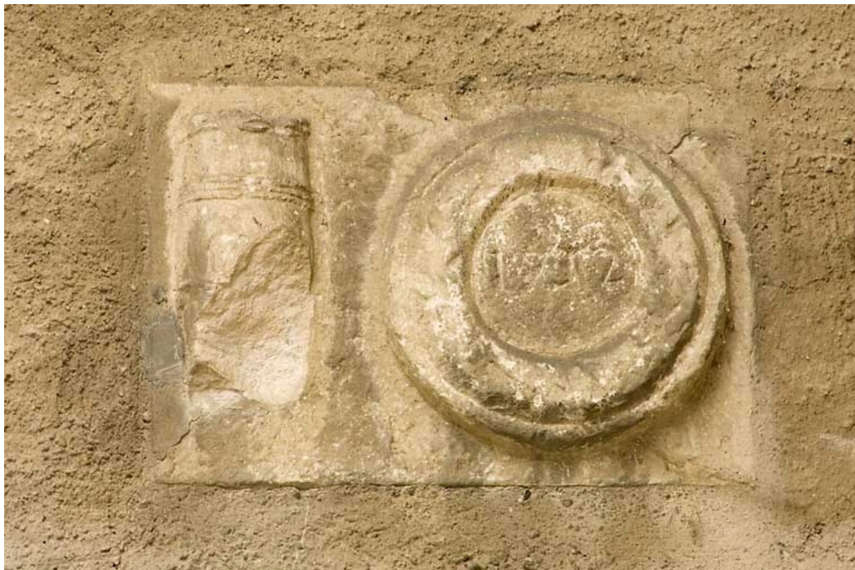
Habitation : façade antérieure, cartouche millésimé 1752.