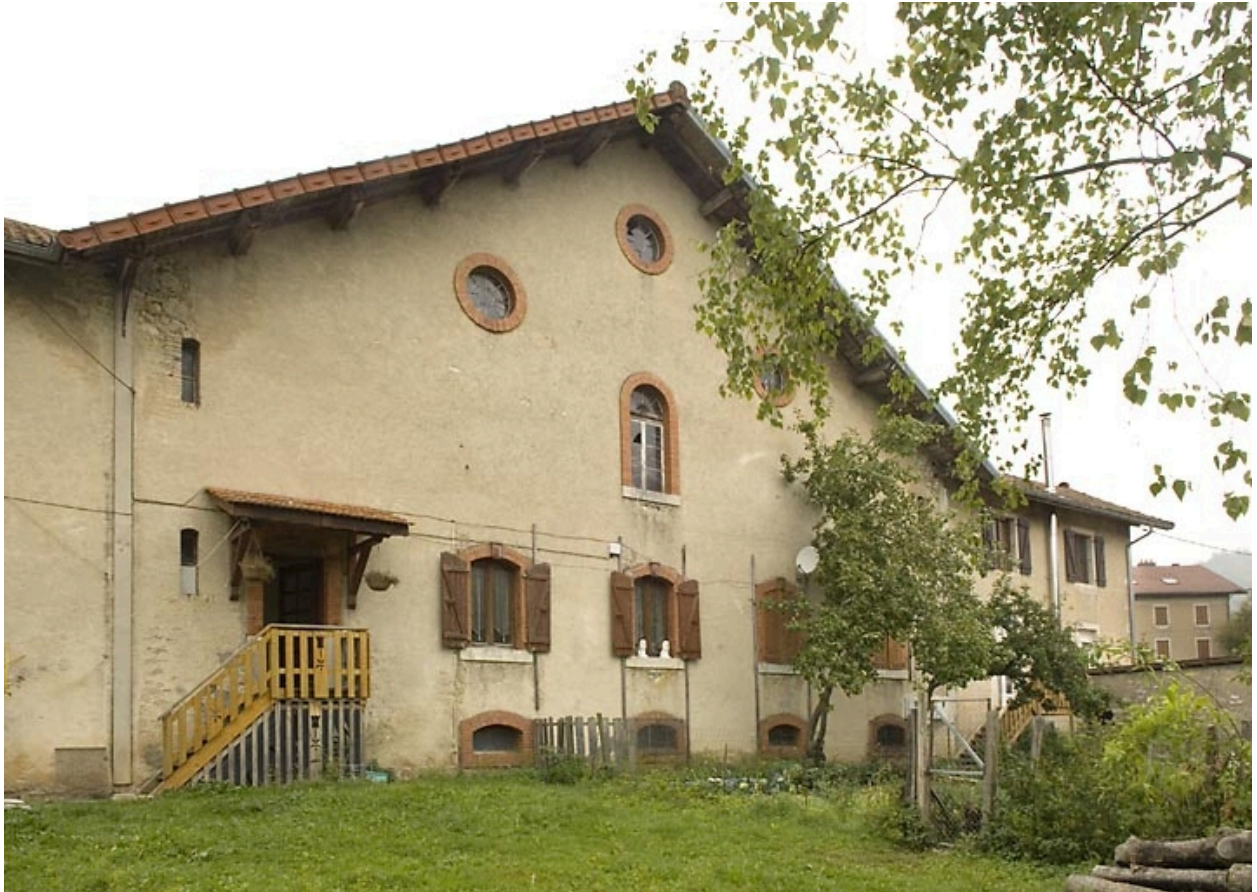
Habitation : partie centrale de la façade antérieure, de trois quarts gauche.