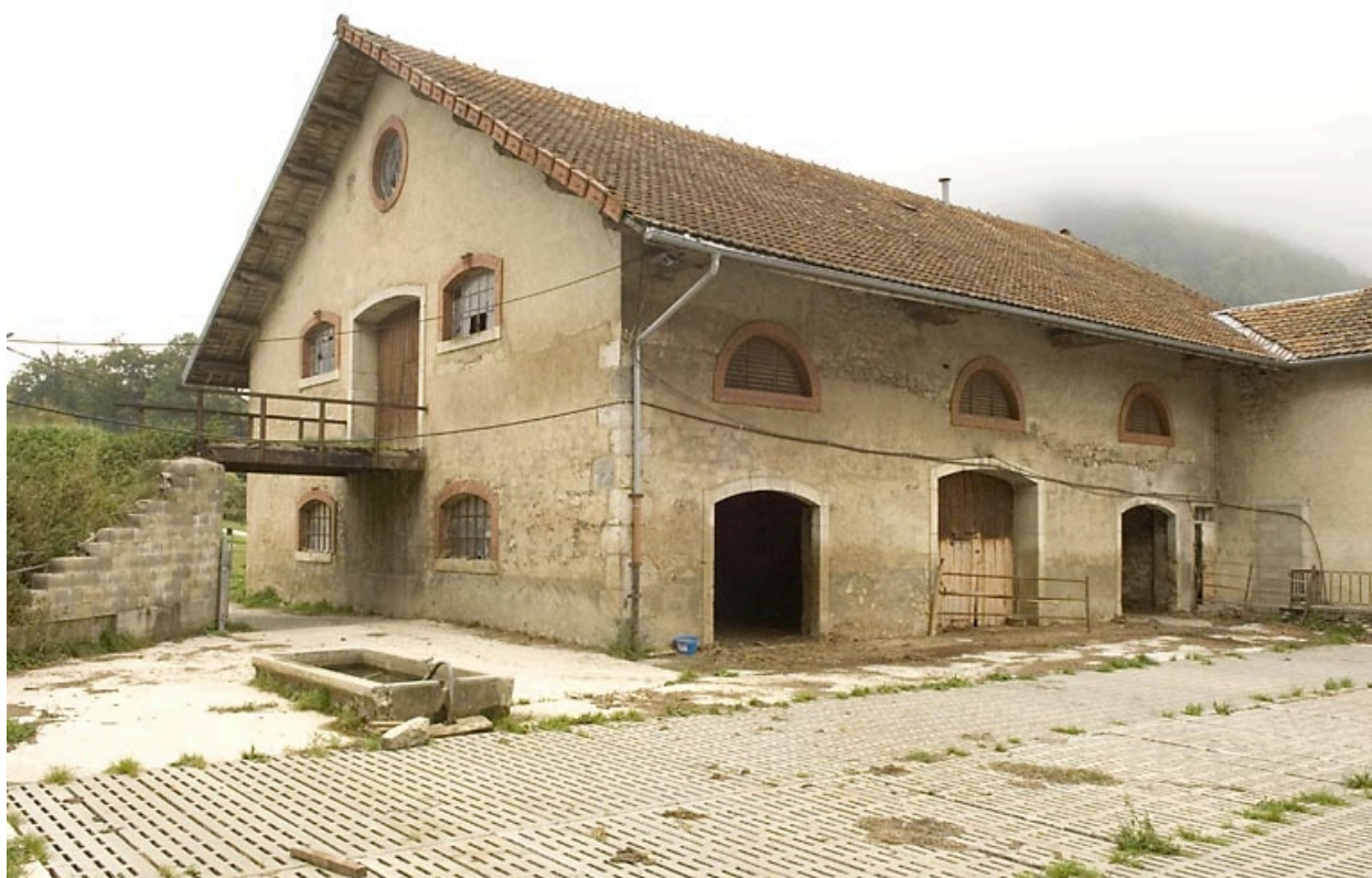
Etables et granges : façade latérale gauche, de trois quarts.