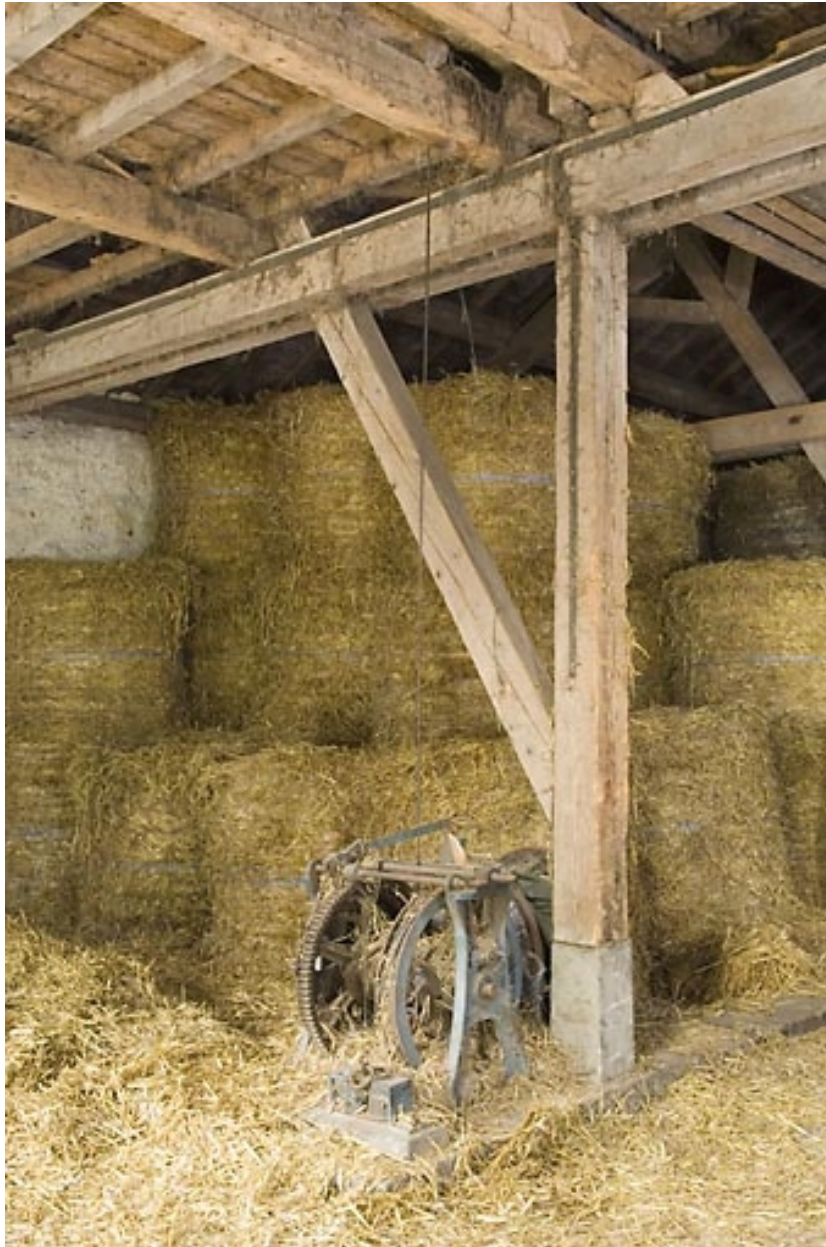
Grange haute : vue d'ensemble du treuil de la déchargeuse.