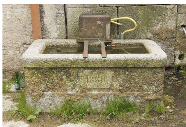
Fontaine en pierre, portant la date 1880.