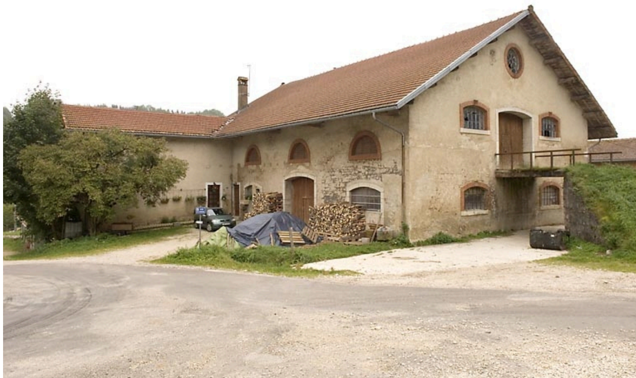
Etables et granges : façades postérieure et latérale droite.