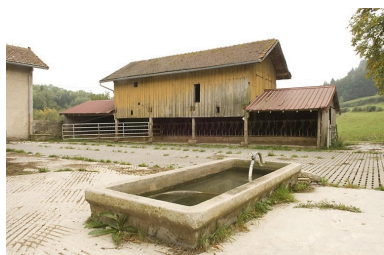
Etable (stabulation) et fontaine en béton. IVR43_20082501099NUC2A