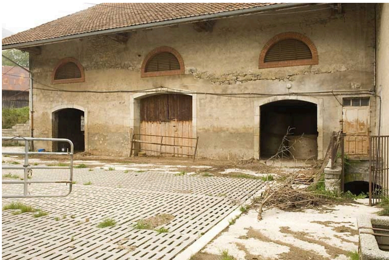
Etables et granges : façade latérale gauche.