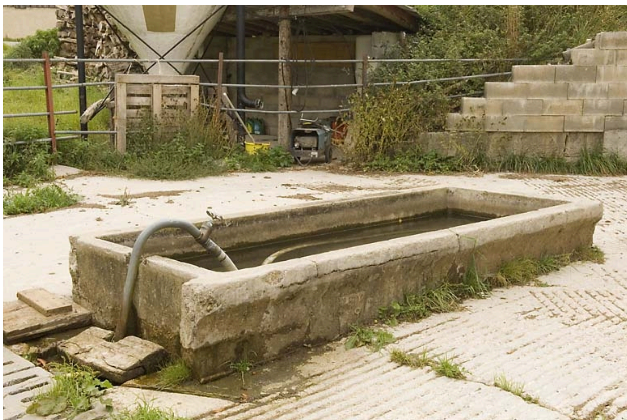
Fontaine en béton.