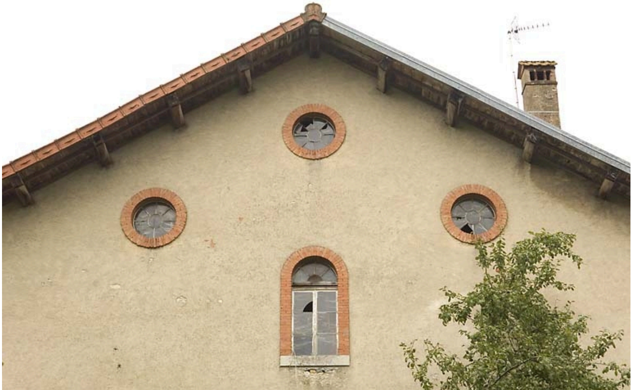
Habitation : oculi dans le pignon de la façade antérieure.