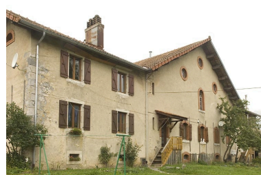
Habitation : façade antérieure, de trois quarts gauche. IVR43_20082501096NUC2A