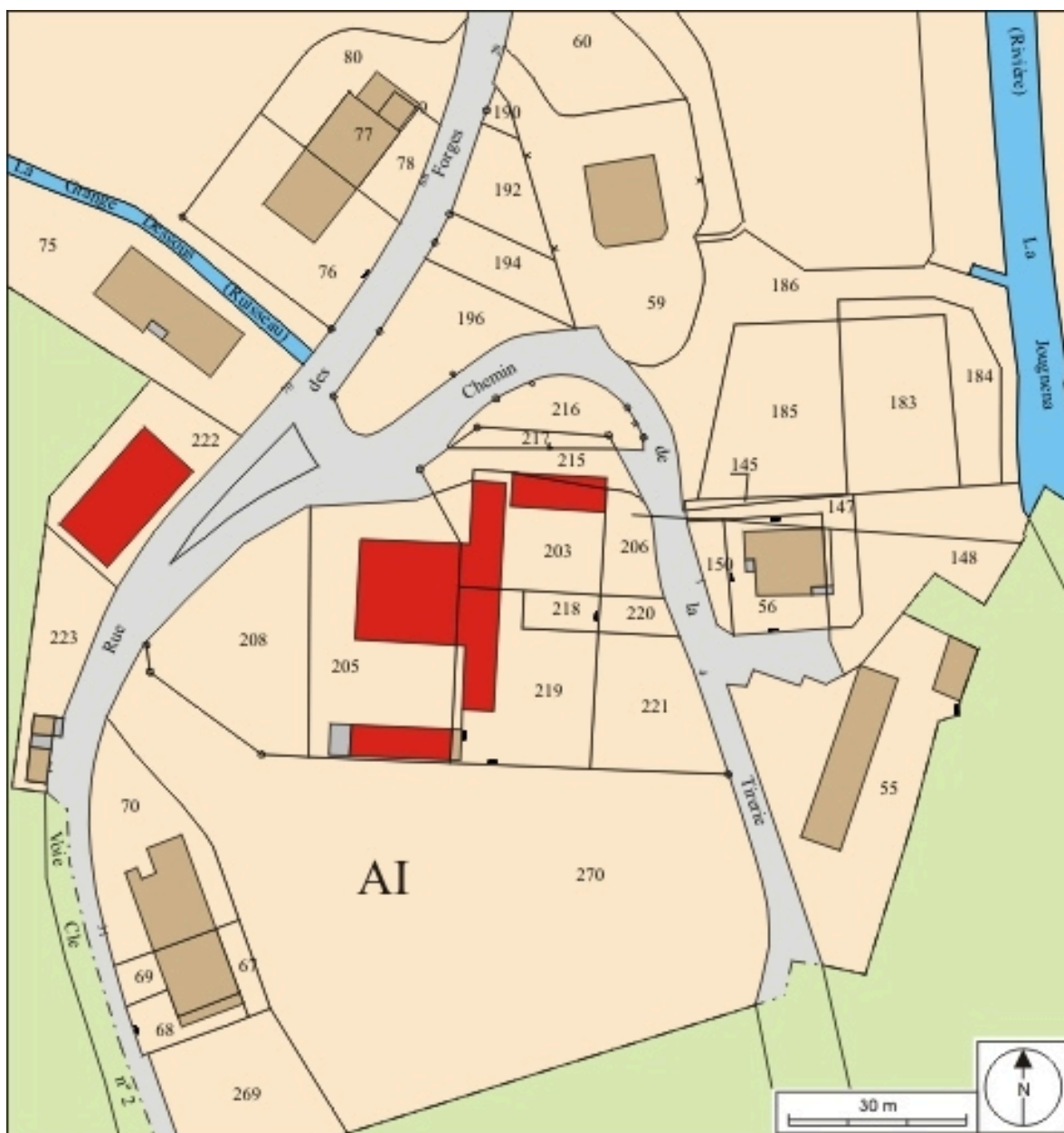
Plan-masse et de situation. Extrait du plan cadastral, 2008, section AI, échelle 1/1 000.