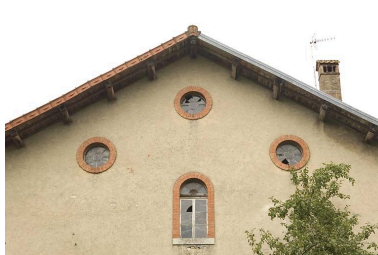
Habitation : oculi dans le pignon de la façade antérieure.