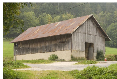
Troisième grange. IVR43_20082501098NUC2A