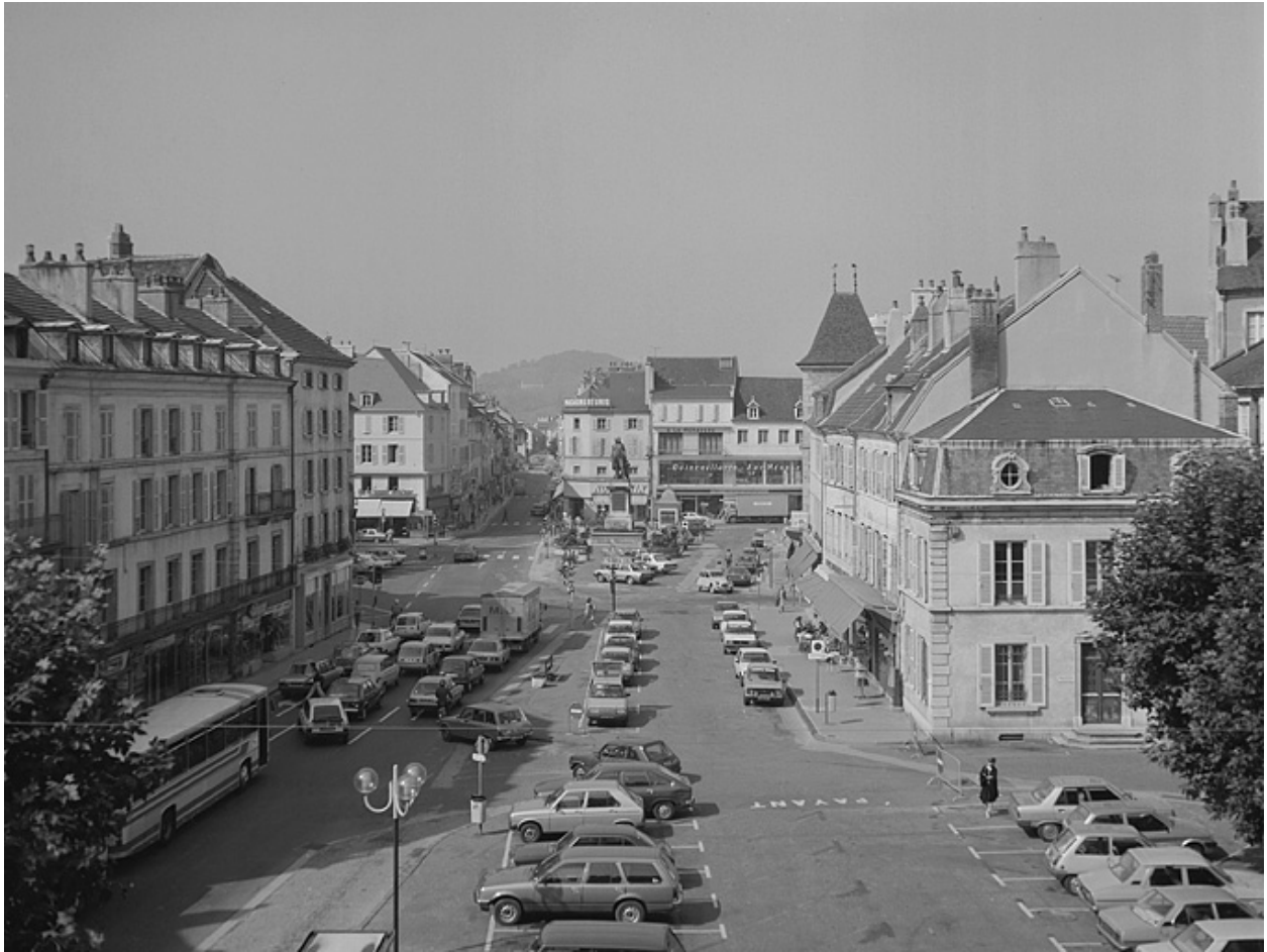
Vue générale depuis le théâtre.