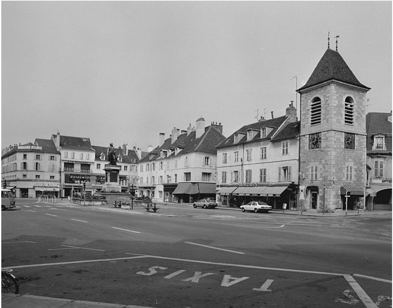
Côté pair entre la rue du Commerce et la rue Lecourbe.