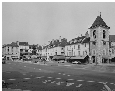
Côté pair entre la rue du Commerce et la rue Lecourbe. IVR43_19833900236X