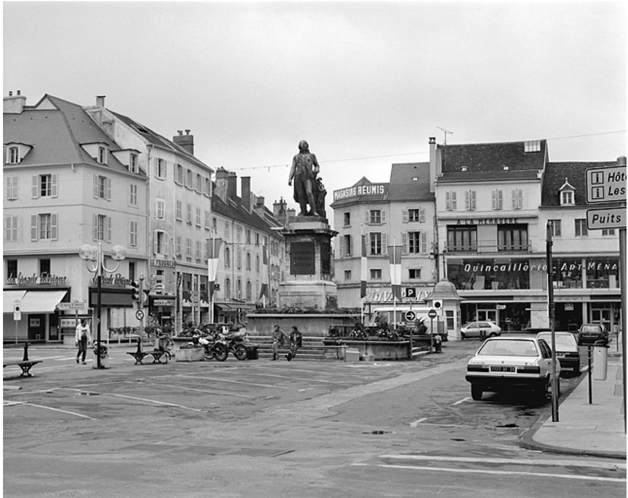
Monument à Lecourbe.