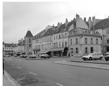
Côté pair entre la rue du Commerce et la rue de Ronde. IVR43_19833900235X