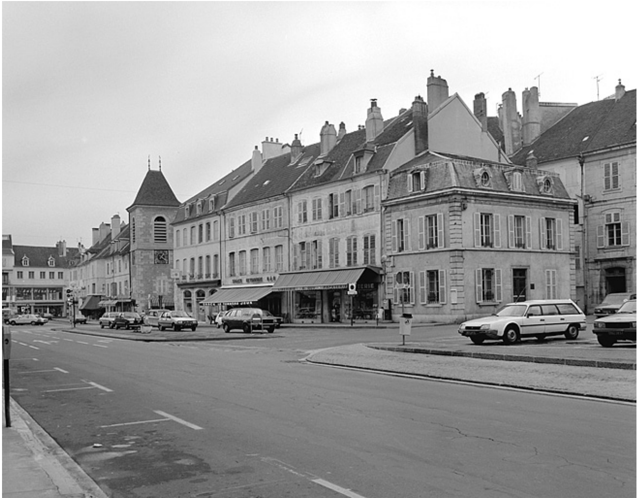
Côté pair entre la rue du Commerce et la rue de Ronde.