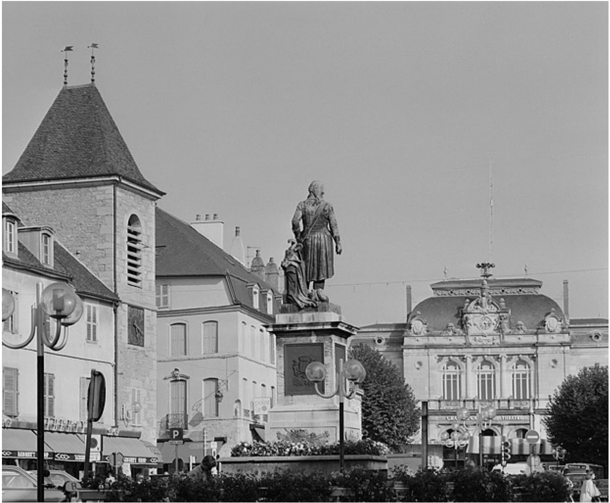
Revers du monument à Lecourbe.