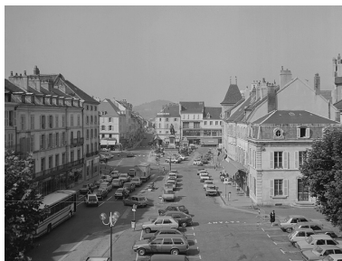
Vue générale depuis le théâtre.