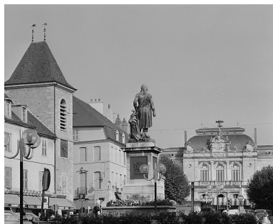
Revers du monument à Lecourbe. IVR43_19853900334X