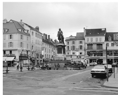
Monument à Lecourbe.