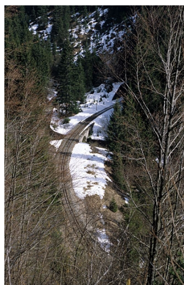
Vue d'ensemble plongeante, depuis le sud-ouest (côté Andelot-en-Montagne). IVR43_20053900380ZA