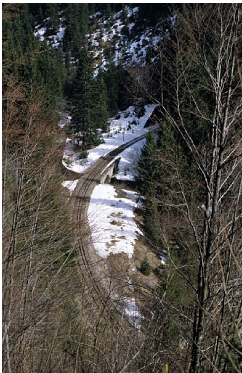
Vue d'ensemble plongeante, depuis le sud-ouest (côté Andelot-en-Montagne).