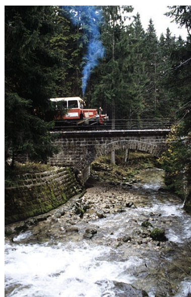
Élévation nord (amont), avec draineuse.