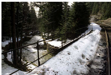
Garde-corps sud (aval) et ruisseau de l'Evalude canalisé. IVR43_20053900376ZA