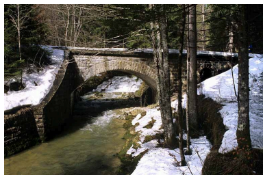
Elévation sud (aval).