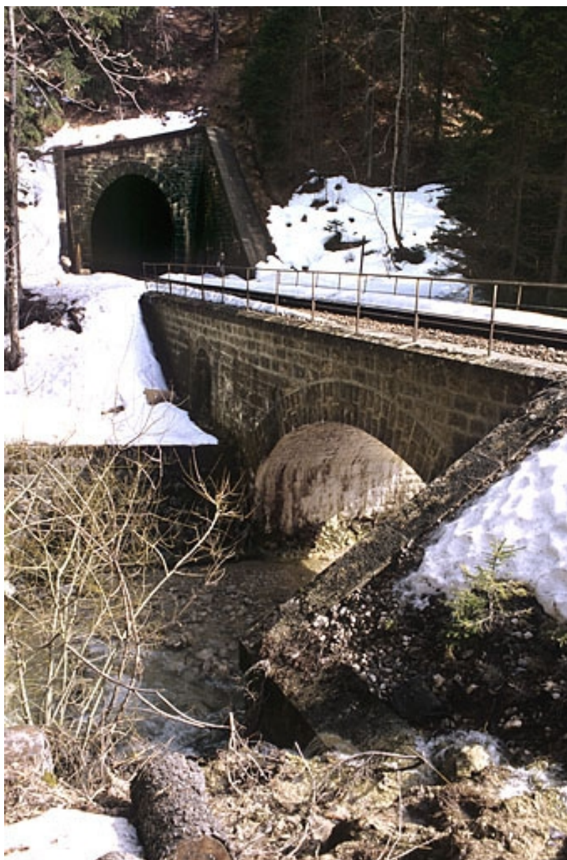
Vue d'ensemble, depuis le nord-ouest (amont).