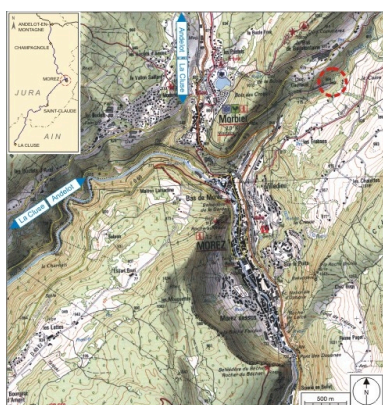
Carte et schéma de localisation. Carte topographique, IGN, 2000, dalles F087_050 et F088_050, échelle 1:25 000. Scan 25, licence n° 2008/CISE/2968. IVR43_20073900452NUDA