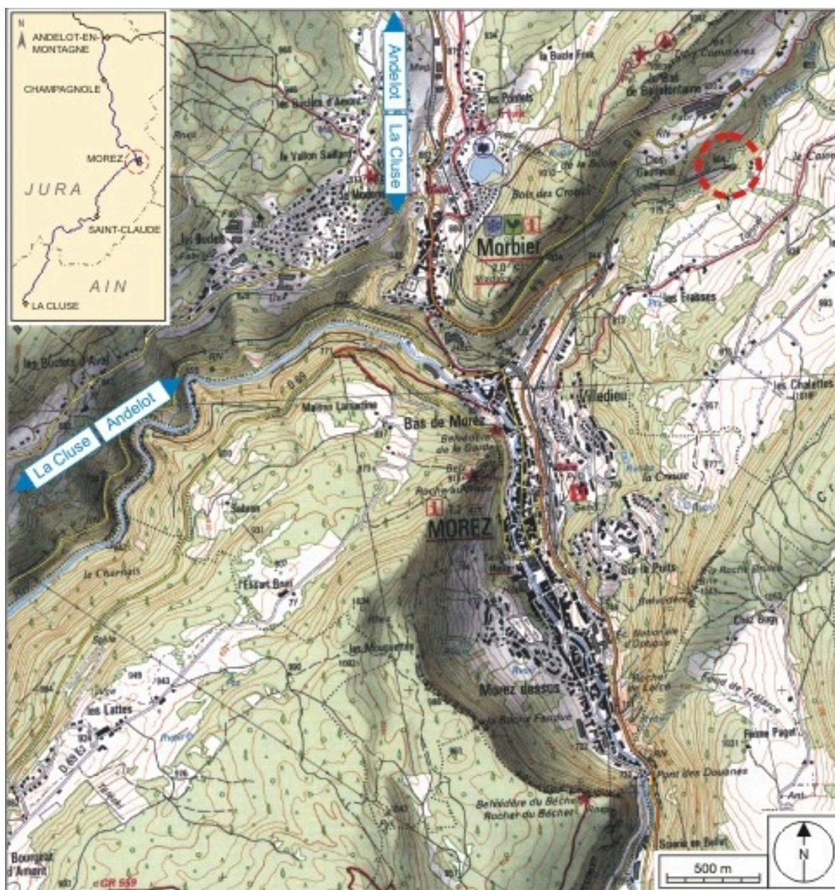
Carte et schéma de localisation. Carte topographique, IGN, 2000, dalles F087_050 et F088_050, échelle 1:25 000. Scan 25, licence n° 2008/CISE/2968.