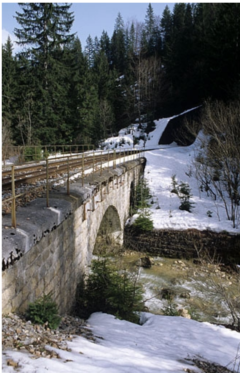
Vue d'ensemble, depuis le sud-ouest (aval).