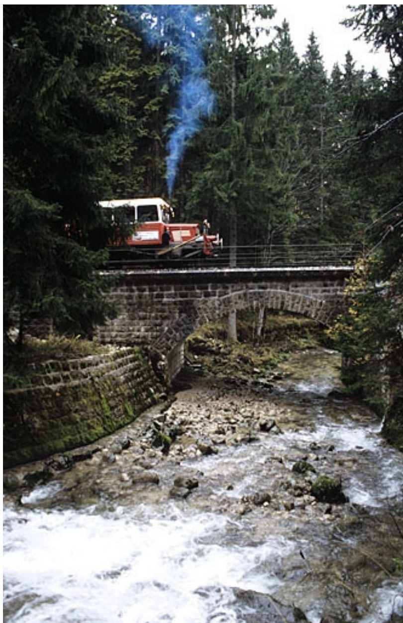
Elévation nord (amont), avec draine.