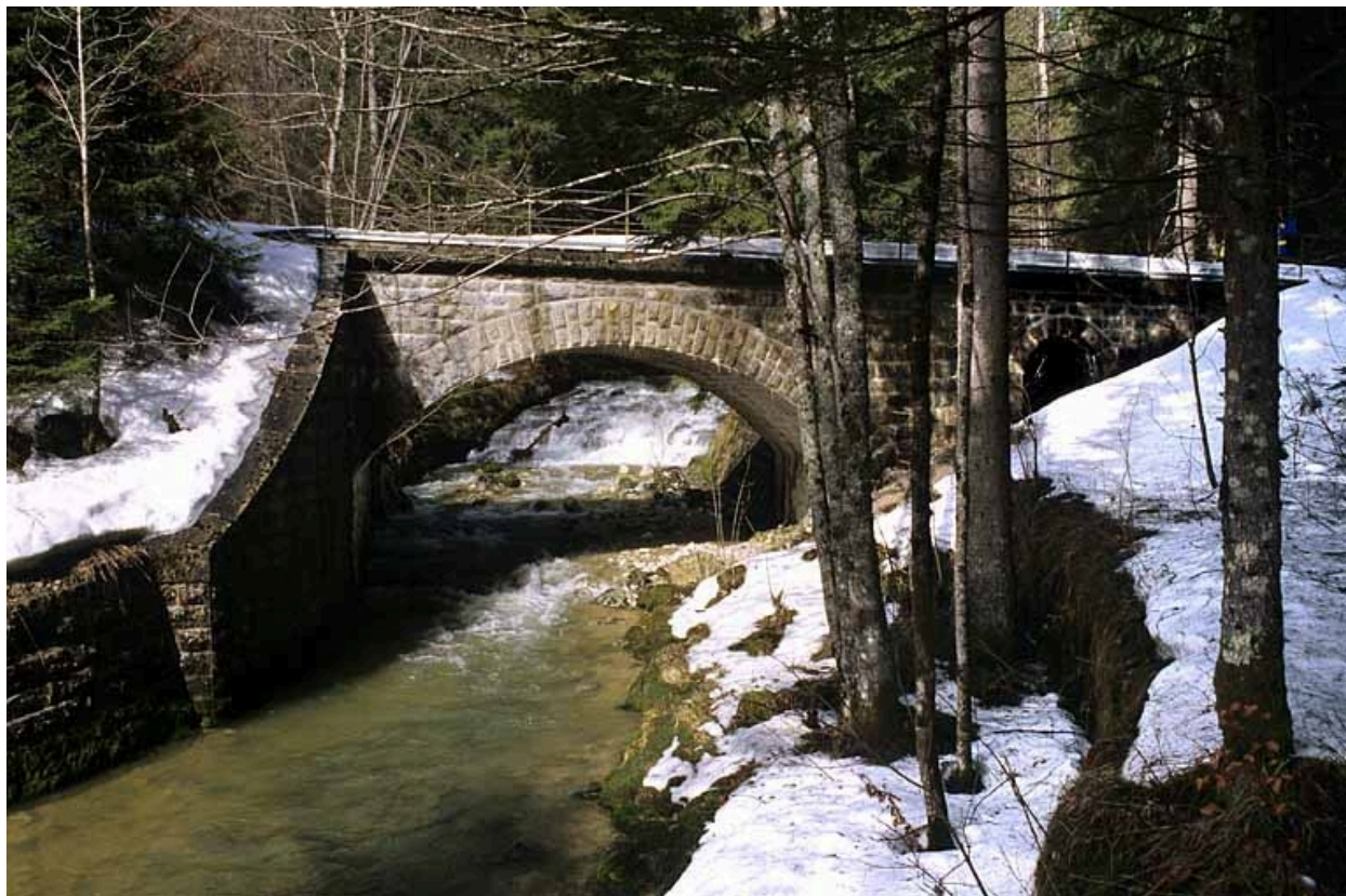
Elévation sud (aval).