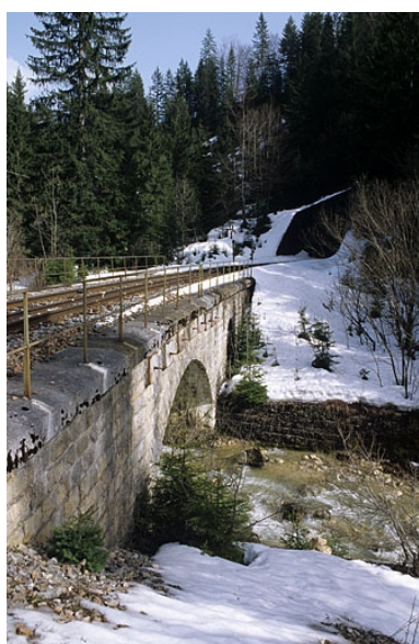
Vue d'ensemble, depuis le sud-ouest (aval).