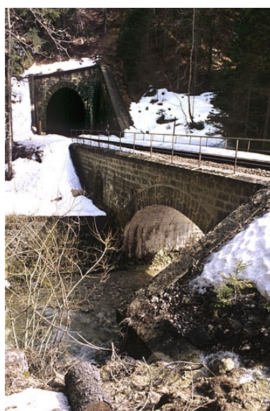
Vue d'ensemble, depuis le nord-ouest (amont).