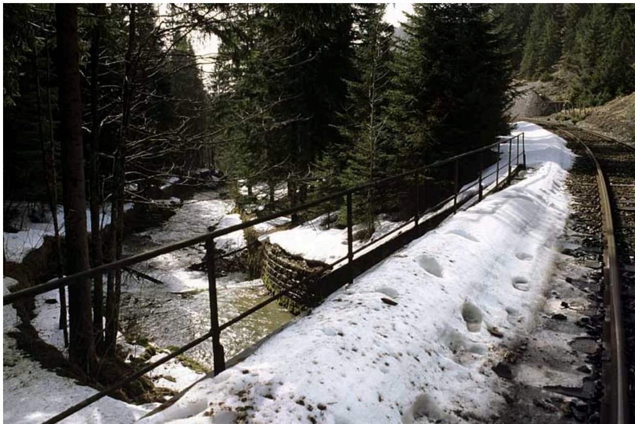
Garde-corps sud (aval) et ruisseau de l'Evalude canalisé.