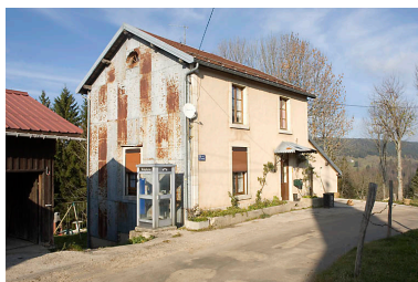
Vue générale. IVR43_20082501046NUC2A