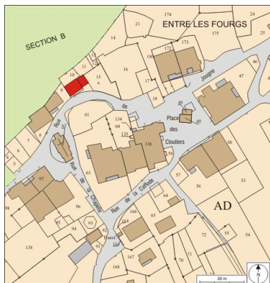
Plan-masse et de situation. Extrait du plan cadastral, 2008, section AD, échelle 1:1 000. IVR43_20102501483NUDA