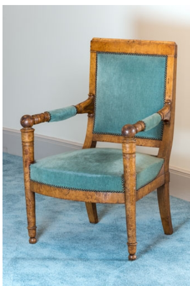
Fauteuil rembourré à dossier plat garni. IVR26_20222100576NUC4A