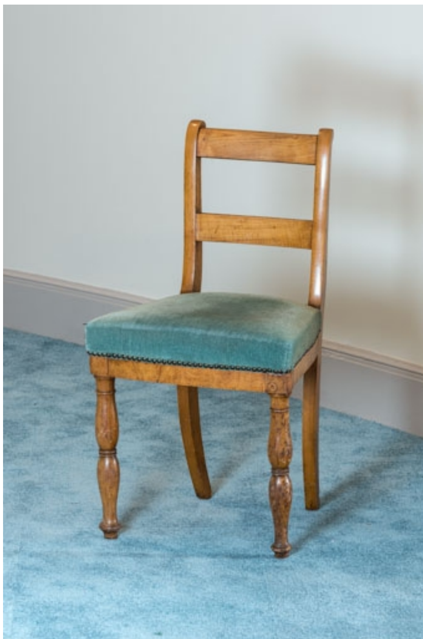
Chaise rembourrée à dossier plat à barreau.