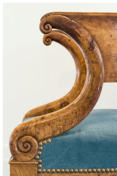
Fauteuil rembourré à dossier concave en bois : supports d'accotoir, vus de profil. IVR26_20222100665NUC4A