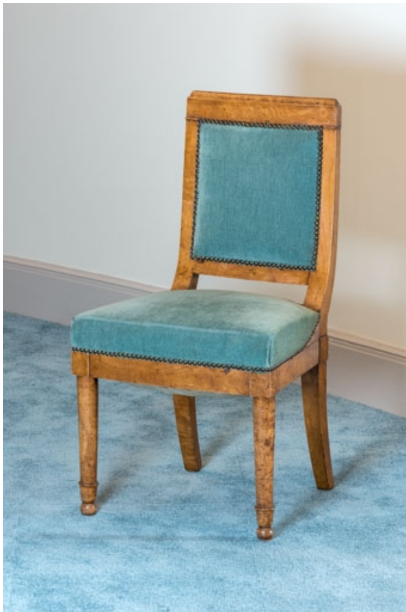
Chaise rembourrée à dossier plat garni.