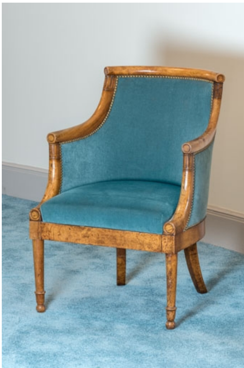
Fauteuil rembourré à dossier concave garni.