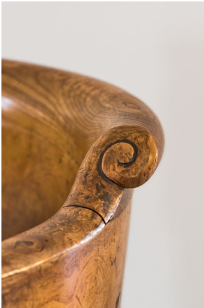
Fauteuil rembourré à dossier concave en bois : décor de la traverse supérieure.