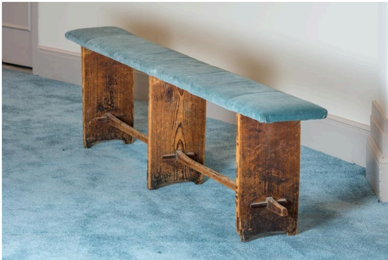
Banc rembourré rustique.