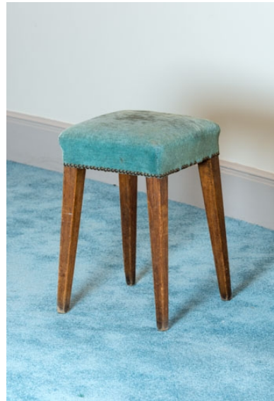
Tabouret rembourré rustique. IVR26_20222100583NUC4A