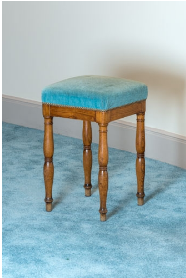
Tabouret rembourré. IVR26_20222100582NUC4A