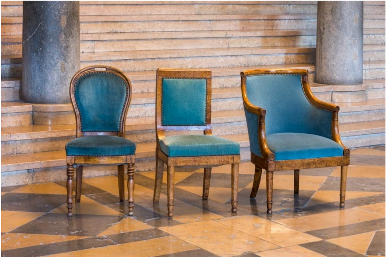
Trois sièges rembourrés à dossier garni : deux chaises (une à dossier concave ovale et une à dossier plat) et un fauteuil (à dossier concave).