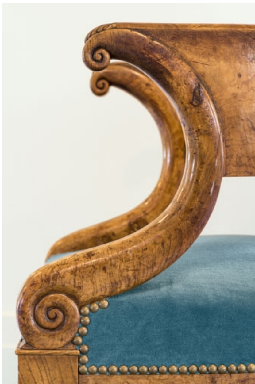
Fauteuil rembourré à dossier concave en bois : supports d'accotoir, vus de profil.