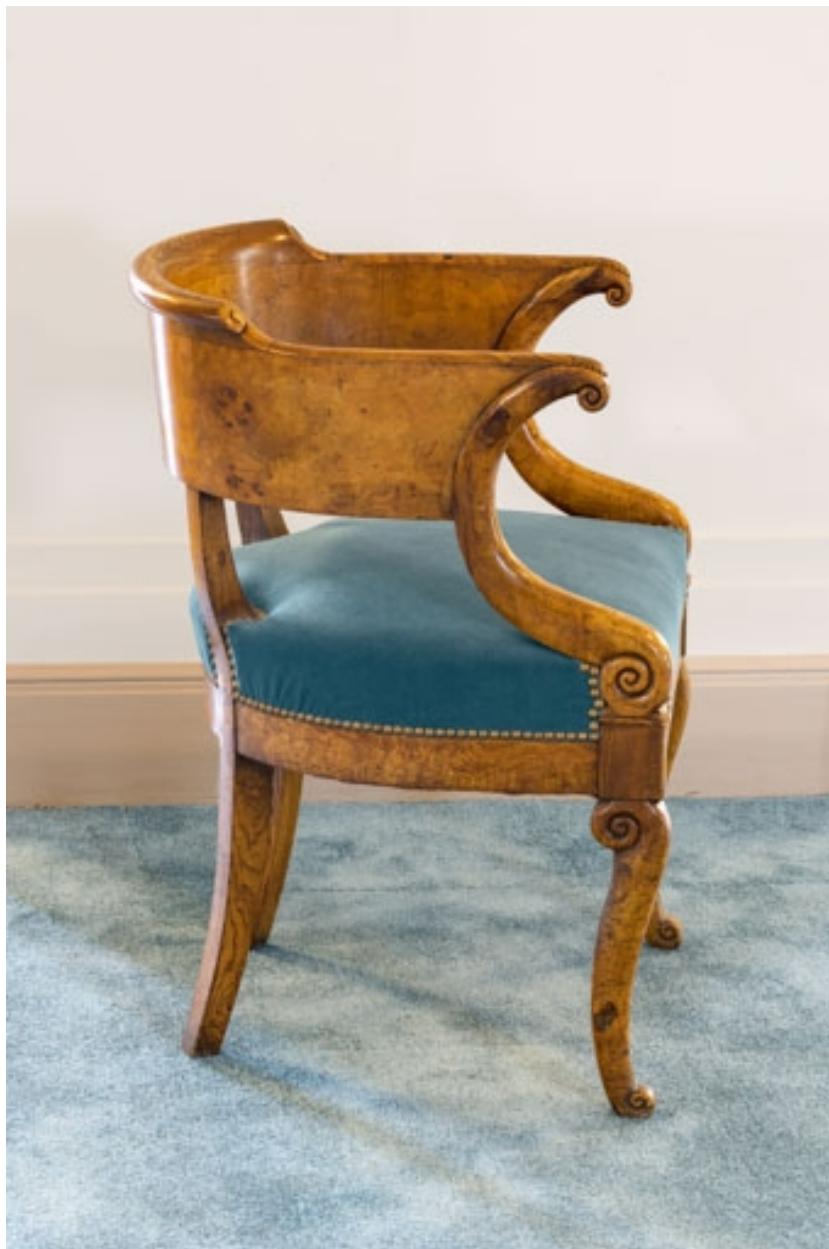
Fauteuil rembourré à dossier concave en bois, vu de profil.