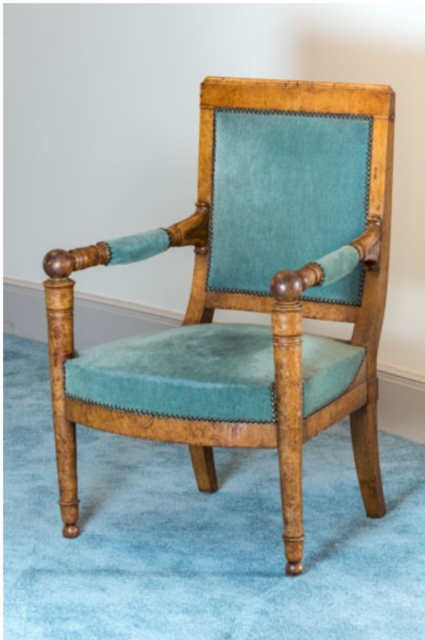
Fauteuil rembourré à dossier plat garni.