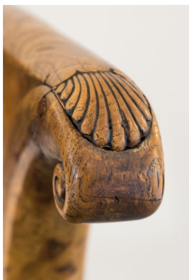
Fauteuil rembourré à dossier concave en bois : décor de l'accotoir. IVR26_20222100664NUC4A