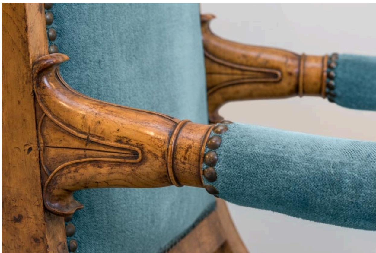
Fauteuil rembourré à dossier plat garni : décor des accotoirs.