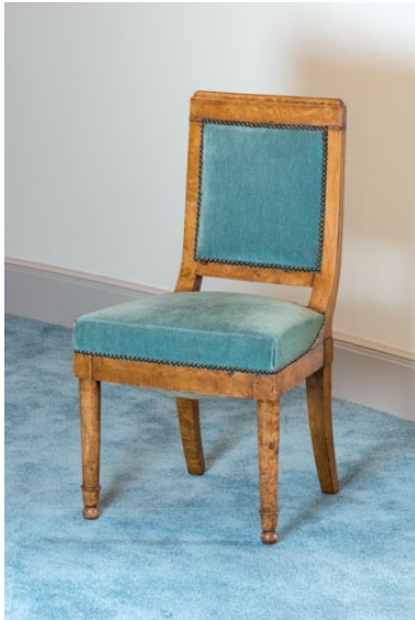
Chaise rembourrée à dossier plat garni. IVR26_20222100577NUC4A