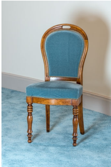
Chaise rembourrée à dossier plat garni ovale.