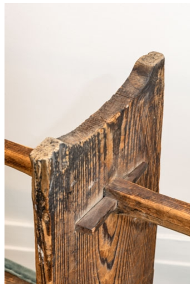
Banc rembourré rustique : détail de l'assemblage de la traverse inférieure. IVR26_20222100595NUC4A

IVR26_20222100584NUC4A