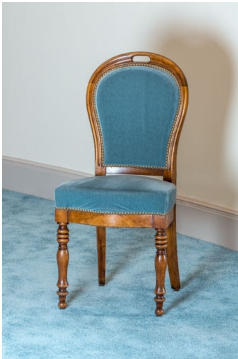
Chaise rembourrée à dossier plat garni ovale.