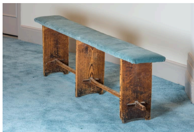
Banc rembourré rustique.

IVR26_20222100585NUC4A