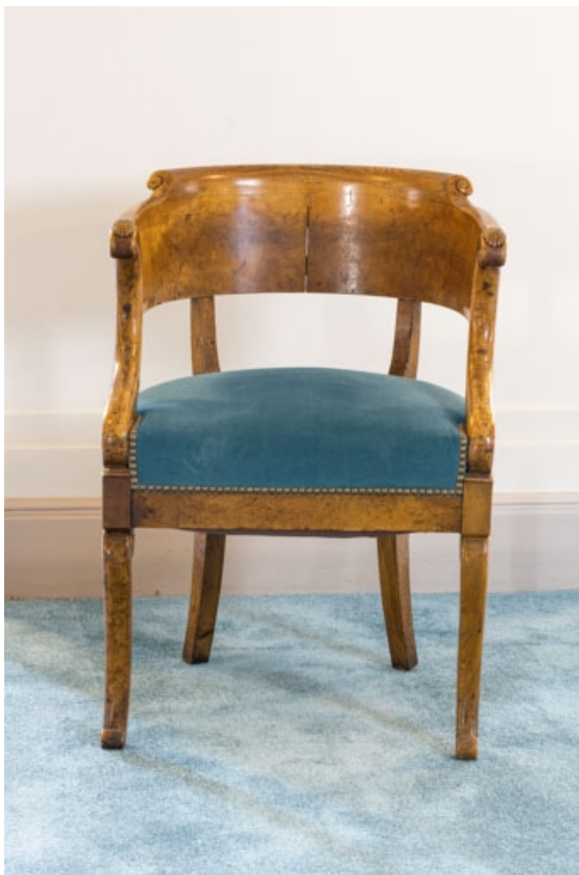
Fauteuil rembourré à dossier concave en bois (loge du préfet).