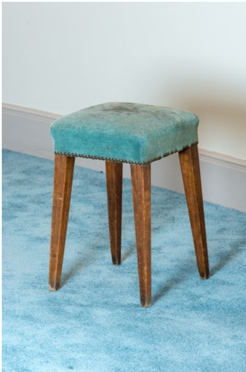
Tabouret rembourré rustique.