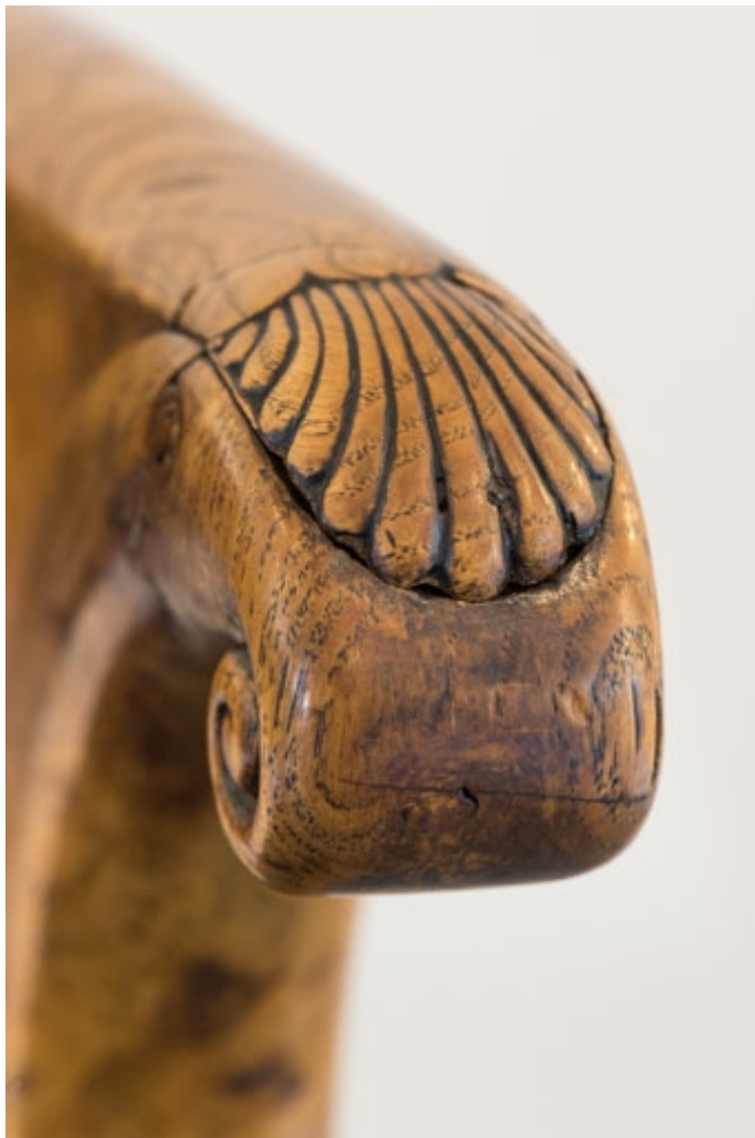
Fauteuil rembourré à dossier concave en bois : décor de l'accotoir.