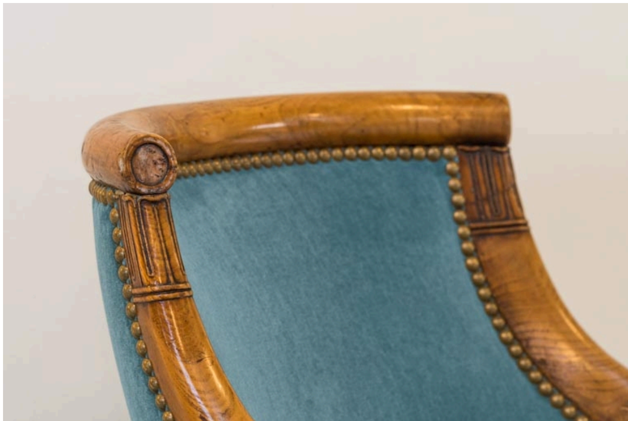
Fauteuil rembourré à dossier concave garni : décor de la traverse supérieure et des accotoirs.