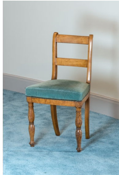
Chaise rembourrée à dossier plat à barreau.