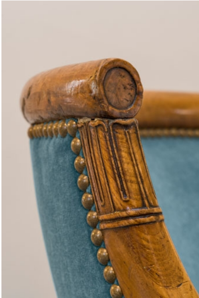
Fauteuil rembourré à dossier concave garni : décor de la traverse supérieure et d'un accotoir.