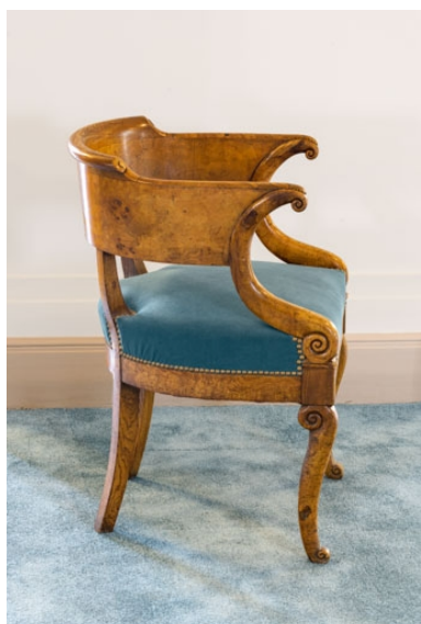
Fauteuil rembourré à dossier concave en bois, vu de profil. IVR26_20222100663NUC4A