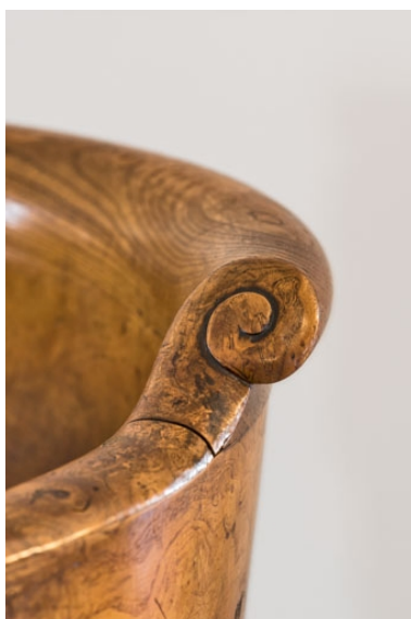
Fauteuil rembourré à dossier concave en bois : décor de la traverse supérieure. IVR26_20222100666NUC4A