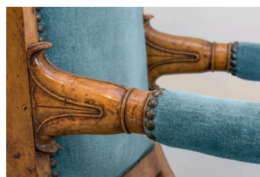
Fauteuil rembourré à dossier plat garni : décor des accotoirs. IVR26_20222100593NUC4A