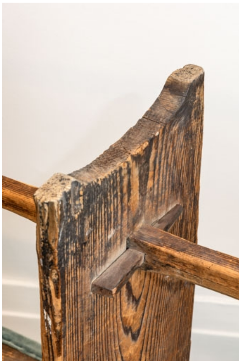
Banc rembourré rustique : détail de l'assemblage de la traverse inférieure.