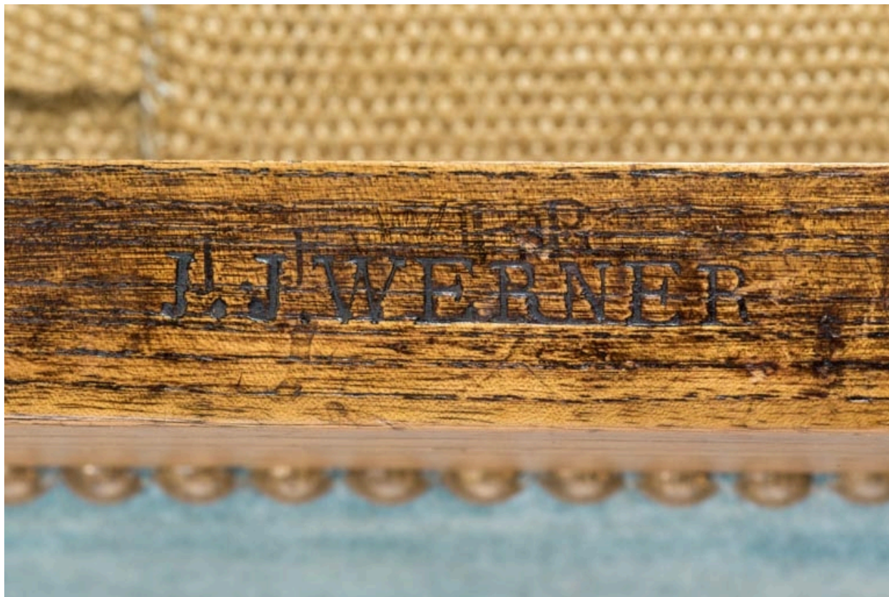
Tabouret rembourré : marque du fabricant J.-J. Werner.