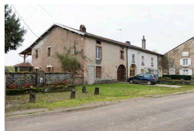
Alignement de fermes, Grande rue.