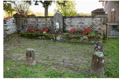
Fontaine-abreuvoir, Grande rue.