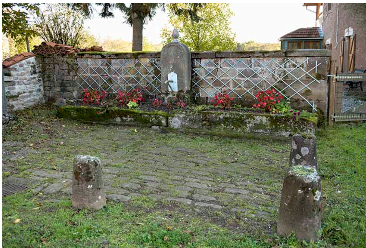
Fontaine-abreuvoir, Grande rue.