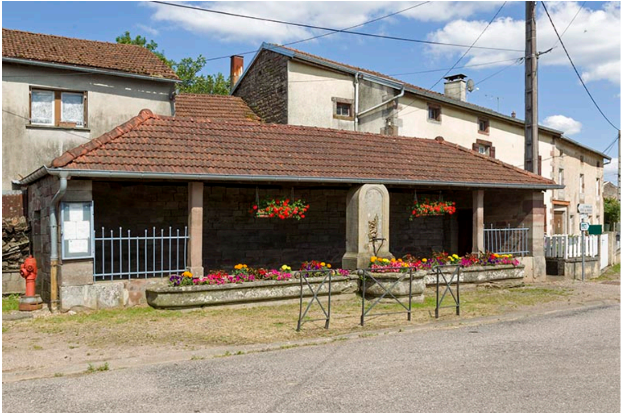
Fontaine-lavoir au centre du village.