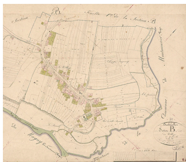
Plan du village extrait du plan cadastral 1834.