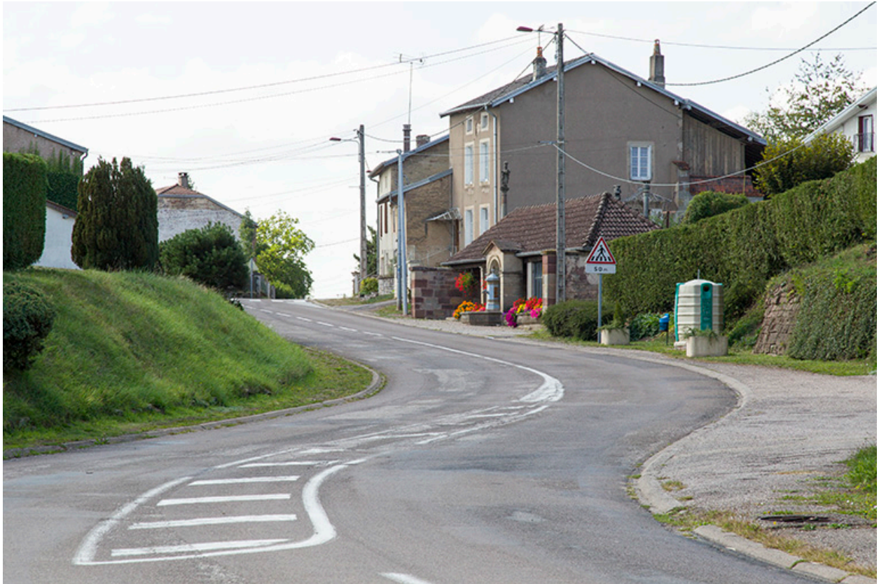
Vue générale de la Grande rue.