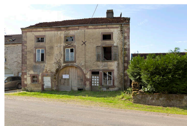
ferme, Grande rue.