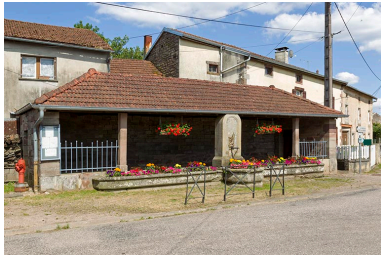
Fontaine-lavoir au centre du village.