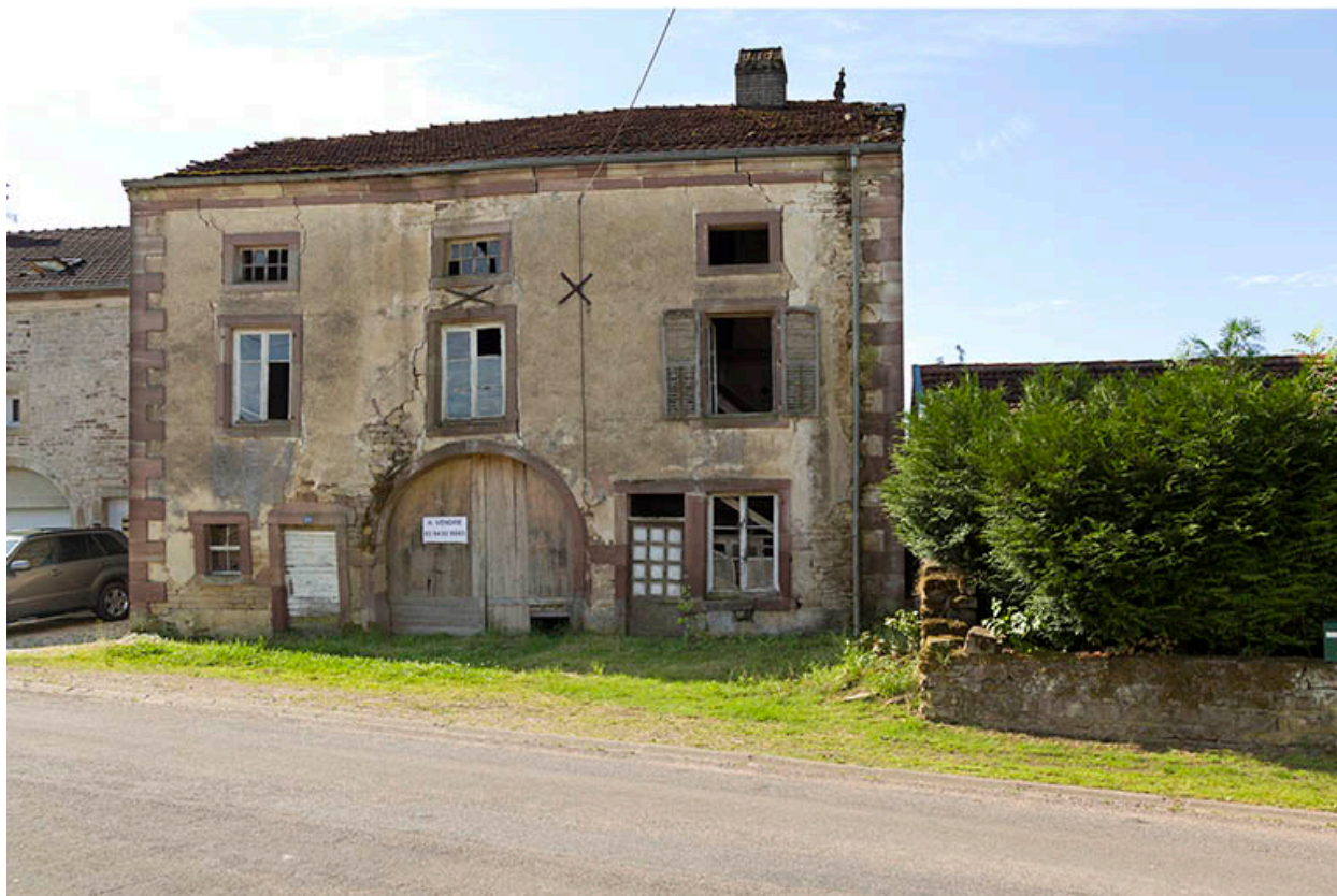
ferme, Grande rue.