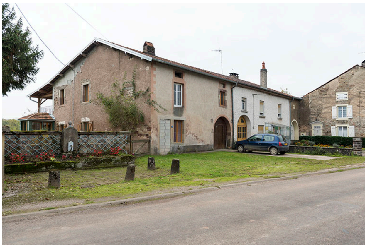
Alignement de fermes, Grande rue.