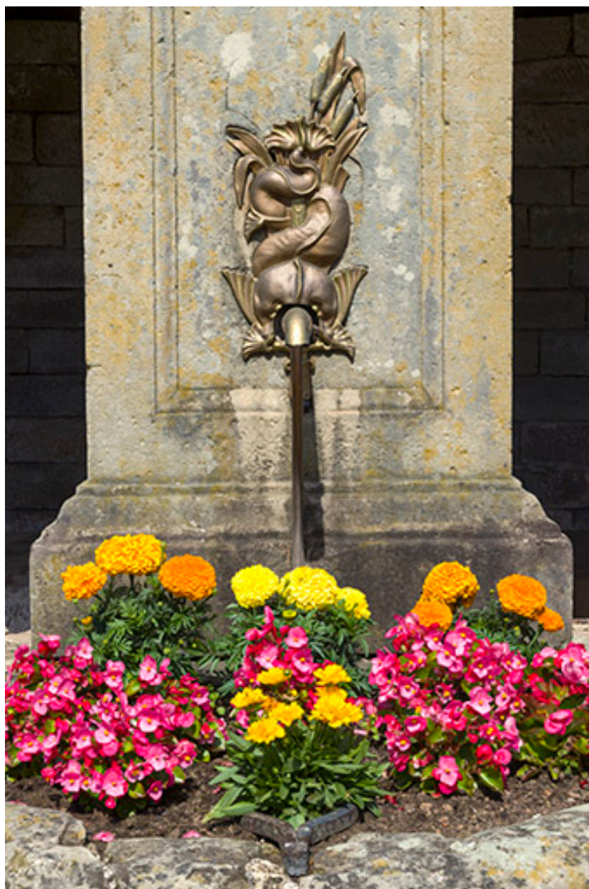
Détail d'une fontaine.