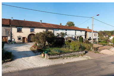
Alignement de fermes, Grande rue.