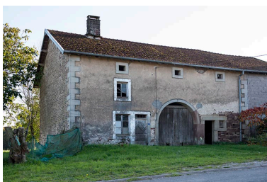
Ferme à trois travées.