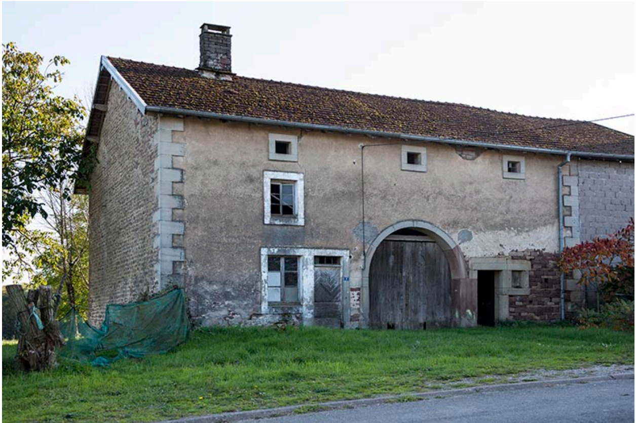
Ferme à trois travées.