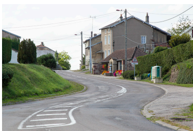
Vue générale de la Grande rue.