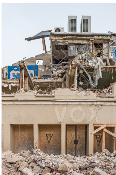
Cinéma Vox (14 rue Victor Guichard) en cours de démolition : entrée (22 mars 2023). IVR26_20238900267NUC4A