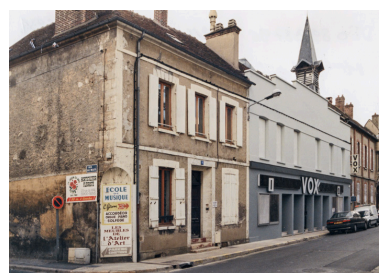
[Façade antérieure du Vox, de trois quarts gauche]. 1996. IVR26_20238900272NUC4A