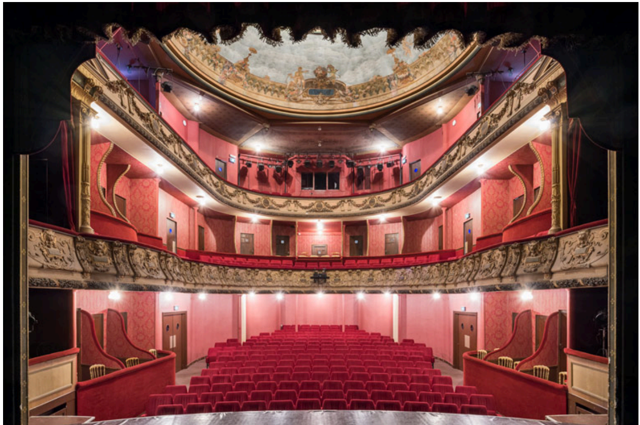
Théâtre municipal : la salle.