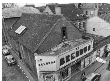
Cinéma le Brennus [vue plongeante]. S.d. [1977]. IVR26_20238900276NUC4A