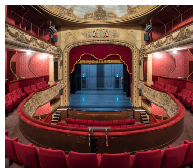
Théâtre municipal : la scène. IVR26_20238900134NUC4A