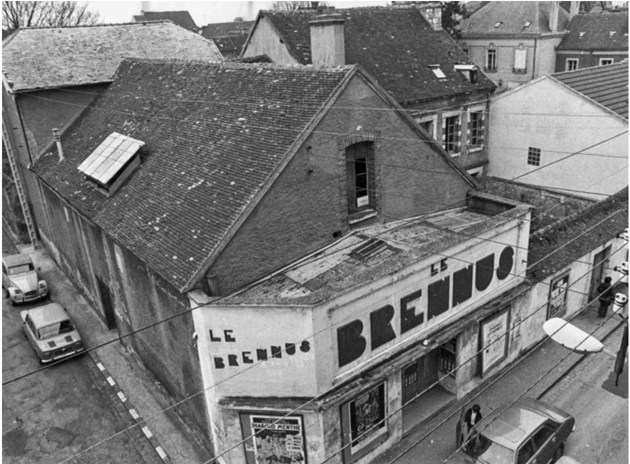
Cinéma le Brennus [vue plongeante]. S.d. [1977].