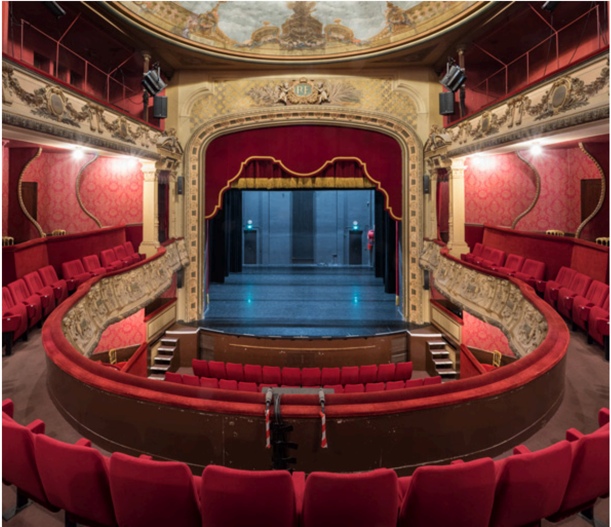
Théâtre municipal : la scène.