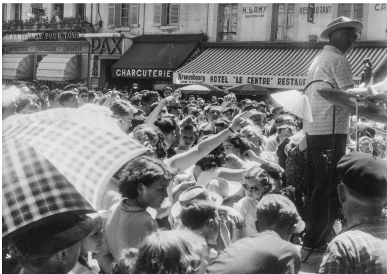
Sens braderie 60 (Place de la République) [montrant l'entrée du Pax]. 1960.