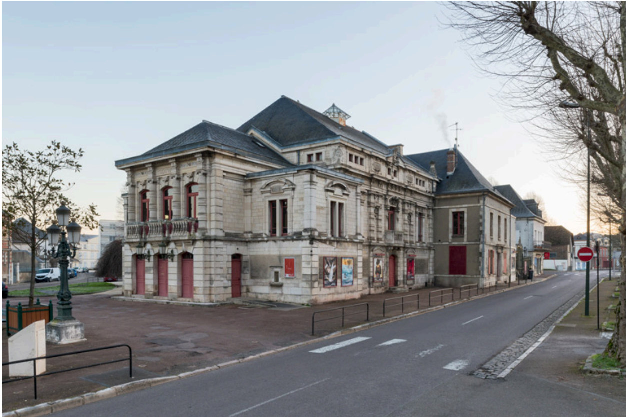
Théâtre municipal (1-2 boulevard des Garibaldi).