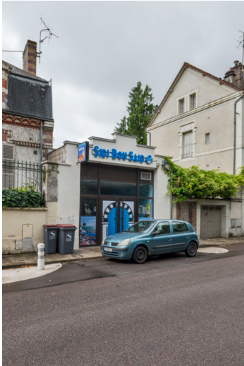
Cinéma Variétés (12 boulevard du Mail).