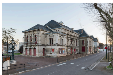
Théâtre municipal (1-2 boulevard des Garibaldi). IVR26_20238900189NUC4A