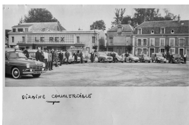
Dizaine commerciale. Les véhicules de la "Caravane" [devant le Rex]. 14 juin 1960.