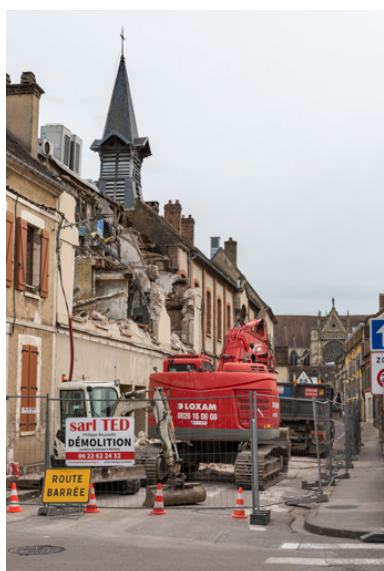
Cinéma Vox (14 rue Victor Guichard) en cours de démolition (22 mars 2023). IVR26_20238900266NUC4A