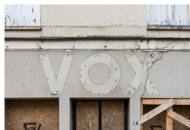
Traces de l'enseigne du Vox (février 2023).