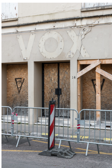
Entrée du Vox, de trois quarts droite (février 2023).