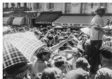
Sens braderie 60 (Place de la République) [montrant l'entrée du Pax]. 1960. Autr. auteur inconnu IVR26_20238900274NUC4A