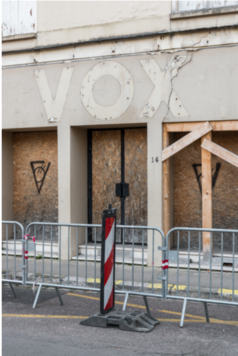
Entrée du Vox, de trois quarts droite (février 2023).