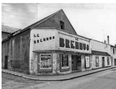
Cinéma le Brennus [de trois quarts gauche]. S.d. [1977]. IVR26_20238900275NUC4A