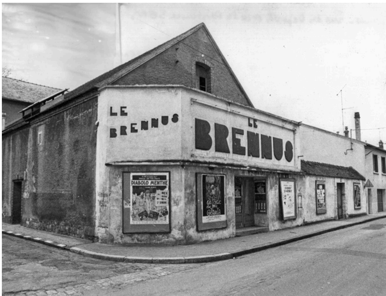
Cinéma le Brennus [de trois quarts gauche]. S.d. [1977].