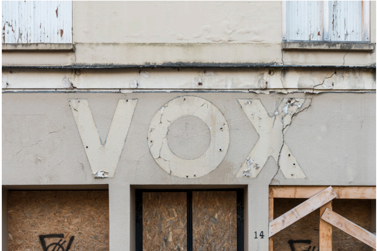
Traces de l'enseigne du Vox (février 2023).