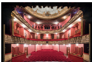
Théâtre municipal : la salle. IVR26_20238900114NUC4A