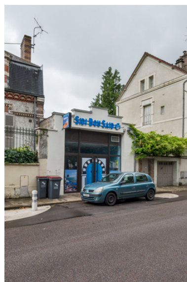
Cinéma Variétés (12 boulevard du Mail). IVR26_20238900600NUC4A