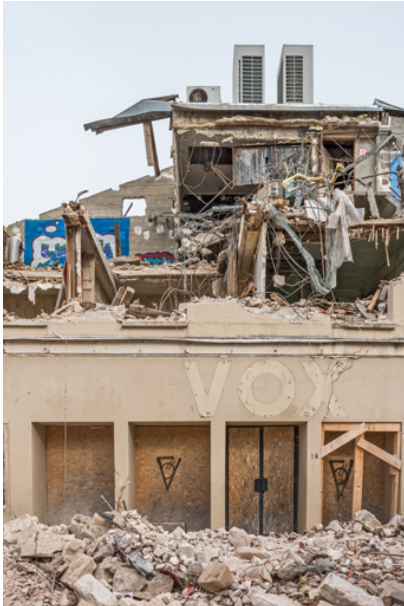
Cinéma Vox (14 rue Victor Guichard) en cours de démolition : entrée (22 mars 2023).