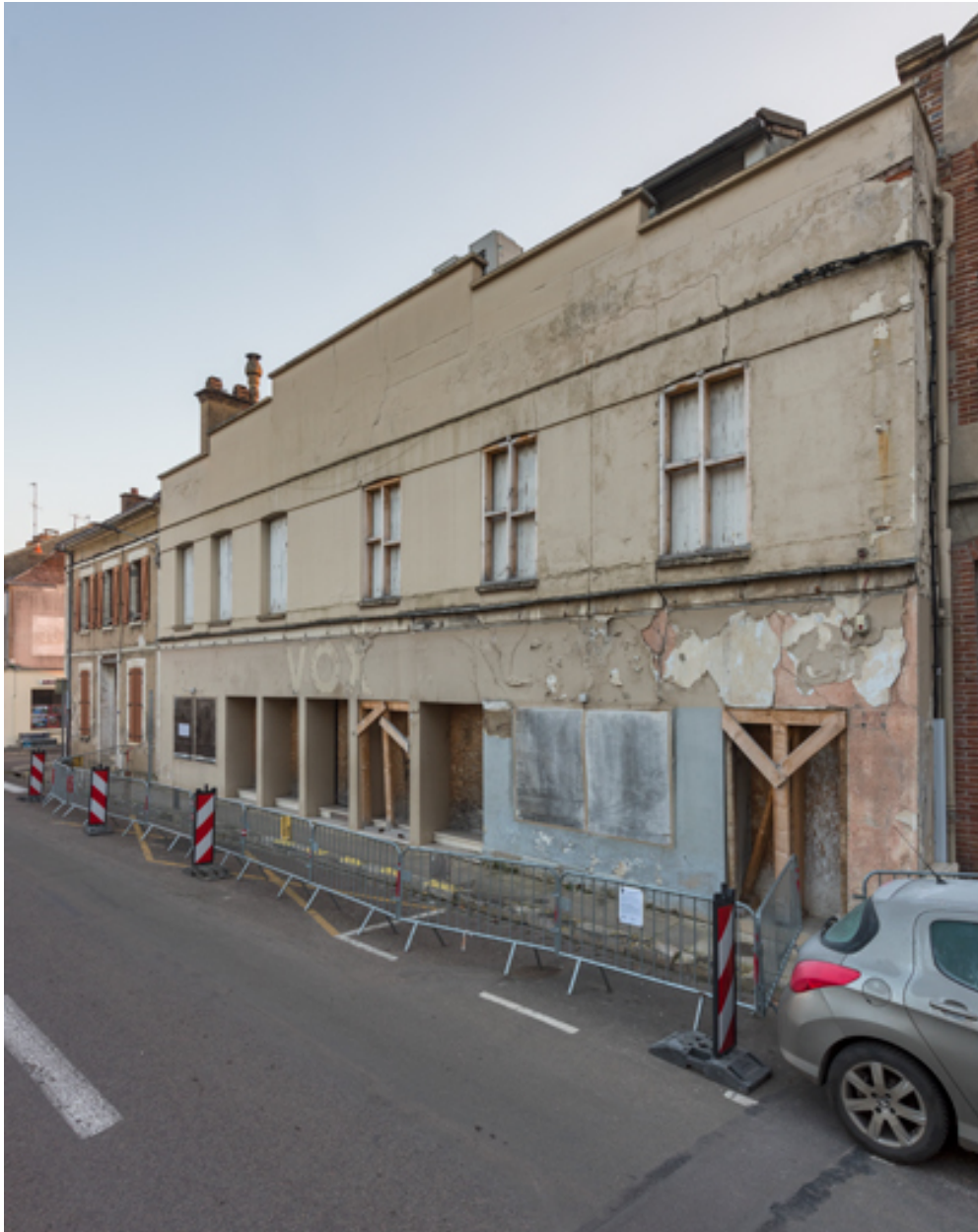
Façade antérieure du Vox, de trois quarts droite (février 2023).