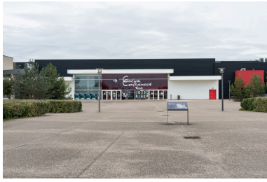
Cinéma Confluences (chemin des Cannelières). IVR26_20238900268NUC4A