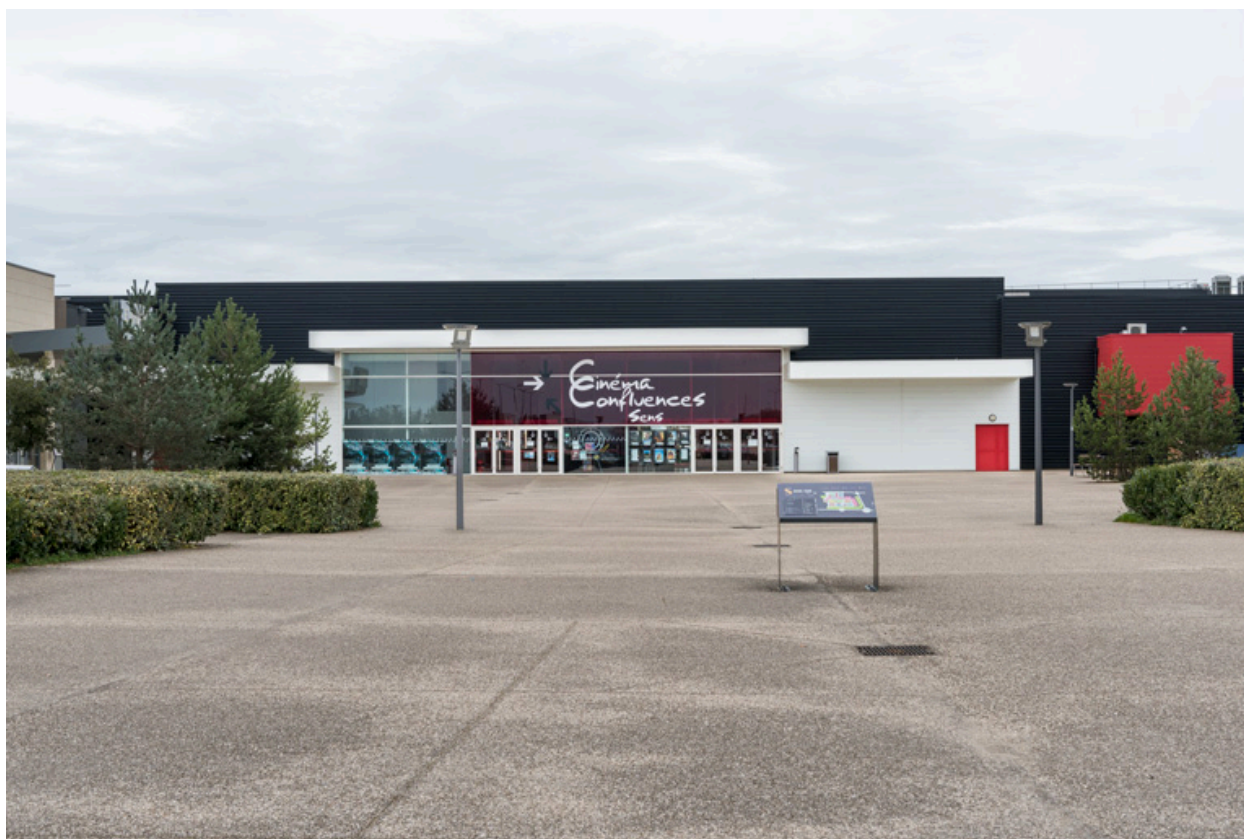
Cinéma Confluences (chemin des Cannetières).