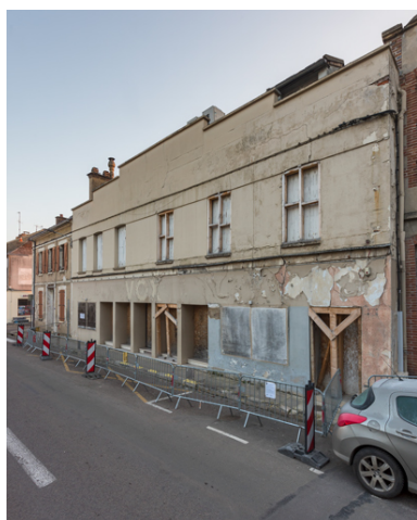
Façade antérieure du Vox, de trois quarts droite (février 2023).