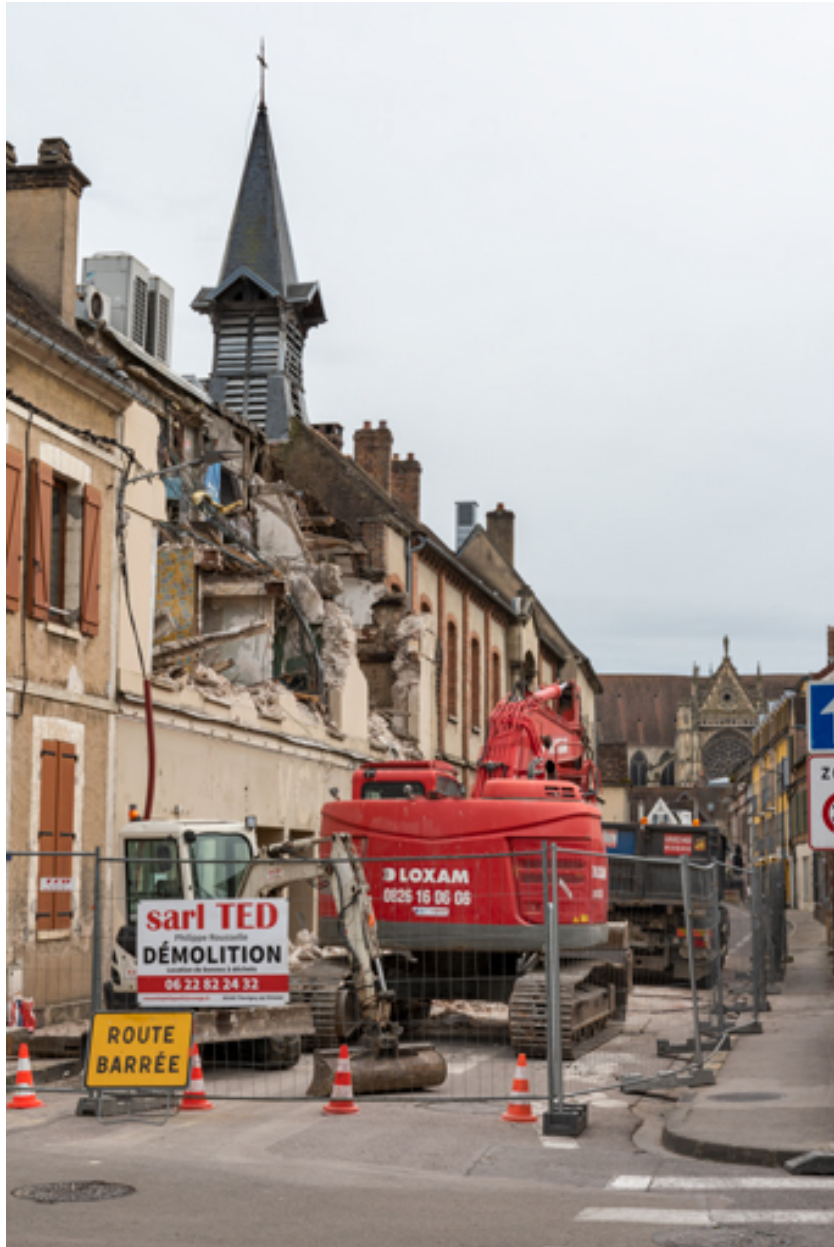
Cinéma Vox (14 rue Victor Guichard) en cours de démolition (22 mars 2023).