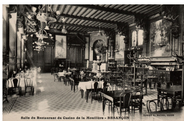
Vue intérieure de la salle de restaurant.