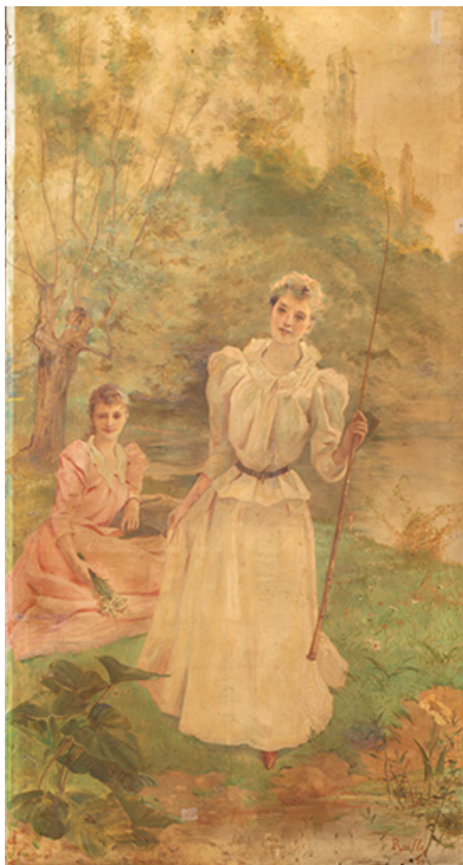
Tableau de Louis-Eugène Baille.