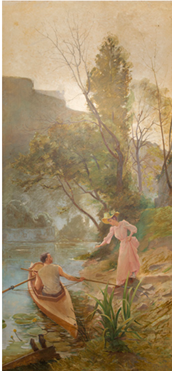
Tableau de Raoul Trémolières.