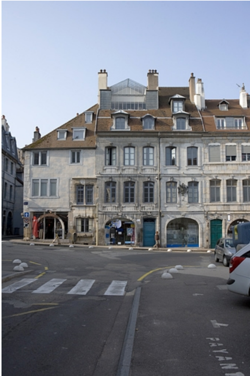
Vue d'ensemble éloignée de la façade sur rue rue.