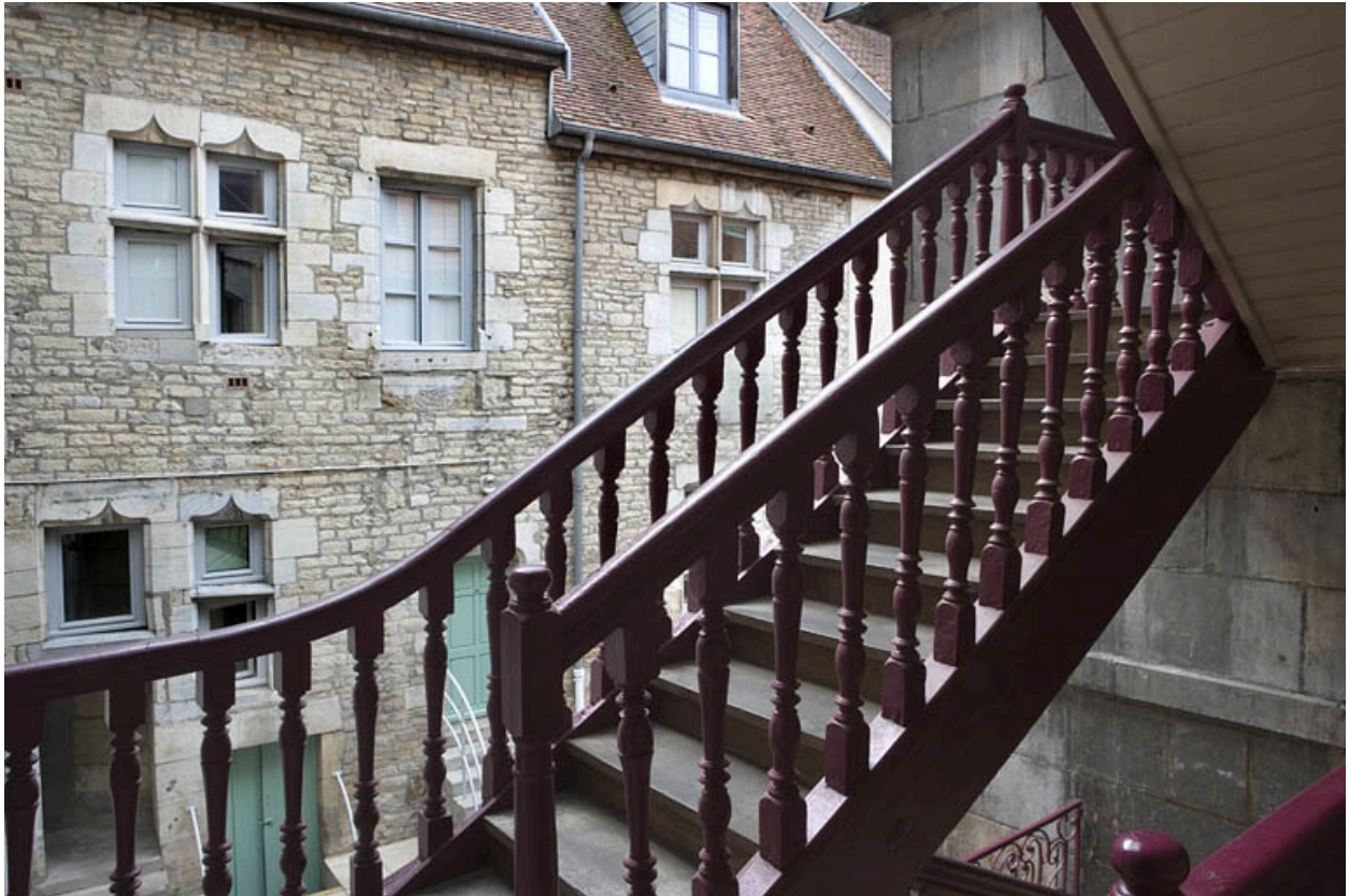
Escalier à cage ouverte sur cour, détail d'une volée.