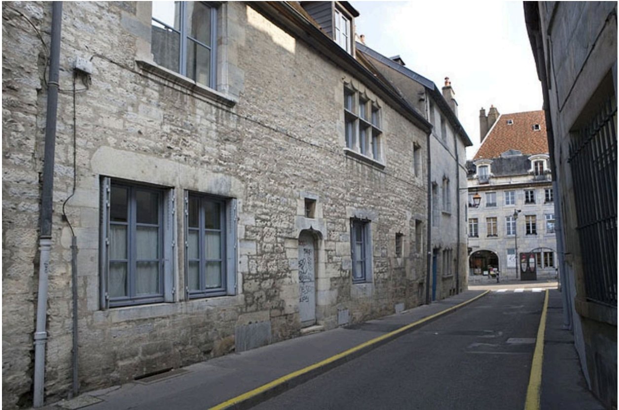
Vue d'ensemble de la façade latérale gauche, de trois quarts gauche.