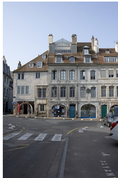
Vue d'ensemble éloignée de la façade sur rue. IVR43_20092501286NUC2A