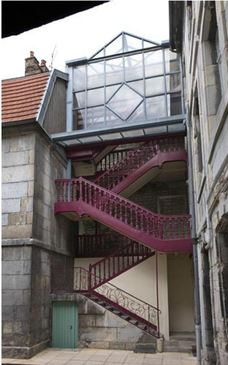
Vue d'ensemble de l'escalier à cage ouverte.