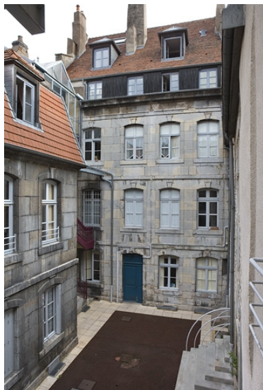
Vue d'ensemble de la cour depuis le fond. IVR43_20092501305NUC2A