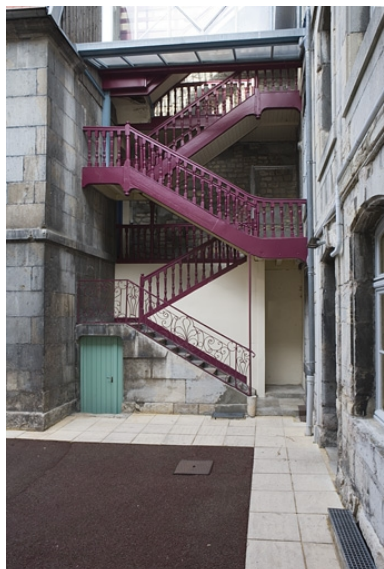
Vue d'ensemble de l'escalier à cage ouverte en dessous de la verrière. IVR43_20092501314NUC2A