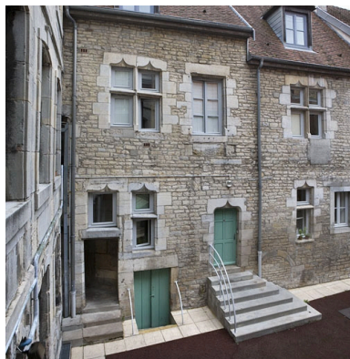
Vue d'une partie de l'aile gauche sur cour. IVR43_20092501307NUC2A