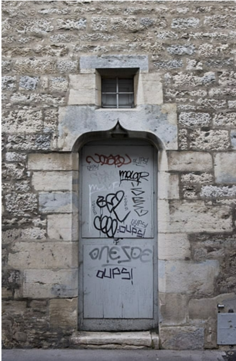
Façade latérale gauche : détail d'une porte en accolade.