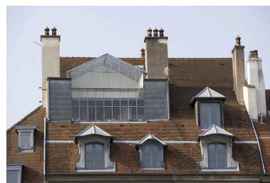
Toiture : détail de la verrière de l'atelier d'artiste. IVR43_20092501292NUC2A