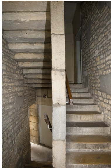
Détail de l'escalier rampe sur rampe dans oeuvre de l'aile gauche. IVR43_20092501311NUC2A