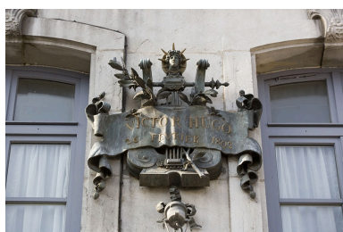
Façade sur rue : plaque commémorative dédiée à Victor Hugo, vue rapprochée. IVR43_20092501290NUC2A