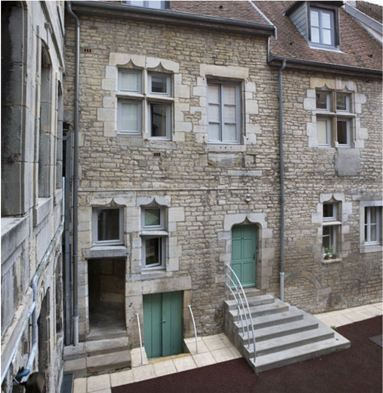
Vue d'une partie de l'aile gauche sur cour.