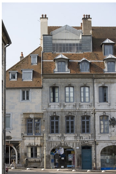
Partie gauche de la façade sur rue, de face. IVR43_20092501291NUC2A