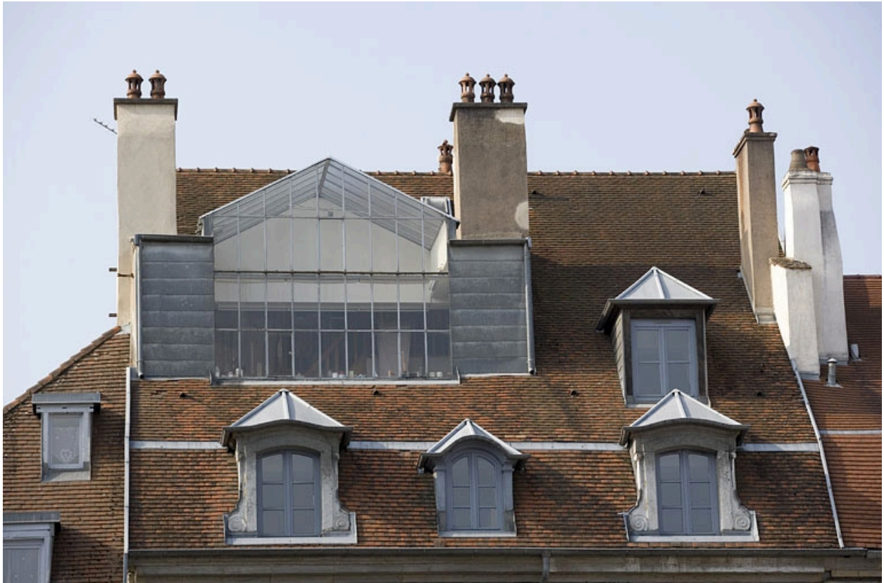
Toiture : détail de la verrière de l'atelier d'artiste.