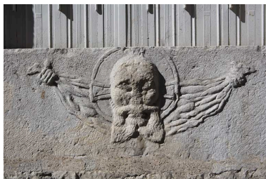
Façade latérale gauche : détail du bas-relief représentant une tête de Christ sur un linge. IVR43_20092501299NUC2A