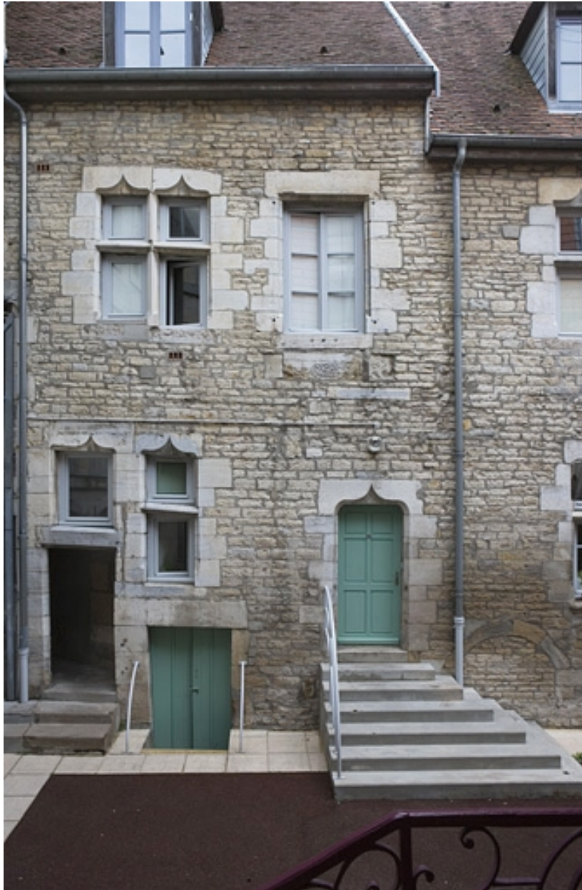
Vue d'une partie de l'aile gauche sur cour, de face.