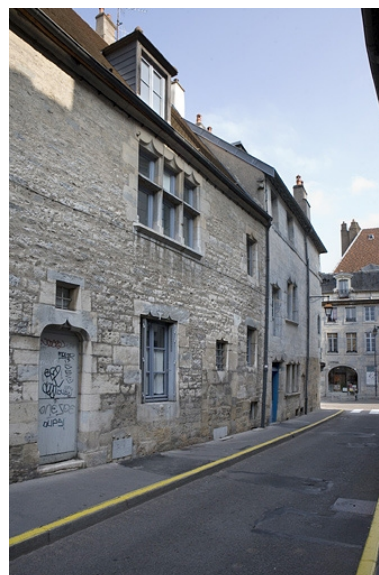
Façade latérale gauche : vue partielle. IVR43_20092501298NUC2A