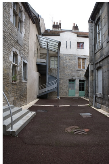
Vue d'ensemble de la cour depuis l'entrée.