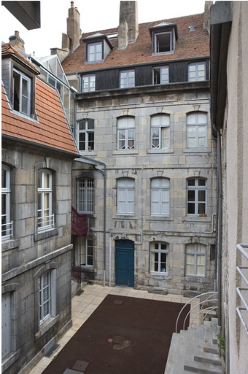
Vue d'ensemble de la cour depuis le fond.