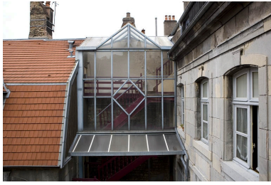
Détail de la verrière au-dessus de l'escalier à cage ouverte.