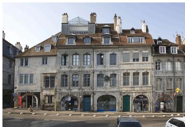
Vue d'ensemble de la façade sur rue, de face. IVR43_20092501285NUC2A