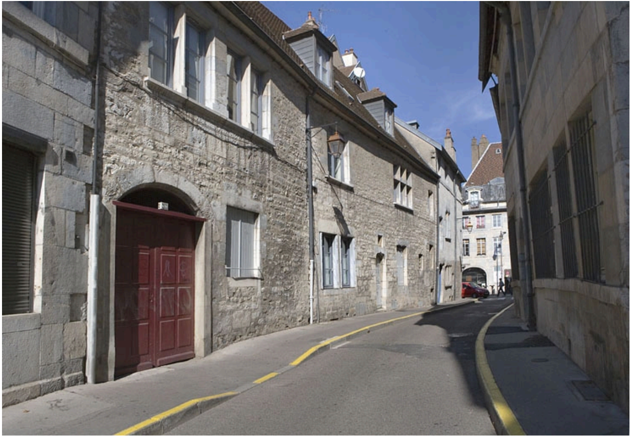
Façade latérale gauche, vue d'ensemble.