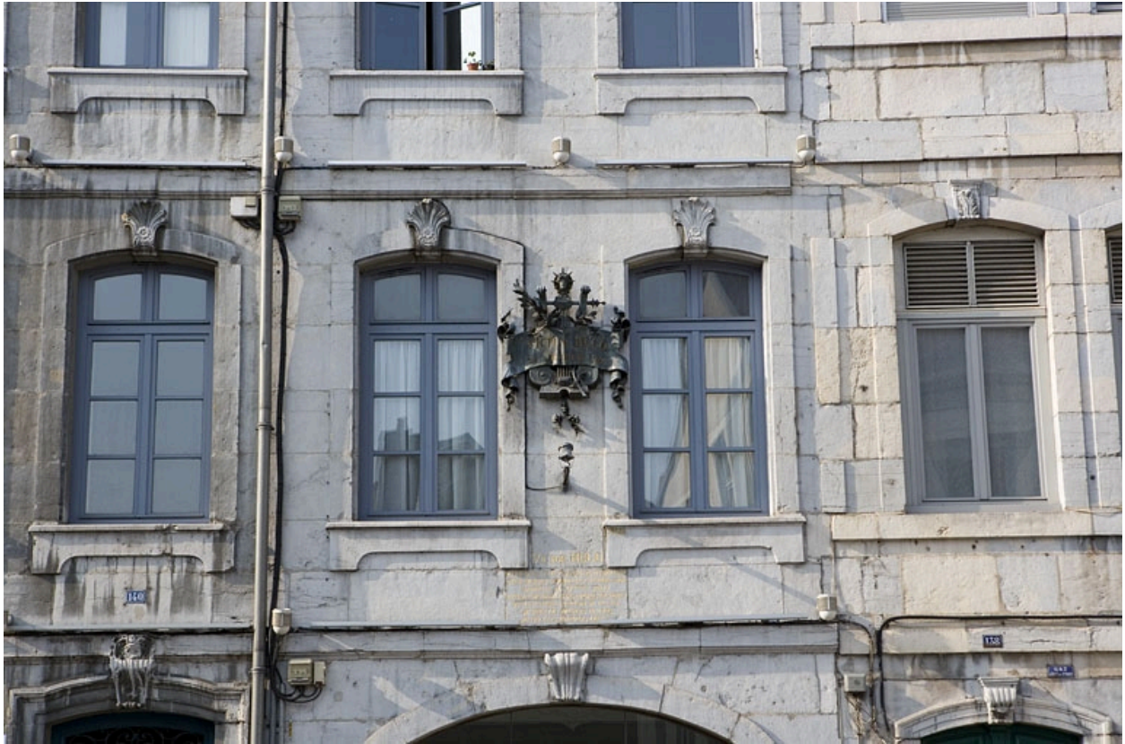
Façade sur rue : détail de la plaque commémorative dédiée à Victor Hugo.