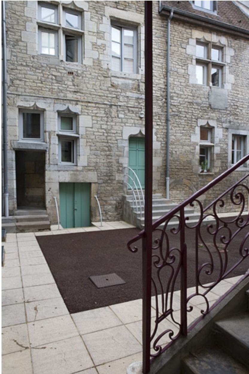
Vue de l'aile gauche depuis l'escalier à cage ouverte.