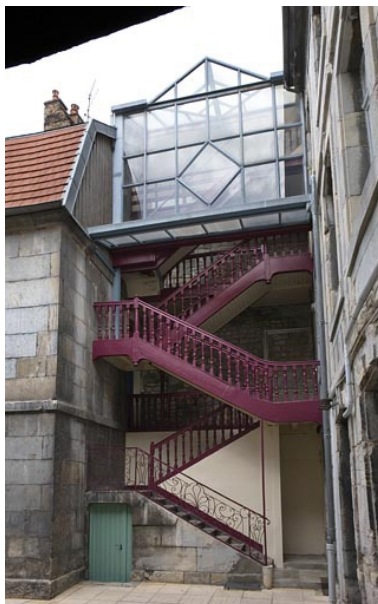
Vue d'ensemble de l'escalier à cage ouverte. IVR43_20092501313NUC2A