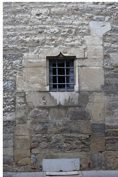
Façade latérale gauche : détail d'une fenêtre en accolade.