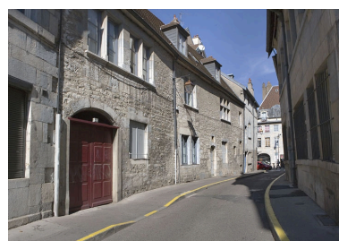
Façade latérale gauche, vue d'ensemble. IVR43_20092501301NUC2A