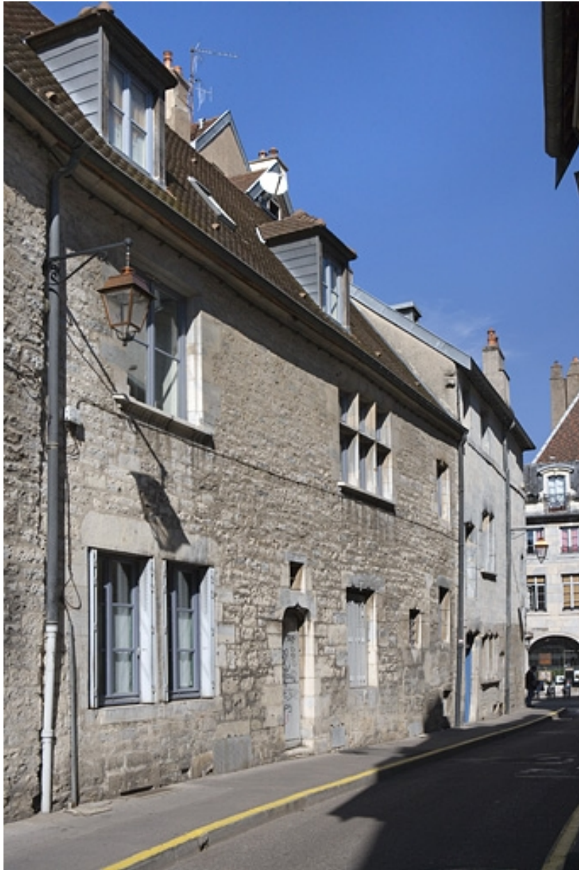
Façade latérale gauche, vue partielle.