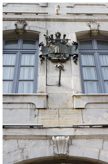
Façade sur rue : détail de la plaque commémorative dédiée à Victor Hugo. IVR43_20092501288NUC2A