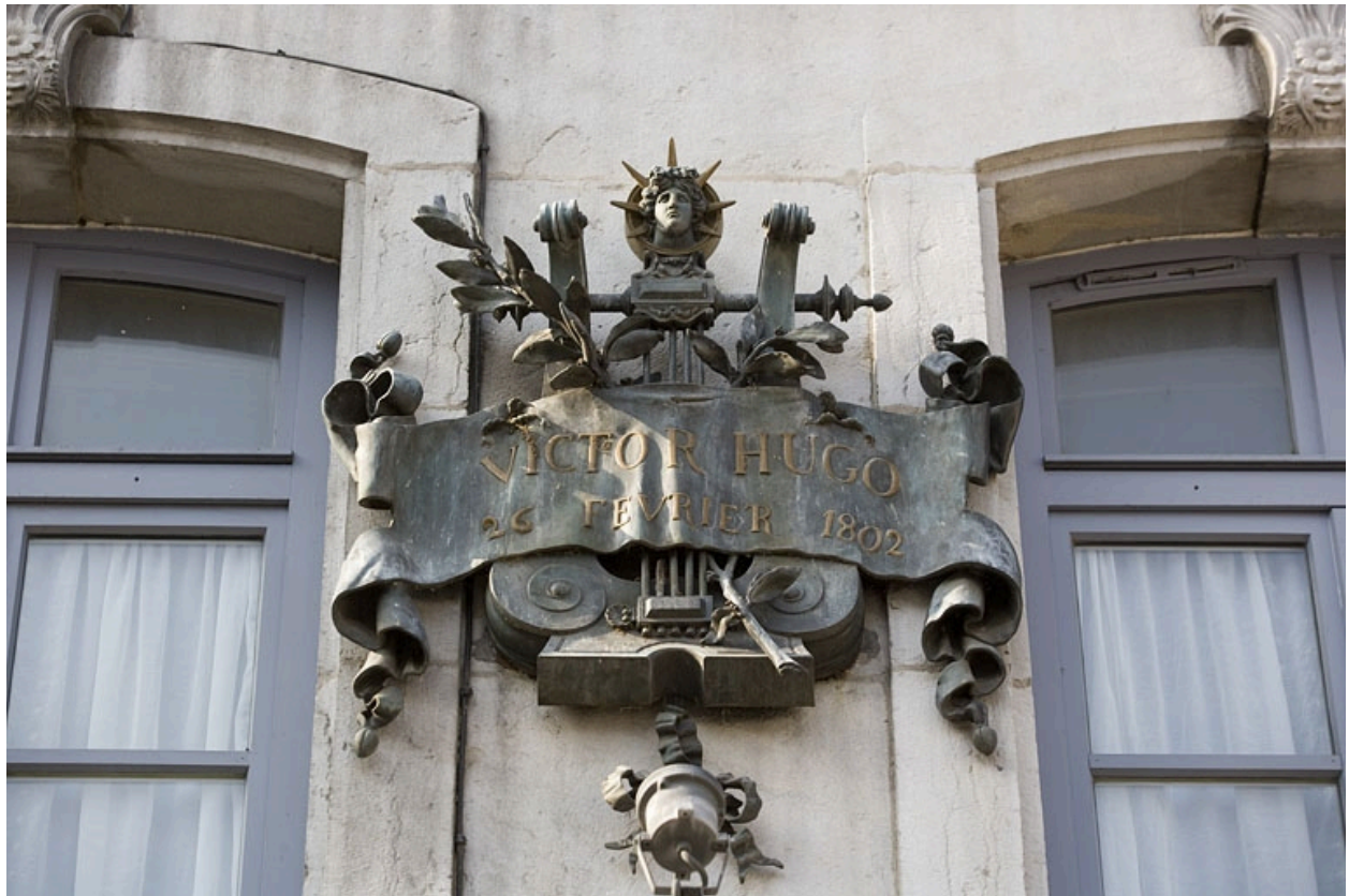
Façade sur rue : plaque commémorative dédiée à Victor Hugo, vue rapprochée.