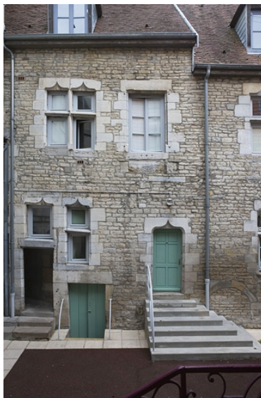
Vue d'une partie de l'aile gauche sur cour, de face. IVR43_20092501308NUC2A