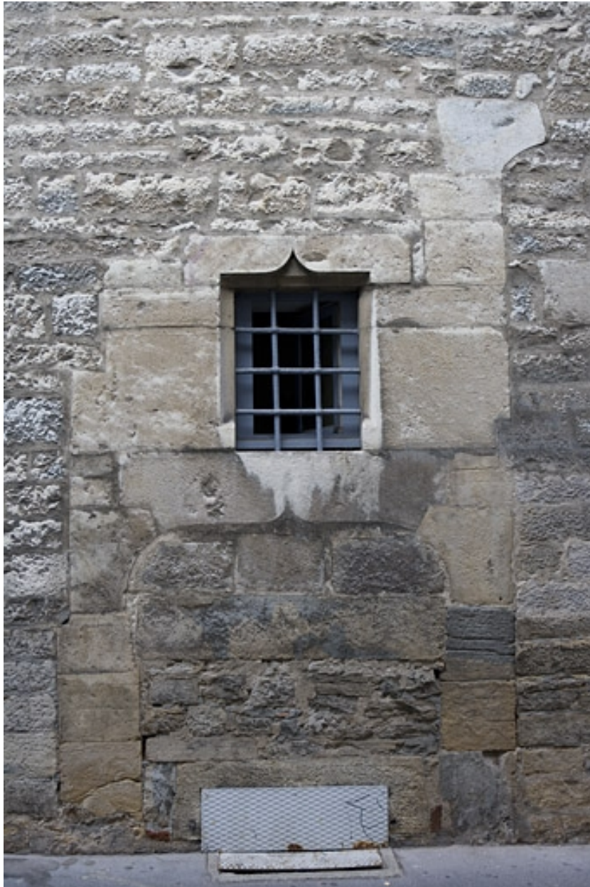
Façade latérale gauche : détail d'une fenêtre en accolade.