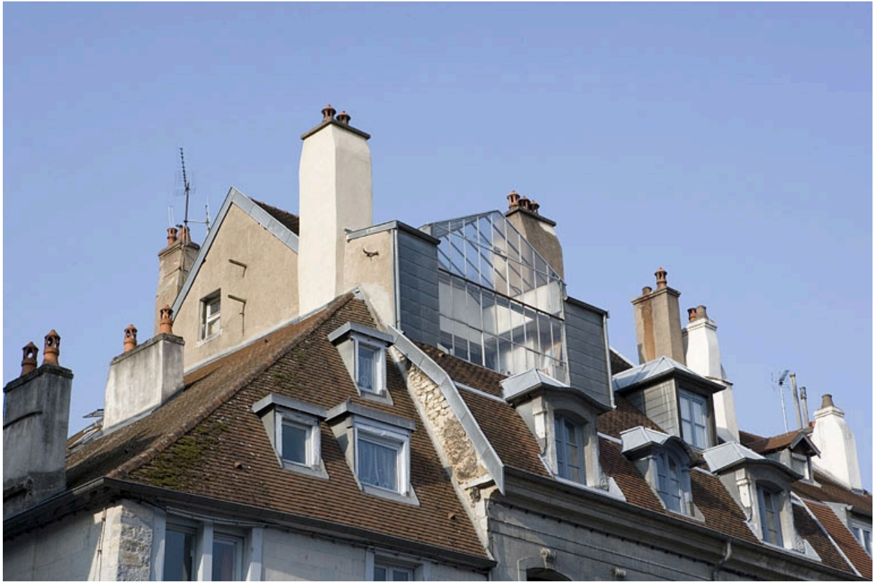
Toiture : détail de la verrière de l'atelier d'artiste, de trois quarts gauche.