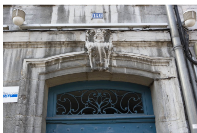
Façade sur rue : détail de la partie supérieure de la porte d'entrée.