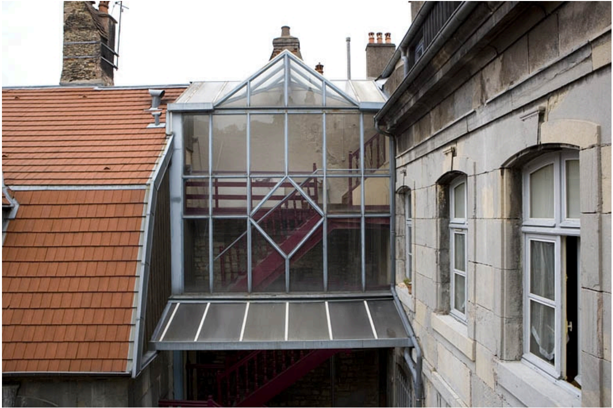
Détail de la verrière au-dessus de l'escalier à cage ouverte.