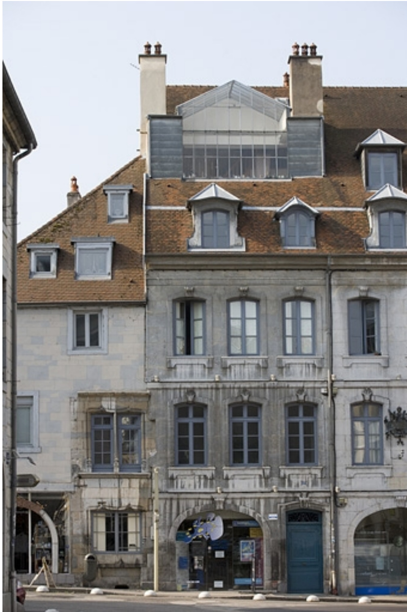
Partie gauche de la façade sur rue, de face.