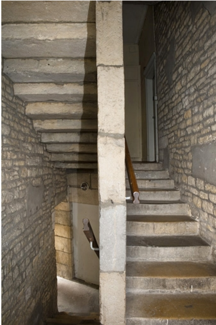
Détail de l'escalier rampe sur rampe dans oeuvre de l'aile gauche.