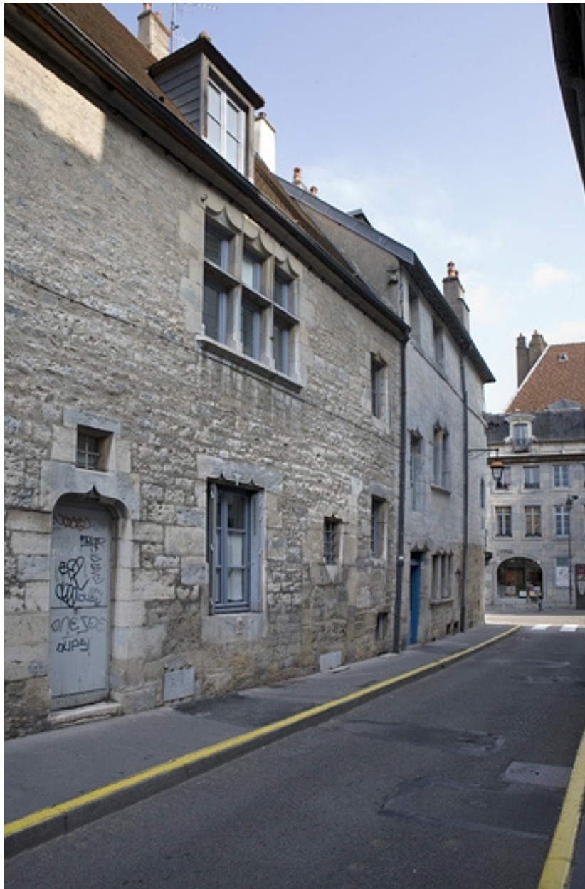
Façade latérale gauche : vue partielle.