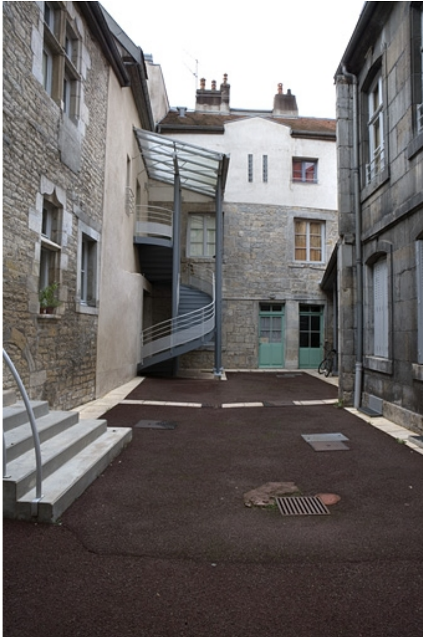
Vue d'ensemble de la cour depuis l'entrée.