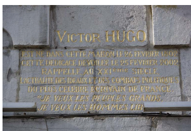
Façade sur rue : détail de l'inscription sous la plaque commémorative dédiée à Victor Hugo.