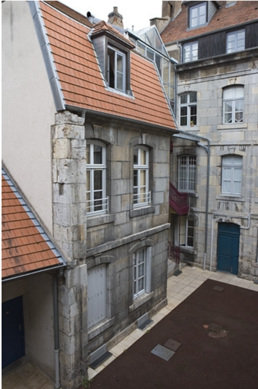
Vue d'ensemble de l'aile droite depuis le fond de la cour.