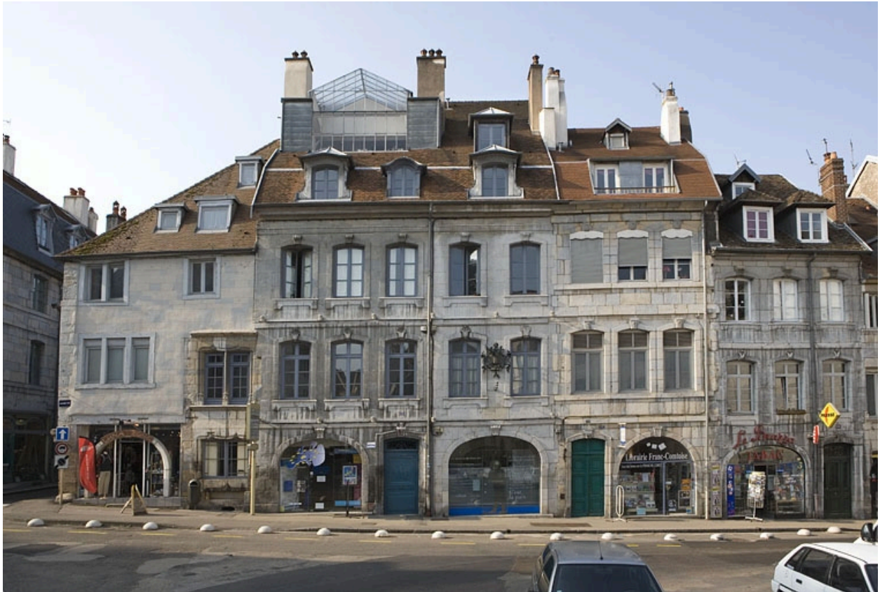
Vue d'ensemble de la façade sur rue, de face.