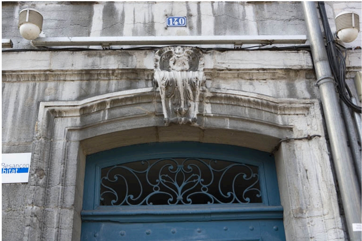
Façade sur rue : détail de la partie supérieure de la porte d'entrée.