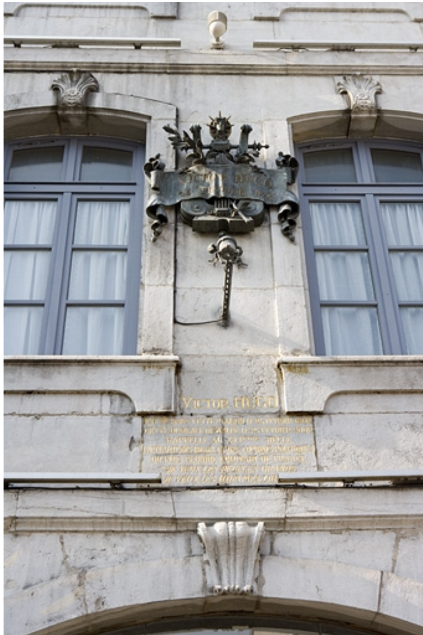
Façade sur rue : détail de la plaque commémorative dédiée à Victor Hugo.