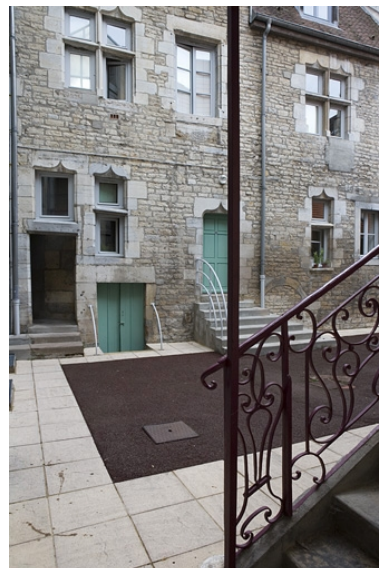
Vue de l'aile gauche depuis l'escalier à cage ouverte. IVR43_20092501310NUC2A