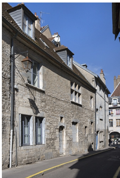
Façade latérale gauche, vue partielle.