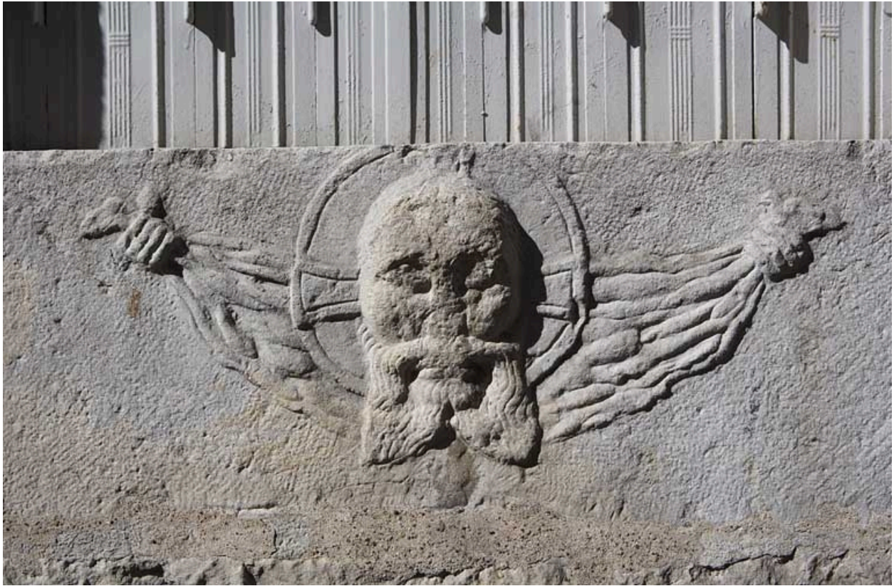
Façade latérale gauche : détail du bas-relief représentant une tête de Christ sur un linge.