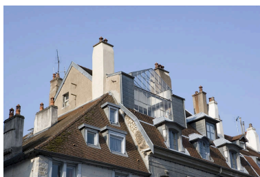
Toiture : détail de la verrière de l'atelier d'artiste, de trois quarts gauche. IVR43_20092501293NUC2A