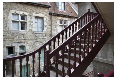
Escalier à cage ouverte sur cour, détail d'une volée. IVR43_20092501309NUC2A