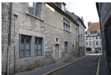
Vue d'ensemble de la façade latérale gauche, de trois quarts gauche.