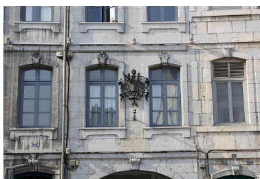
Façade sur rue : détail de la plaque commémorative dédiée à Victor Hugo. IVR43_20092501287NUC2A