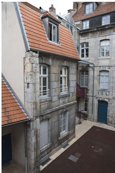
Vue d'ensemble de l'aile droite depuis le fond de la cour.