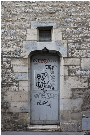
Façade latérale gauche : détail d'une porte en accolade. IVR43_20092501295NUC2A