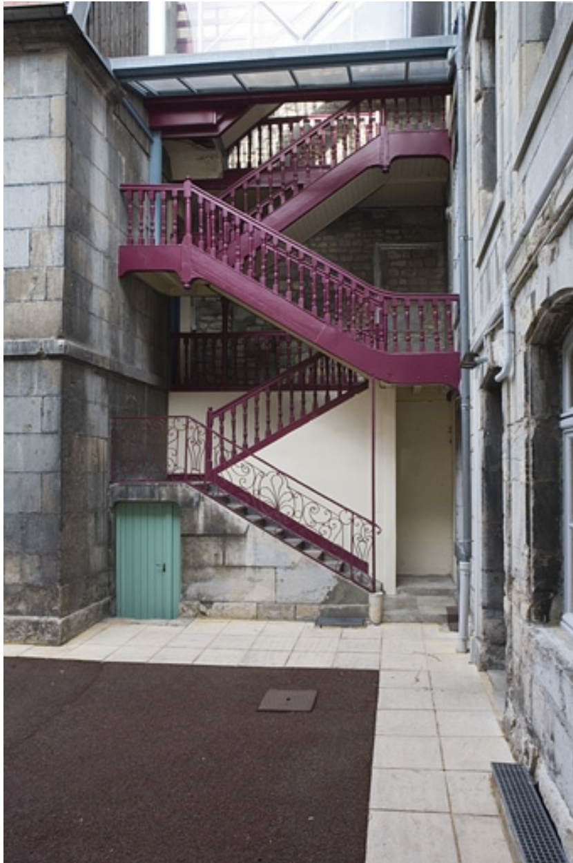
Vue d'ensemble de l'escalier à cage ouverte en dessous de la verrière.