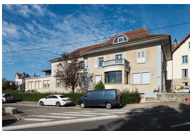
Vue d'ensemble depuis le sud-est. IVR43_20172501166NUC4A