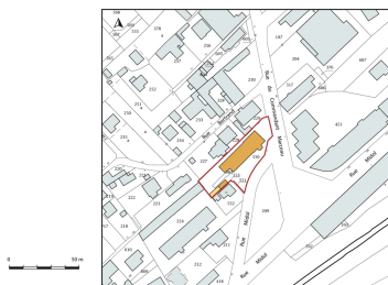
Plan-masse et de situation. Extrait du plan cadastral, 2019. IVR43_20192501120NUDA