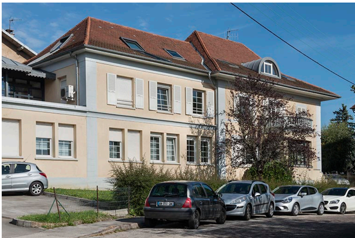
Atelier principal, vu de trois quarts gauche.