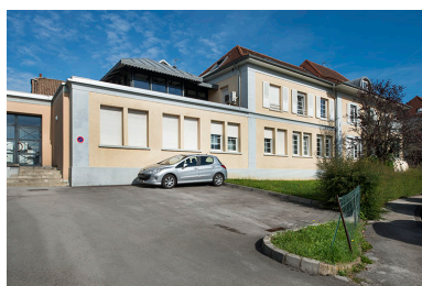
Vue de trois quarts gauche. IVR43_20172501169NUC4A