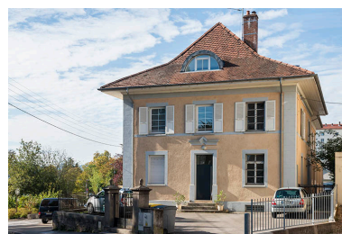
Pignon est. IVR43_20172501164NUC4A