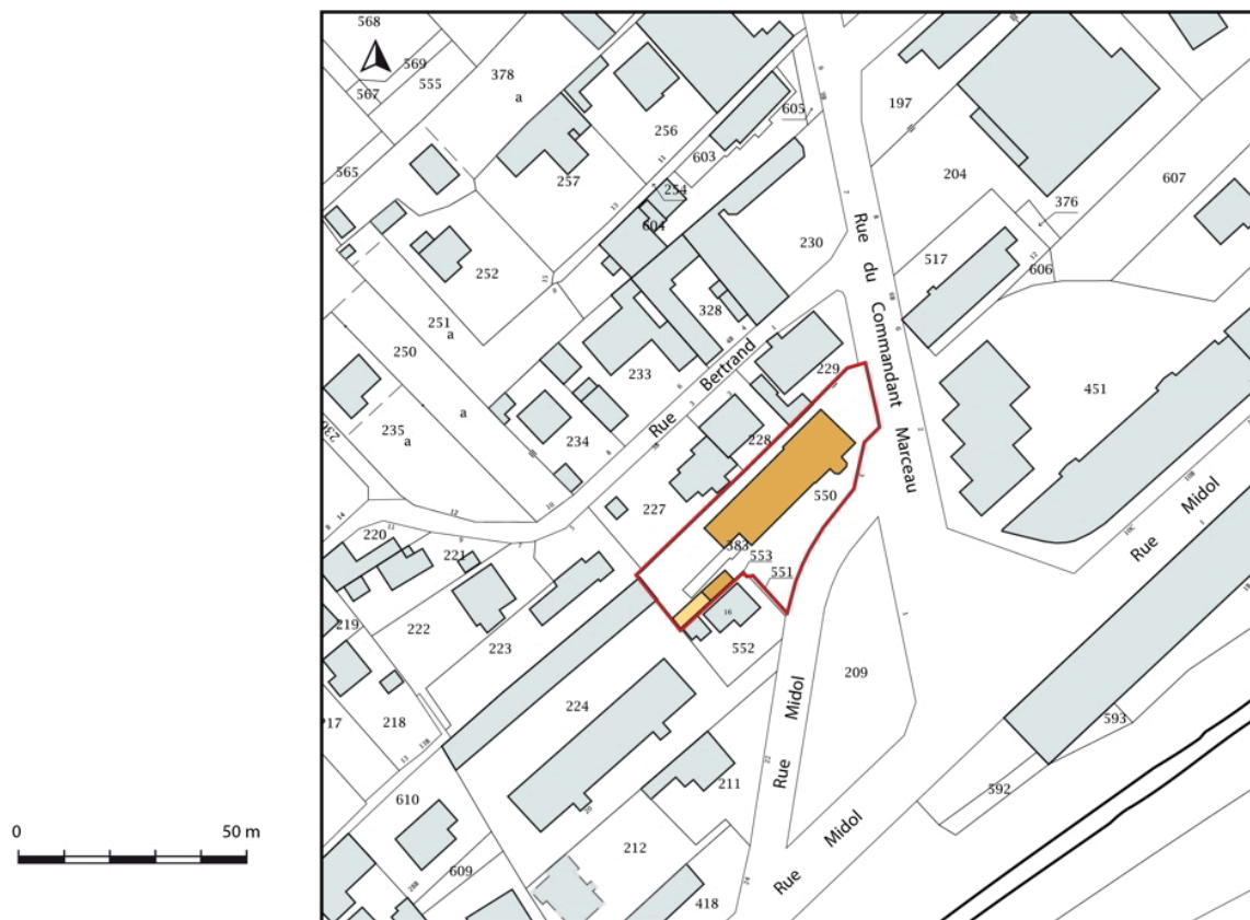
Plan-masse et de situation. Extrait du plan cadastral, 2019.