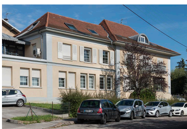
Atelier principal, vu de trois quarts gauche. IVR43_20172501167NUC4A