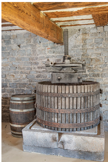
Le pressoir. IVR43_20233900485NUC4A