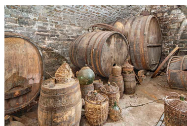
Chai. Rangée de foudres (sud). IVR43_20233900482NUC4A