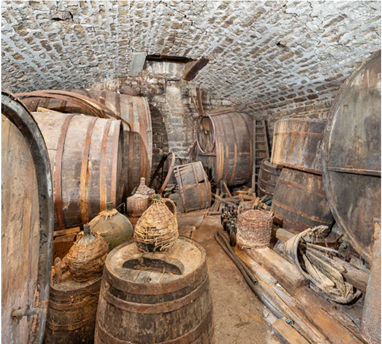
Chai. Vue d'ensemble.