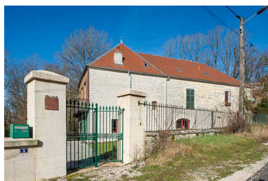
Vue d'ensemble depuis l'entrée. IVR43_20243900021NUC4A