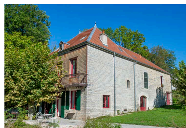
Vue de trois quarts gauche (en été). IVR43_20233900487NUC4A