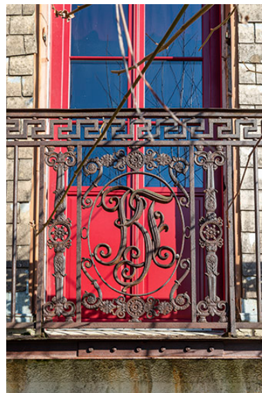
Détail du garde- corps du premier étage.