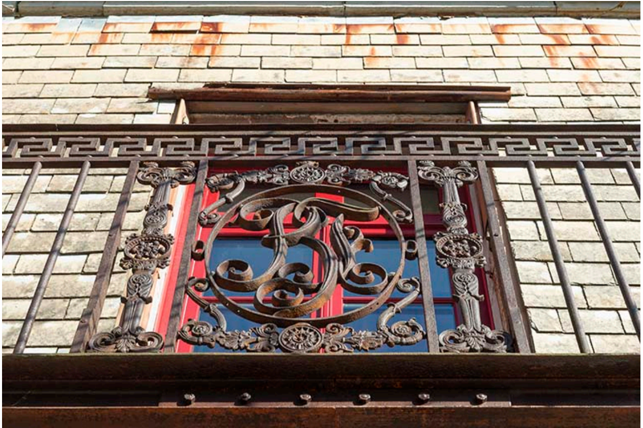
Vue en contre-plongée du garde-corps du balcon.