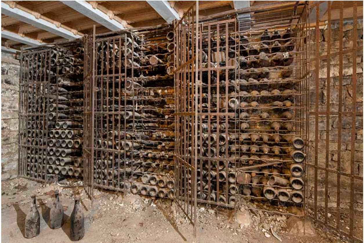
Stockage des bouteilles (sous-sol).