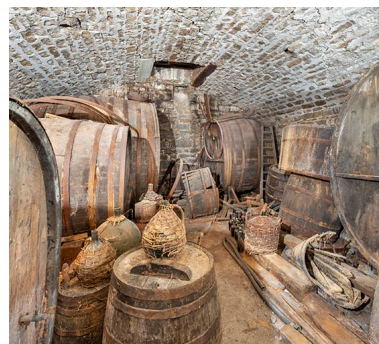
Chai. Vue d'ensemble. IVR43_20233900480NUC4A