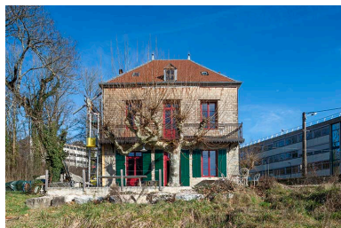
Pignon sud-ouest. IVR43_20243900024NUC4A