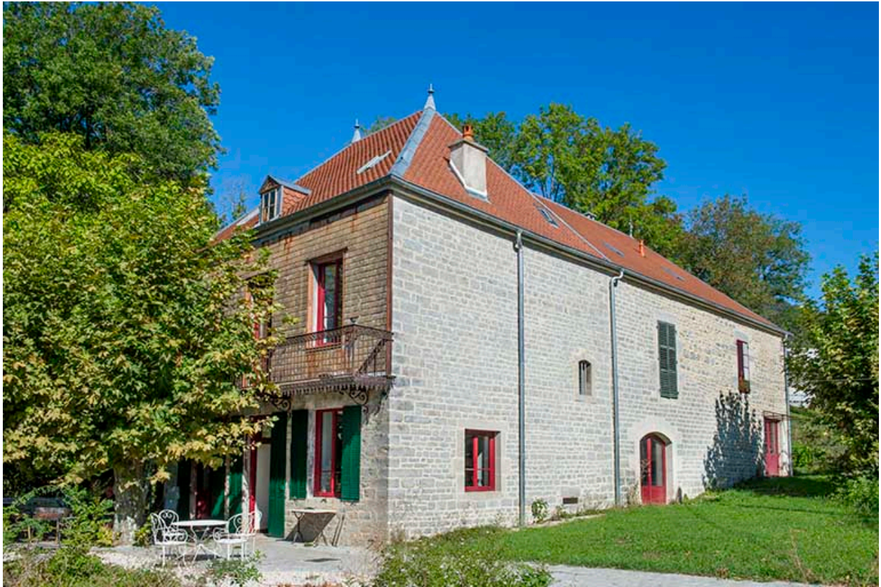
Vue de trois quarts gauche (en été).