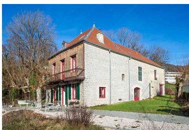
Vue de trois quarts gauche. IVR43_20243900022NUC4A