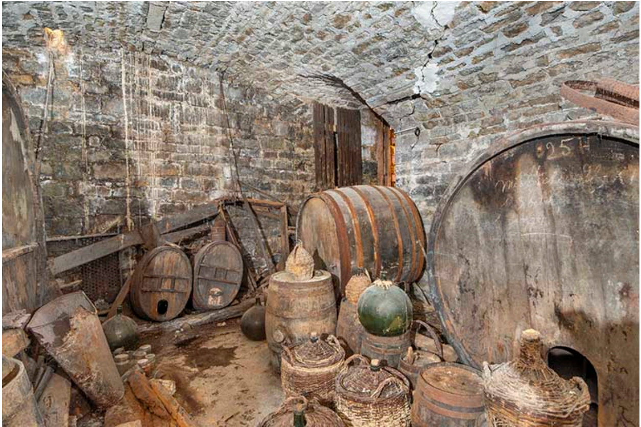
Le chai (côté nord).