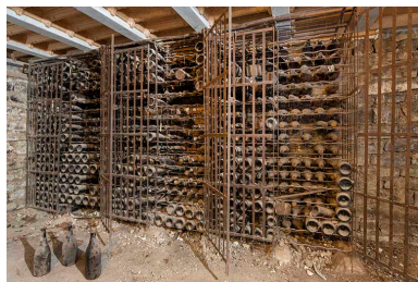
Stockage des bouteilles (sous-sol).