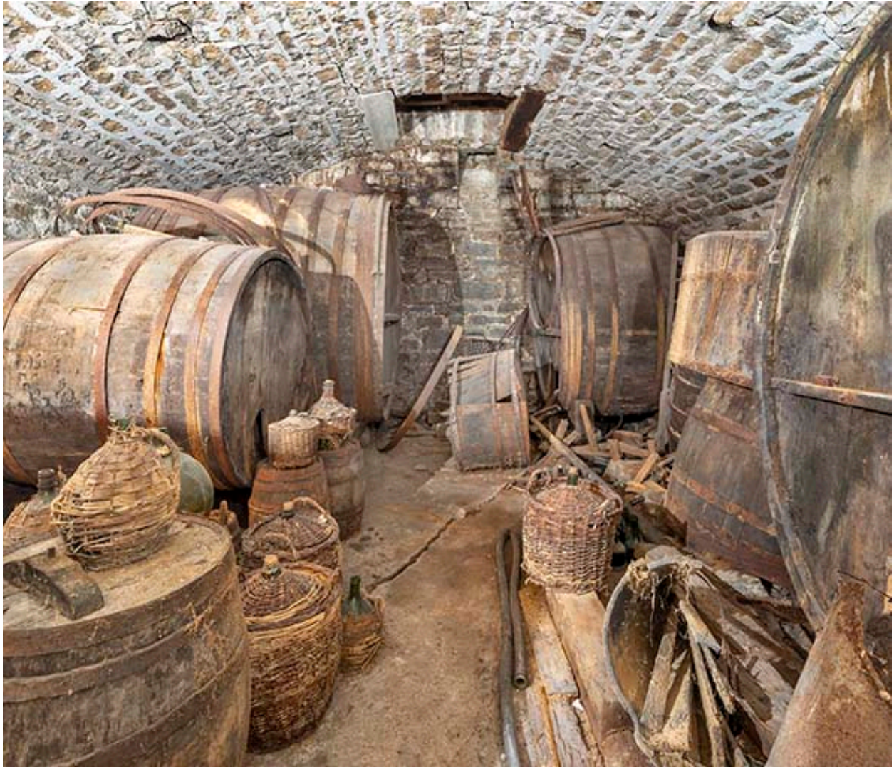
Vue d'ensemble du chai.