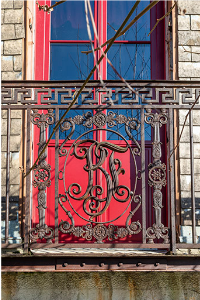
Détail du garde-corps du premier étage.