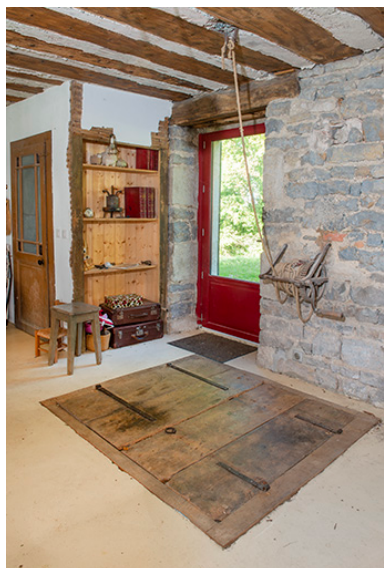
Trappe de cave.