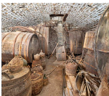
Vue d'ensemble du chai. IVR43_20233900481NUC4A