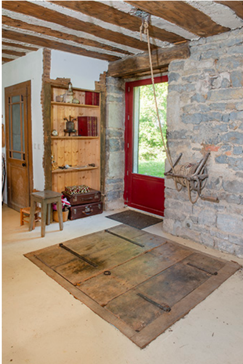
Trappe de cave.