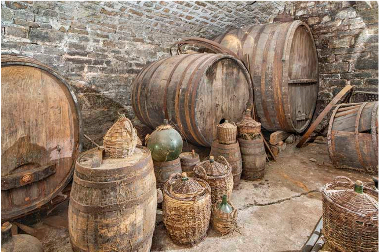
Chai. Rangée de foudres (sud).