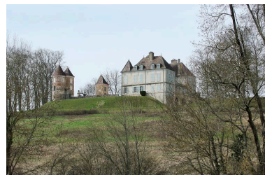
Le château de Loisy vu de la rive gauche de la Seille.