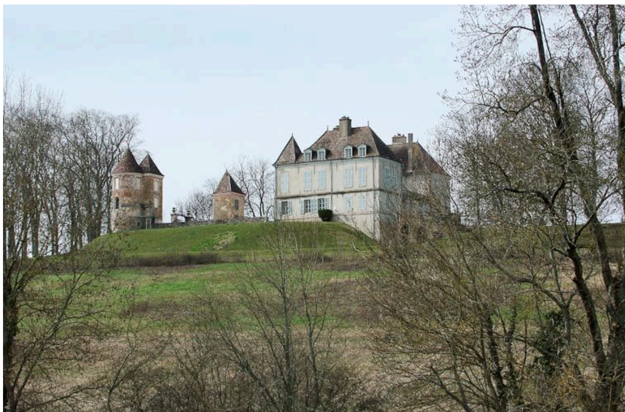
Le château de Loisy vu de la rive gauche de la Seille.