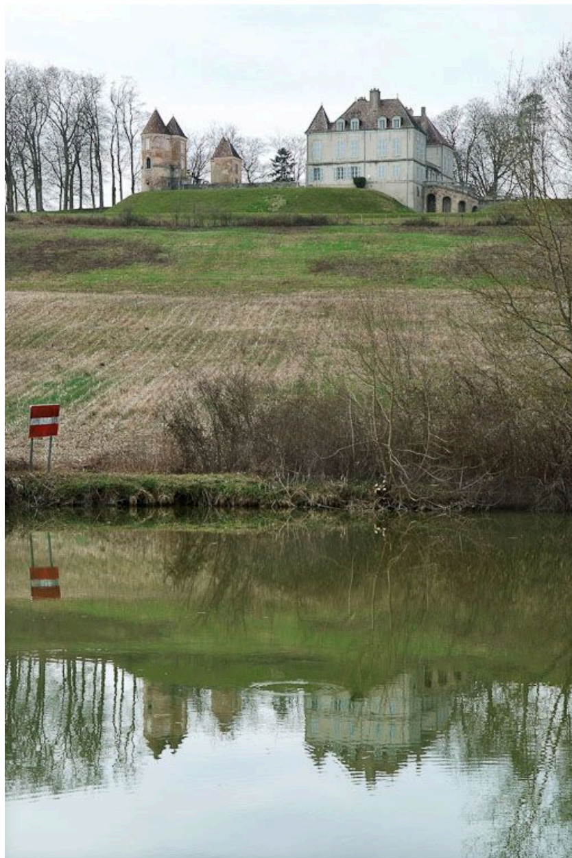
Château de Loisy. Seille au premier plan.