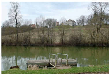
Le château pris de la rive gauche de la Seille. Au premier plan, un appontement moderne.