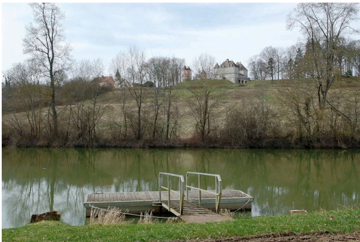
Le château pris de la rive gauche de la Seille. Au premier plan, un appontement moderne.