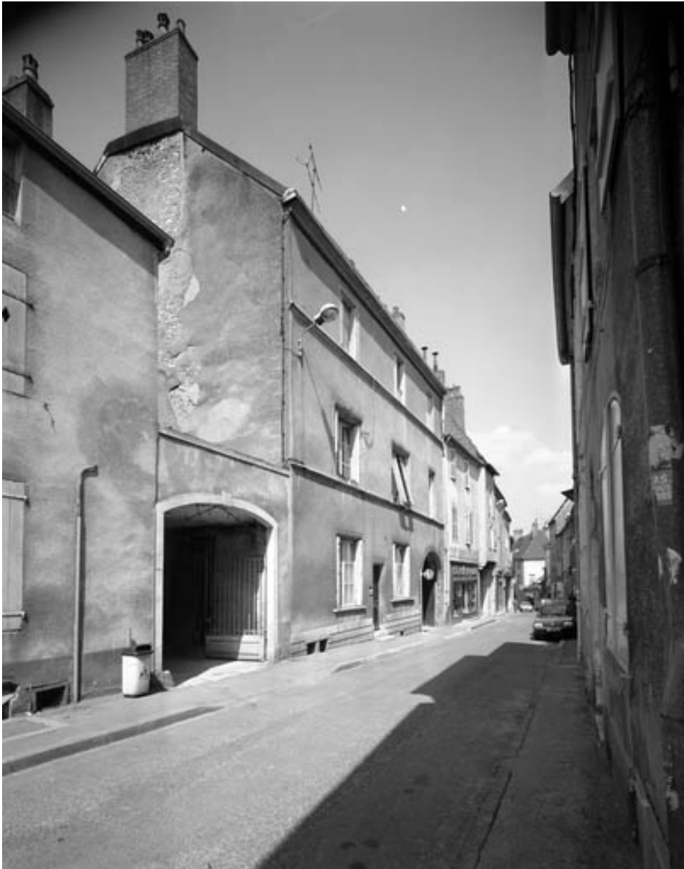
Façade antérieure de trois quarts gauche.