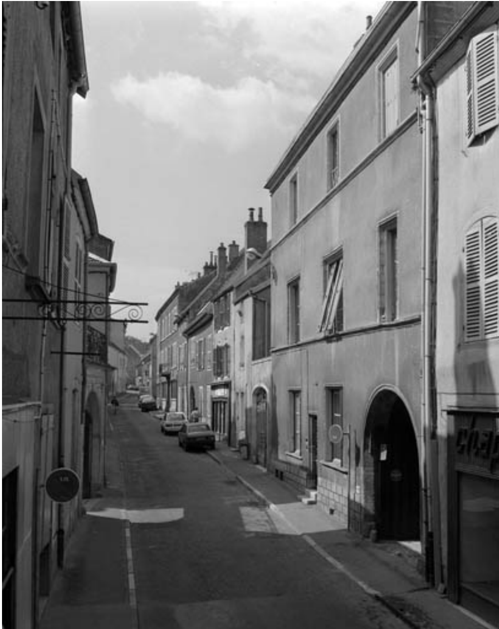
Façade antérieure, de trois quarts droit.