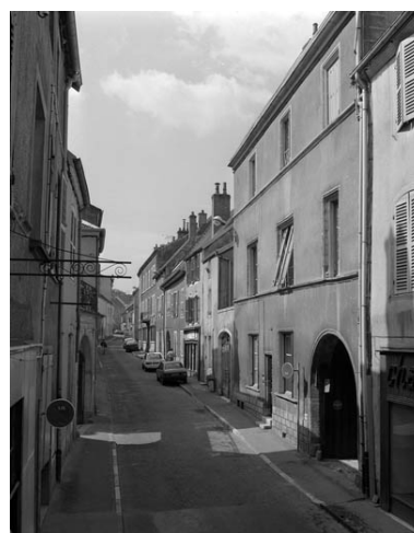
Façade antérieure, de trois quarts droit. IVR43_19917000123X