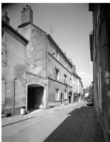
Façade antérieure de trois quarts gauche. IVR43_19897000157V