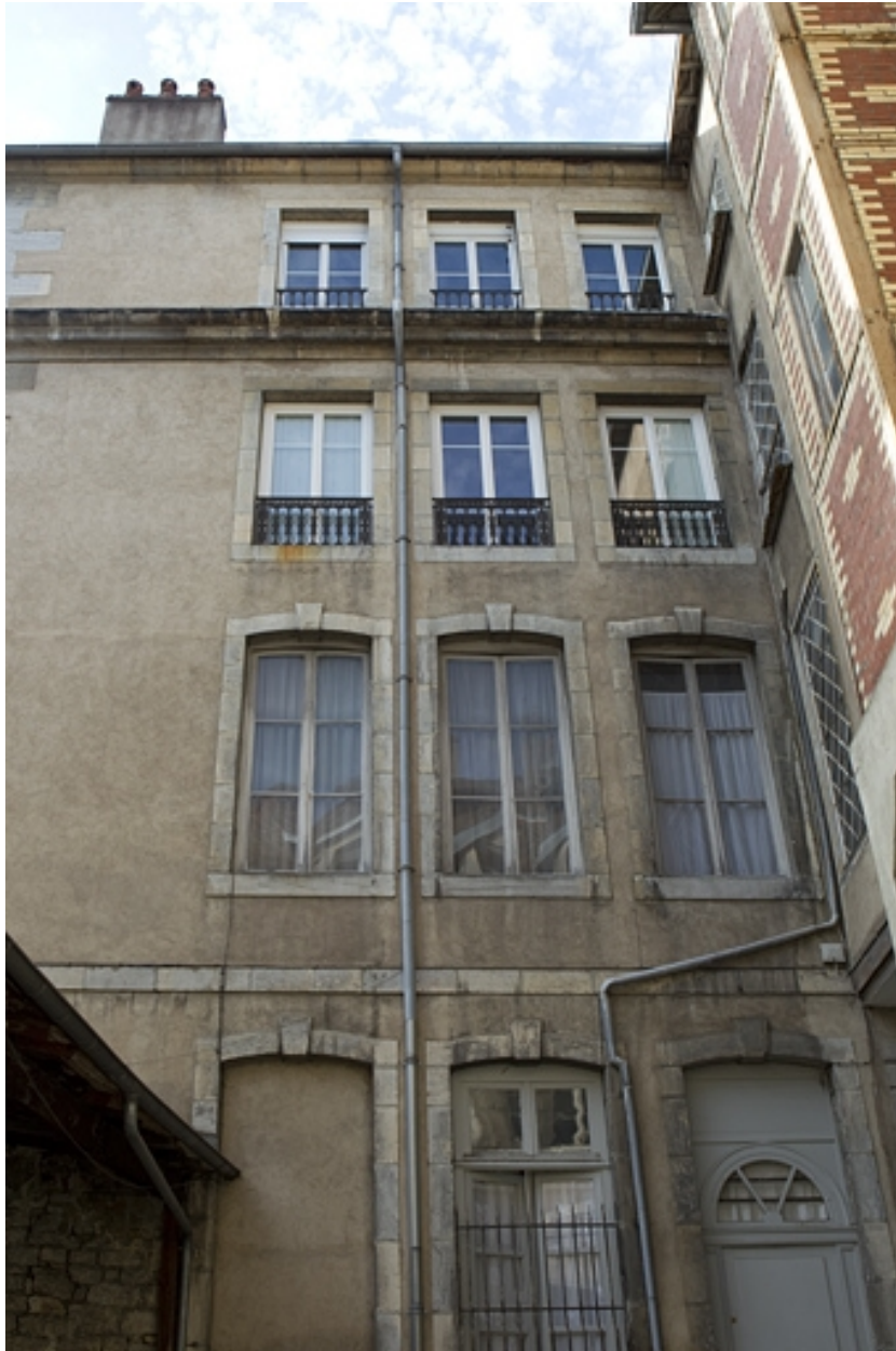
Vue d'ensemble de l'aile gauche sur cour.