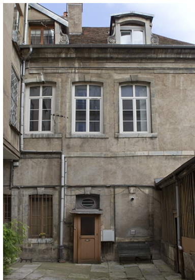
Vue d'ensemble de l'aile droite sur cour.