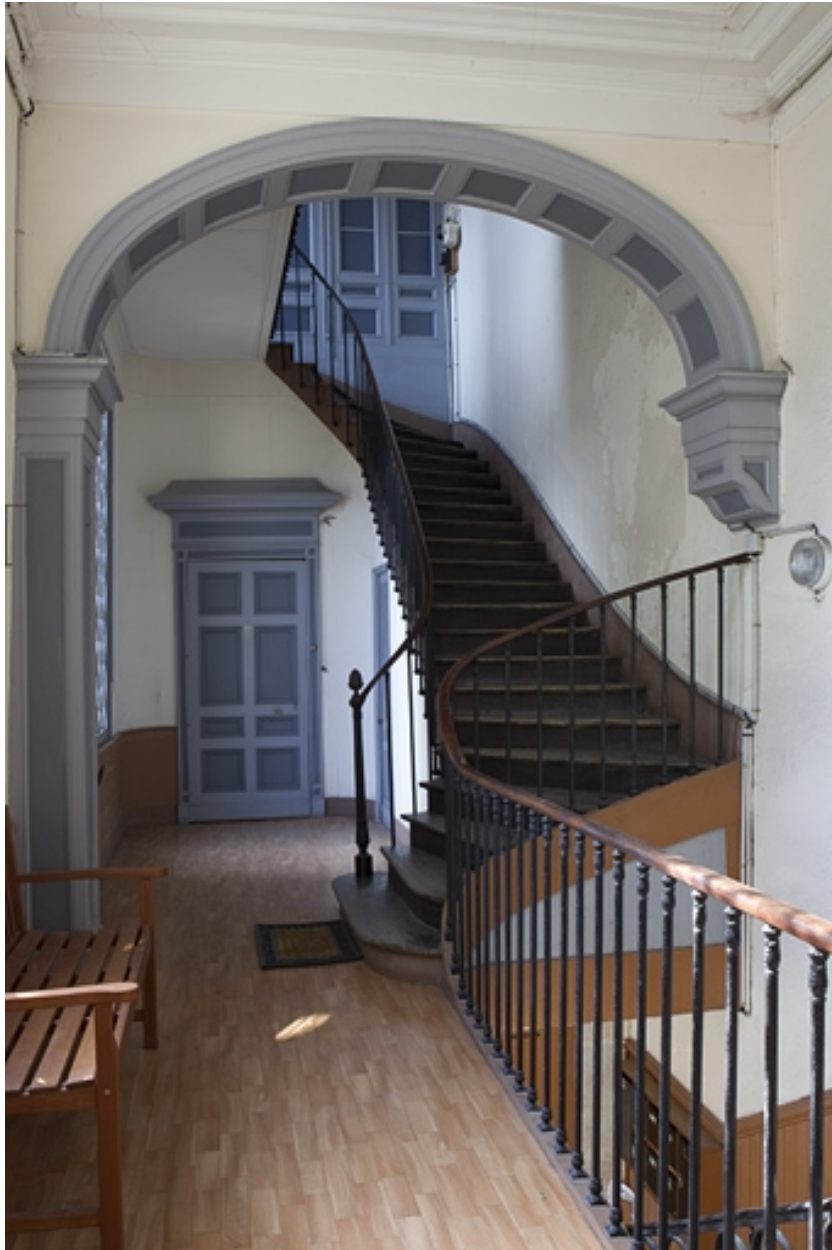
Vue des volées supérieures de l'escalier, de face.