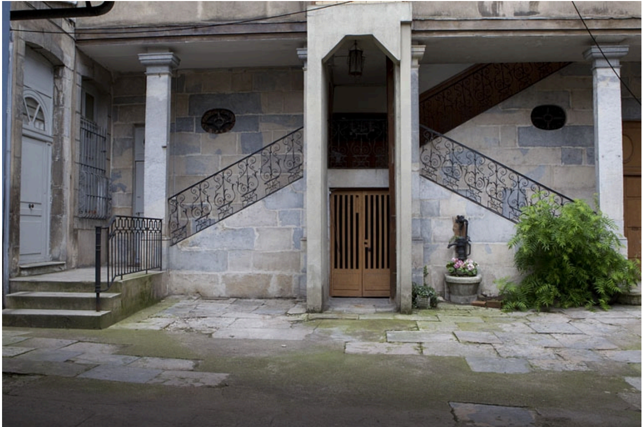
Vue du départ de l'escalier en fond de cour, de face.