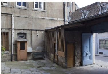
Détail du bûcher à droite du portail d'entrée. IVR43_20102501008NUC2A