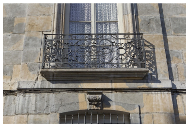
Aile droite : détail d'un garde- corps d'une fenêtre du premier étage.