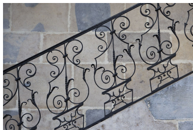
Escalier, première volée : détail de la rampe en ferronnerie. IVR43_20102501014NUC2A