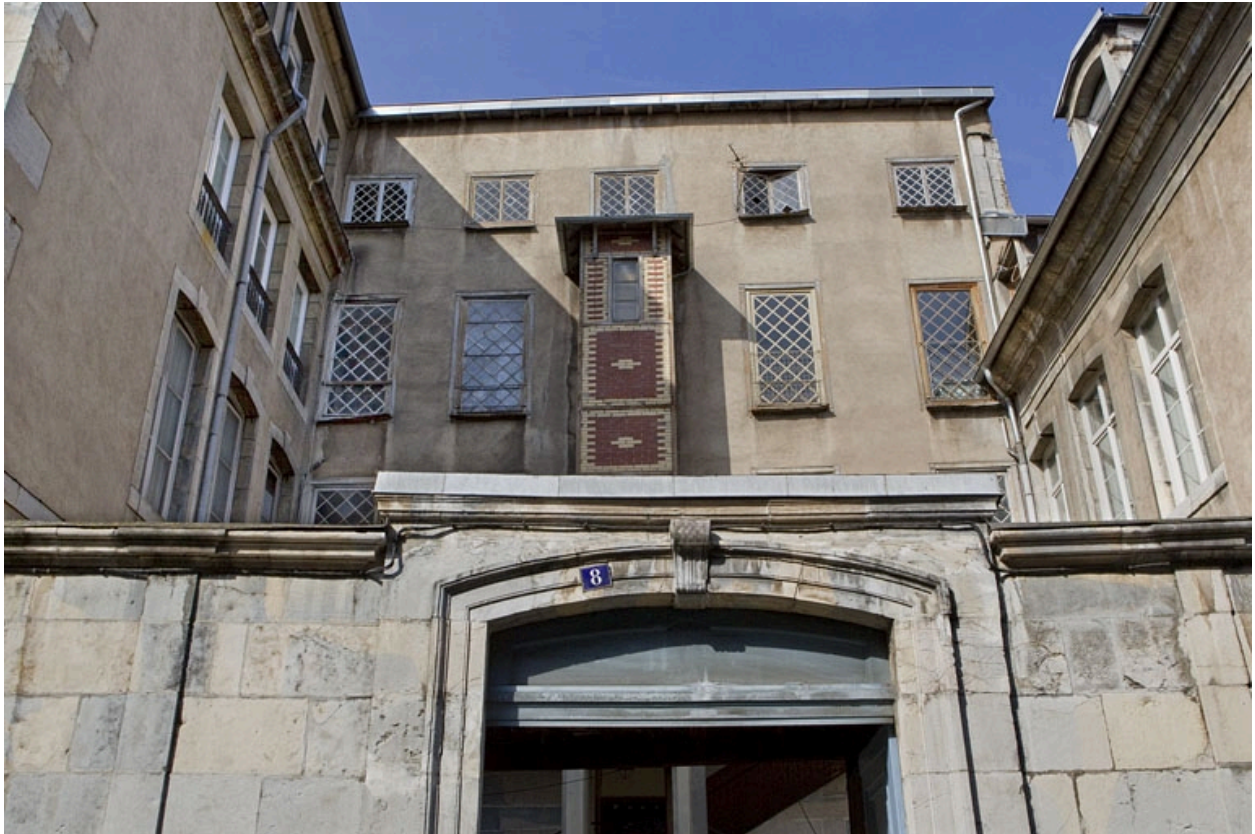
Vue d'ensemble de la clôture sur rue et de l'aile de l'escalier en fond de cour.