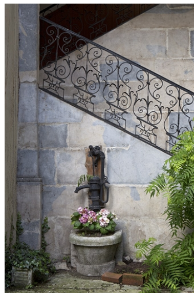
Escalier, première volée : détail de la rampe en ferronnerie et de la borne fontaine.