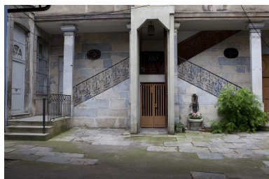
Vue du départ de l'escalier en fond de cour, de face. IVR43_20102501011NUC2A