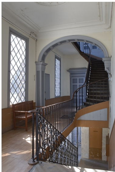
Vue des volées supérieures de l'escalier. IVR43_20102501012NUC2A