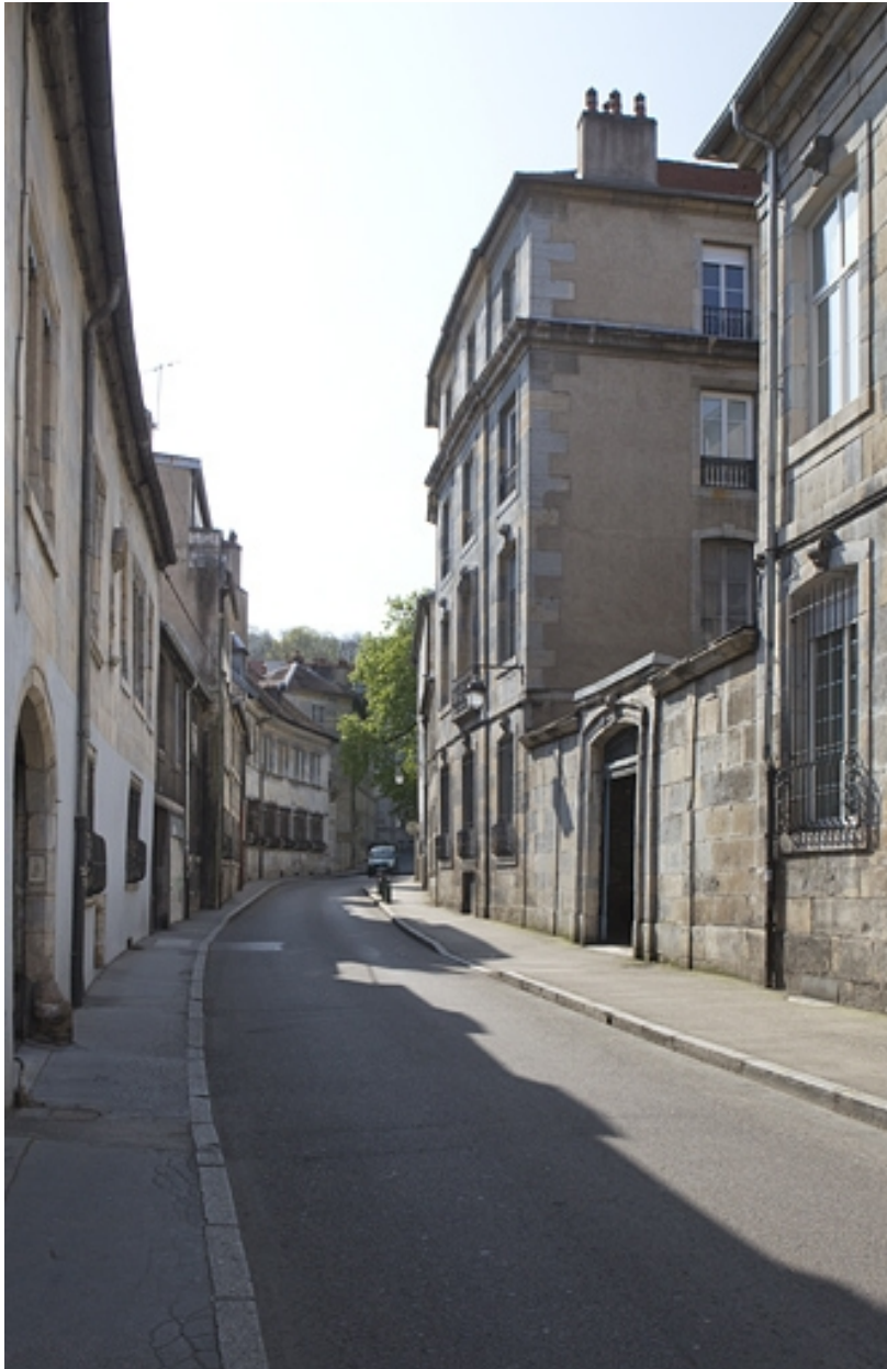
Vue d'ensemble depuis la rue, de trois quarts droit.