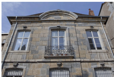
Aile droite : partie supérieure de la façade sur rue surmontée d'un fronton cintré.