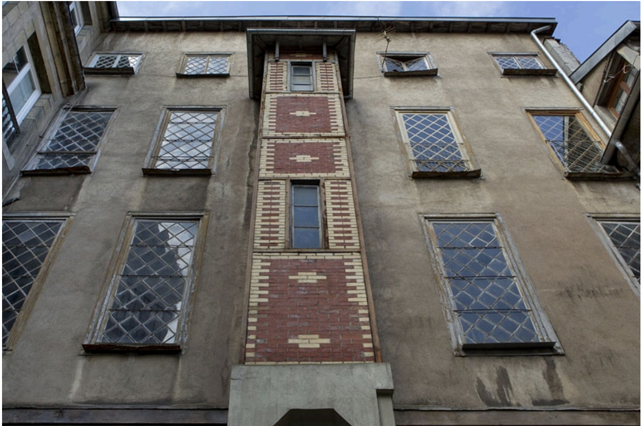
Vue d'ensemble de l'aile de l'escalier en fond de cour.