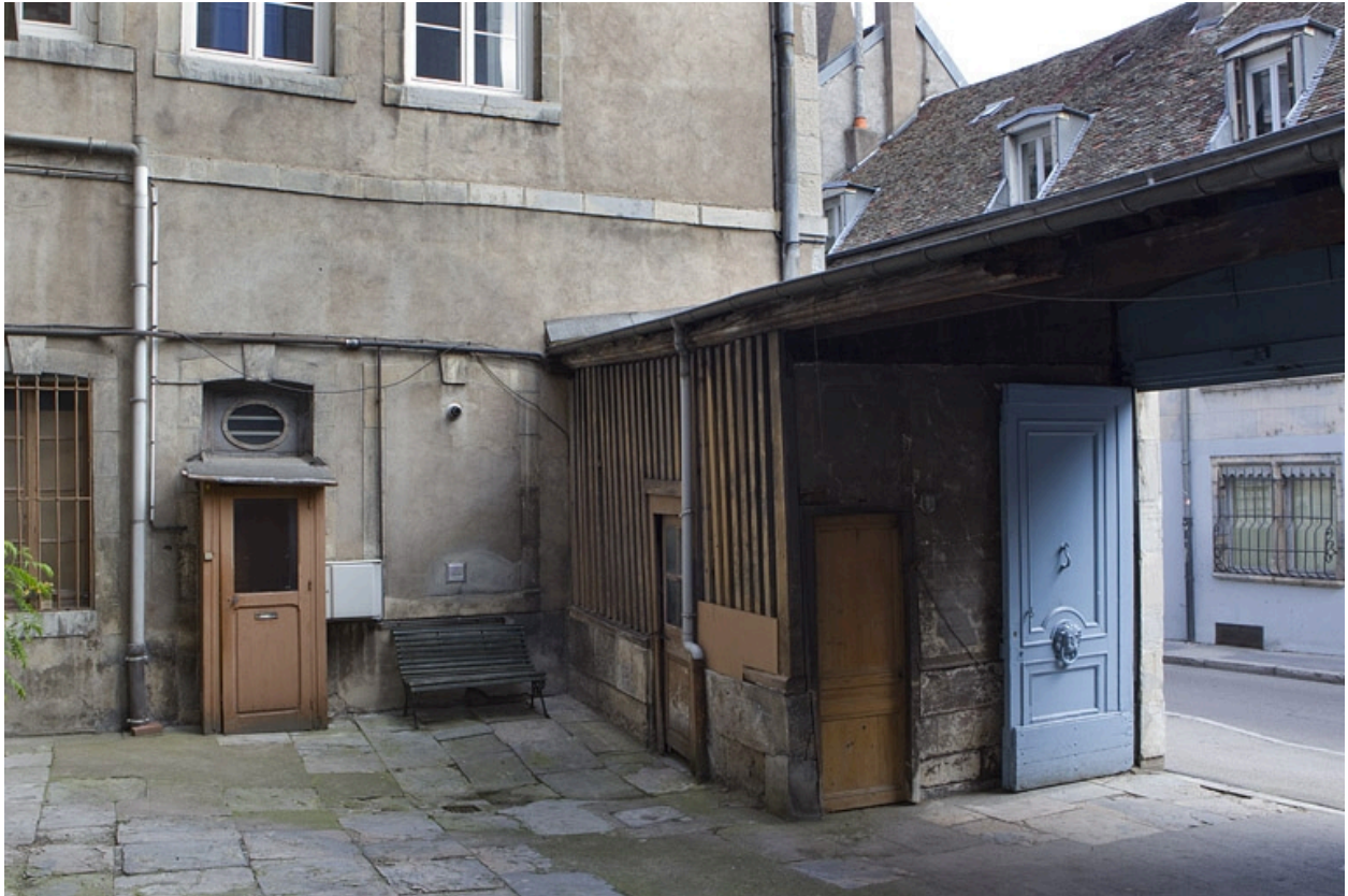
Détail du bûcher à droite du portail d'entrée.