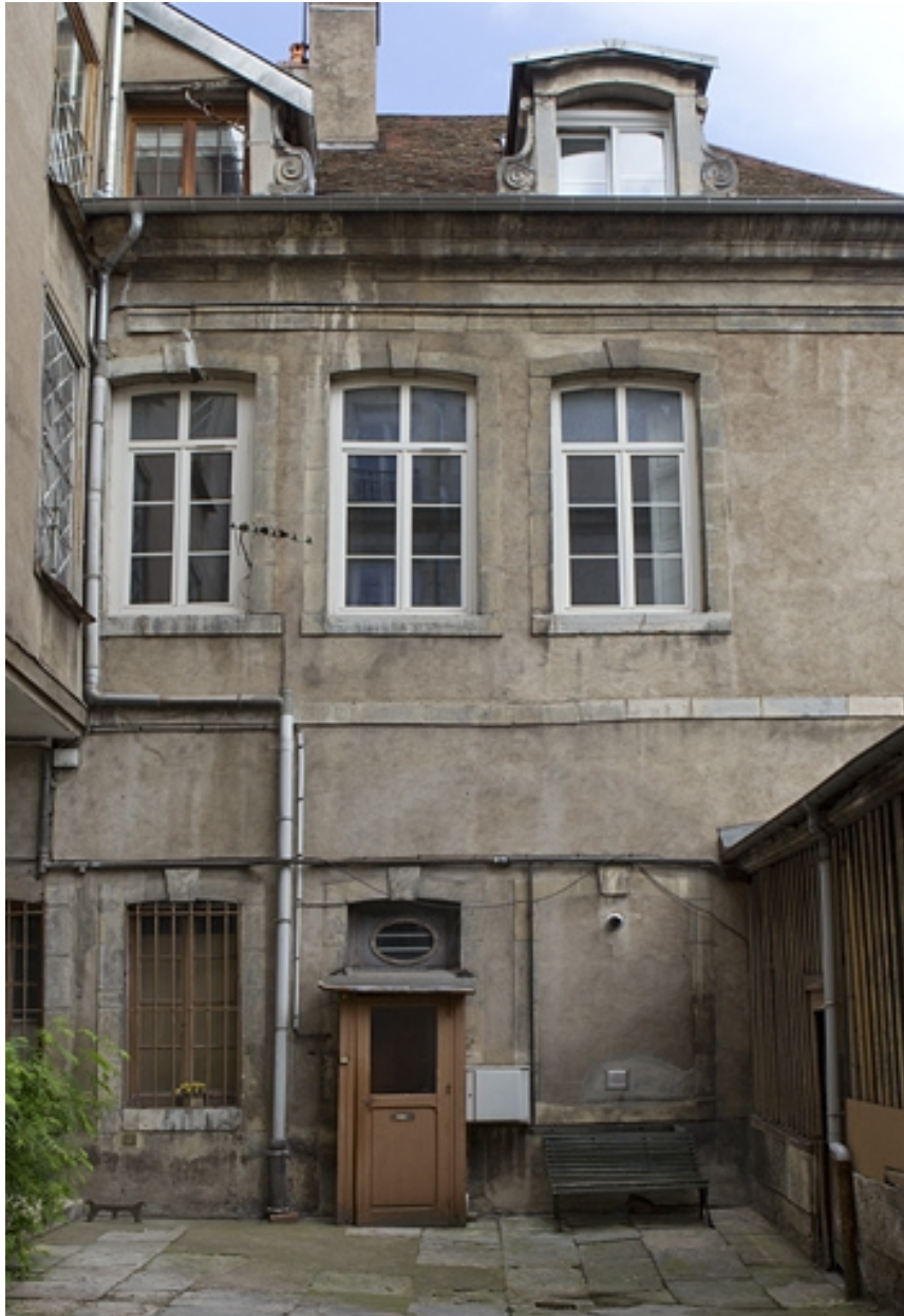
Vue d'ensemble de l'aile droite sur cour.