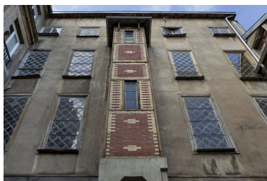
Vue d'ensemble de l'aile de l'escalier en fond de cour. IVR43_20102501005NUC2A