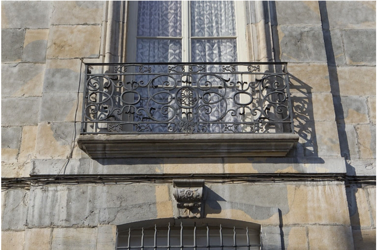
Aile droite : détail d'un garde-corps d'une fenêtre du premier étage.