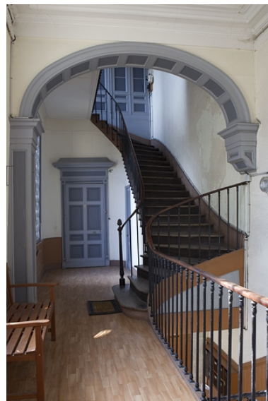
Vue des volées supérieures de l'escalier, de face.