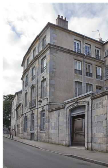
Vue d'ensemble de l'aile gauche depuis la rue, de trois quarts droit.