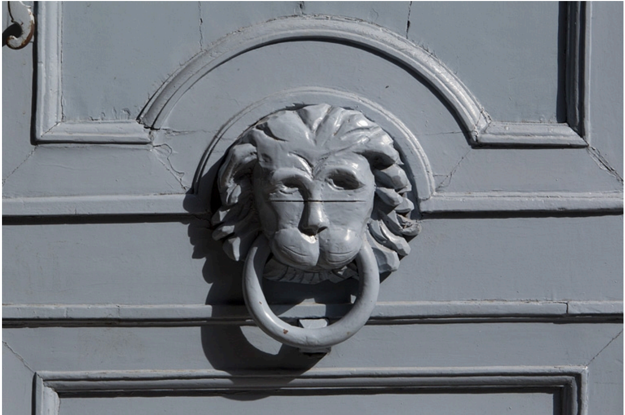
Portail d'entrée : détail du heurtoir.