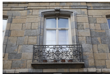
Aile droite : détail d'une fenêtre du premier étage. IVR43_20102501017NUC2A