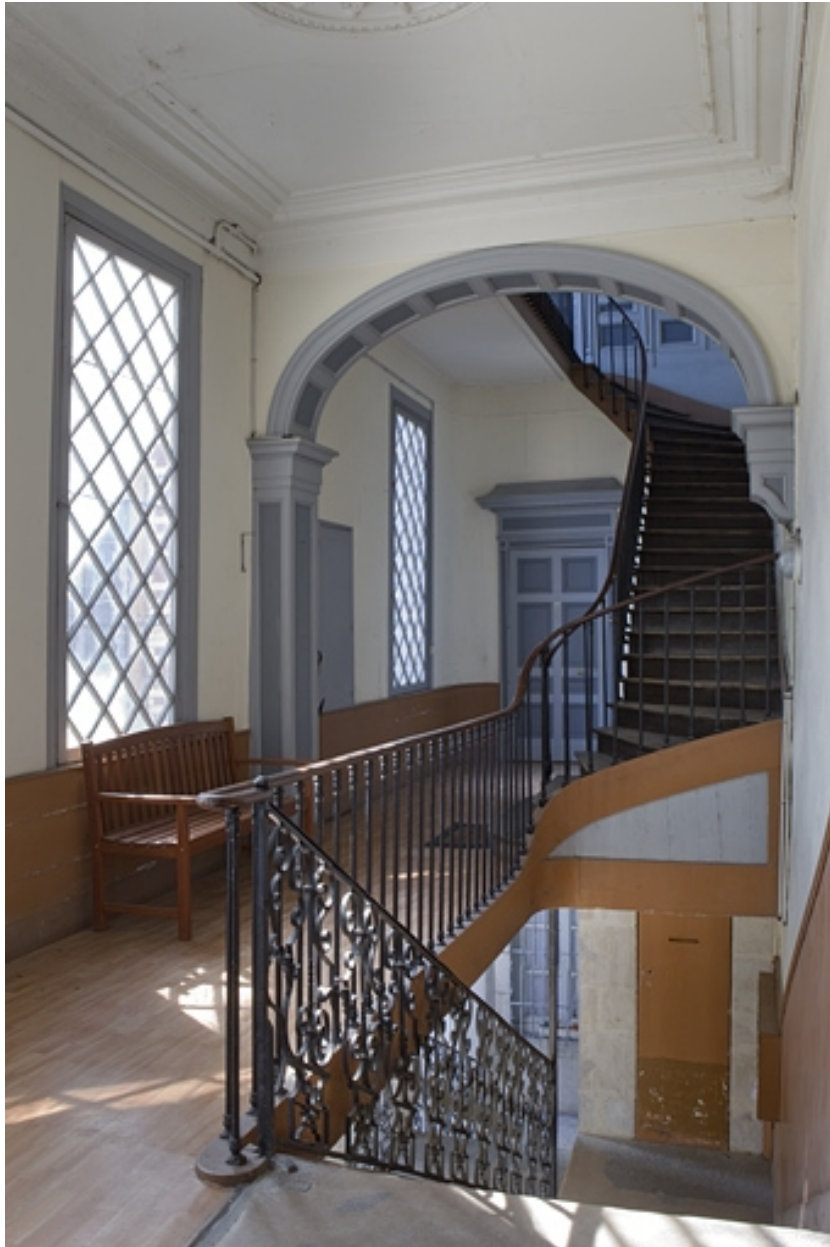
Vue des volées supérieures de l'escalier.