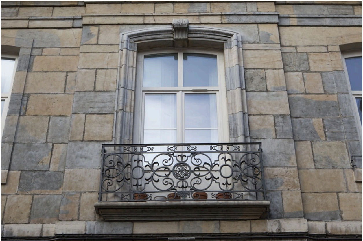
Aile droite : détail d'une fenêtre du premier étage.