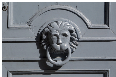
Portail d'entrée : détail du heurtoir.