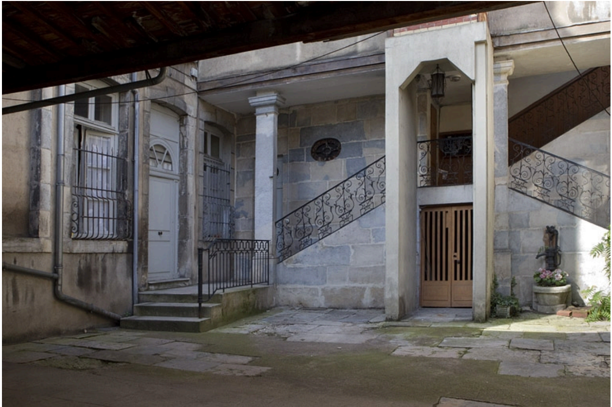
Vue du départ de l'escalier en fond de cour, de trois quarts droit.