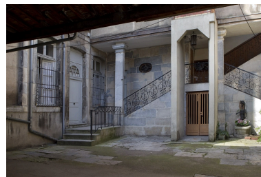
Vue du départ de l'escalier en fond de cour, de trois quarts droit. IVR43_20102501010NUC2A