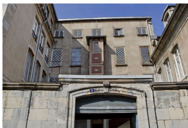
Vue d'ensemble de la clôture sur rue et de l'aile de l'escalier en fond de cour.