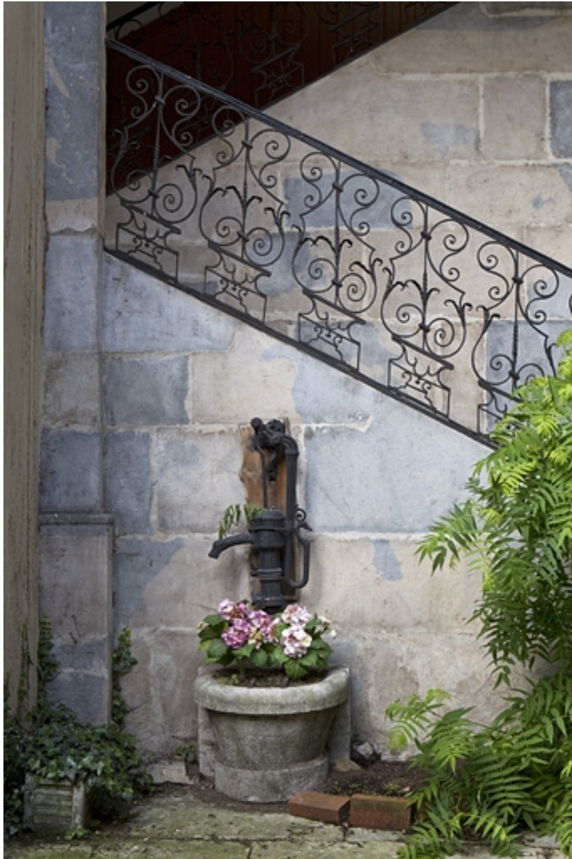
Escalier, première volée : détail de la rampe en ferronnerie et de la borne fontaine.