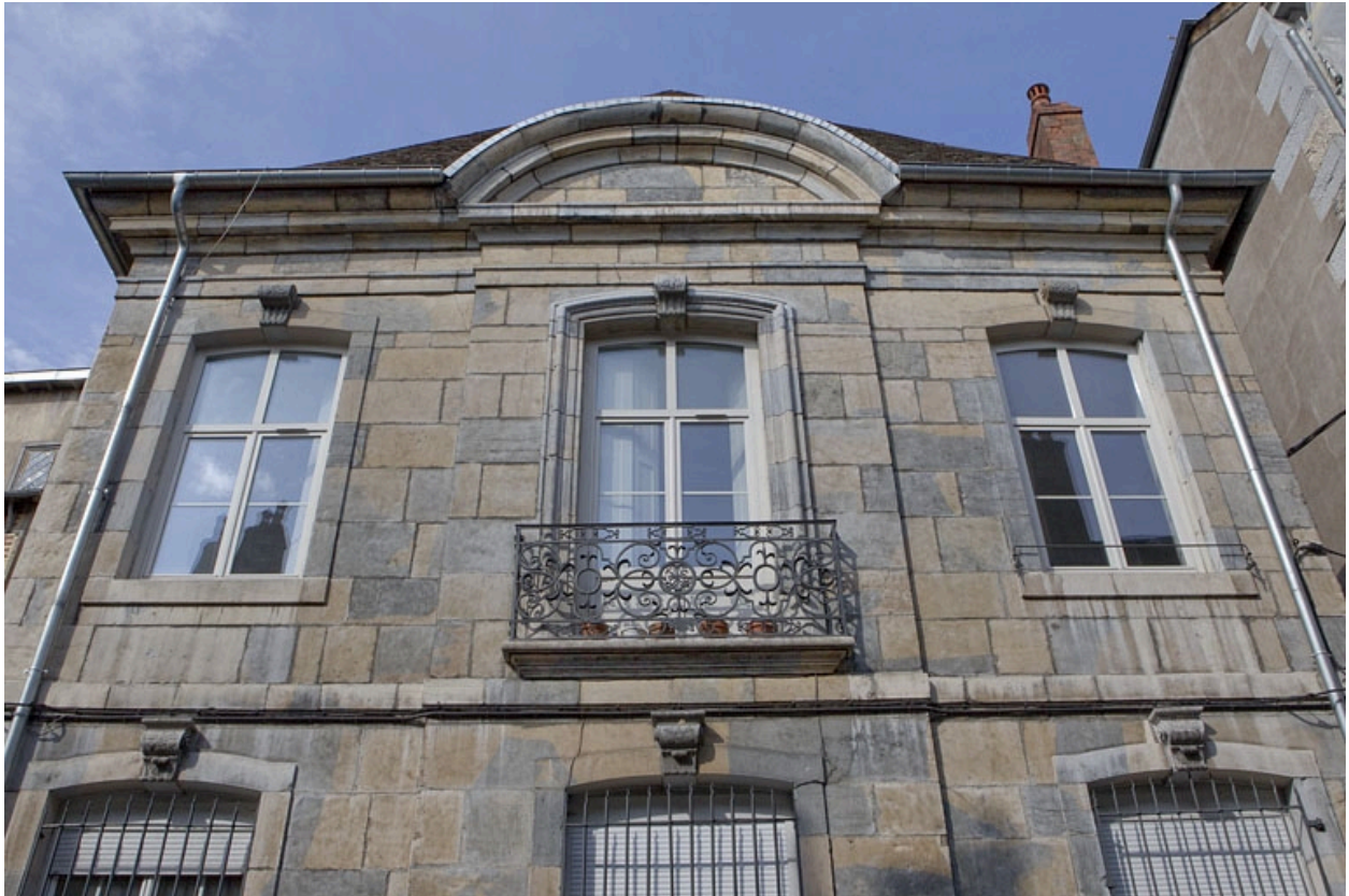
Aile droite : partie supérieure de la façade sur rue surmontée d'un fronton cintré.