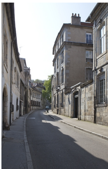
Vue d'ensemble depuis la rue, de trois quarts droit.