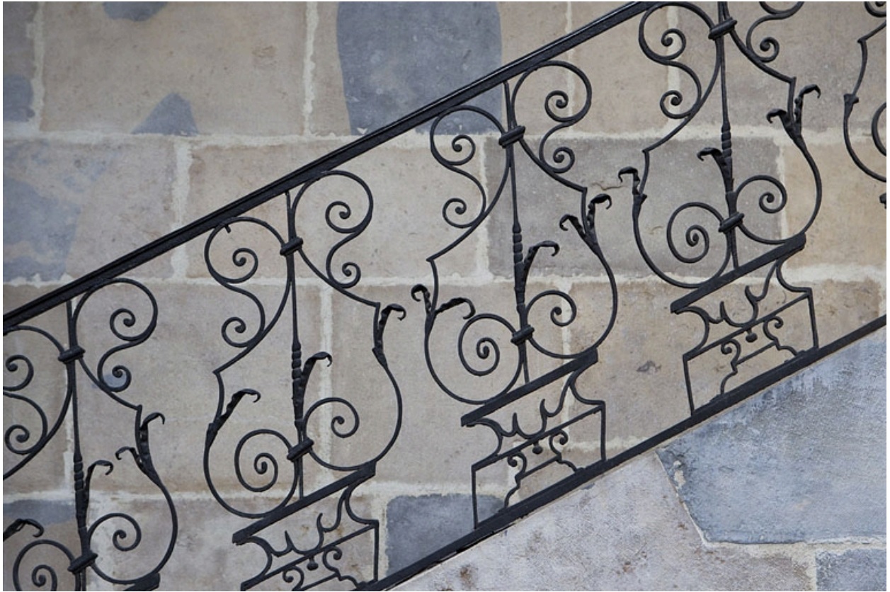
Escalier, première volée : détail de la rampe en ferronnerie.