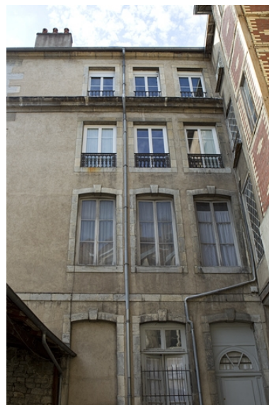
Vue d'ensemble de l'aile gauche sur cour. IVR43_20102501006NUC2A