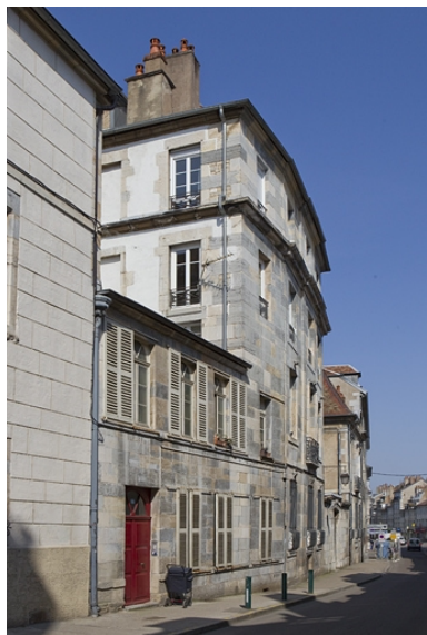
Vue d'ensemble depuis la rue, de trois quarts gauche. IVR43_20102501001NUC2A