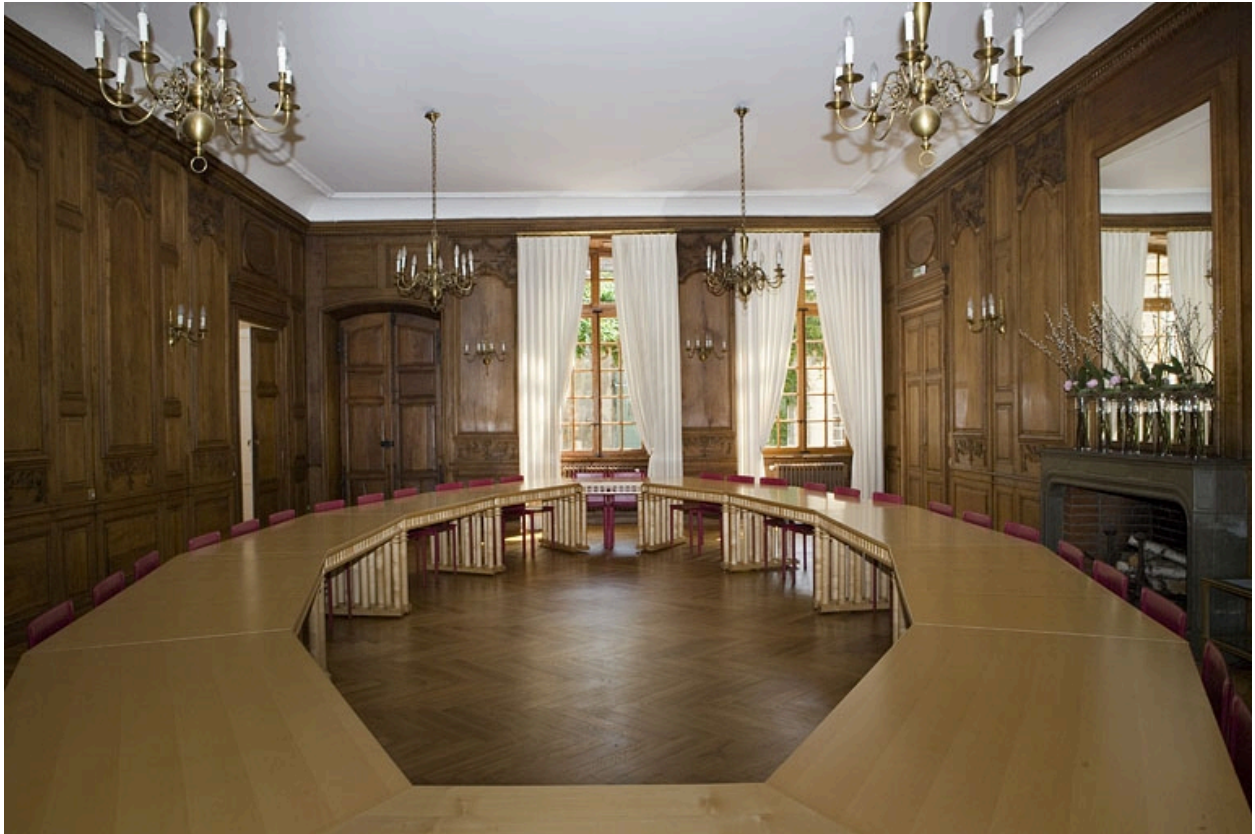
Intérieur : vue d'ensemble de la grande salle depuis le fond, de face.