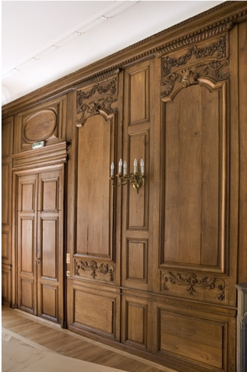
Intérieur : lambris de la grande salle à gauche de la cheminée, de trois quarts.