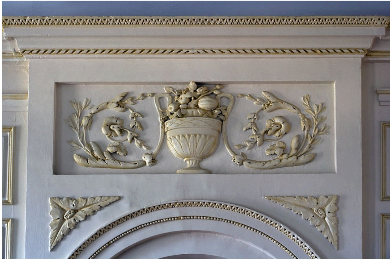
Intérieur : chambre, détail du décor au-dessus de la niche du poêle.