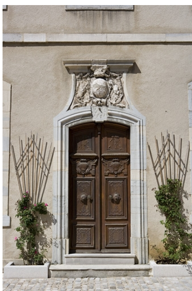
Détail de la porte d'entrée du logis.