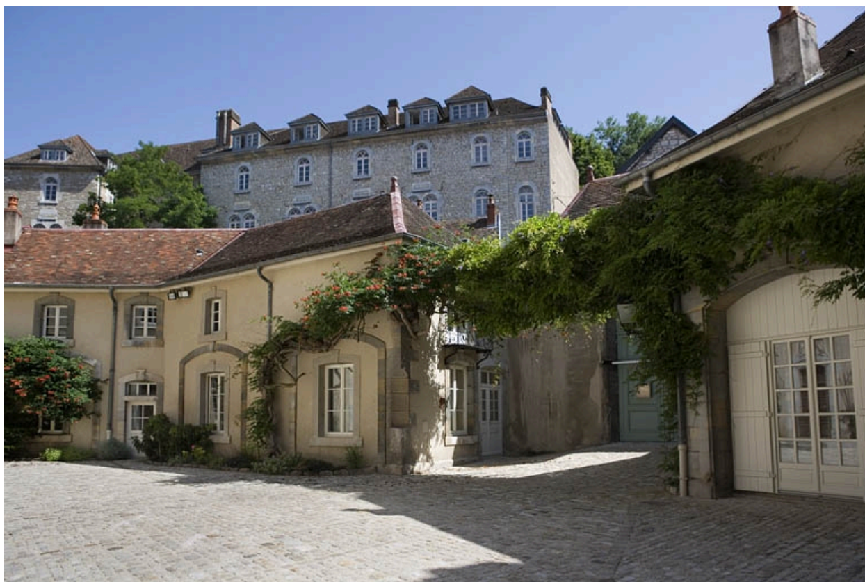
Détail des communs, partie gauche de trois quart droit.