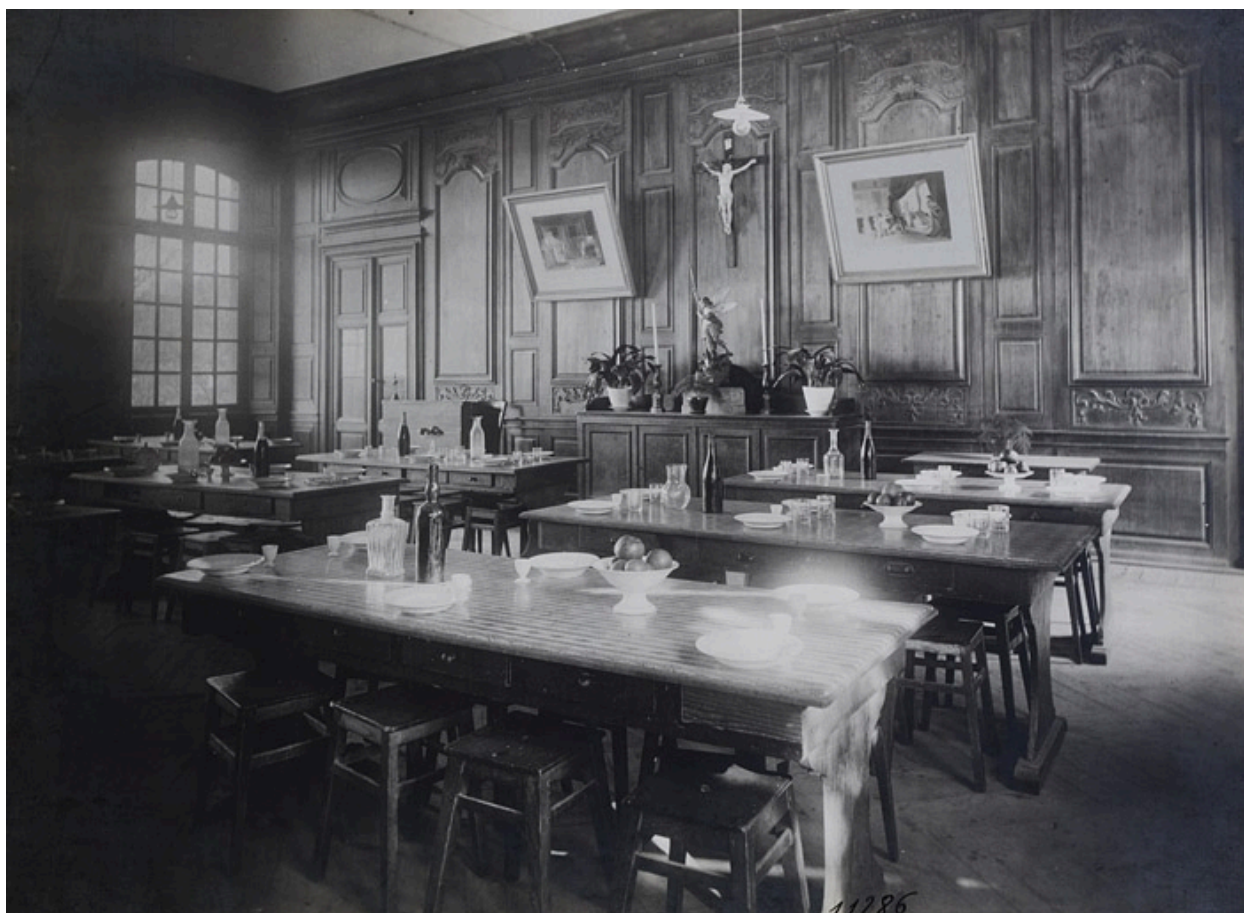
Photographie du grand salon, transformé en réfectoire, lors de l'occupation des lieux par l'école Notre-Dame. Photographie ancienne, 1e moitié 20e siècle.