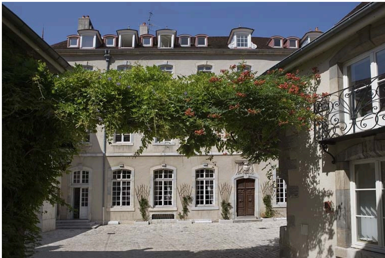
Vue d'ensemble du logis depuis le portail d'entrée.