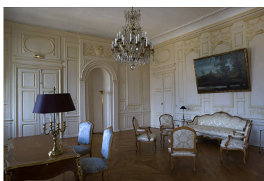
Intérieur : vue d'ensemble de la chambre depuis l'entrée vers la grande salle. IVR43_20072500494NUCA