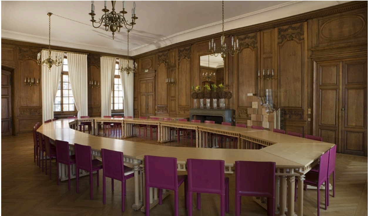
Intérieur : vue d'ensemble de la grande salle depuis le fond de la pièce.