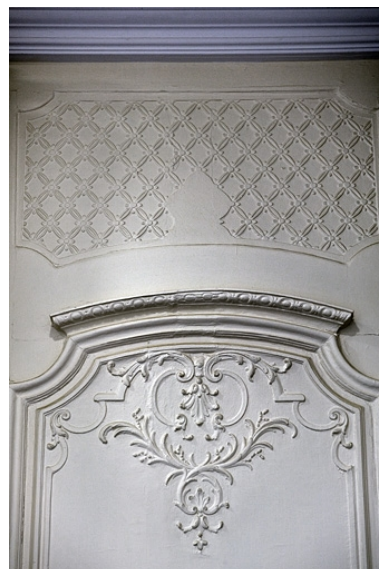
Intérieur : détail d'un lambris d'un ancien cabinet.