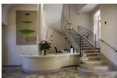
Vue d'ensemble du hall d'entrée.