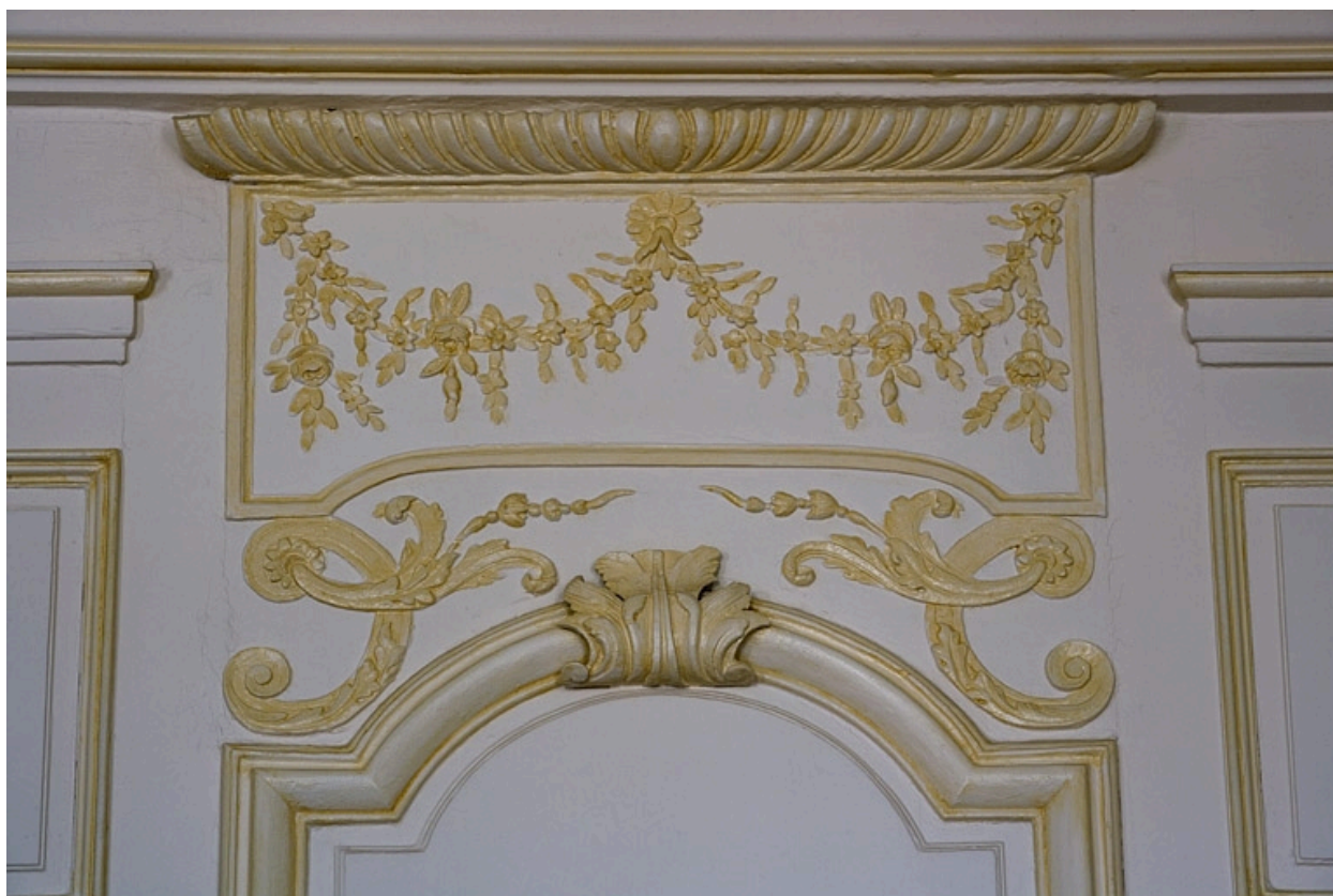
Intérieur : lambris de la chambre, détail du décor à la partie supérieure d'un panneau.