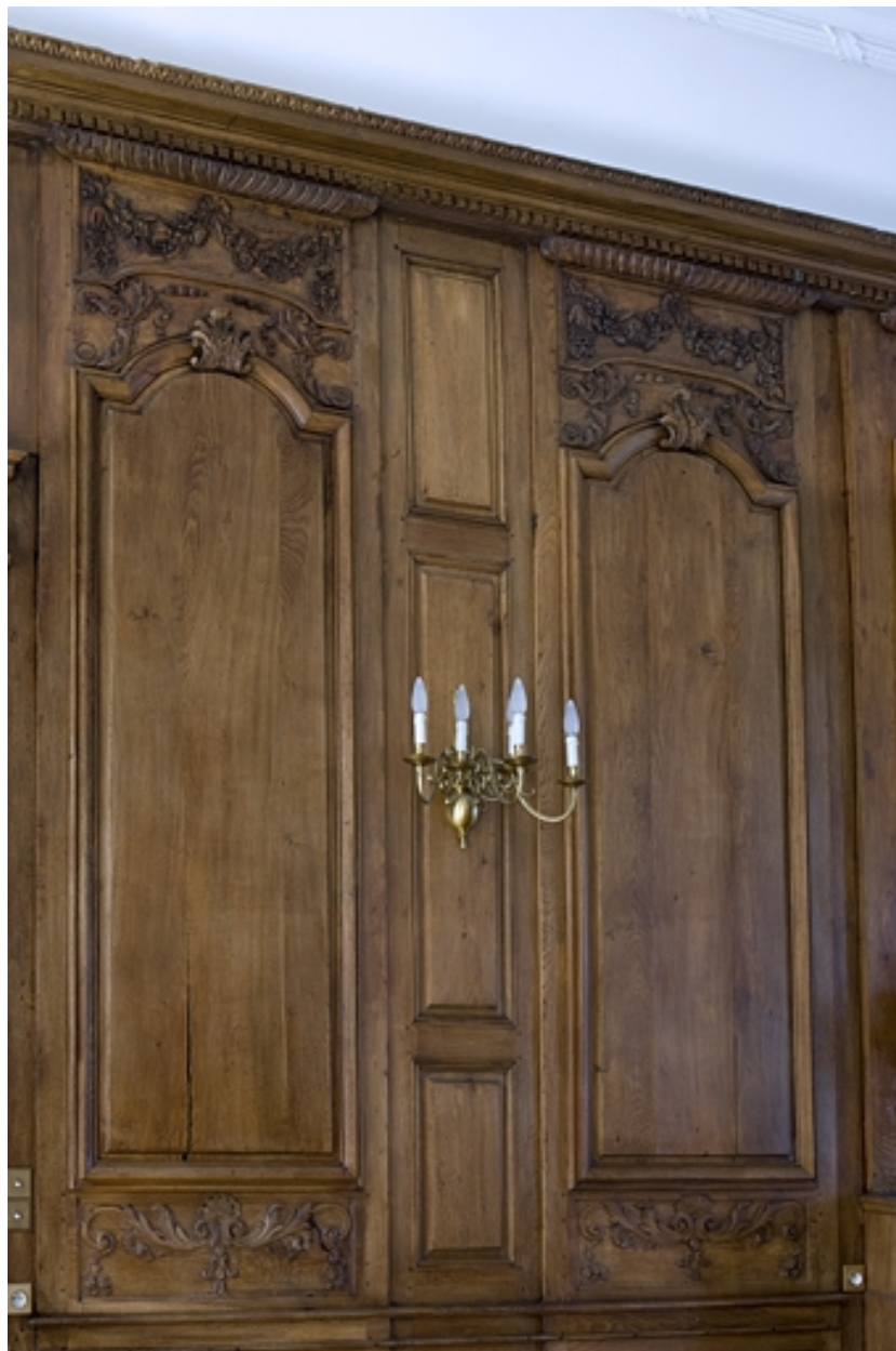
Intérieur : lambris de la grande salle, détail de deux panneaux.