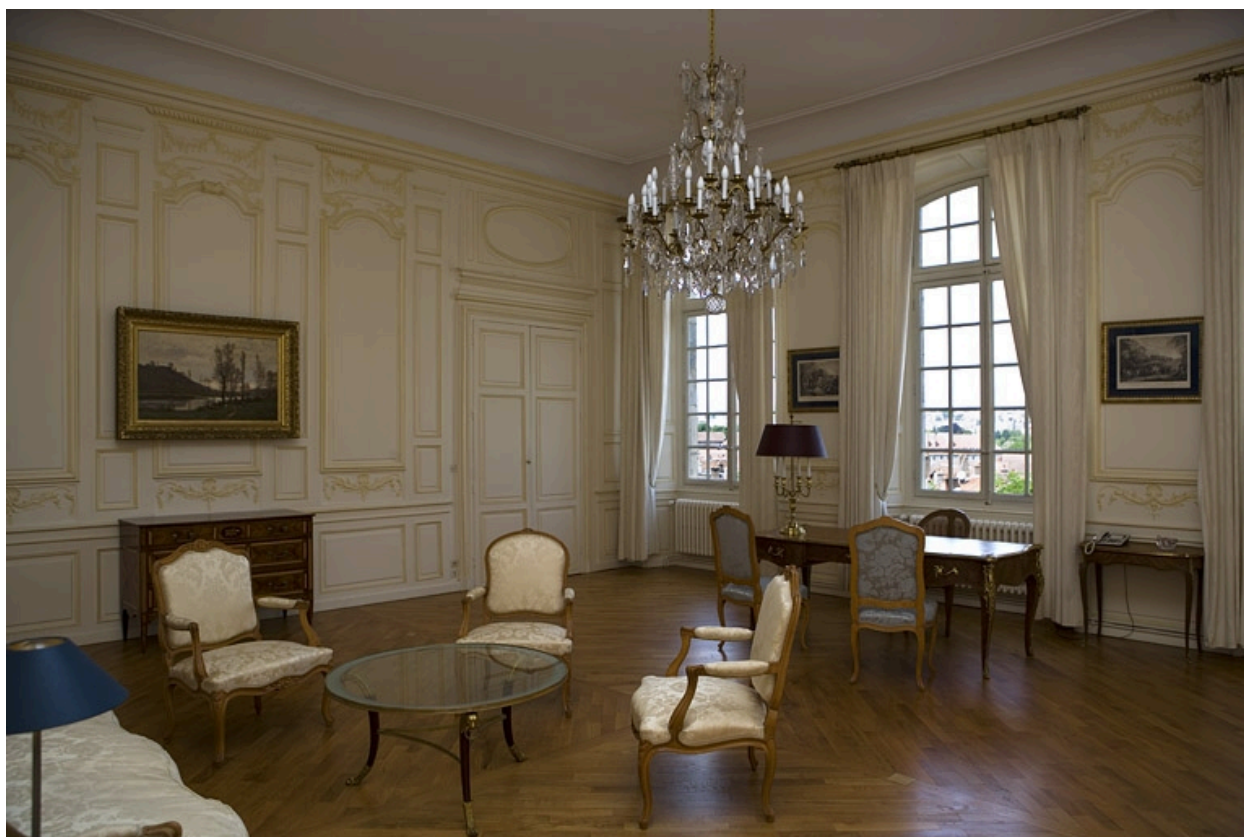
Intérieur : vue d'ensemble de la chambre depuis l'entrée vers l'antichambre.