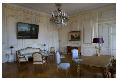
Intérieur : vue d'ensemble de la chambre depuis le fond de la pièce, de trois quarts gauche. IVR43_20072500495NUCA