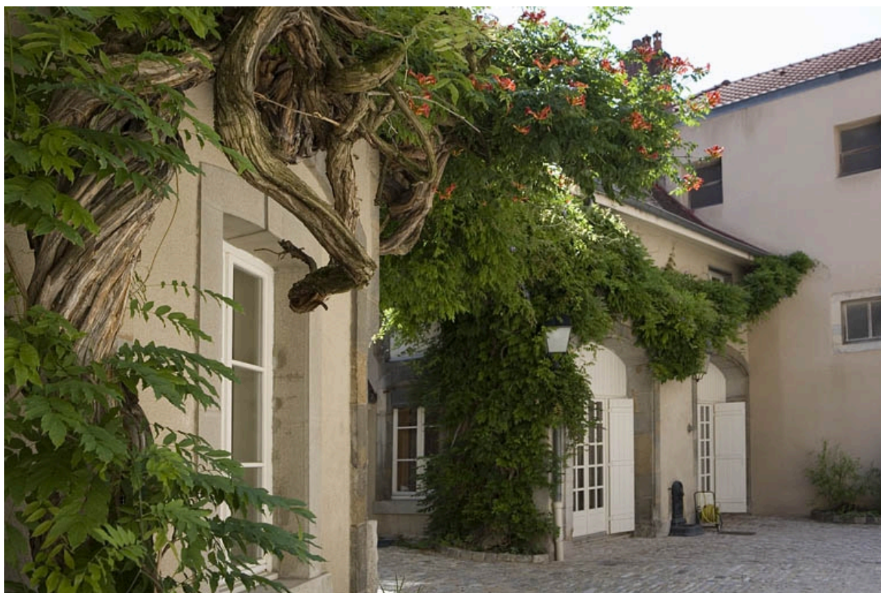
Détail des communs, vue rapprochée de trois quarts gauche.