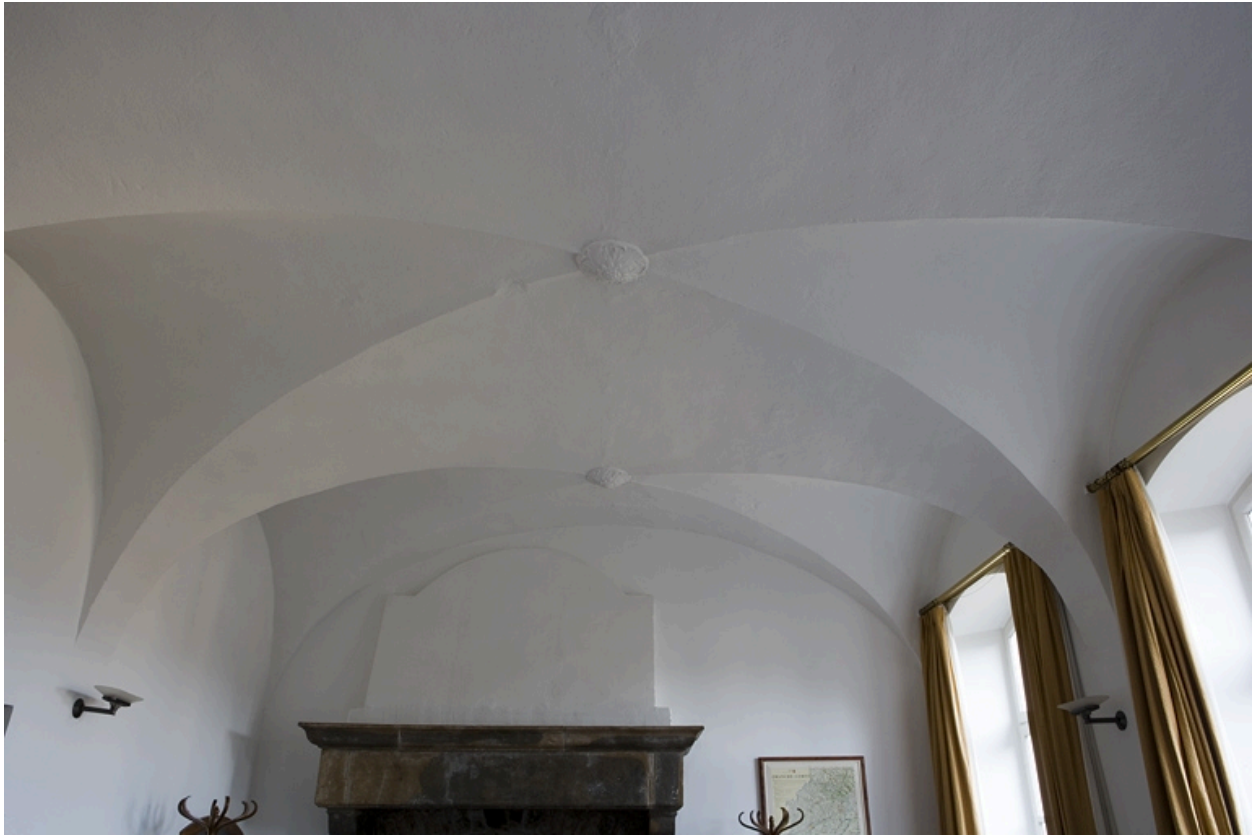
Intérieur : détail des voûtes d'arêtes de l'ancienne cuisine.