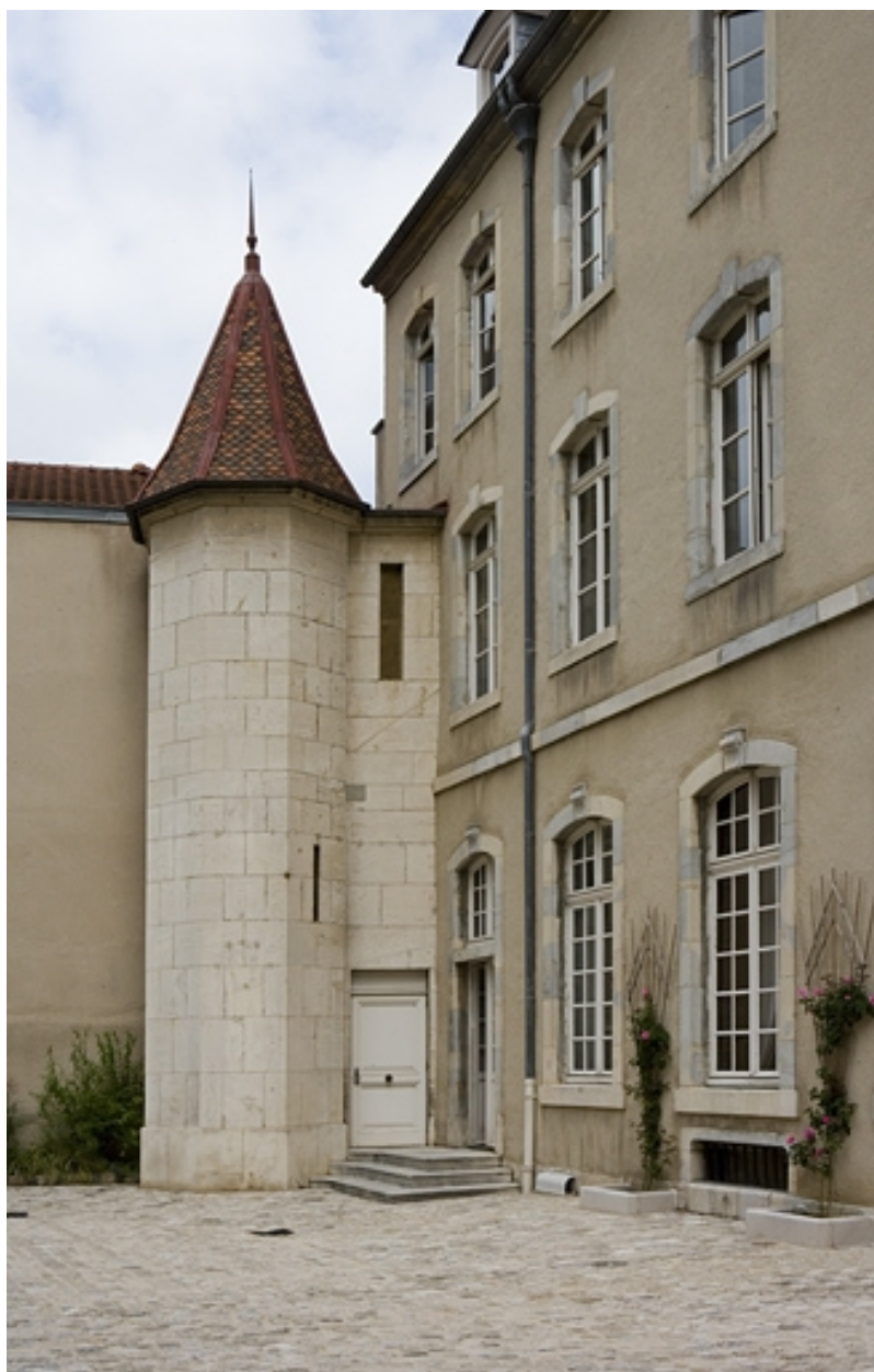
Façade antérieure, détail de la tour d'escalier, vue éloignée.