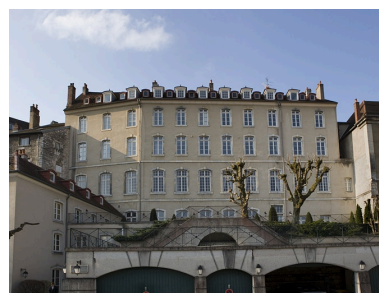
Vue d'ensemble de la façade postérieure. IVR43_20072500478NUCA