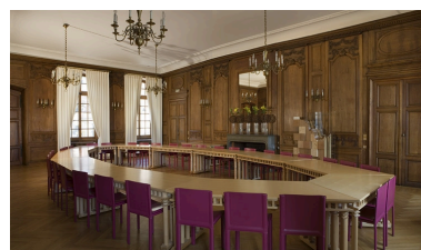
Intérieur : vue d'ensemble de la grande salle depuis le fond de la pièce.