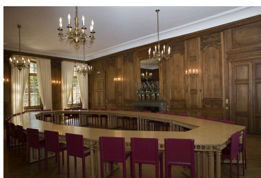
Intérieur : vue d'ensemble de la grande salle depuis le fond, de trois quarts gauche.