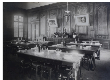
Photographie du grand salon, transformé en réfectoire, lors de l'occupation des lieux par l'école Notre-Dame. Photographie ancienne, 1e moitié 20e siècle. IVR43_20072500576NUCA