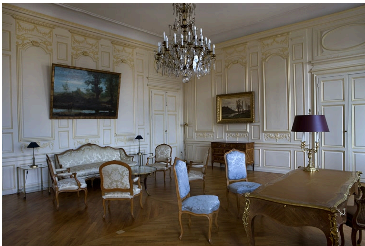
Intérieur : vue d'ensemble de la chambre depuis le fond de la pièce, de trois quarts gauche.