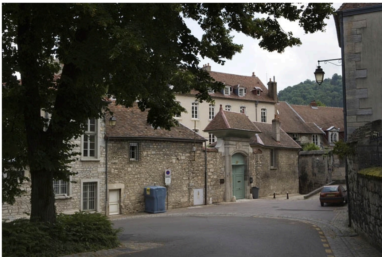
Vue d'ensemble du portail d'entrée depuis l'extérieur.