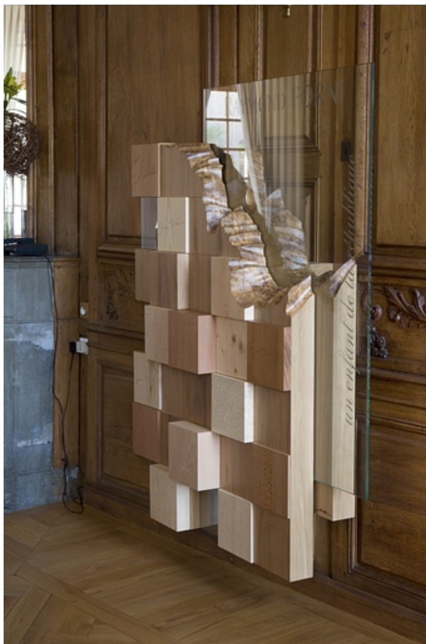
Intérieur : vue d'ensemble de la sculpture dédiée au président Raymond Forni, de trois-quarts.