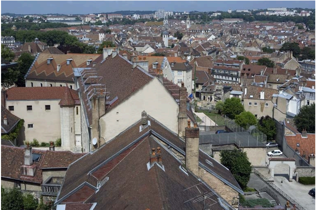
Vue d'ensemble éloignée de profil depuis les locaux du CRDP.