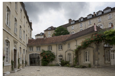
Vue d'ensemble de la partie gauche des communs.