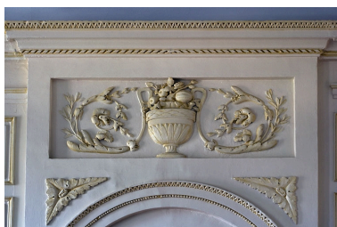
Intérieur : chambre, détail du décor au-dessus de la niche du poêle. IVR43_20072500500NUCA