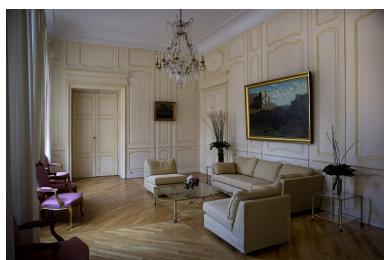
Intérieur : vue d'ensemble de l'antichambre depuis l'entrée.