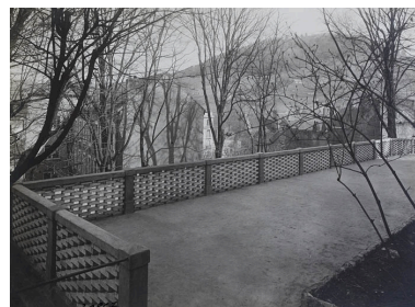
Photographie ancienne montrant la terrasse (disparue) derrière l'édifice. Photographie ancienne, 1e moitié 20e siècle. IVR43_20072500578NUCA