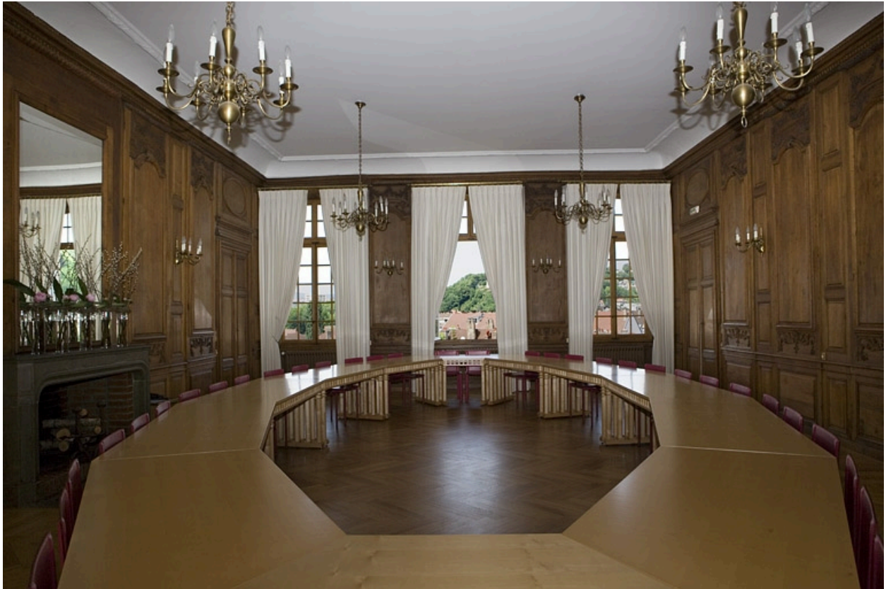
Intérieur : vue d'ensemble de la grande salle depuis l'entrée sur cour, de face.