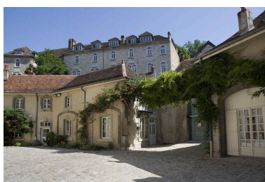
Détail des communs, partie gauche de trois quart droit.