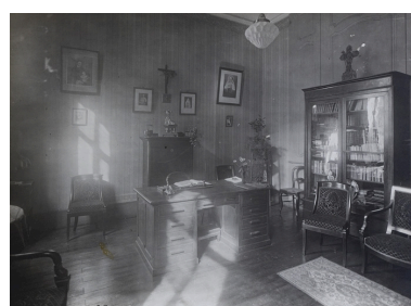
Photographie ancienne montrant l'antichambre transformée en bureau pour la directrice de l'école Notre-Dame. Photographie ancienne, 1e moitié 20e siècle.