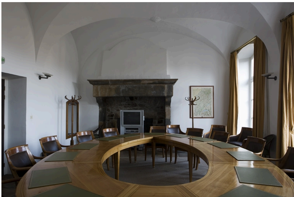
Intérieur : vue d'ensemble de l'ancienne cuisine.