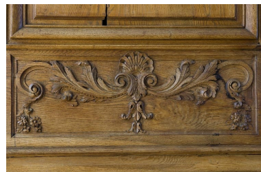
Intérieur : lambris de la grande salle, détail d'un petit panneau sculpté.