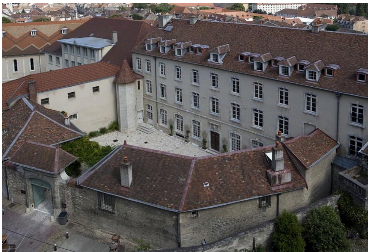
Vue d'ensemble rapprochée des bâtiments autour de la cour.