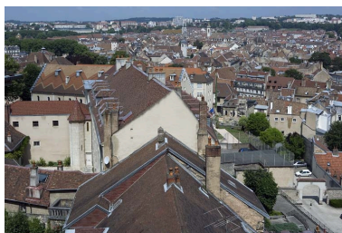
Vue d'ensemble éloignée de profil depuis les locaux du CRDP.