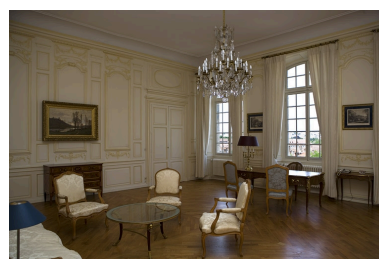
Intérieur : vue d'ensemble de la chambre depuis l'entrée vers l'antichambre. IVR43_20072500493NUCA