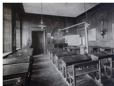
Photographie ancienne montrant la chambre, transformée en salle de classe, lors de l'occupation des lieux par l'école Notre-Dame. Photographie ancienne, 1e moitié 20e siècle. Phot.