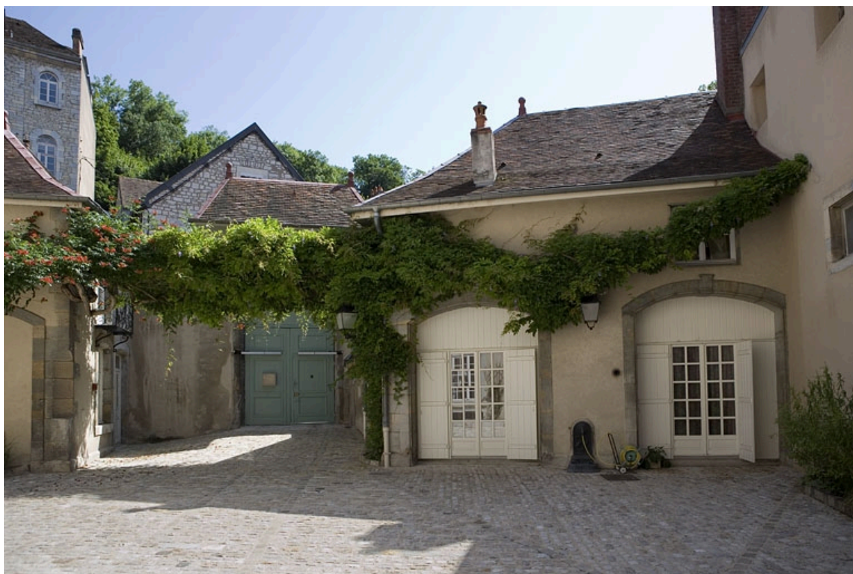
Détail des communs, partie droite de face.