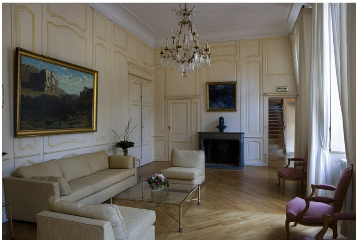
Intérieur : vue d'ensemble de l'antichambre depuis le fond de la pièce.