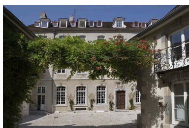
Vue d'ensemble du logis depuis le portail d'entrée.