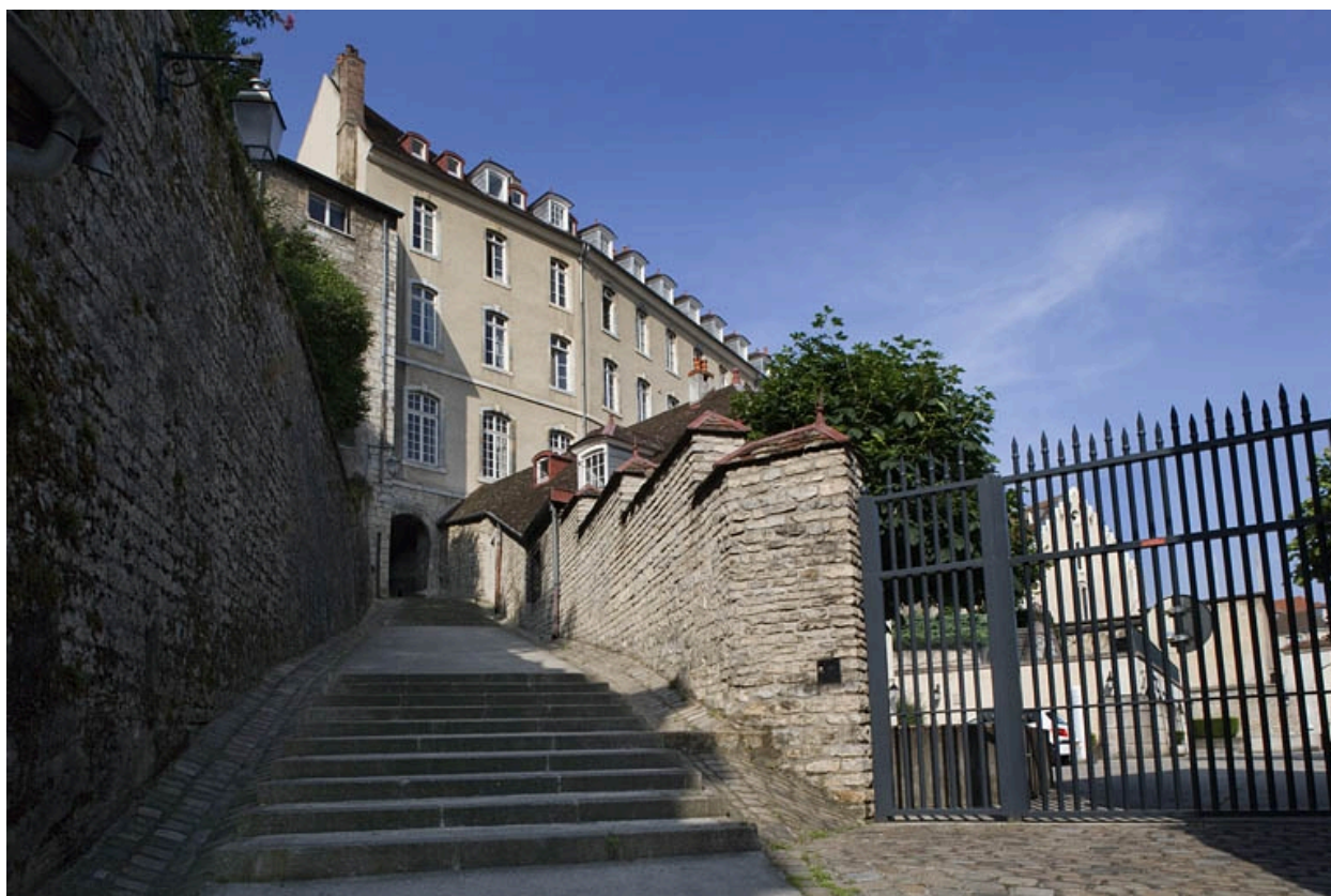
Vue de la façade postérieure depuis la rue du Chambrier.