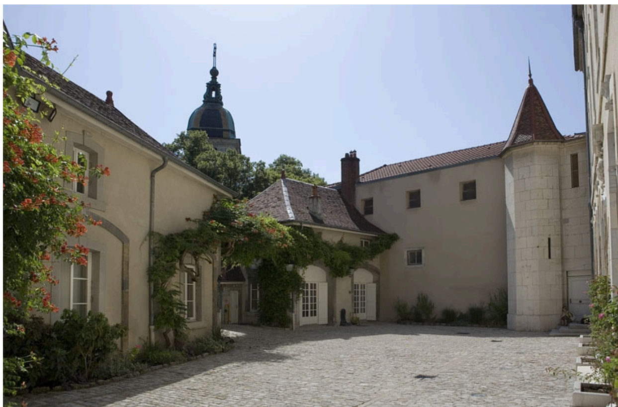
Détail des communs, de trois quarts gauche.