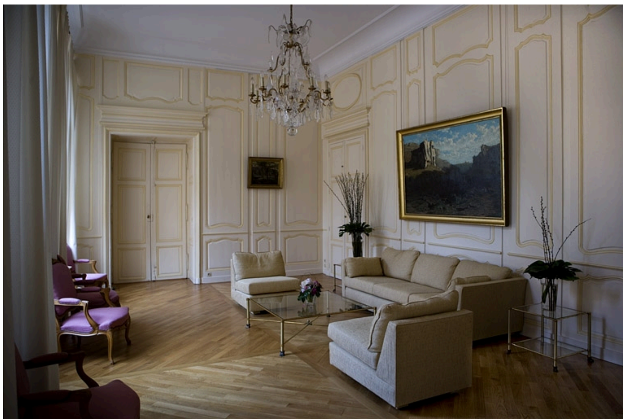
Intérieur : vue d'ensemble de l'antichambre depuis l'entrée.