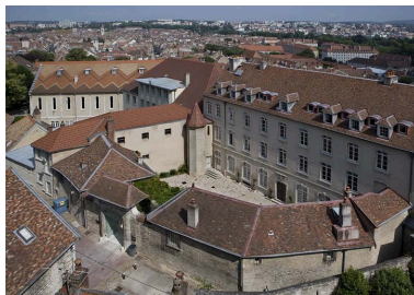
Vue d'ensemble des bâtiments autour de la cour. IVR43_20072500485NUCA