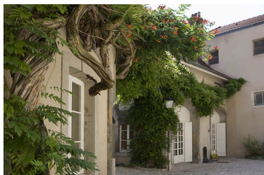
Détail des communs, vue rapprochée de trois quarts gauche.