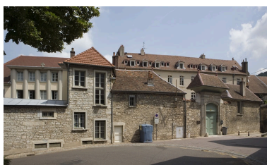
Vue d'ensemble rapprochée de la clôture et du portail depuis la rue. IVR43_20072500489NUCA