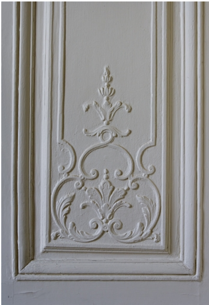
Intérieur : lambris d'un ancien cabinet, détail du décor à la partie inférieure d'un panneau.