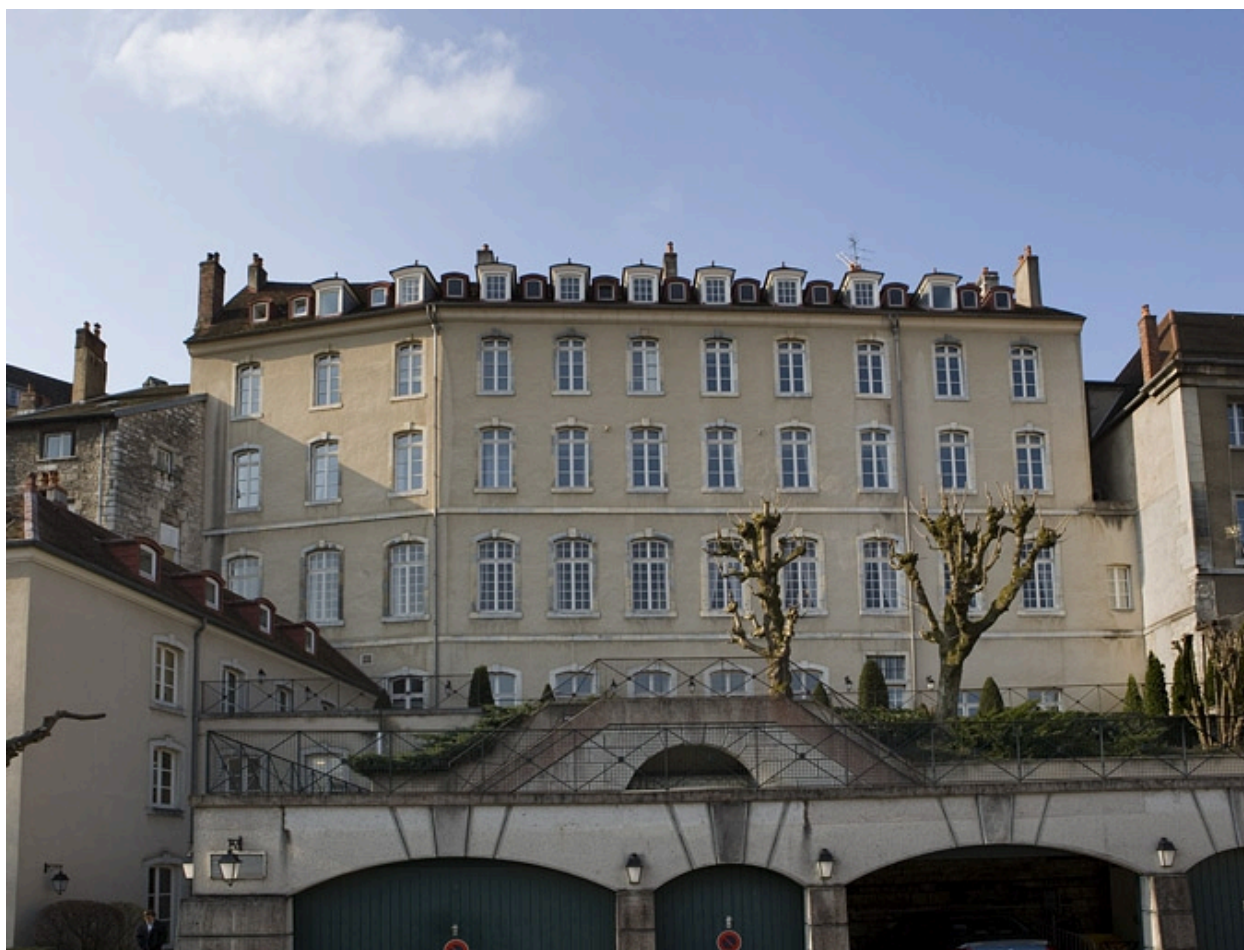
Vue d'ensemble de la façade postérieure.