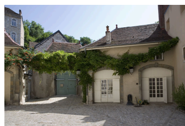
Détail des communs, partie droite de face.