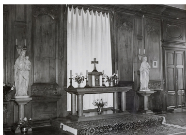
Photographie ancienne montrant le grand salon transformé en chapelle, lors de l'occupation des lieux par l'école Notre-Dame. Photographie ancienne, 1e moitié 20e siècle.