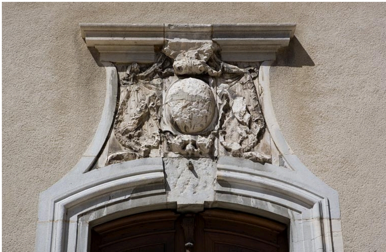
Détail des armoiries bûchées sur la porte d'entrée du logis.