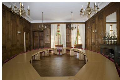
Intérieur : vue d'ensemble de la grande salle depuis le fond, de face.