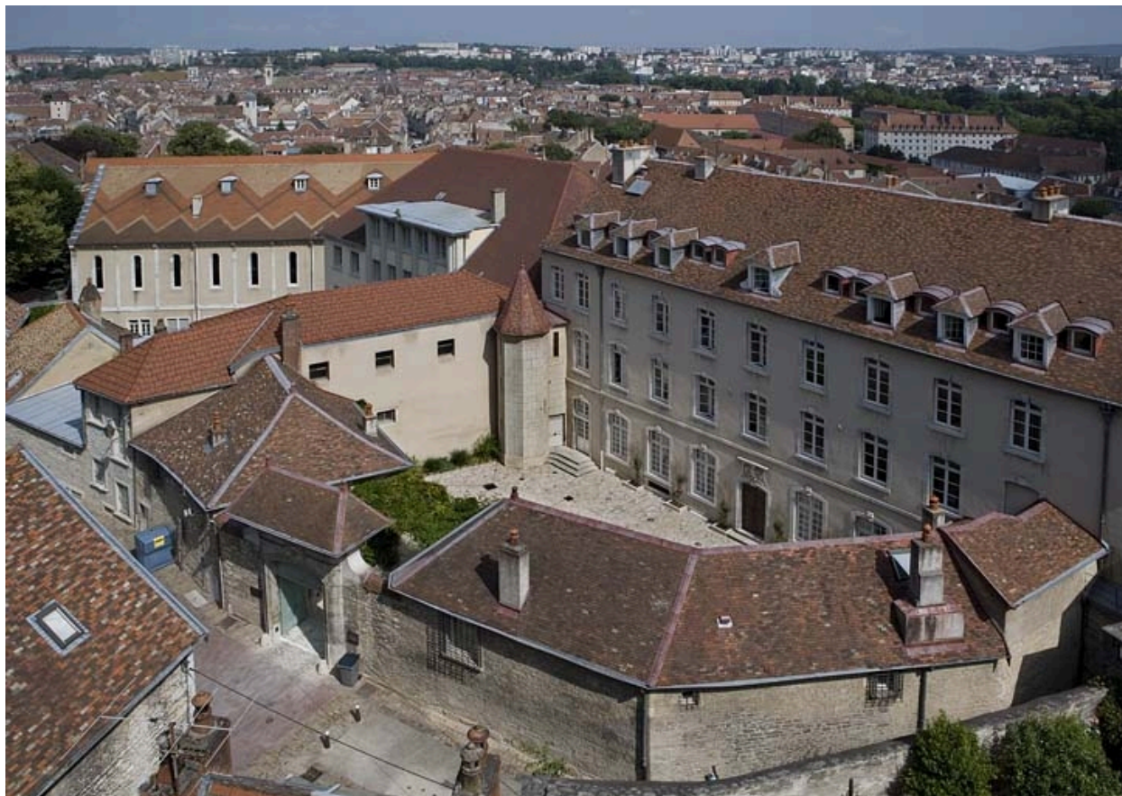
Vue d'ensemble des bâtiments autour de la cour.