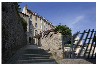
Vue de la façade postérieure depuis la rue du Chambrier.