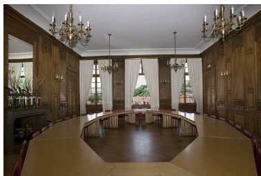
Intérieur : vue d'ensemble de la grande salle depuis l'entrée sur cour, de face.