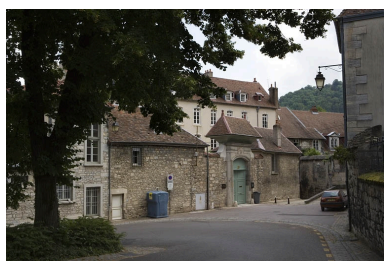
Vue d'ensemble du portail d'entrée depuis l'extérieur.