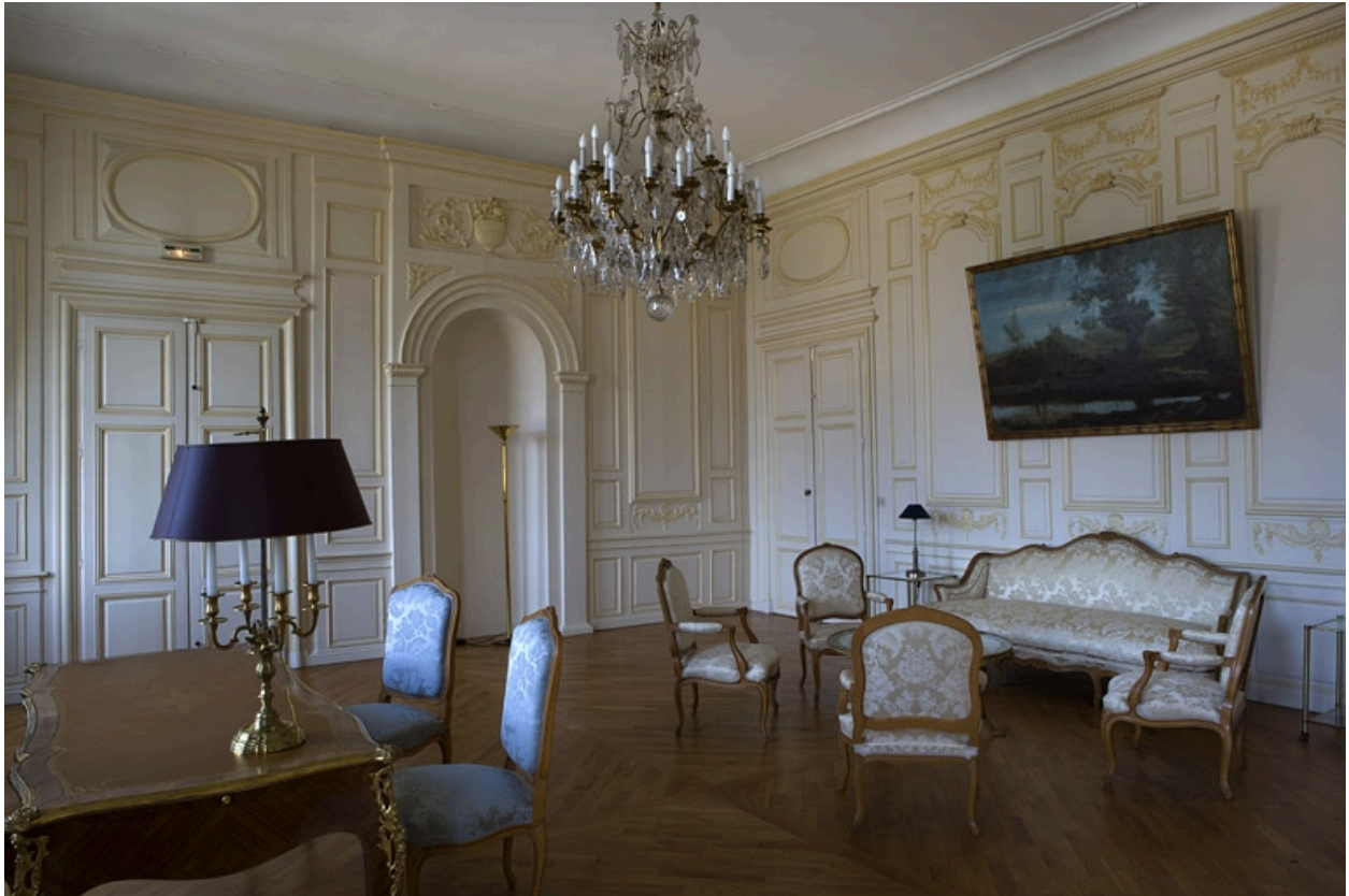
Intérieur : vue d'ensemble de la chambre depuis l'entrée vers la grande salle.