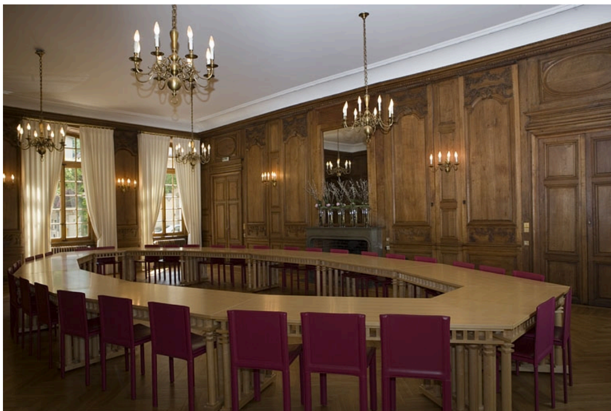
Intérieur : vue d'ensemble de la grande salle depuis le fond, de trois quarts gauche.