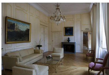
Intérieur : vue d'ensemble de l'antichambre depuis le fond de la pièce.