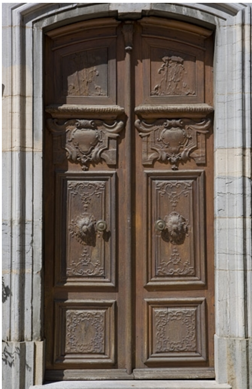
Détail des vantaux de la porte d'entrée du logis.