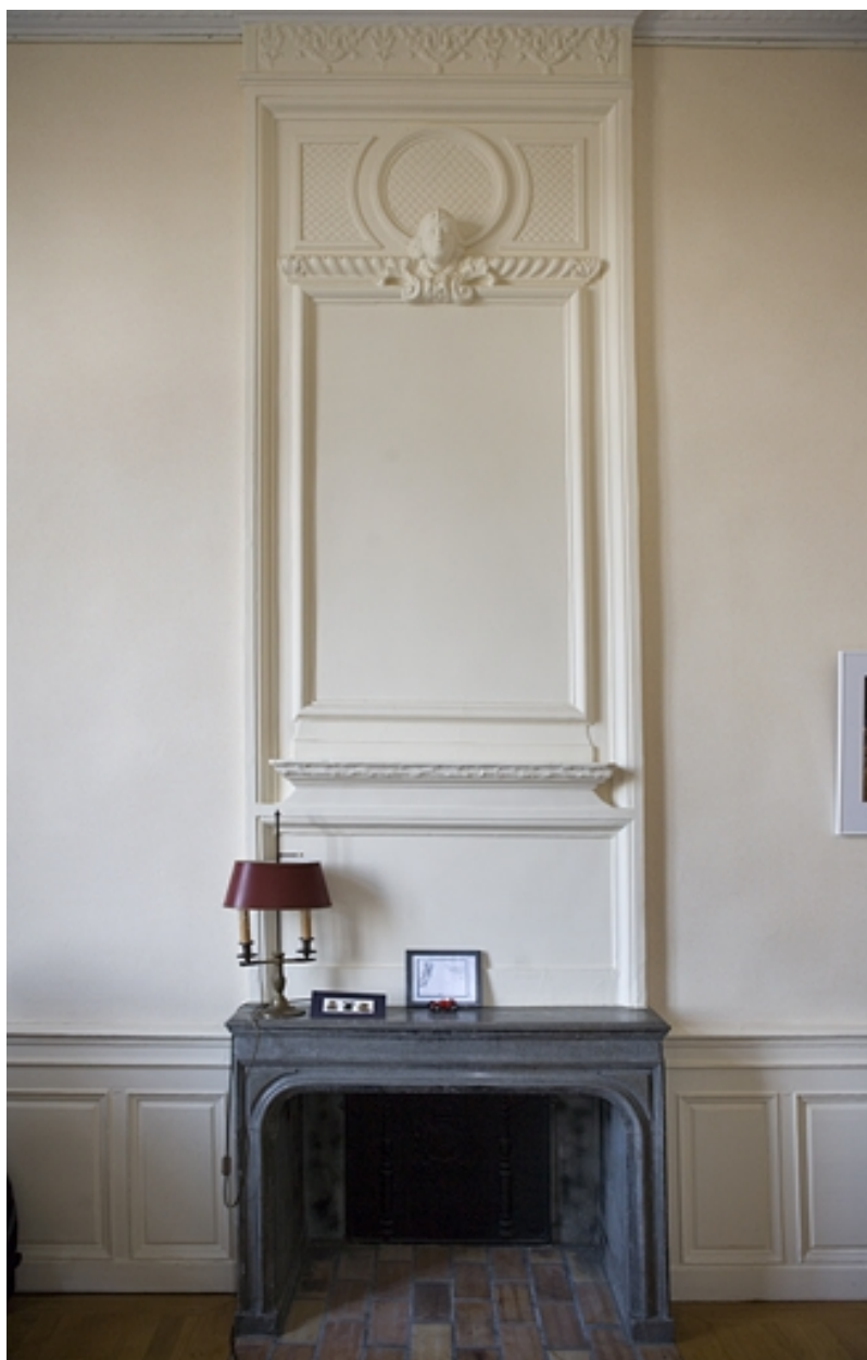
Intérieur : détail d'une cheminée dans une petite pièce du rez-de-chaussée.