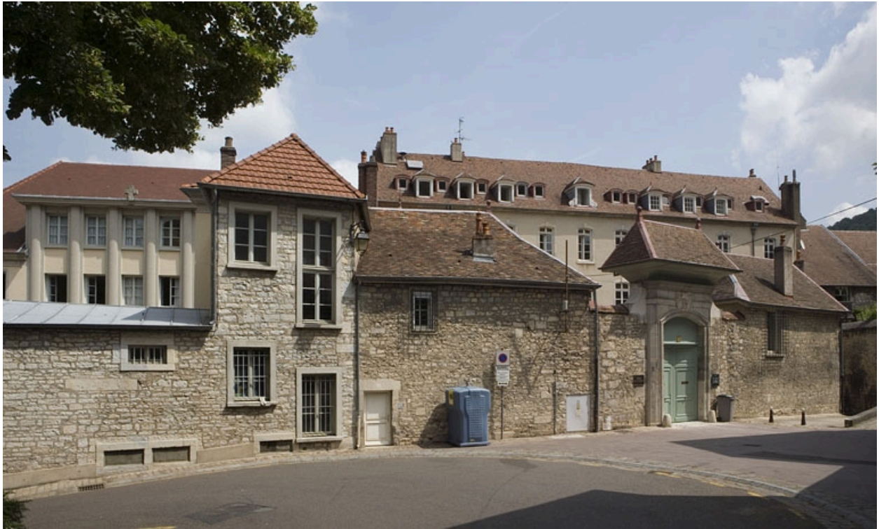
Vue d'ensemble rapprochée de la clôture et du portail depuis la rue.