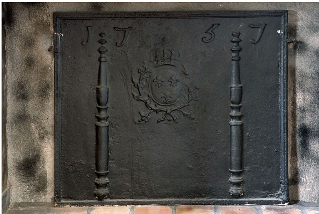
Intérieur : détail de la plaque de cheminée de l'ancienne cuisine.