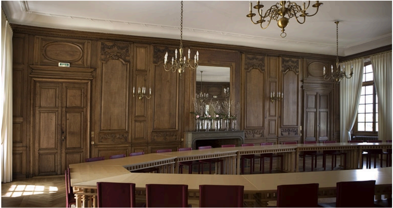
Intérieur : vue d'ensemble de la grande salle, depuis l'entrée vers l'antichambre.