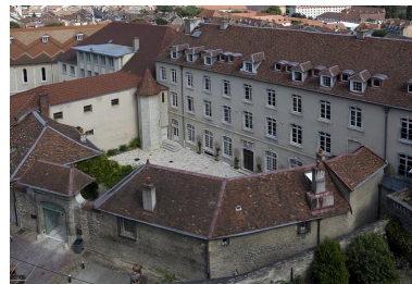
Vue d'ensemble rapprochée des bâtiments autour de la cour. IVR43_20072500486NUCA