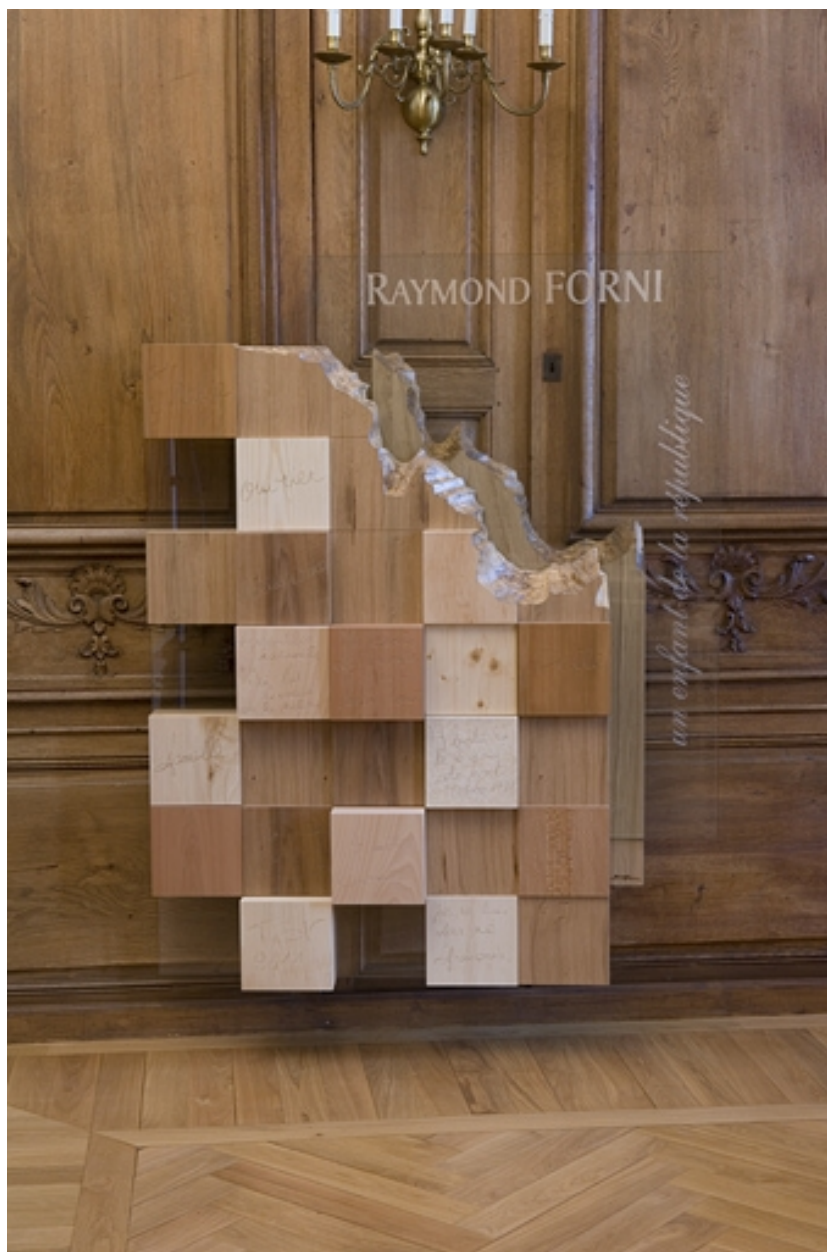
Intérieur : vue d'ensemble de la sculpture dédiée au président Raymond Forni, de face.