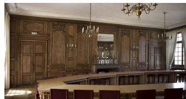
Intérieur : vue d'ensemble de la grande salle, depuis l'entrée vers l'antichambre.