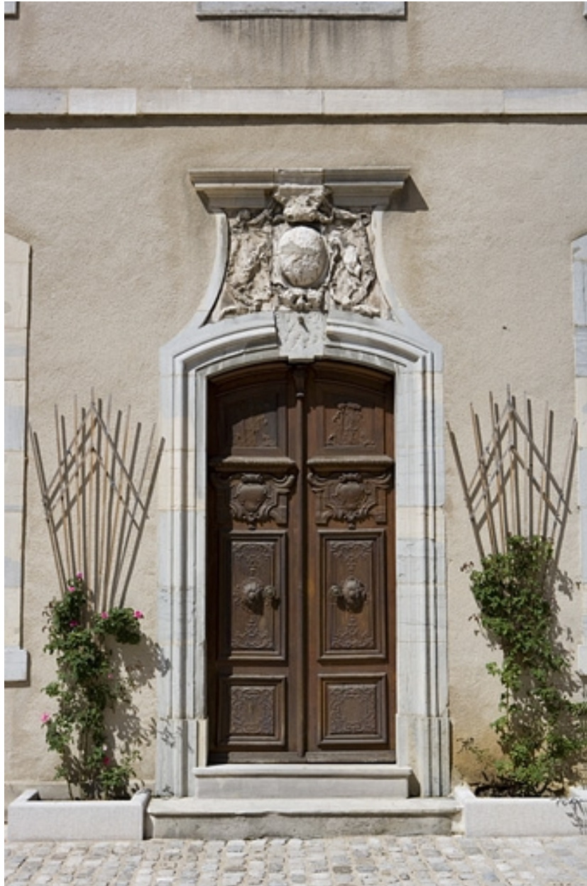
Détail de la porte d'entrée du logis.