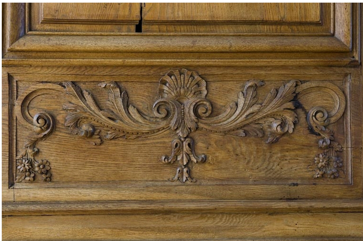
Intérieur : lambris de la grande salle, détail d'un petit panneau sculpté.