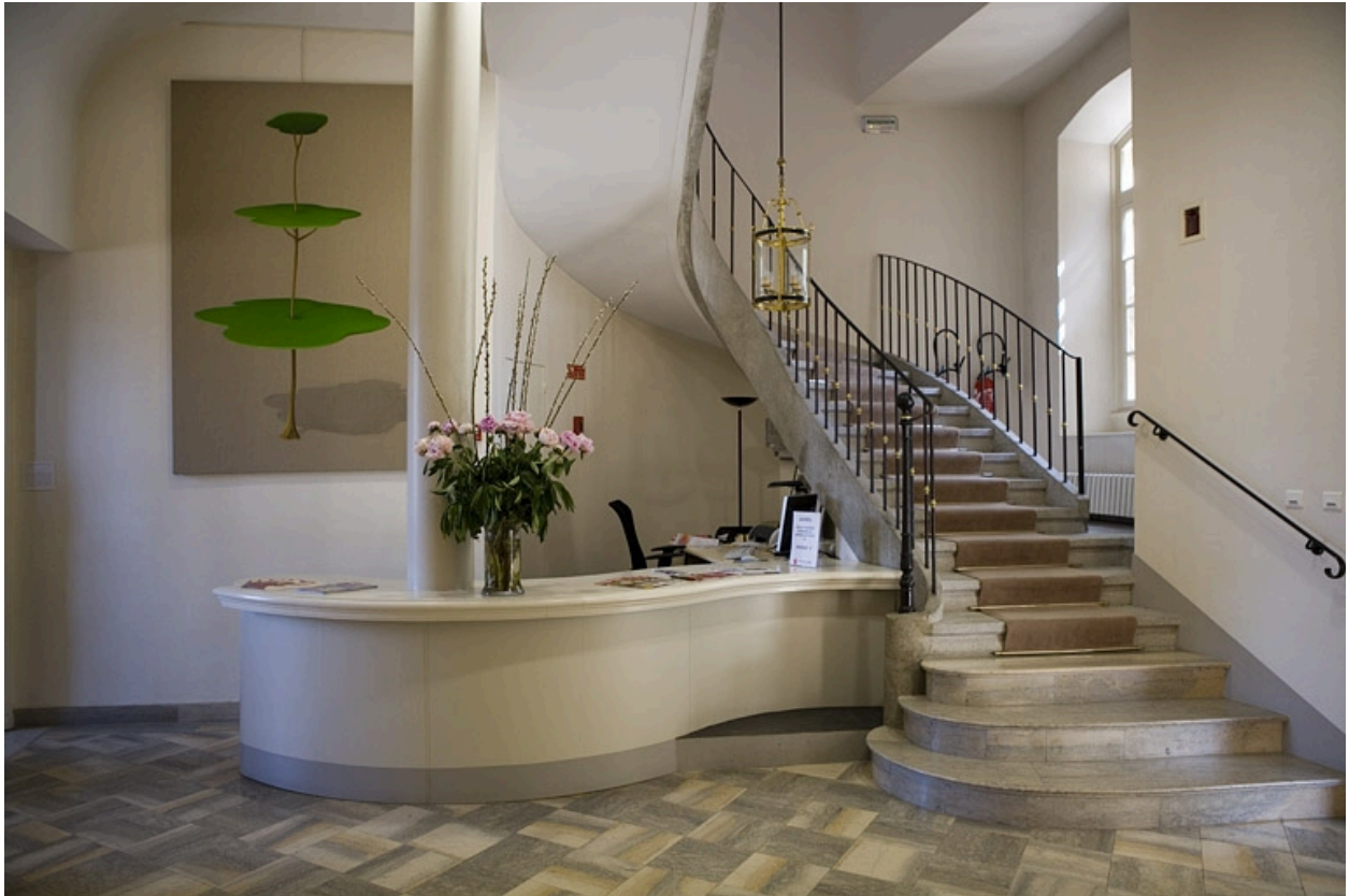
Vue d'ensemble du hall d'entrée.