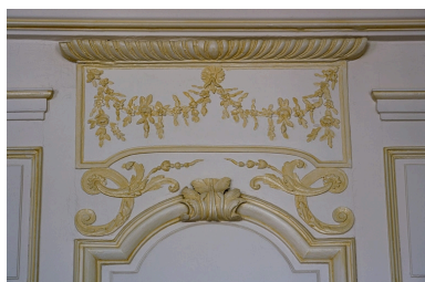
Intérieur : lambris de la chambre, détail du décor à la partie supérieure d'un panneau.