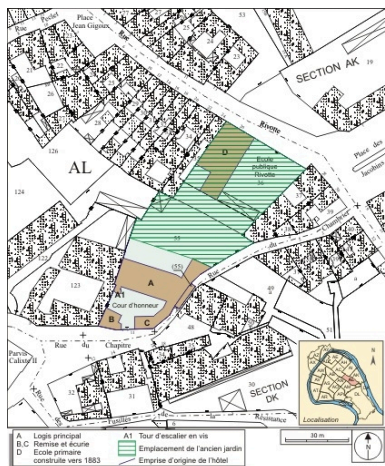
Plan masse et de situation. Extrait du plan cadastral, 1974, section AL. IVR43_20072500843NUDA