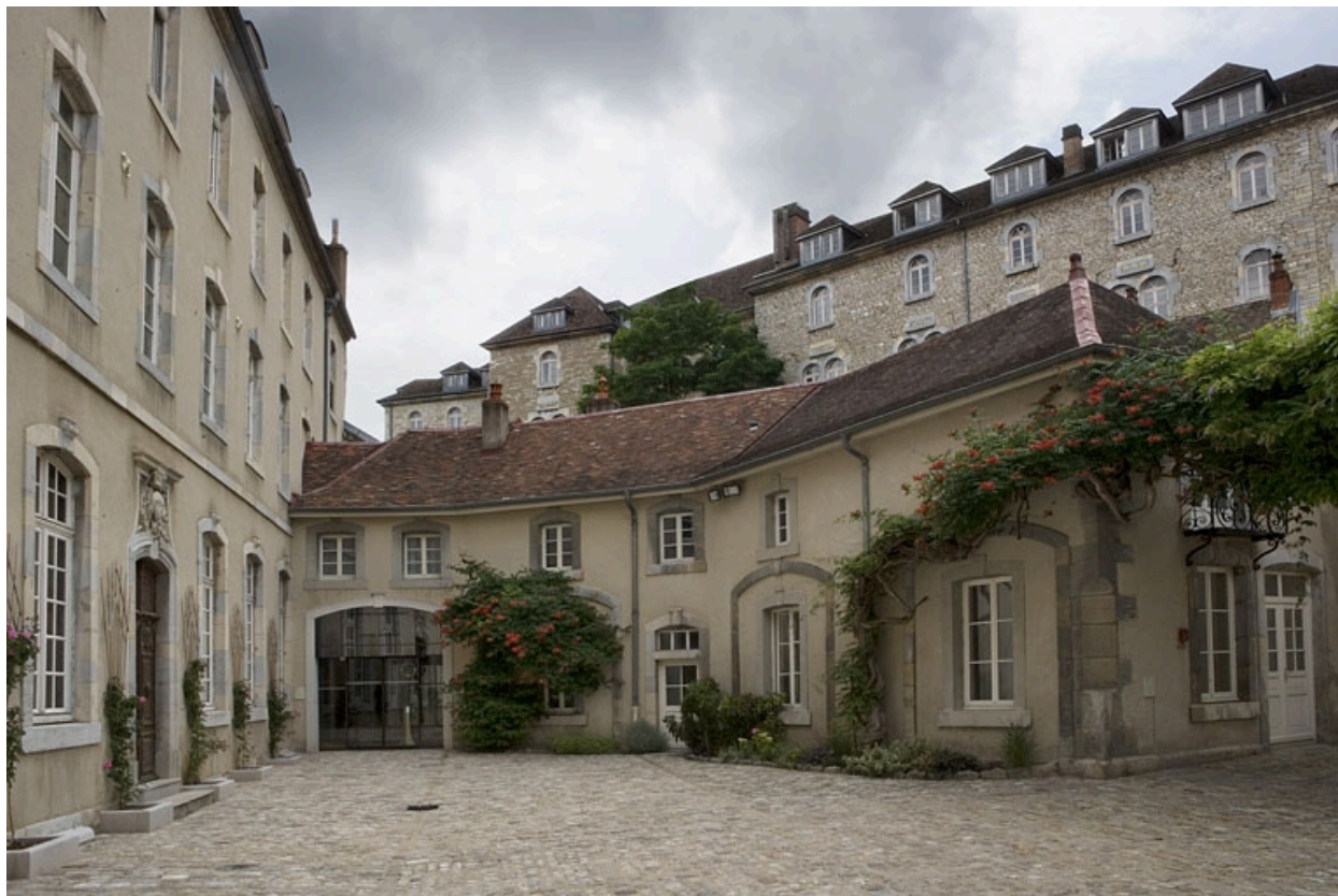
Vue d'ensemble de la partie gauche des communs.