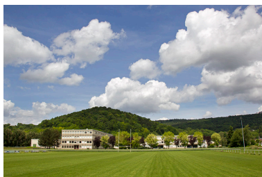
Baume-les-Dames, lycée professionnel Jouffroy d'Abbans : vue depuis le sud.