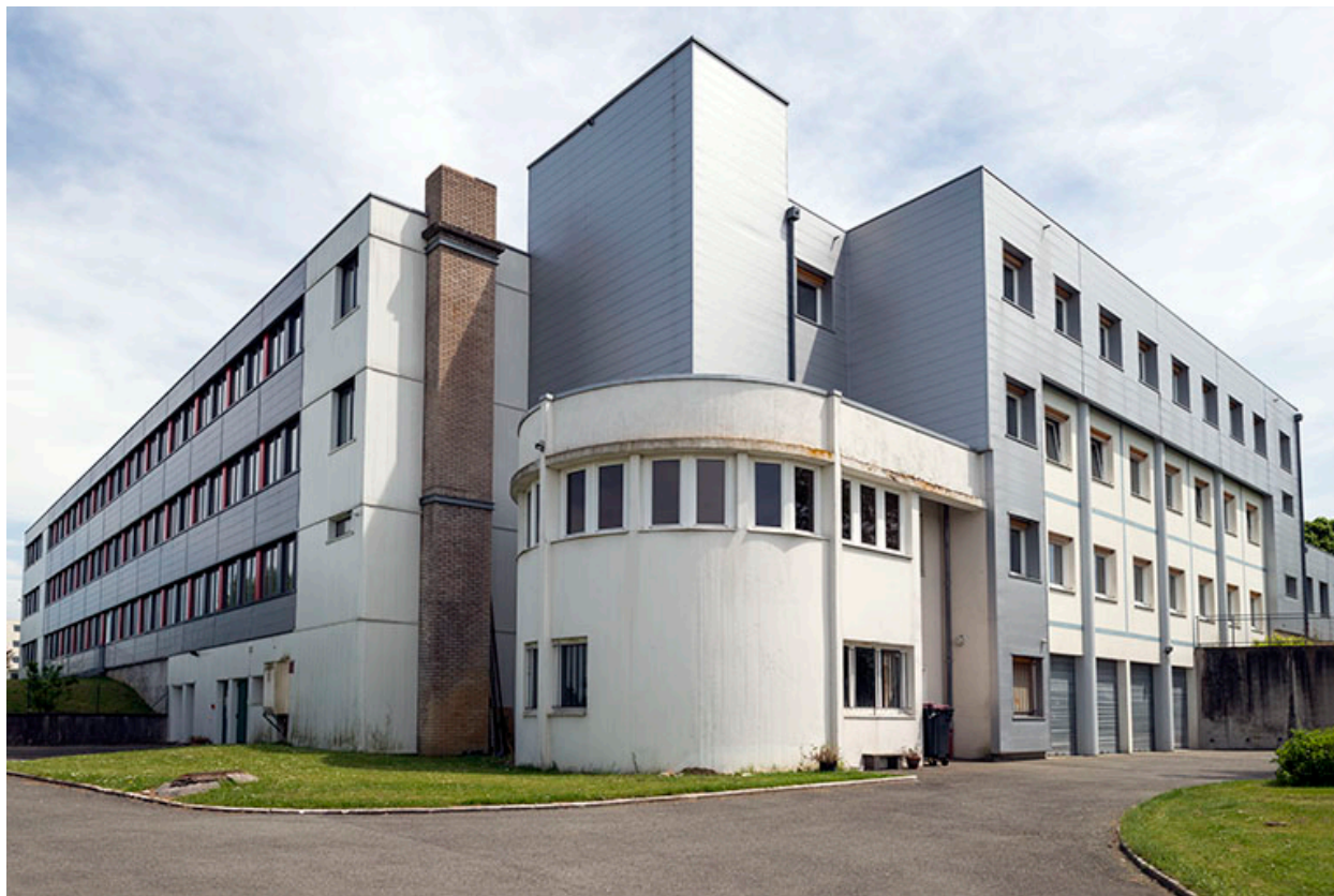
Bethoncourt, site Camus du lycée des Huisselets : externat et cafétéria.