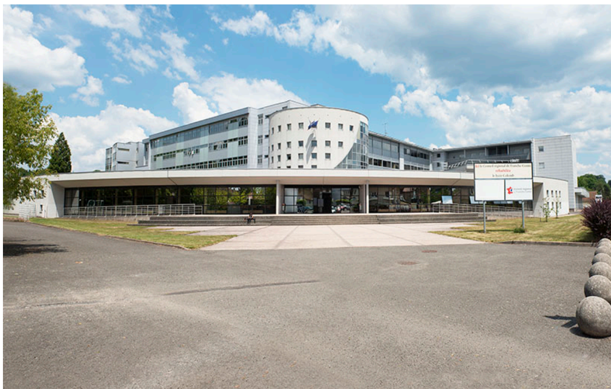
Lure, lycée Georges Colomb : place-parvis et façade de l'entrée.