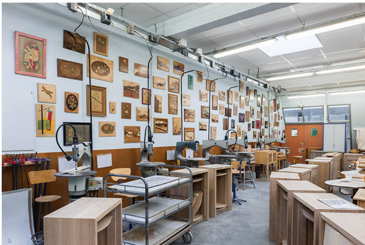
Moirans-en-Montagne, cité scolaire Pierre Vernotte : atelier de marqueterie.