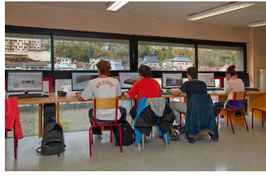
Morez, lycée polyvalent Victor Bérard : atelier de microtechniques. IVR43_20123900090NUC2A