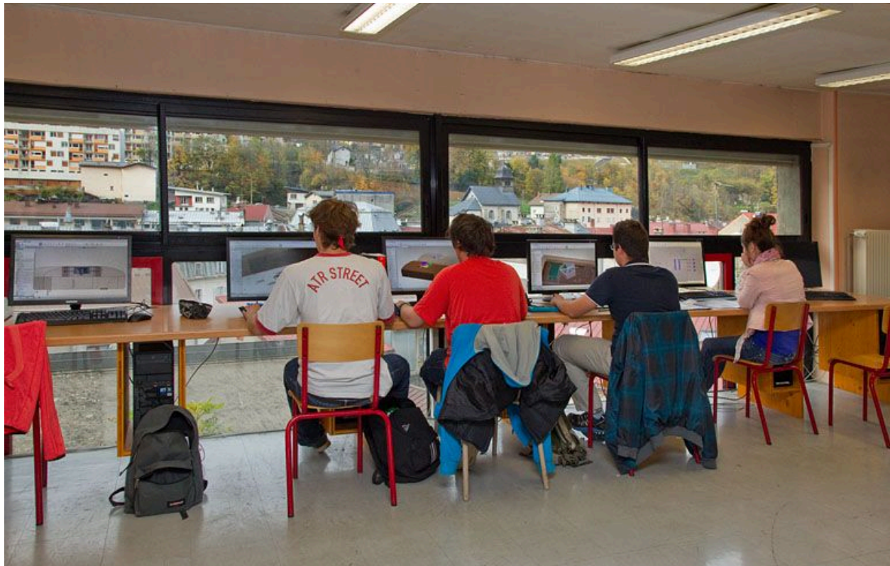
Morez, lycée polyvalent Victor Bérard : atelier de microtechniques.