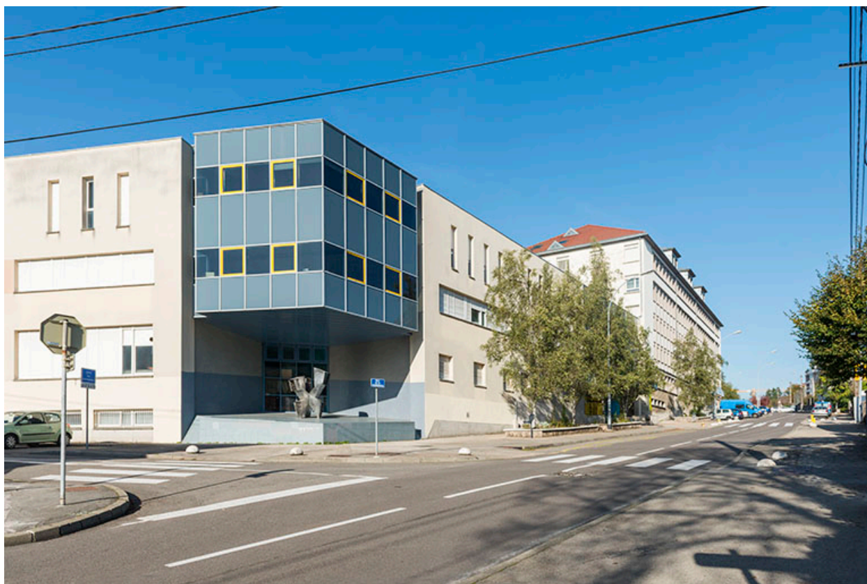
Besançon, lycée Montjoux : bâtiments le long de l'avenue du commandant Marceau.