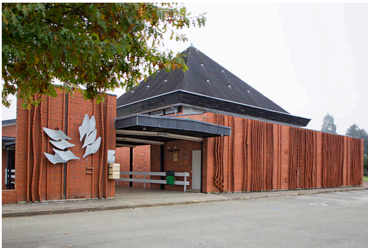
Montmorot, lycée Edgar Faure : entrée principale.