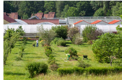
Valdoie : lycée Lucien Quelet : vue du site d'exploitation.