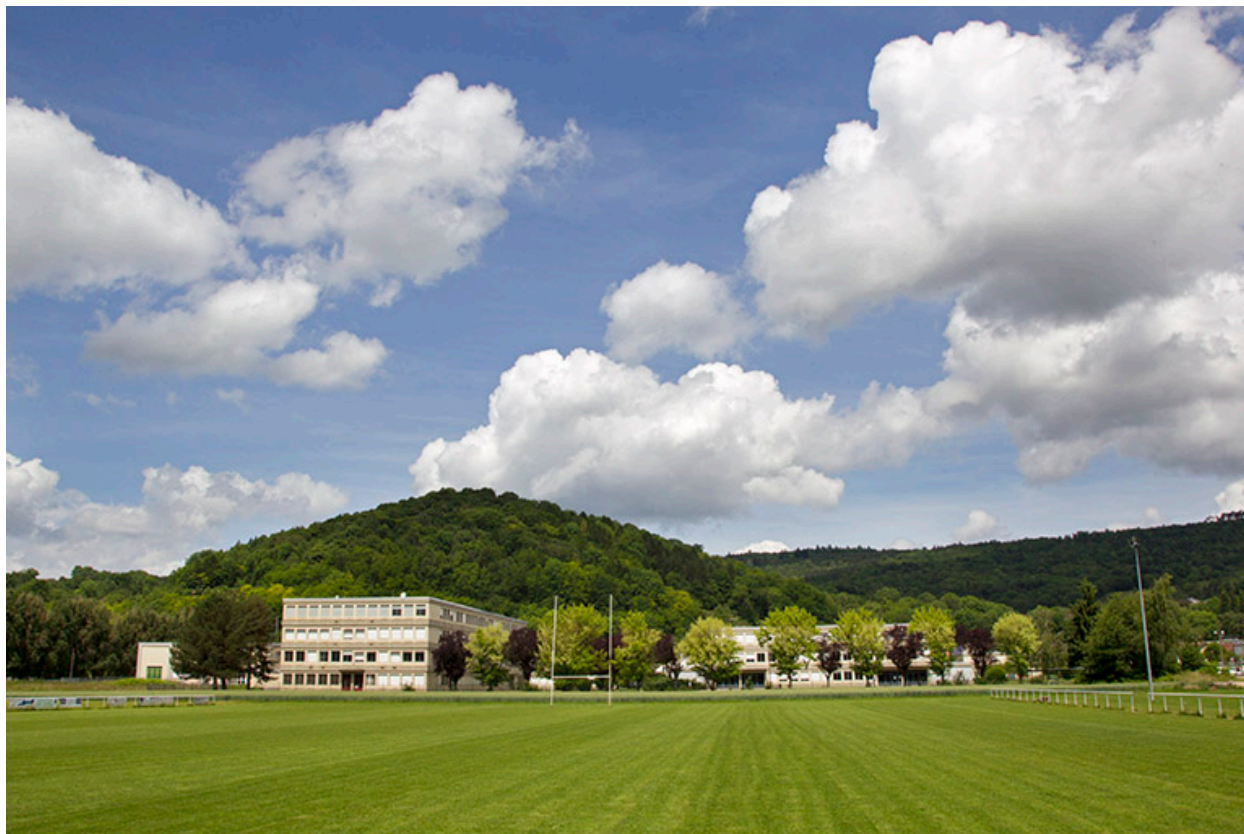
Baume-les-Dames, lycée professionnel Jouffroy d'Abbans : vue depuis le sud.