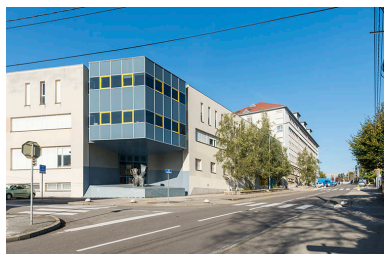
Besançon, lycée Montjoux : bâtiments le long de l'avenue du commandant Marceau. IVR43_20142501484NUC4A