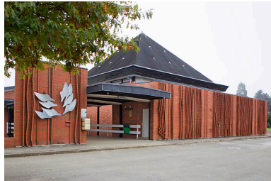
Montmorot, lycée Edgar Faure : entrée principale. IVR43_20143900817NUC2A