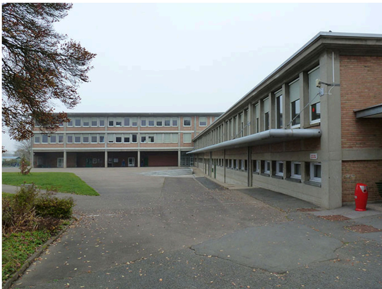
Audincourt, lycée professionnel Nelson Mandela : la cour, les façades antérieures et le préau de l'externat avant les travaux.