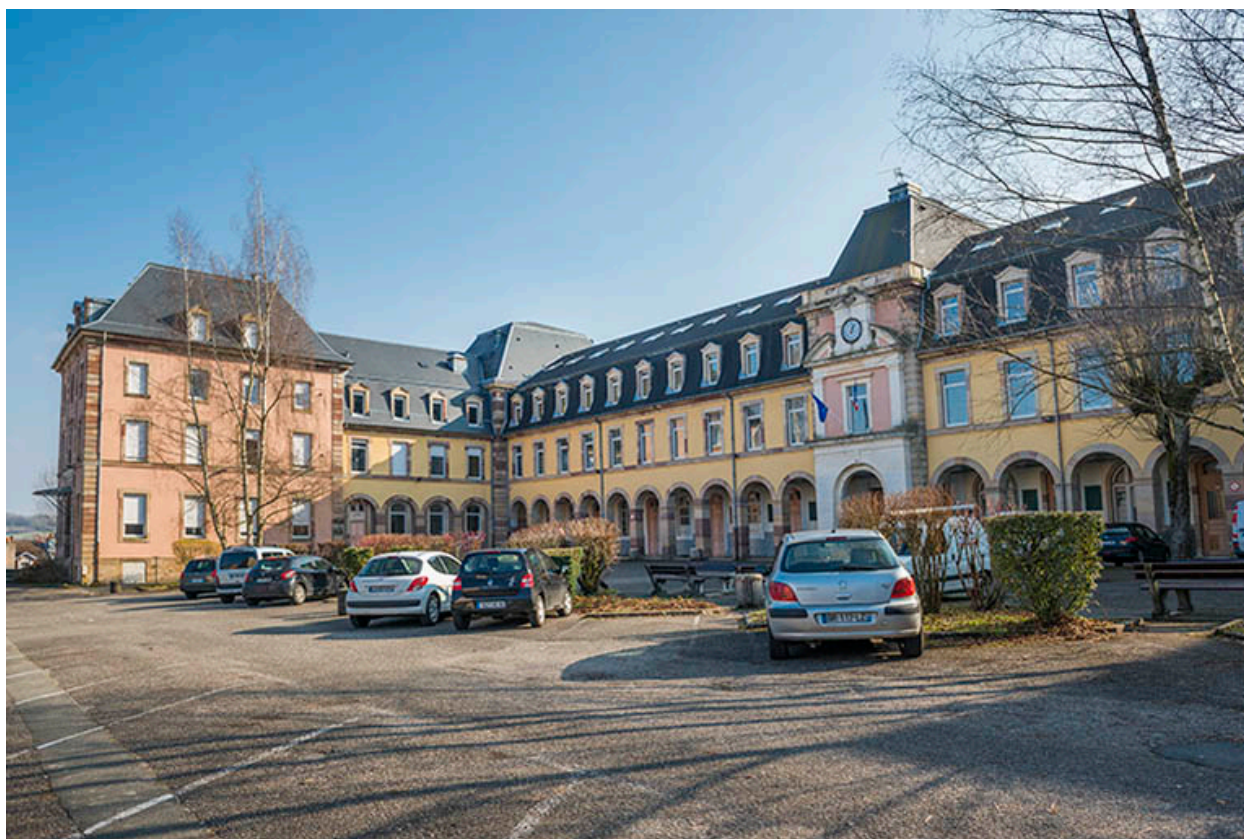
Belfort, lycée Condorcet : cour d'honneur.