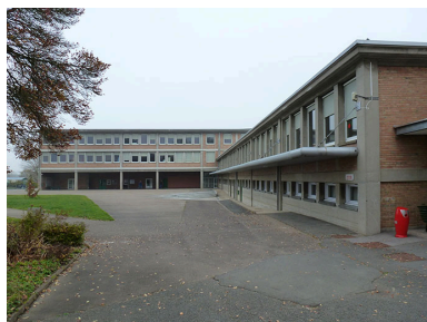
Audincourt, lycée professionnel Nelson Mandela : la cour, les façades antérieures et le préau de l'externat avant les travaux. IVR43_20142500677NUC4A