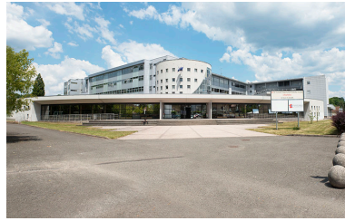
Lure, lycée Georges Colomb : place-parvis et façade de l'entrée. IVR43_20147000085NUC4A