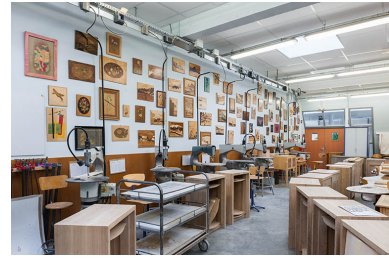
Moirans-en-Montagne, cité scolaire Pierre Vernotte : atelier de marqueterie.