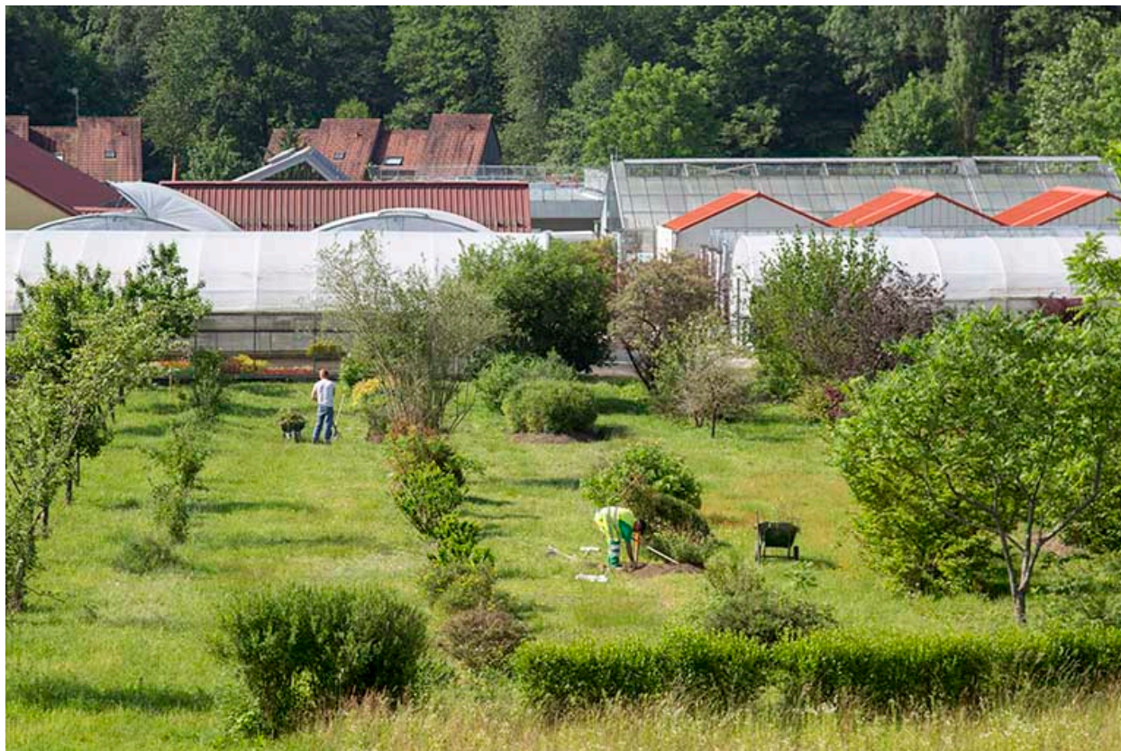
Valdoie : lycée Lucien Quelet : vue du site d'exploitation.