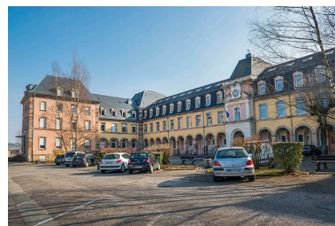
Belfort, lycée Condorcet : cour d'honneur. IVR43_20149000020NUC4A