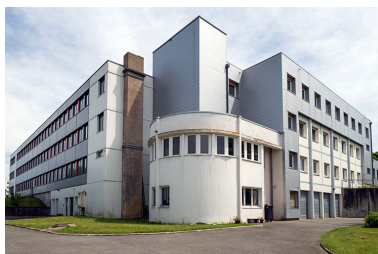
Bethoncourt, site Camus du lycée des Huisselets : externat et cafétéria.