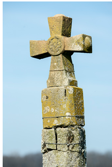
Croix de chemin : détail. IVR43_20177000297NUC4A