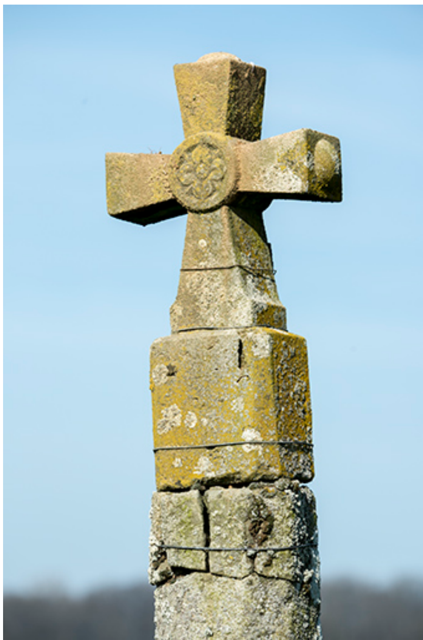
Croix de chemin : détail.