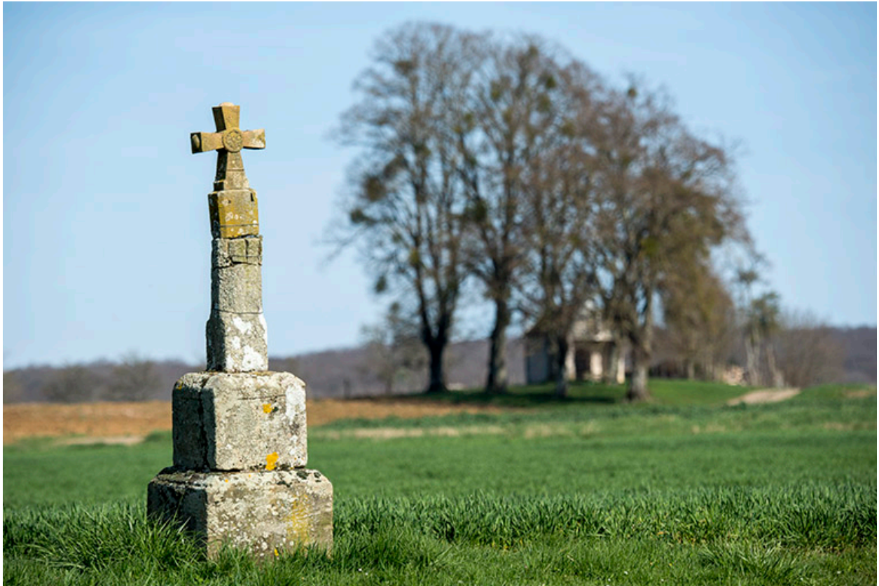
croix de chemin (remontée) non loin de la chapelle St Brice.