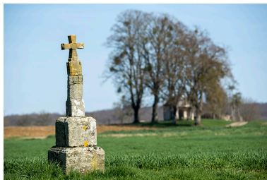
croix de chemin (remontée) non loin de la chapelle St Brice. IVR43_20177000296NUC4A