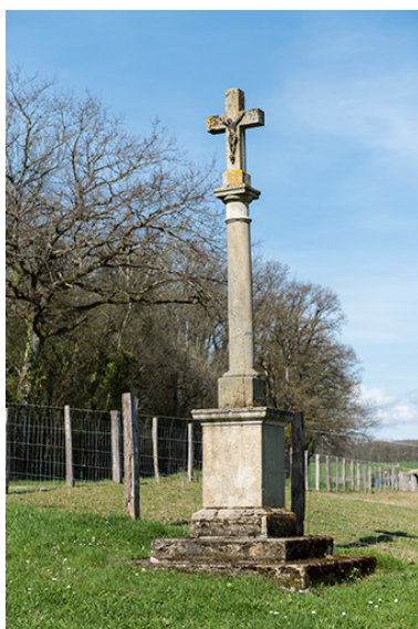
Croix de chemin rue des Mays Brochot.