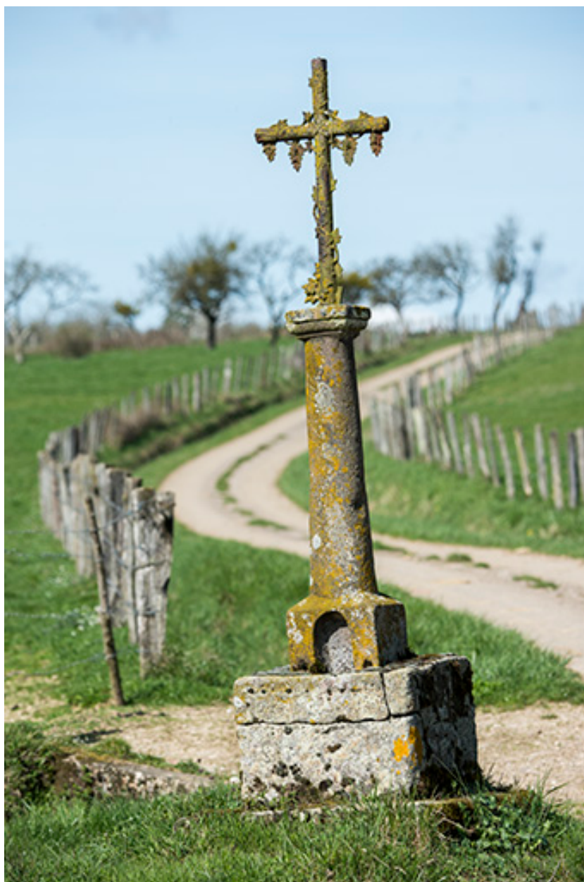
Croix saint Thiébaud (rue de Raincourt)