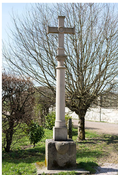
Croix de mission portant la date de 1831, "sur la planche", à l'angle du chemin du Chanissieux et de la Grande rue. IVR43_20177000300NUC4A