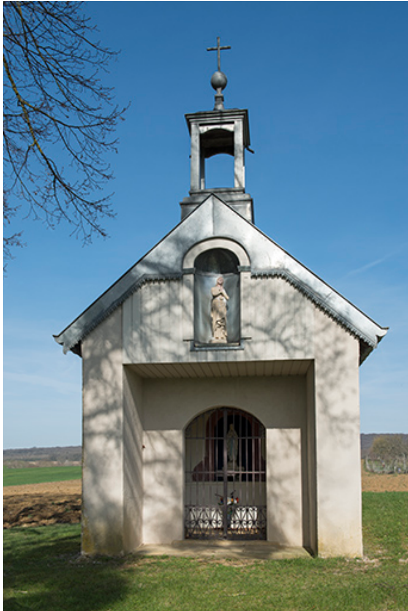
Chapelle saint-Brice. Vue de face.