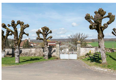
Grille d'entrée et mur d'enceinte du cimetière. IVR43_20177000305NUC4A