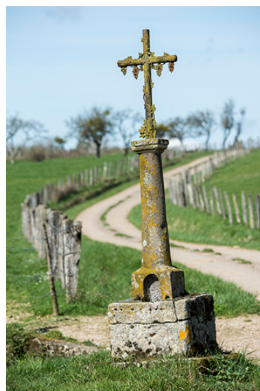
Croix saint Thiébaud (rue de Raincourt)