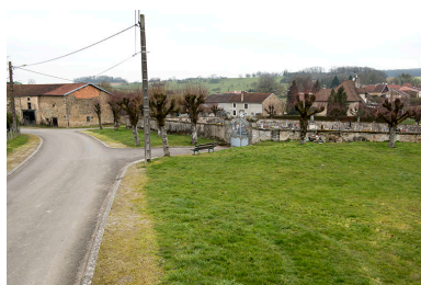
Cimetière vue de trois-quart, depuis l'est. IVR43_20177000304NUC4A