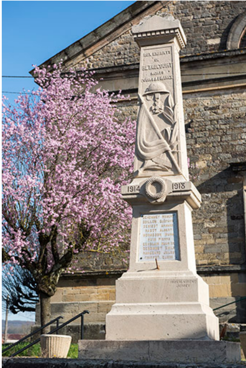
Le monument aux morts. (signature : Didier Laurent Jussey)