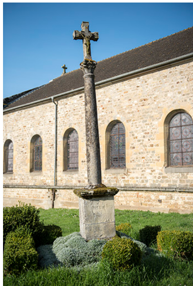
Calvaire le long du flanc est de l'église paroissiale. (mission 1897)