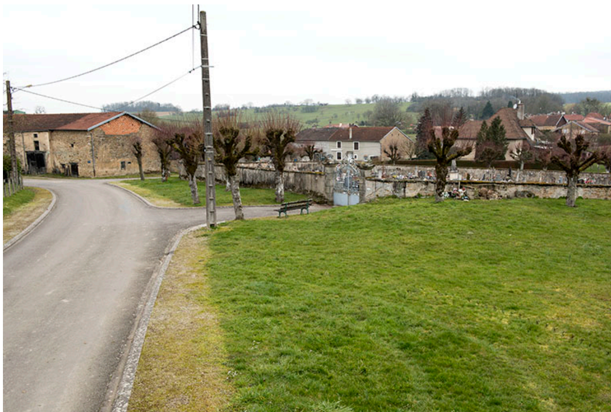
Cimetière vue de trois-quart, depuis l'est.