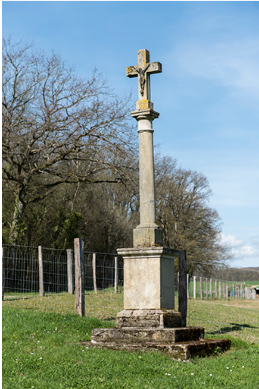
Croix de chemin rue des Mays Brochot.