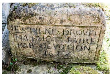
Base du calvaire de dévotion du Petit-Magny. (date portée : 1617) IVR43_20177000301NUC4A