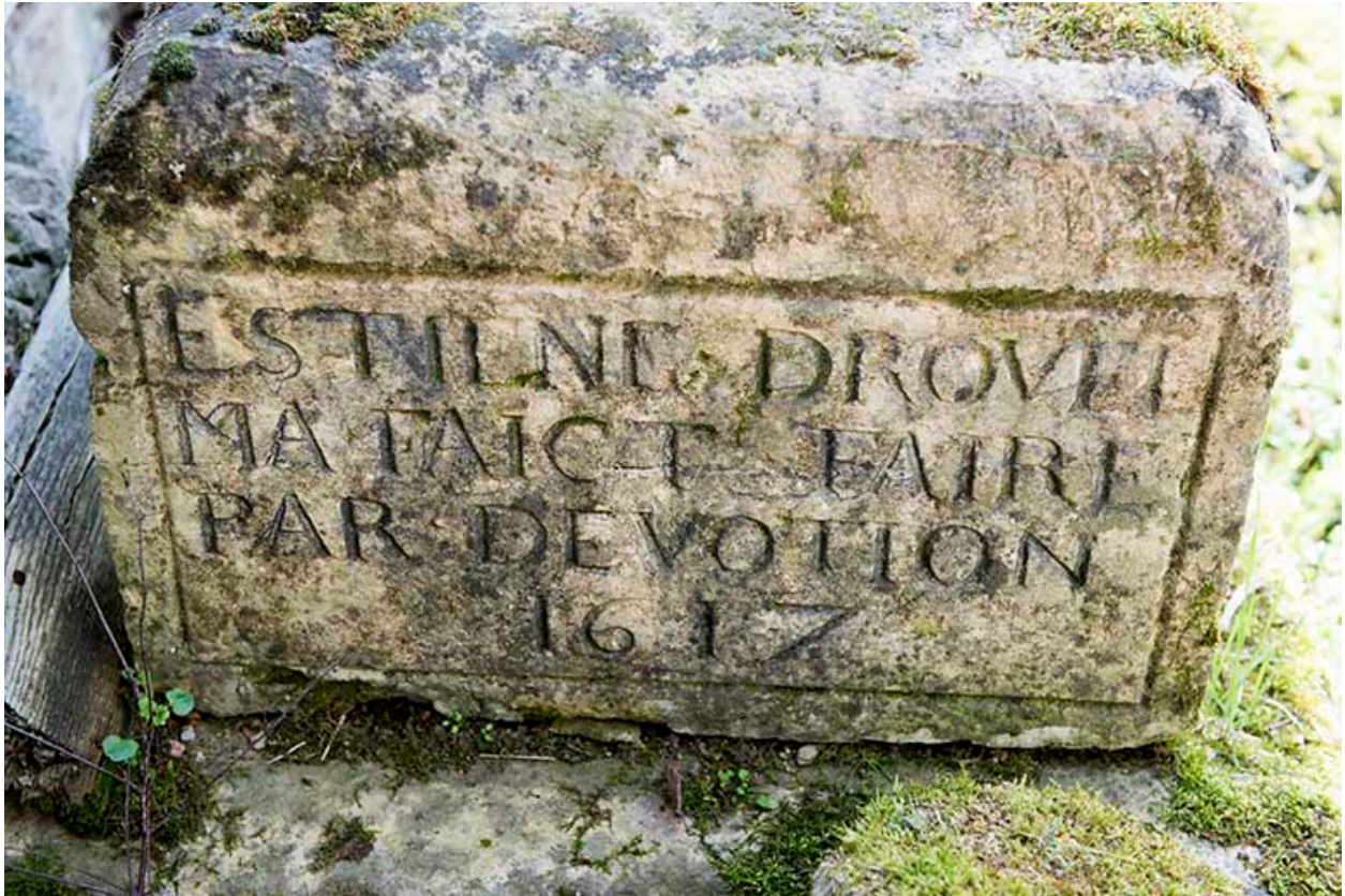
Base du calvaire de dévotion du Petit-Magny. (date portée : 1617)