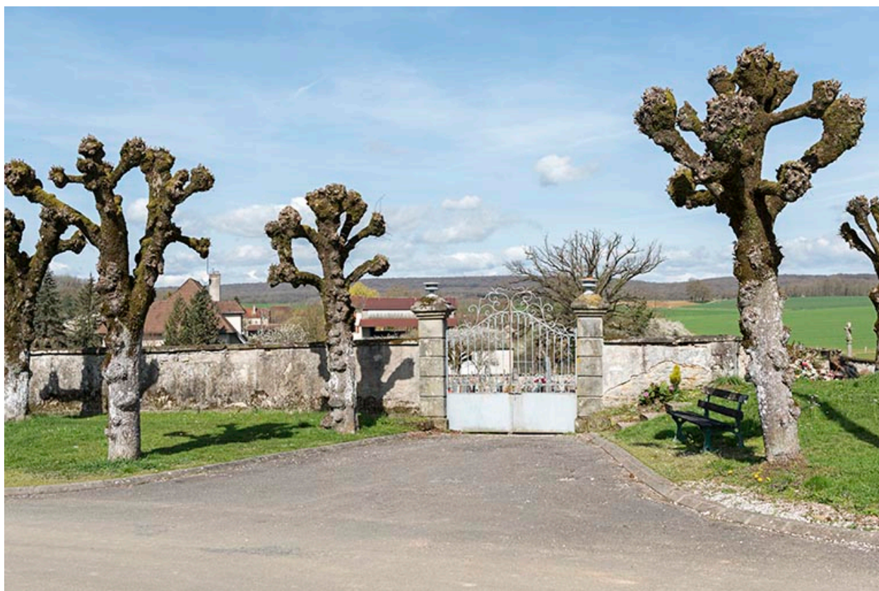
Grille d'entrée et mur d'enceinte du cimetière.