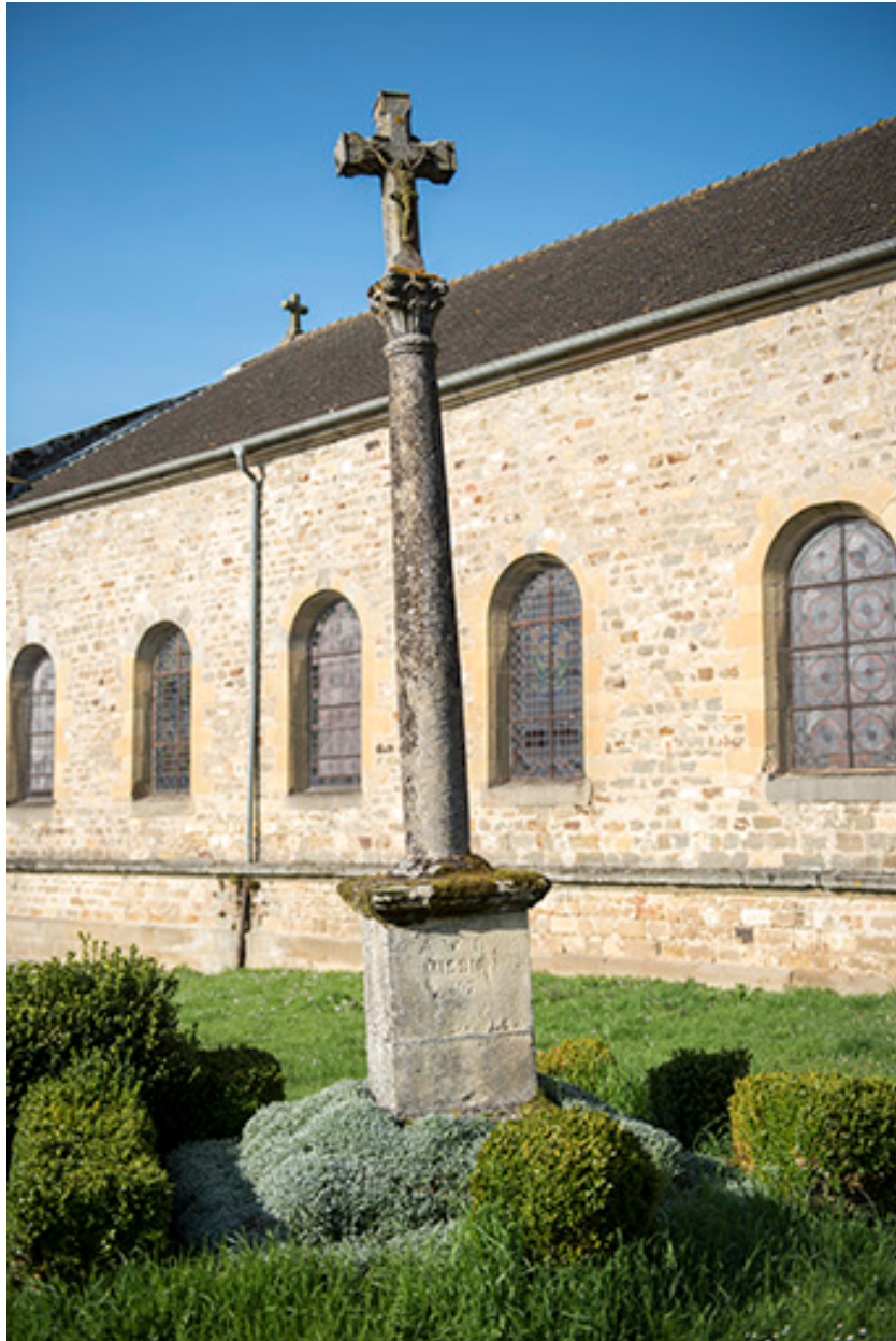
Calvaire le long du flanc est de l'église paroissiale. (mission 1897)