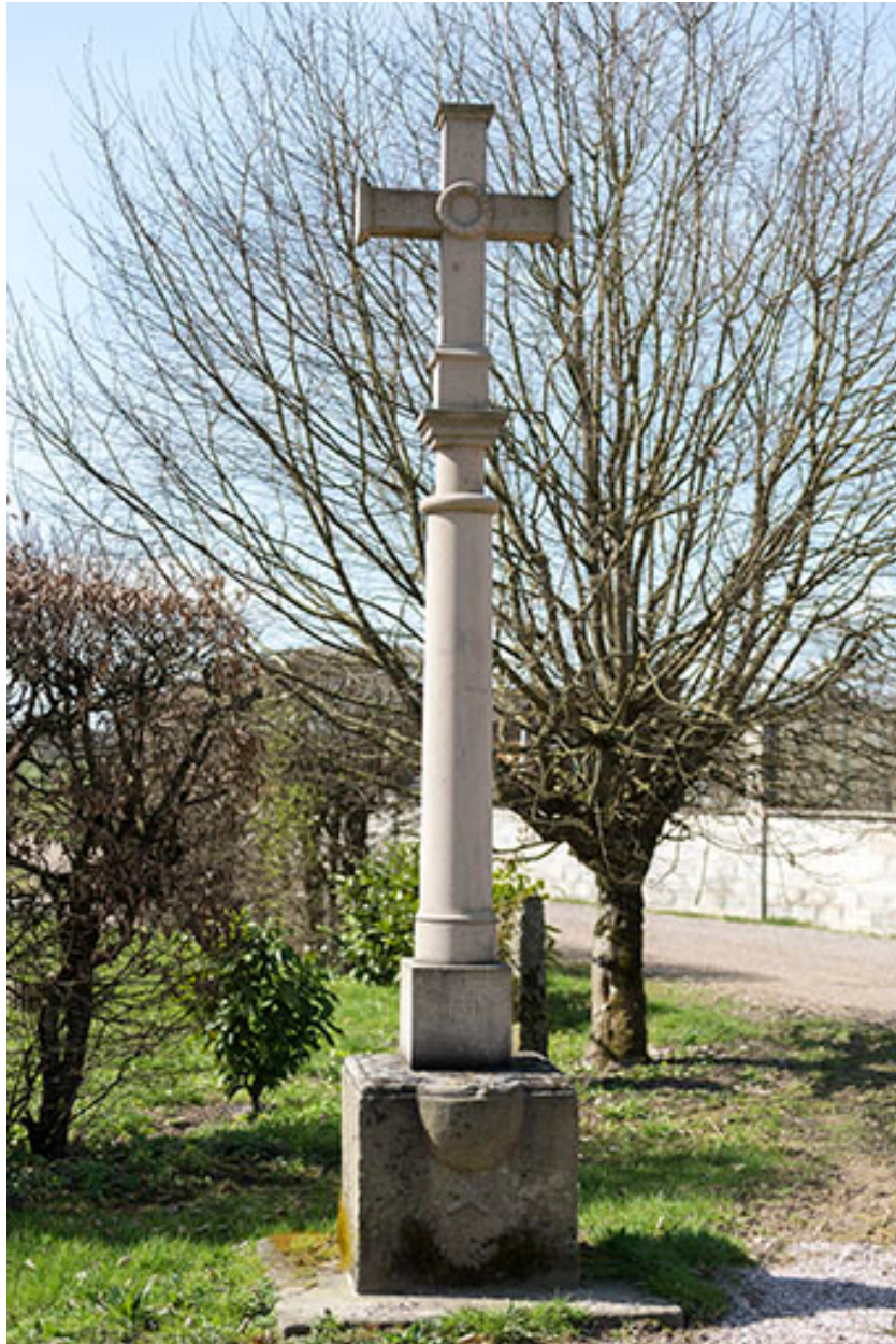
Croix de mission portant la date de 1831, "sur la planche", à l'angle du chemin du Chanissieux et de la Grande rue.