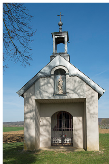
Chapelle saint-Brice. Vue de face. IVR43_20177000303NUC4A