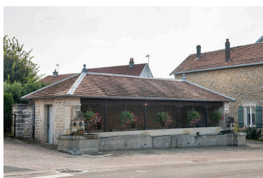
La fontaine-lavoir, Grande rue.