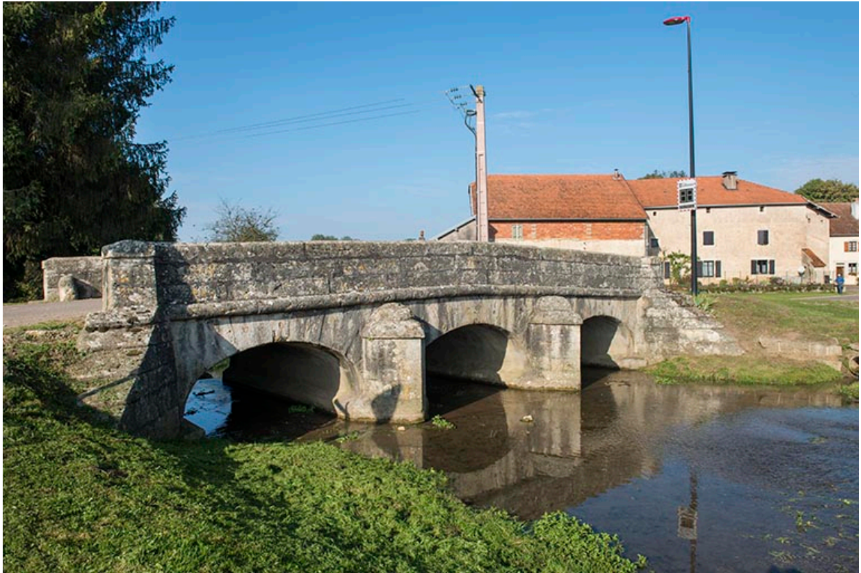
Pont enjambeant le ruisseau, la Scyotte.