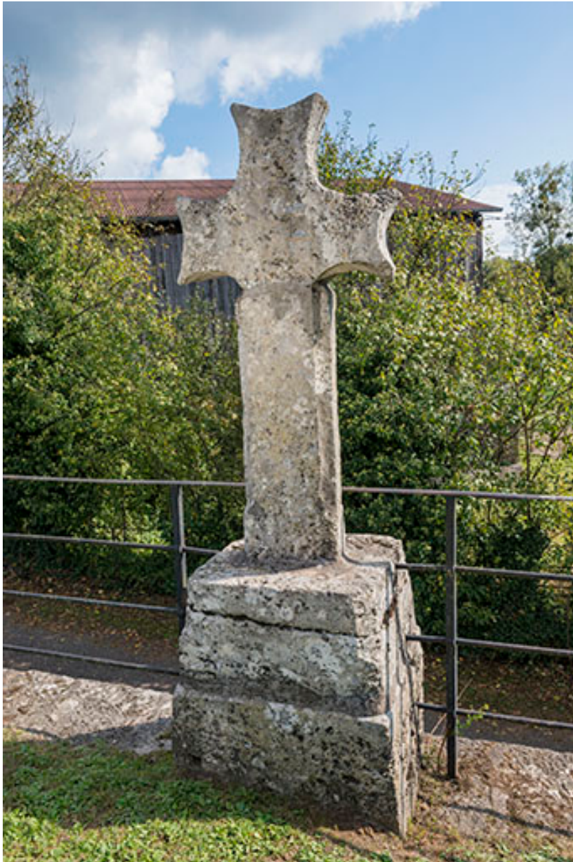
Croix située vers l'entrée du village, Grande rue.