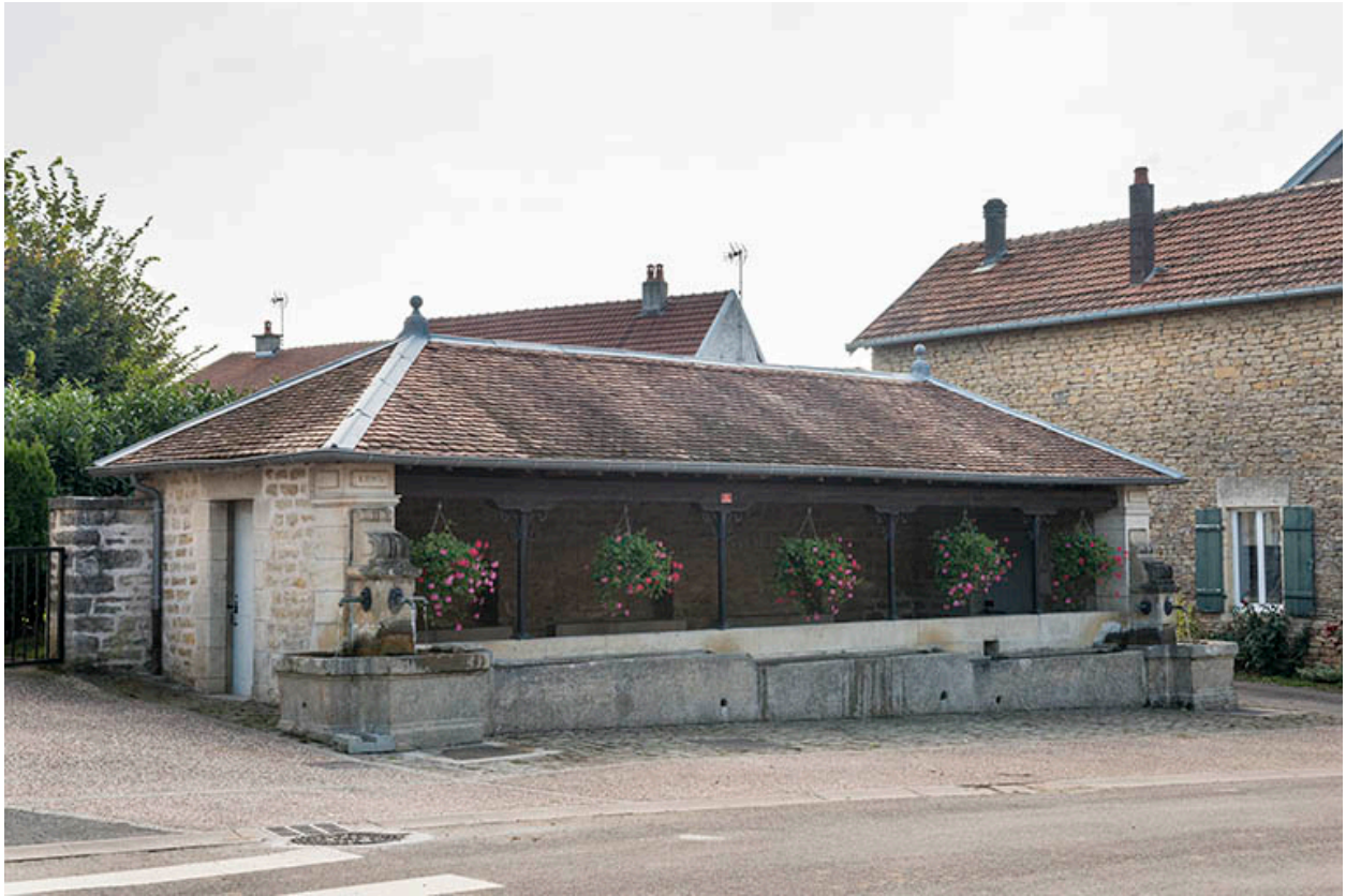
La fontaine-lavoir, Grande rue.