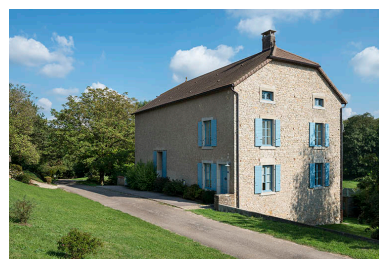
L'ancien moulin. IVR43_20167001603NUC4A