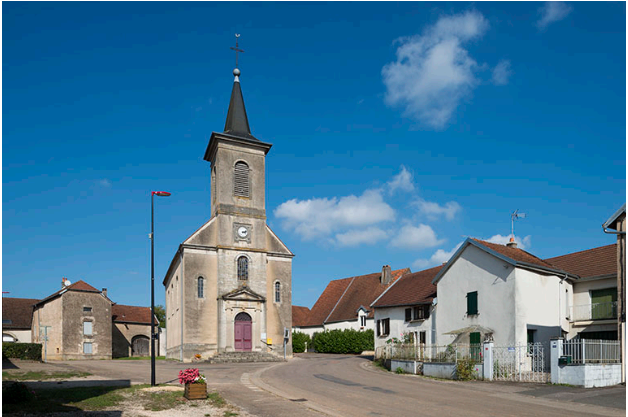
La chapelle, Grande rue.