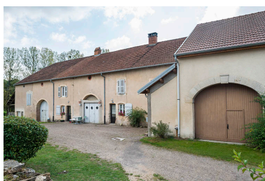
Alignement de fermes, rue de la Fontaine. IVR43_20167001621NUC4A