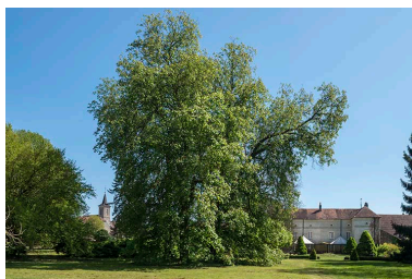
L'église et le château.