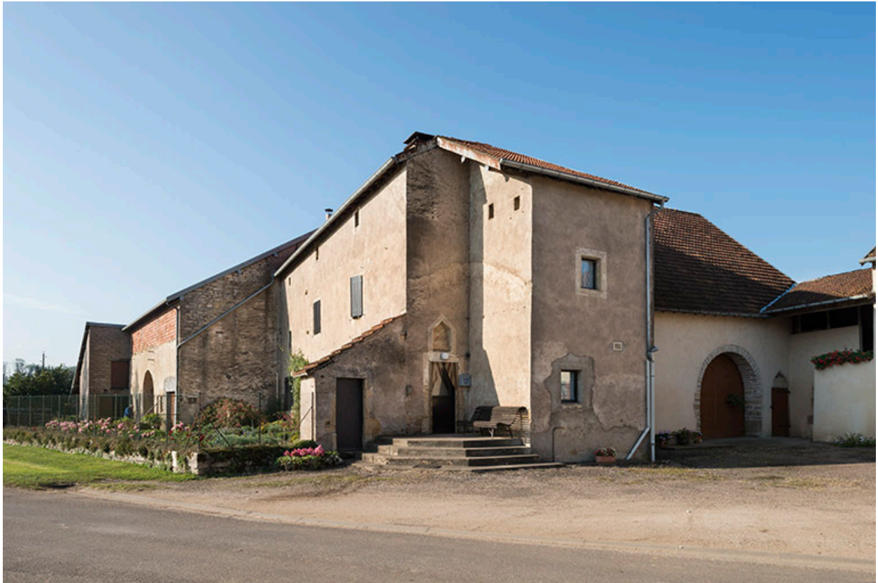
Vue de trois-quart.