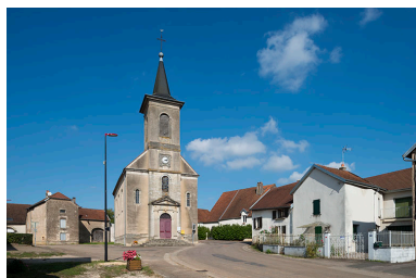
La chapelle, Grande rue.