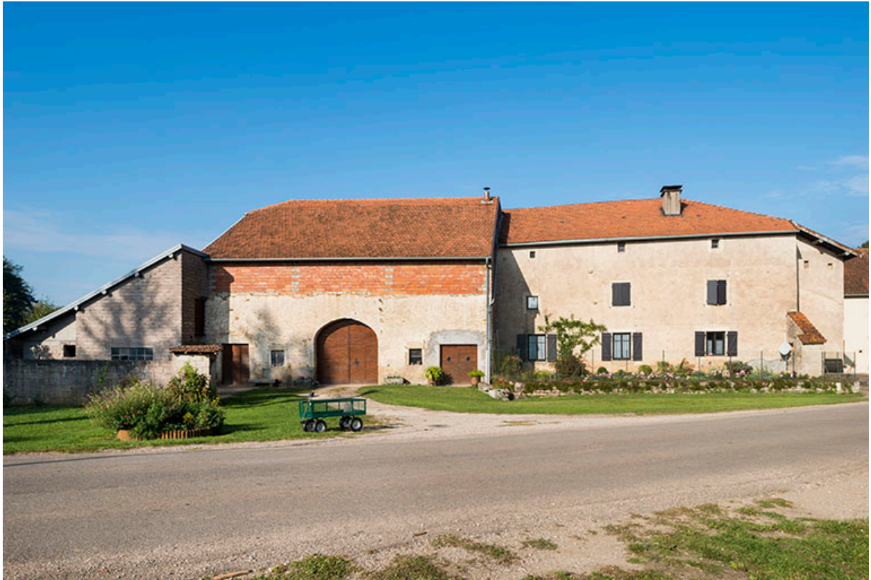
Feme, vue générale, Grande rue.