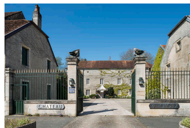
Le château, vue générale depuis la Grande rue. IVR43_20177000392NUC4A