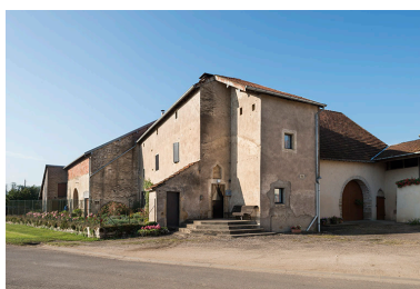
Vue de trois-quart.