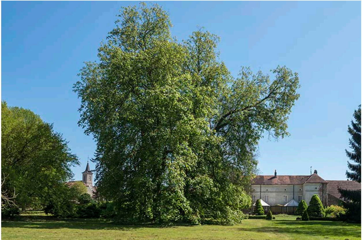
L'église et le château.