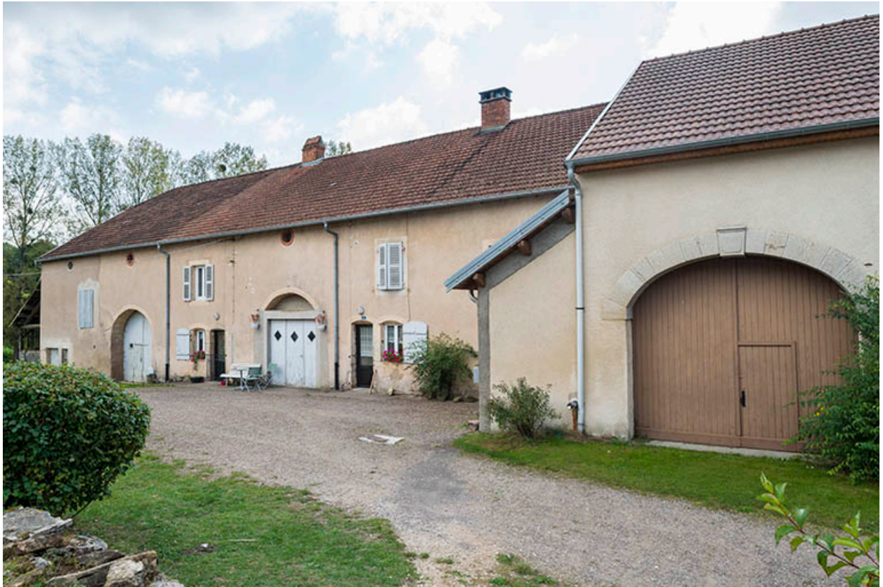
Alignement de fermes, rue de la Fontaine.