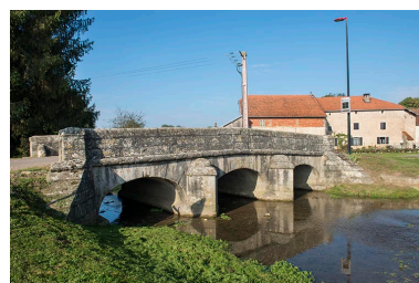
Pont enjambeant le ruisseau, la Scyotte.