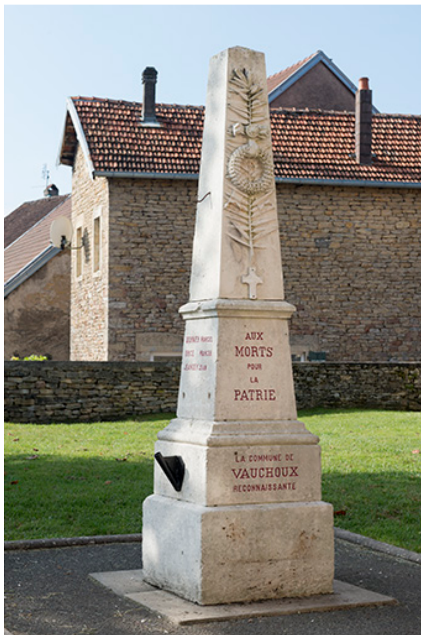
Le monument aux morts.