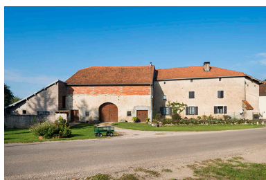
Feme, vue générale, Grande rue. IVR43_20167001604NUC4A