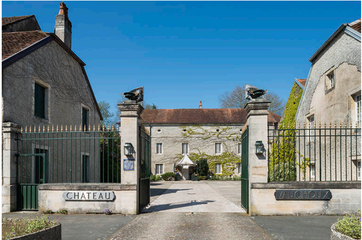
Le château, vue générale depuis la Grande rue.