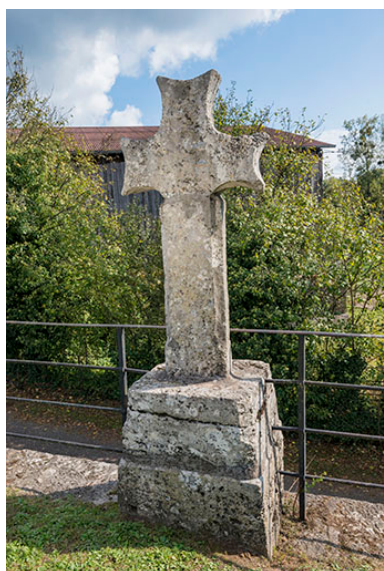
Croix située vers l'entrée du village, Grande rue. IVR43_20167001616NUC4A