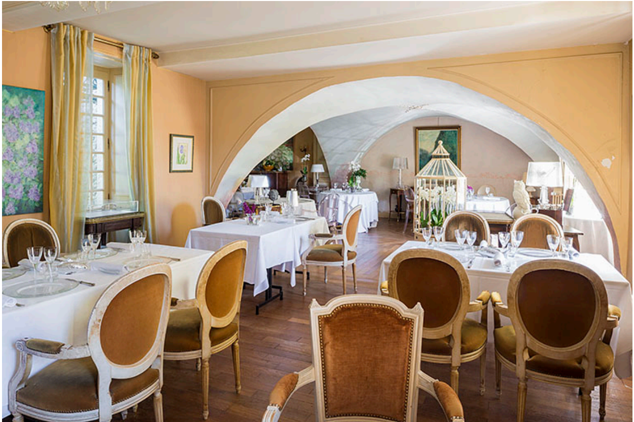
La salle à manger.