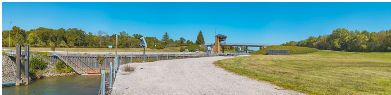
Vue d'ensemble d'aval.