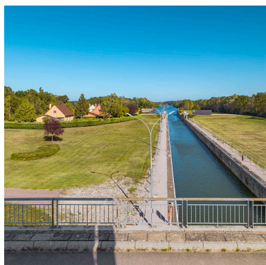
Le sas et le lotissement des employés de VNF, vus depuis le pont sur écluse.