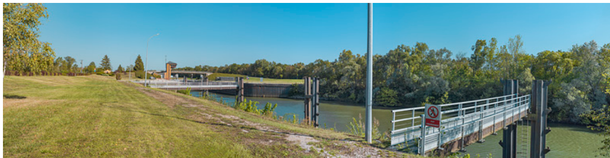
Vue d'ensemble d'aval.