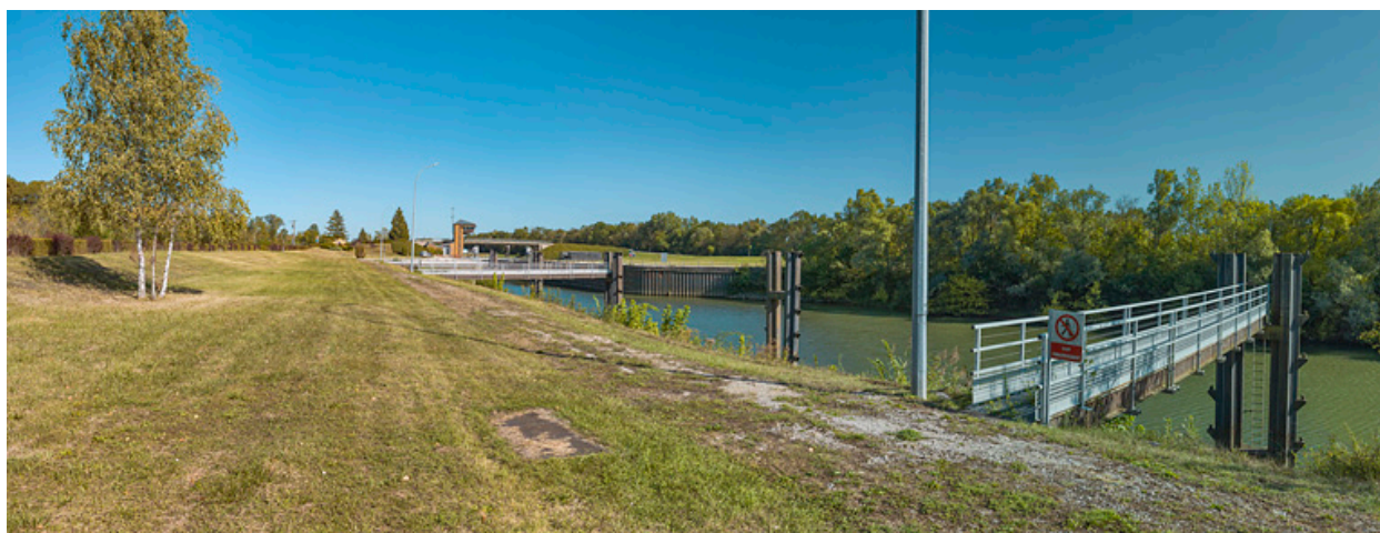
Le site d'écluse vu d'aval.