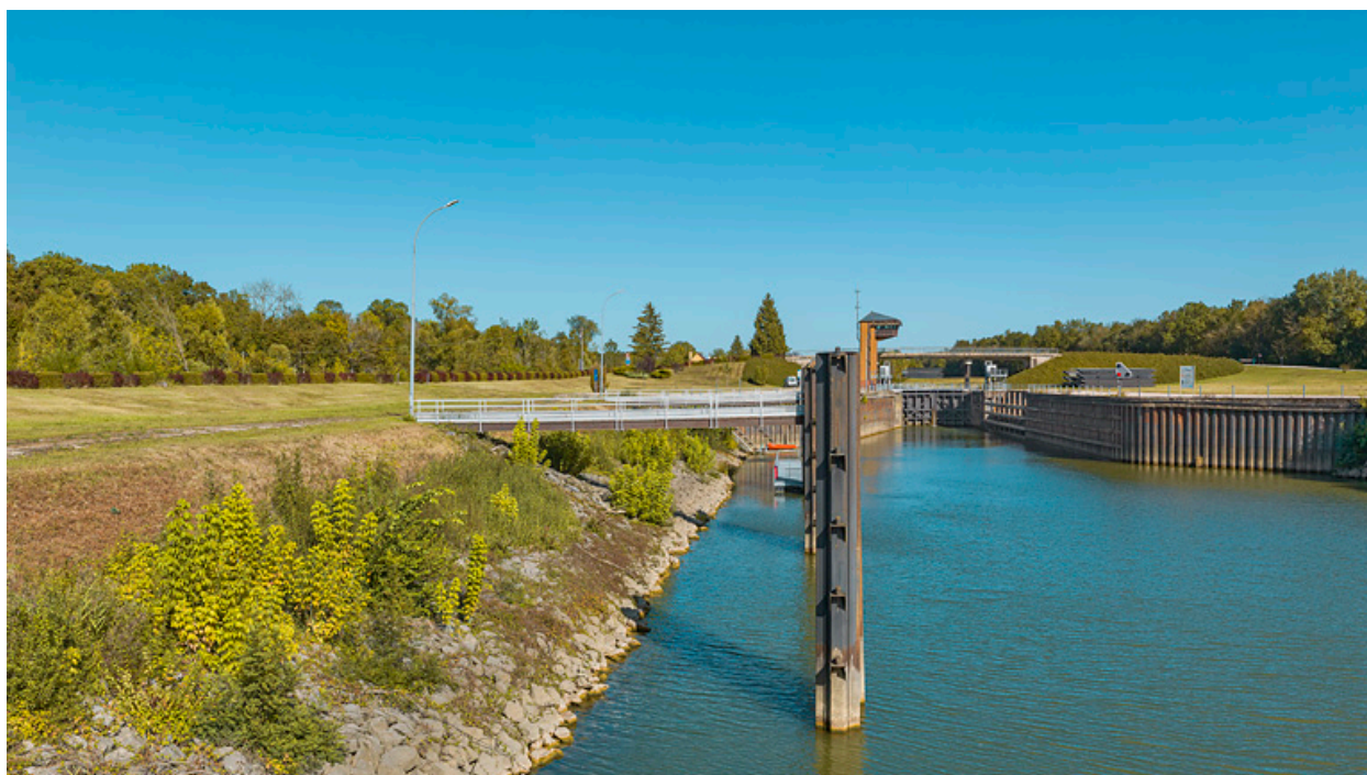
Le site vu d'aval.