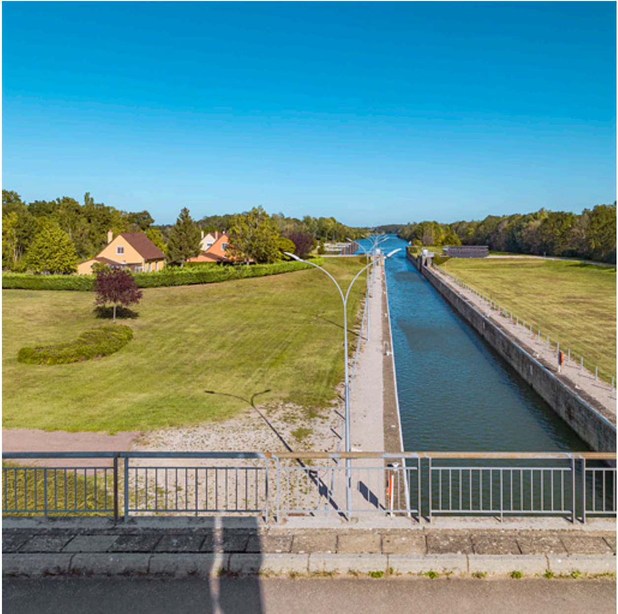
Le sas et le lotissement des employés de VNF, vus depuis le pont sur écluse.