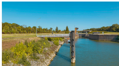
Le site vu d'aval. IVR26_20197100535NUC4A