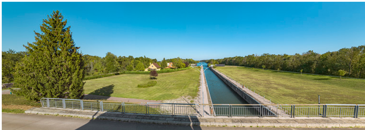
Le sas vu depuis le pont sur écluse.