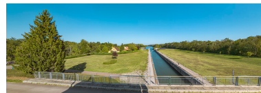
Le sas vu depuis le pont sur écluse.