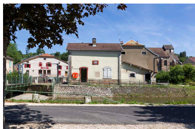
La maison du pontier. IVR43_20157000975NUC2A