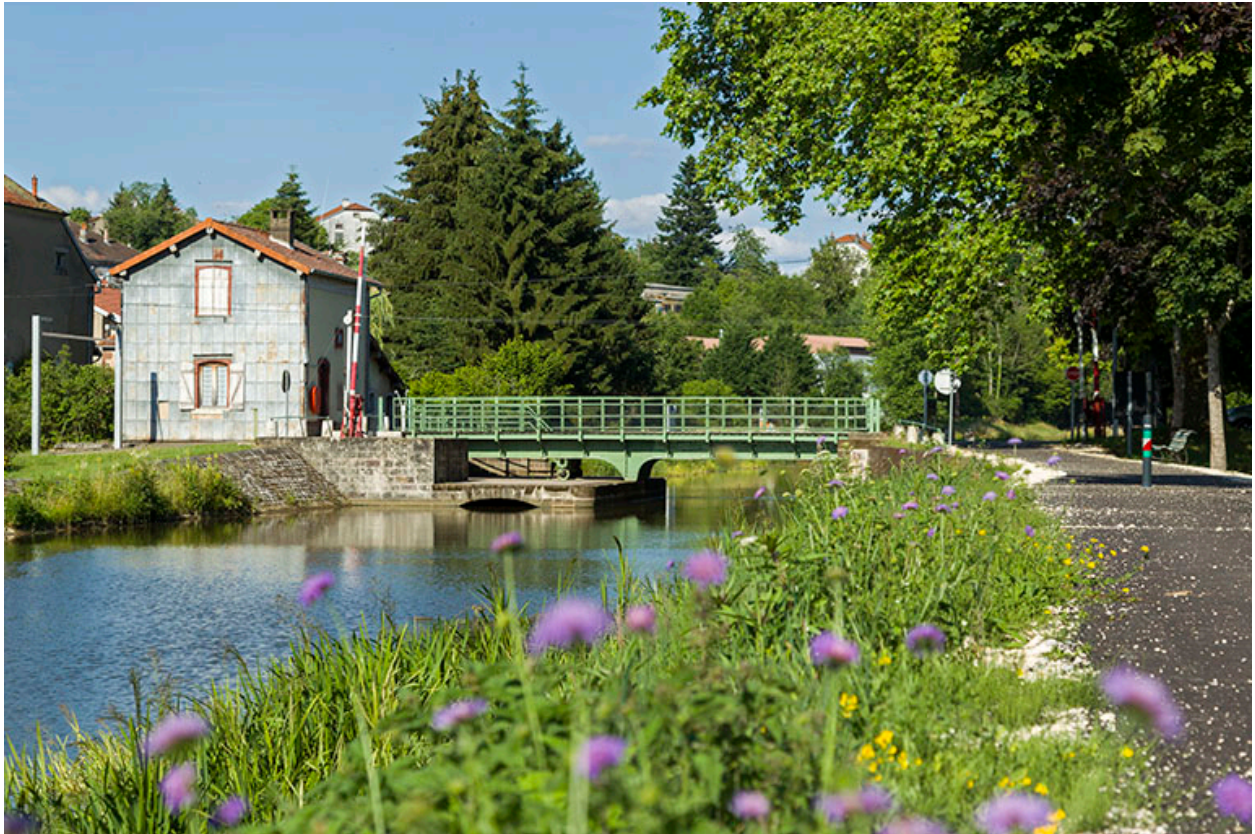
La maison, depuis l'aval.