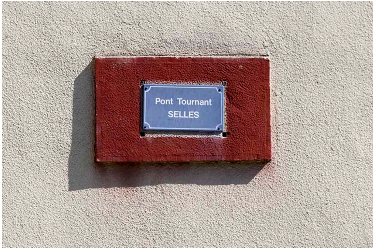
La plaque d'identification du pont.