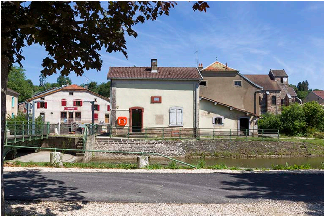
La maison du pontier.