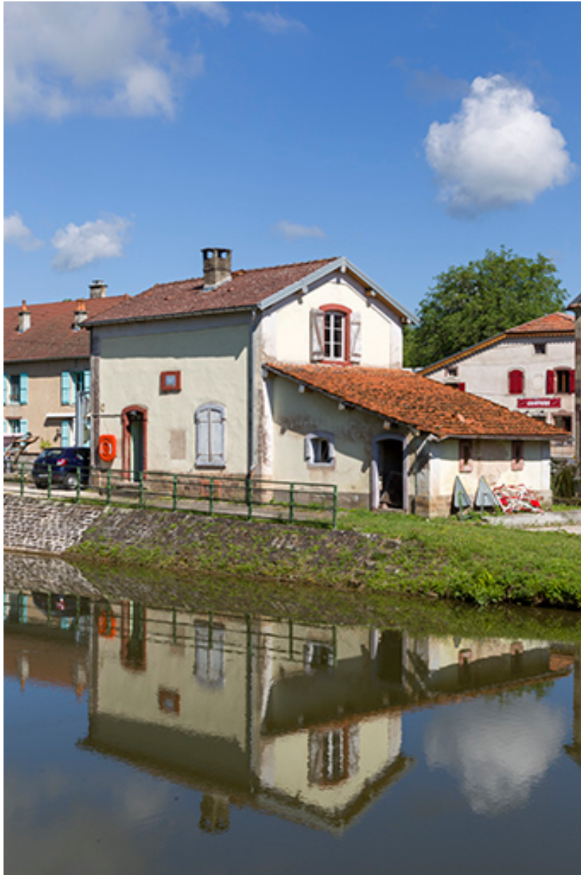
La maison, depuis l'ancien chemin de halage.