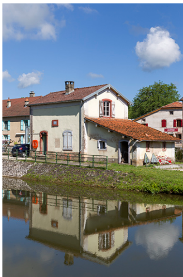
La maison, depuis l'ancien chemin de halage.