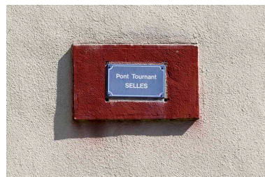
La plaque d'identification du pont.