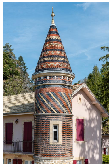
Détail de la tourelle d'angle.