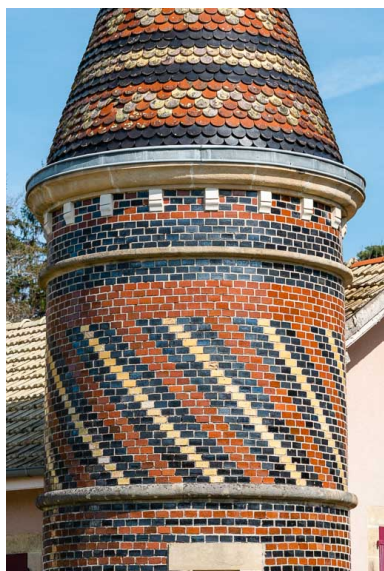
Détail de la tourelle d'angle. IVR26_20195800068NUC4A