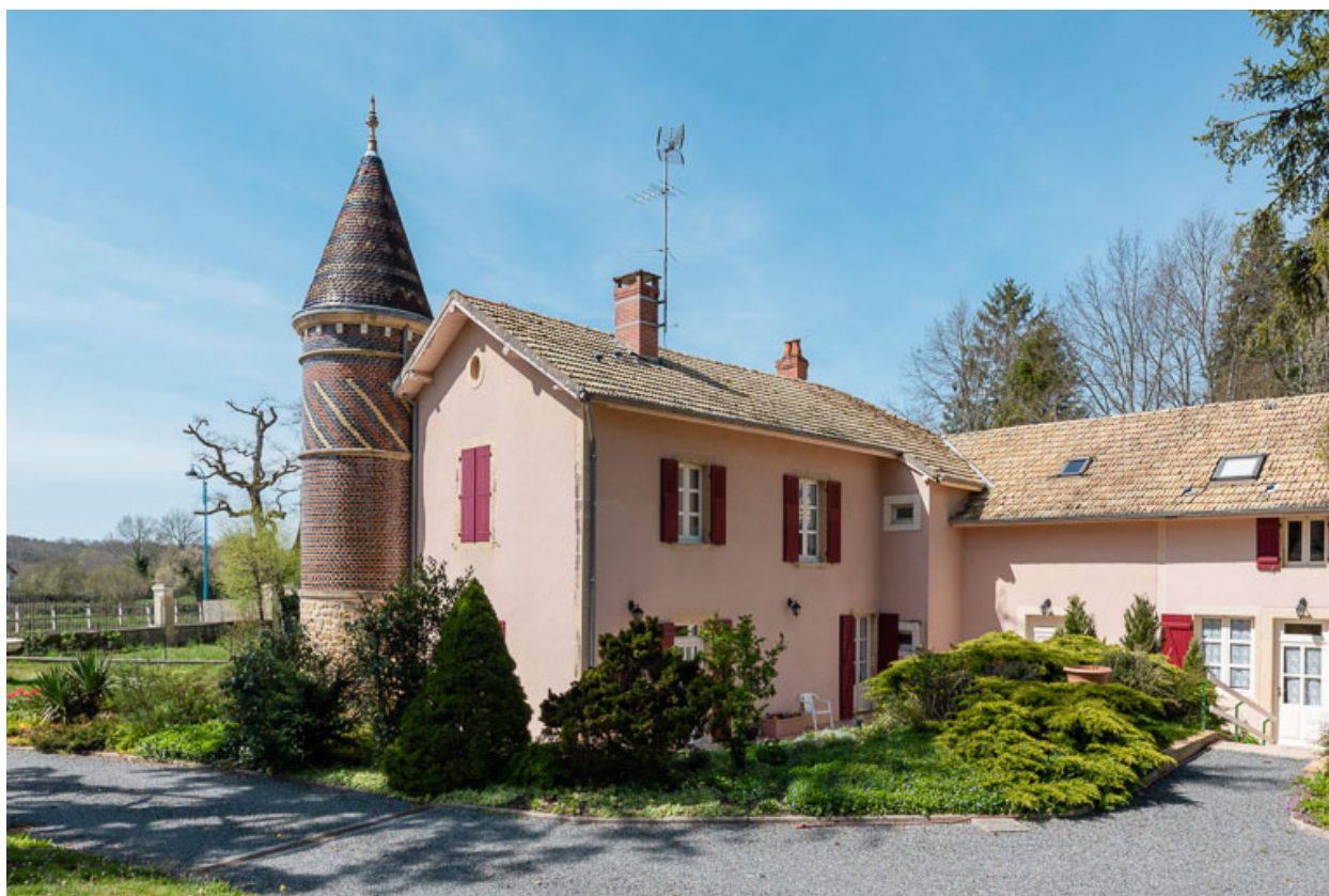
Façade nord-est, vue depuis l'est.