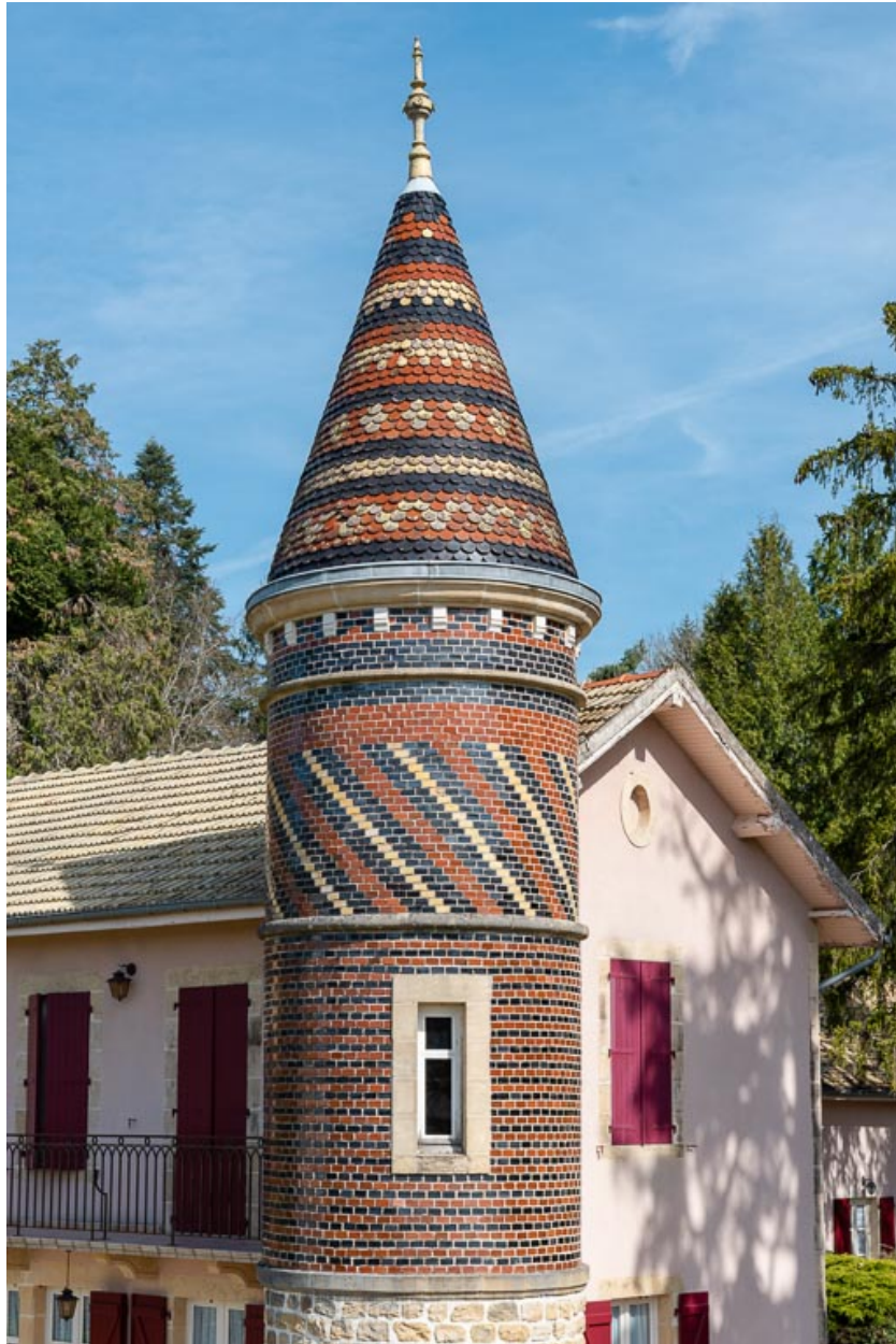
Détail de la tourelle d'angle.