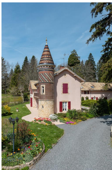
Tourelle d'angle. IVR26_20195800075NUC4A