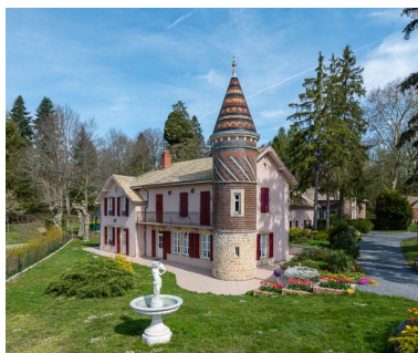
Façade sud-ouest, vue depuis le sud. IVR26_20195800065NUC4AQ