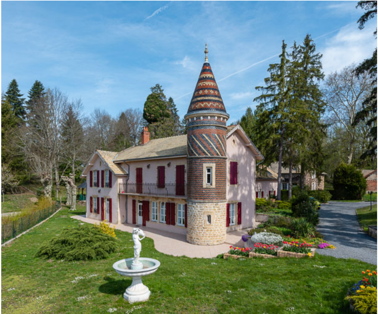
Façade sud-ouest, vue depuis le sud.