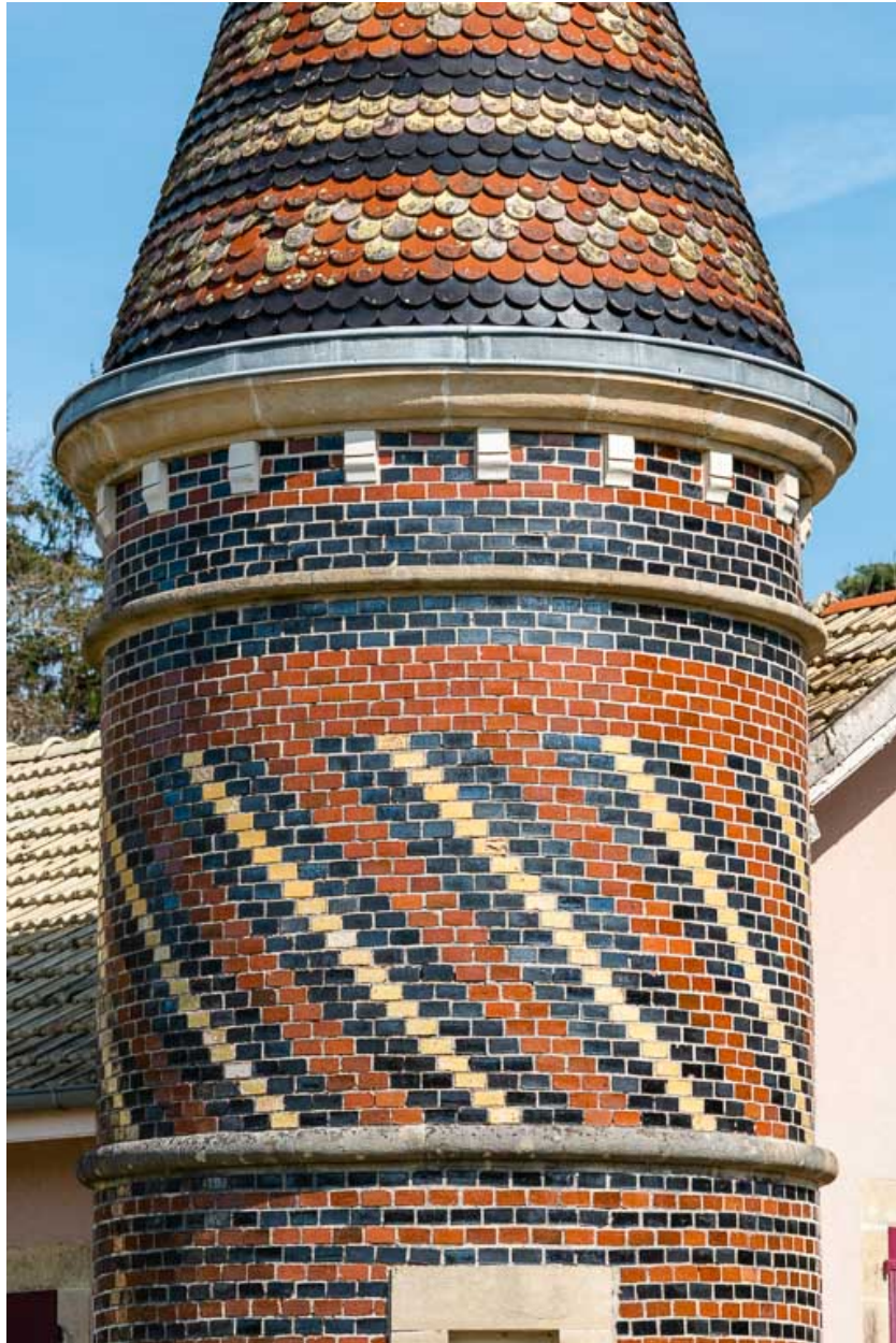
Détail de la tourelle d'angle.