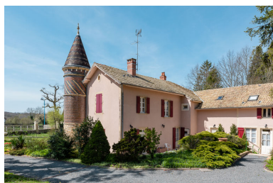
Façade nord-est, vue depuis l'est. IVR26_20195800073NUC4A