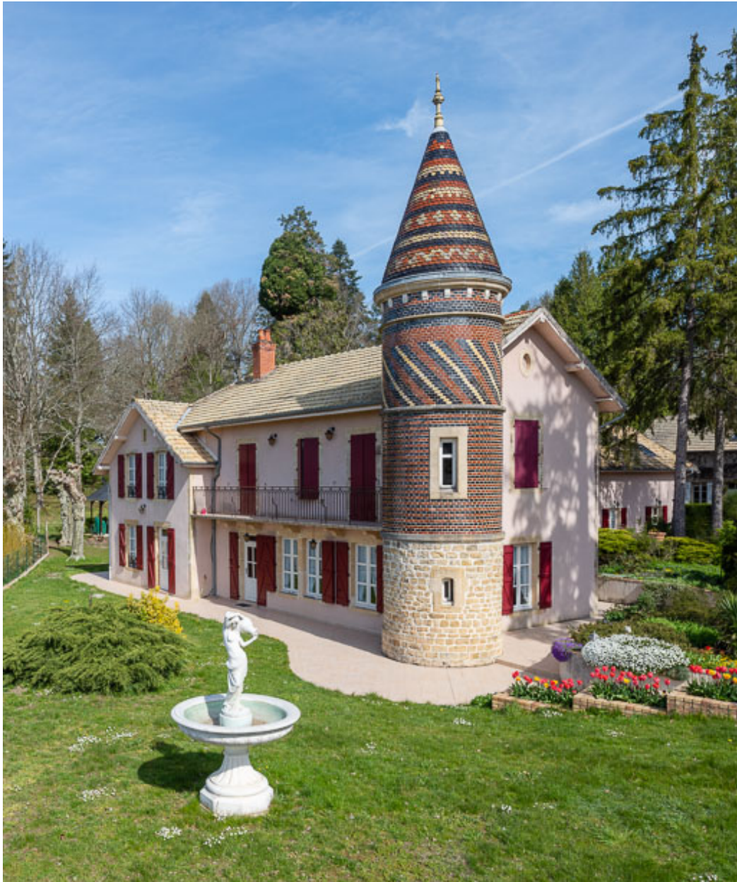
Façade sud-ouest, vue depuis le sud.