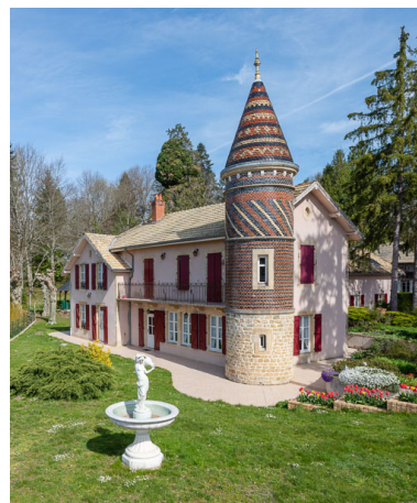
Façade sud-ouest, vue depuis le sud.