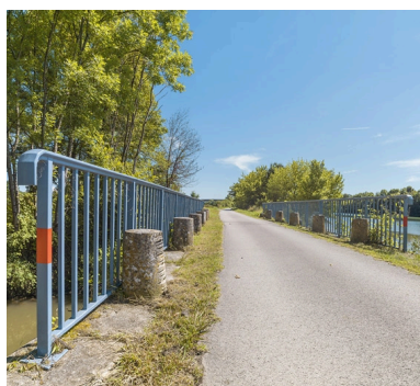
Traces du halage.