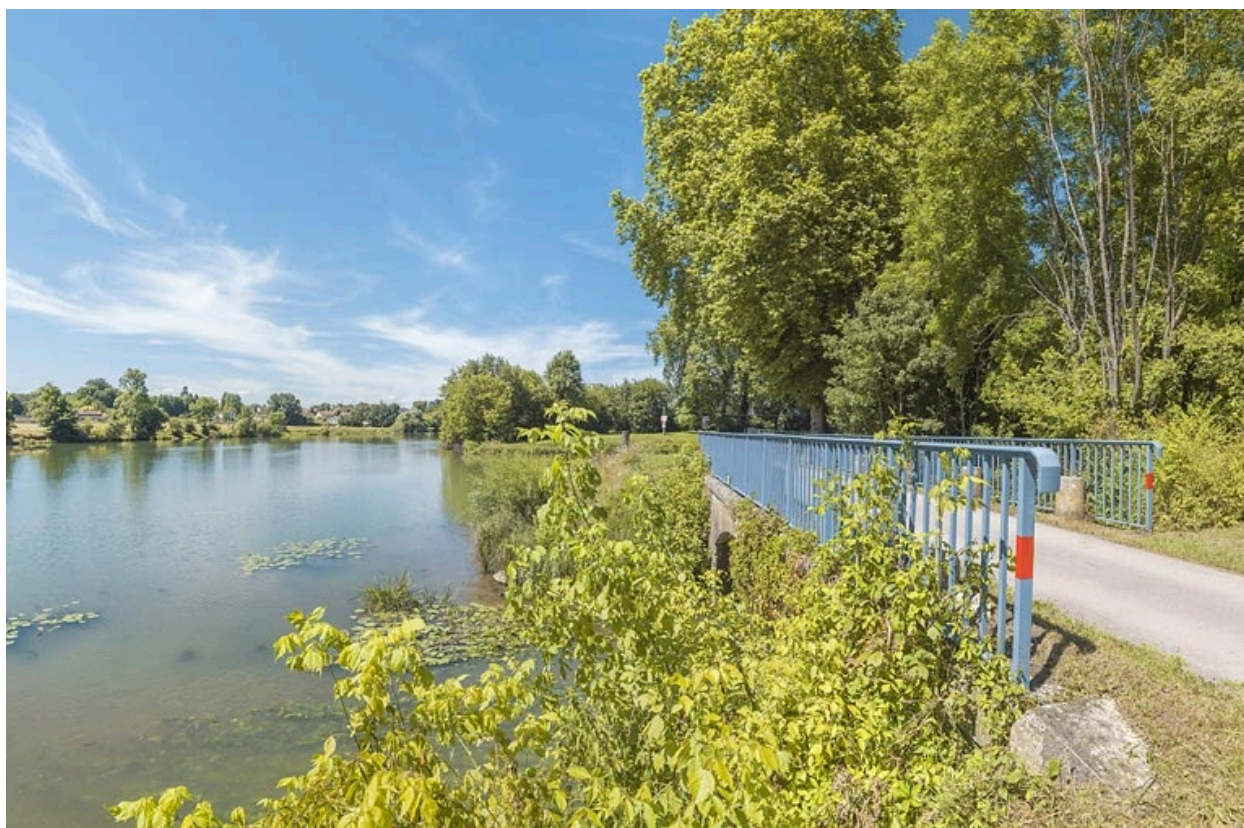
Vue d'ensemble du pont biais. A gauche, la Saône.