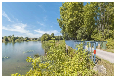
Vue d'ensemble du pont biais. A gauche, la Saône.