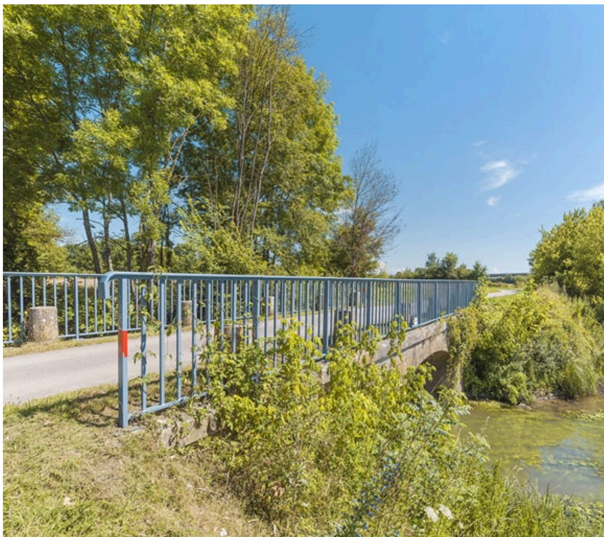
Vue d'ensemble du pont biais. A droite, la Saône.