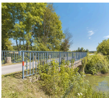
Vue d'ensemble du pont biais. A droite, la Saône.