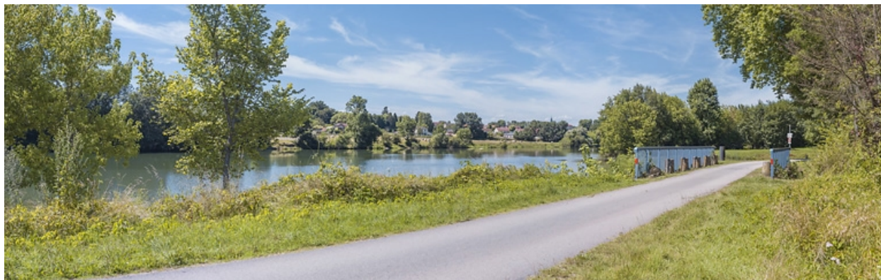
Vue d'ensemble du pont biais. A gauche, la Saône.