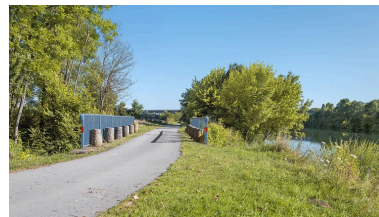
Vue du dessus. En arrière plan, le viaduc autoroutier.