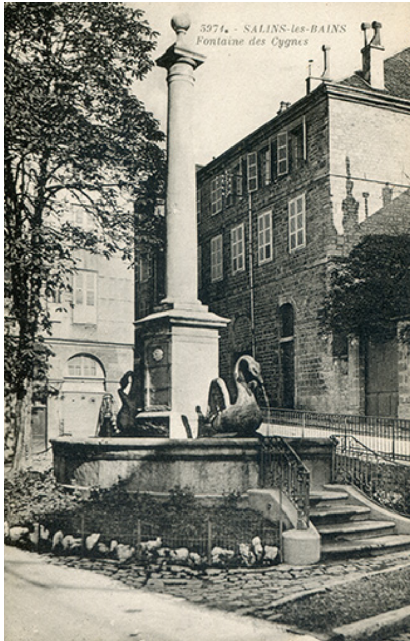
Salins-les-Bains - Fontaine des Cygnes, s.d. [fin 19e ou début 20e siècle].