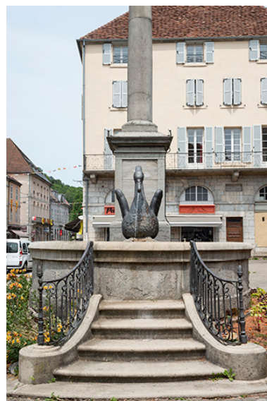
Vue rapprochée depuis le sud.