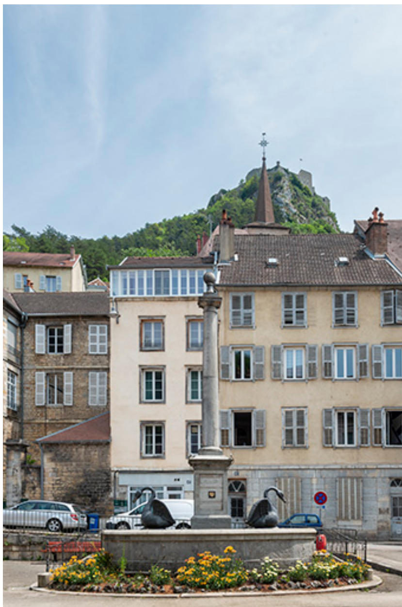
Vue depuis l'ouest.