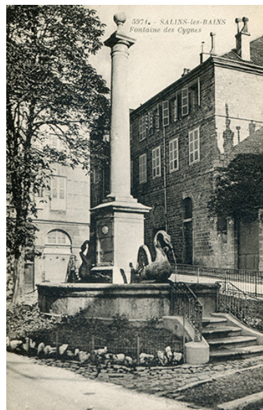
Salins-les-Bains - Fontaine des Cygnes, s.d. [fin 19e ou début 20e siècle]. Autr. auteur inconnu IVR43_20243900272NUC4A