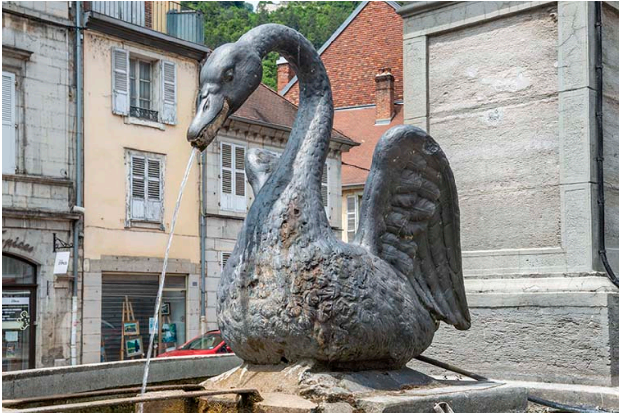
Détail d'un cygne.