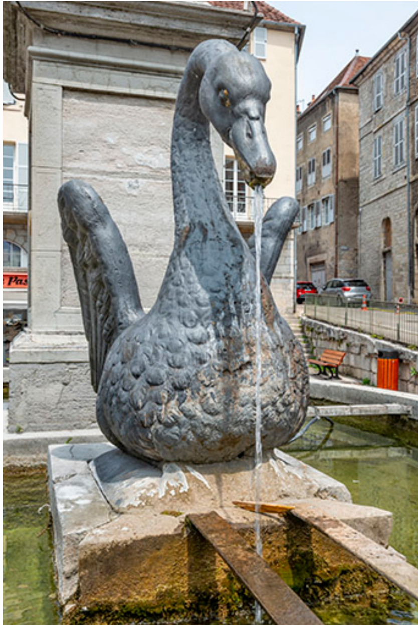
Détail d'un cygne.