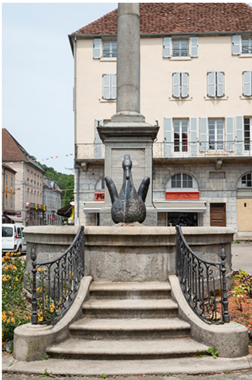
Vue rapprochée depuis le sud.