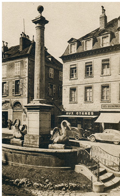
Salins-les-Bains - Fontaine des Cygnes, s.d. [vers 1930].