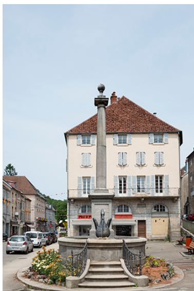
Vue axiale, depuis le sud.