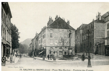
Salins-les-Bains (Jura) - Place Max Buchon - Fontaine des Cygnes, s.d. [fin 19e ou début 20e siècle]. IVR43_20243900359NUC4A