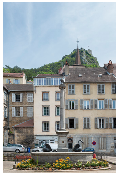
Vue depuis l'ouest. IVR43_20233900657NUC4A