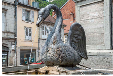
Détail d'un cygne. IVR43_20233900662NUC4A