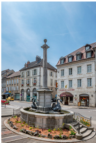
Vue d'ensemble depuis la rue d'Orgemont.