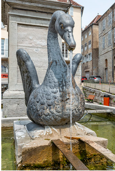
Détail d'un cygne.