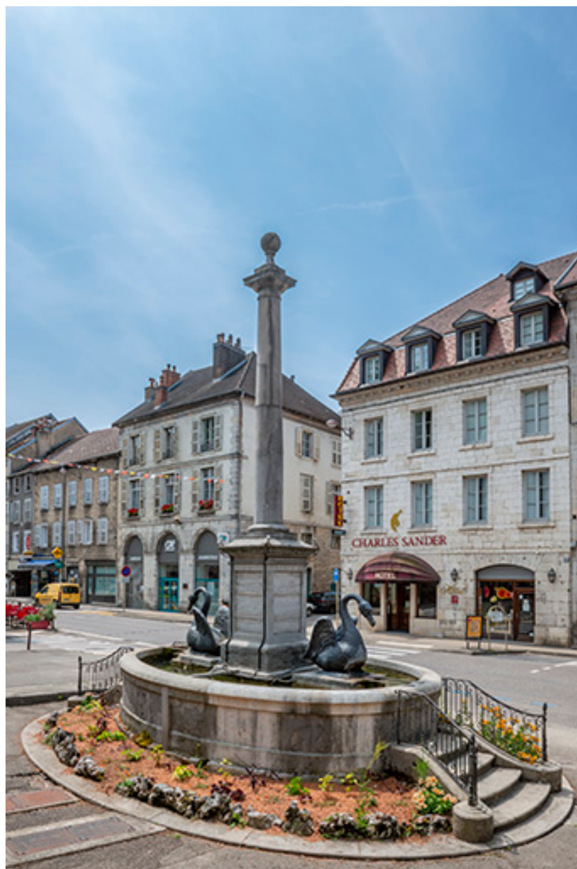
Vue d'ensemble depuis la rue d'Orgemont.