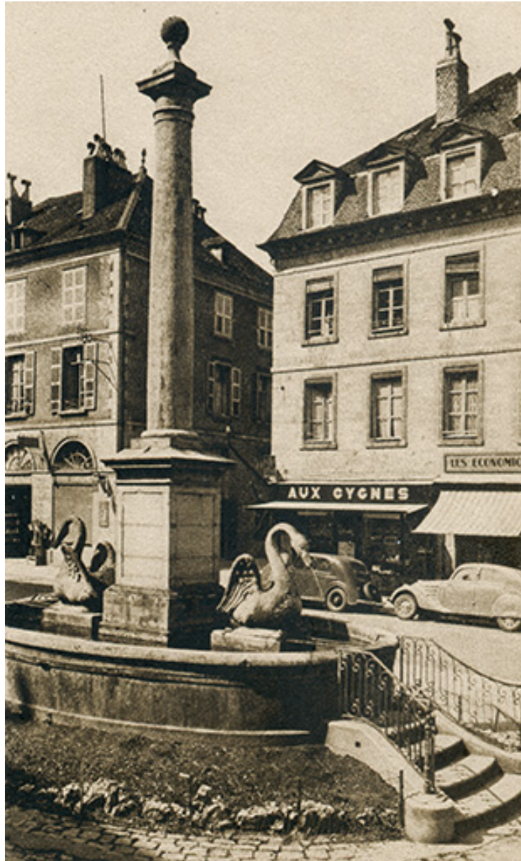
Salins-les-Bains - Fontaine des Cygnes, s.d. [vers 1930].