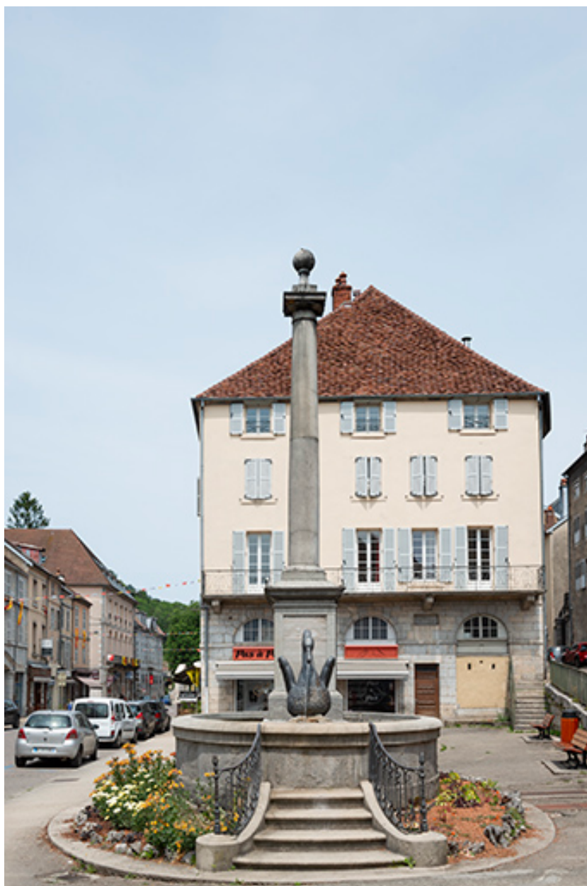
Vue axiale, depuis le sud.