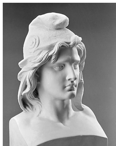
Vue rapprochée de trois quarts. IVR43_20023900188X