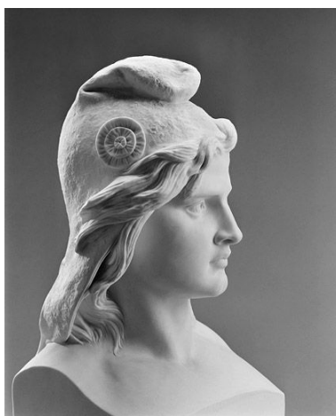
Vue rapprochée de profil. IVR43_20023900163X