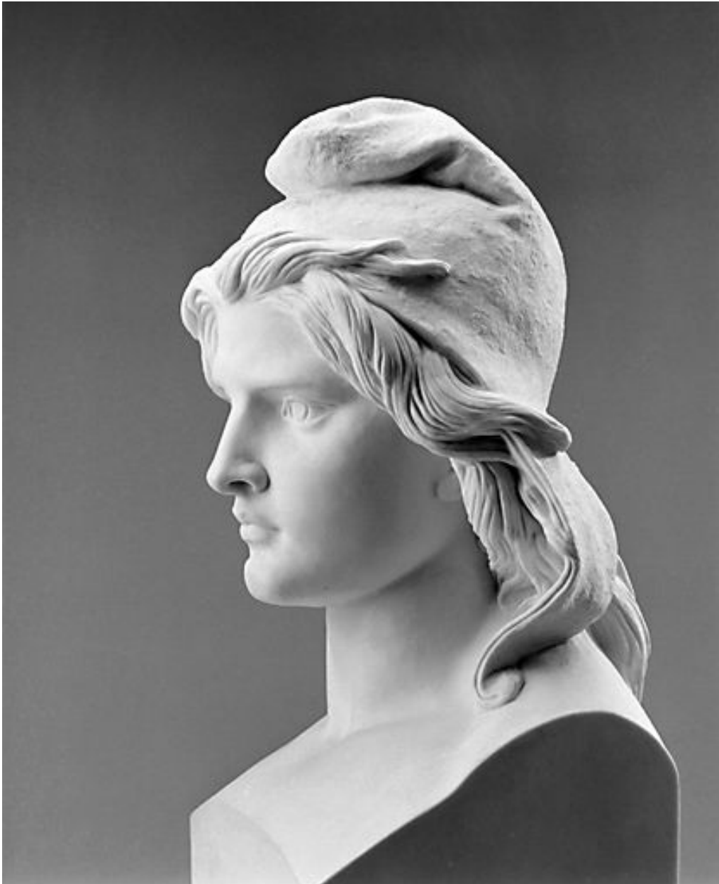
Vue rapprochée de profil.