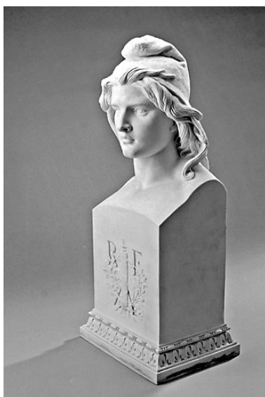
Vue de trois quarts. IVR43_20023900164X