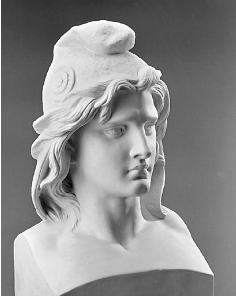
Vue rapprochée de trois quarts.