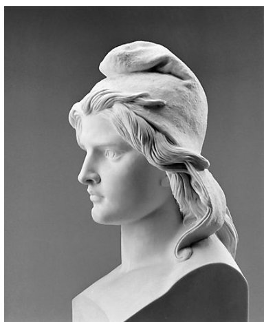
Vue rapprochée de profil. IVR43_20023900162X