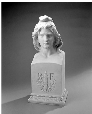
Vue de face. IVR43_20023900165X