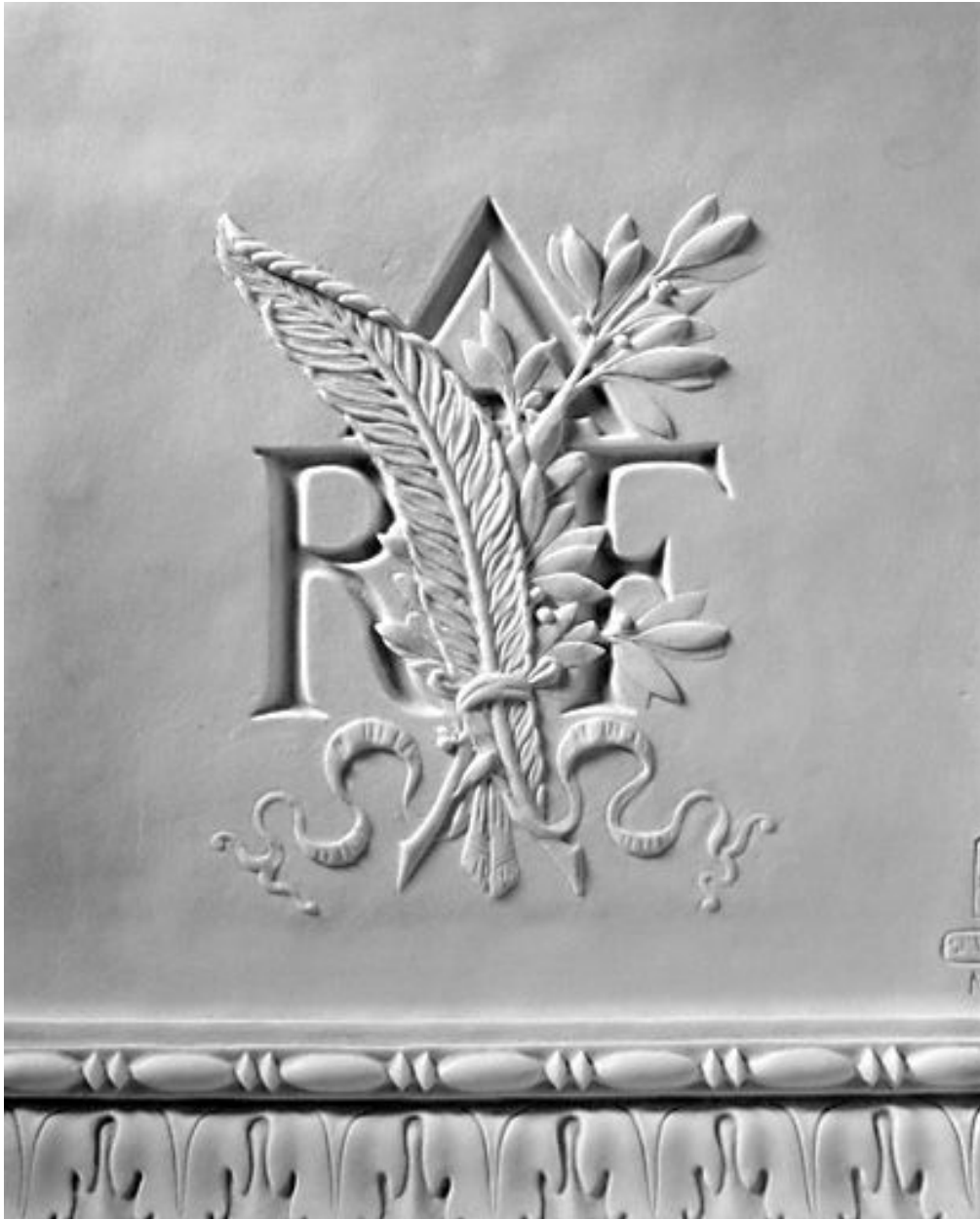
Détail du décor à l'arrière du socle.