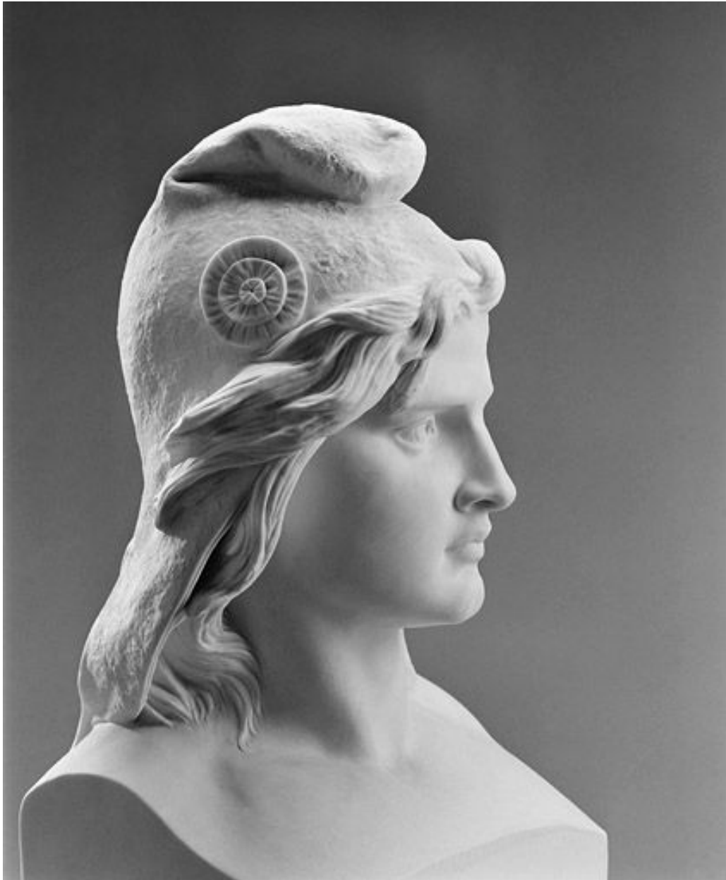
Vue rapprochée de profil.