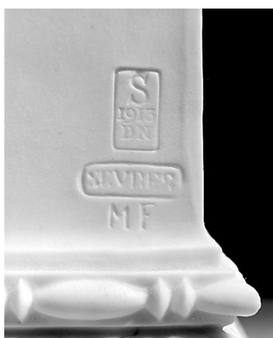
Date et inscriptions à l'arrière du socle. IVR43_20023900167X