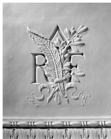
Détail du décor à l'arrière du socle. IVR43_20023900166X