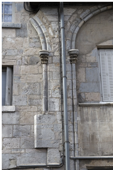
Façade antérieure : détail des arcs et des chapiteaux, vue éloignée.