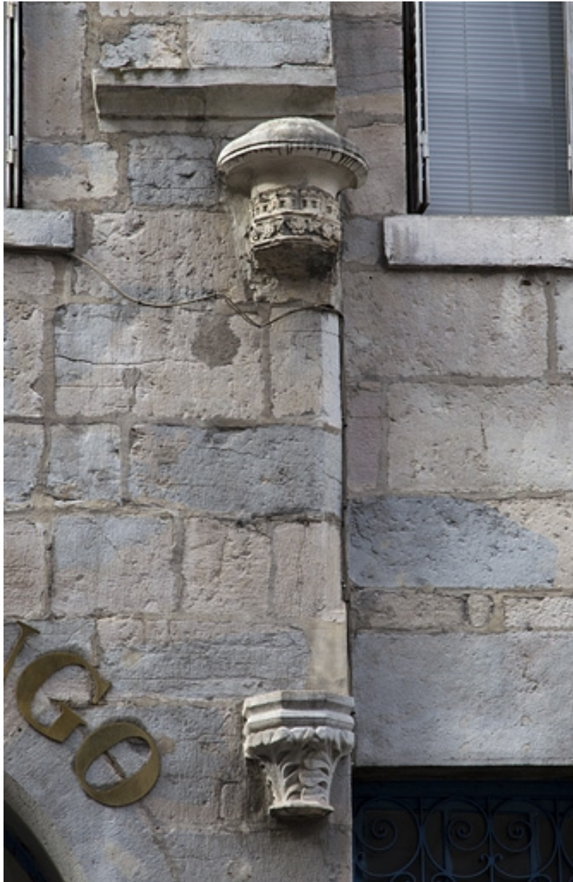
Façade antérieure : détail du décor.