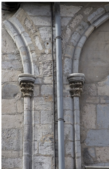
Façade antérieure : détail des arcs et des chapiteaux, vue rapprochée.