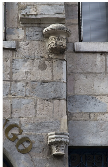
Façade antérieure : détail du décor. IVR43_20112502628NUC2A