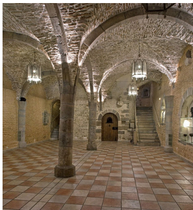
Vue d'ensemble de la cave depuis le fond.