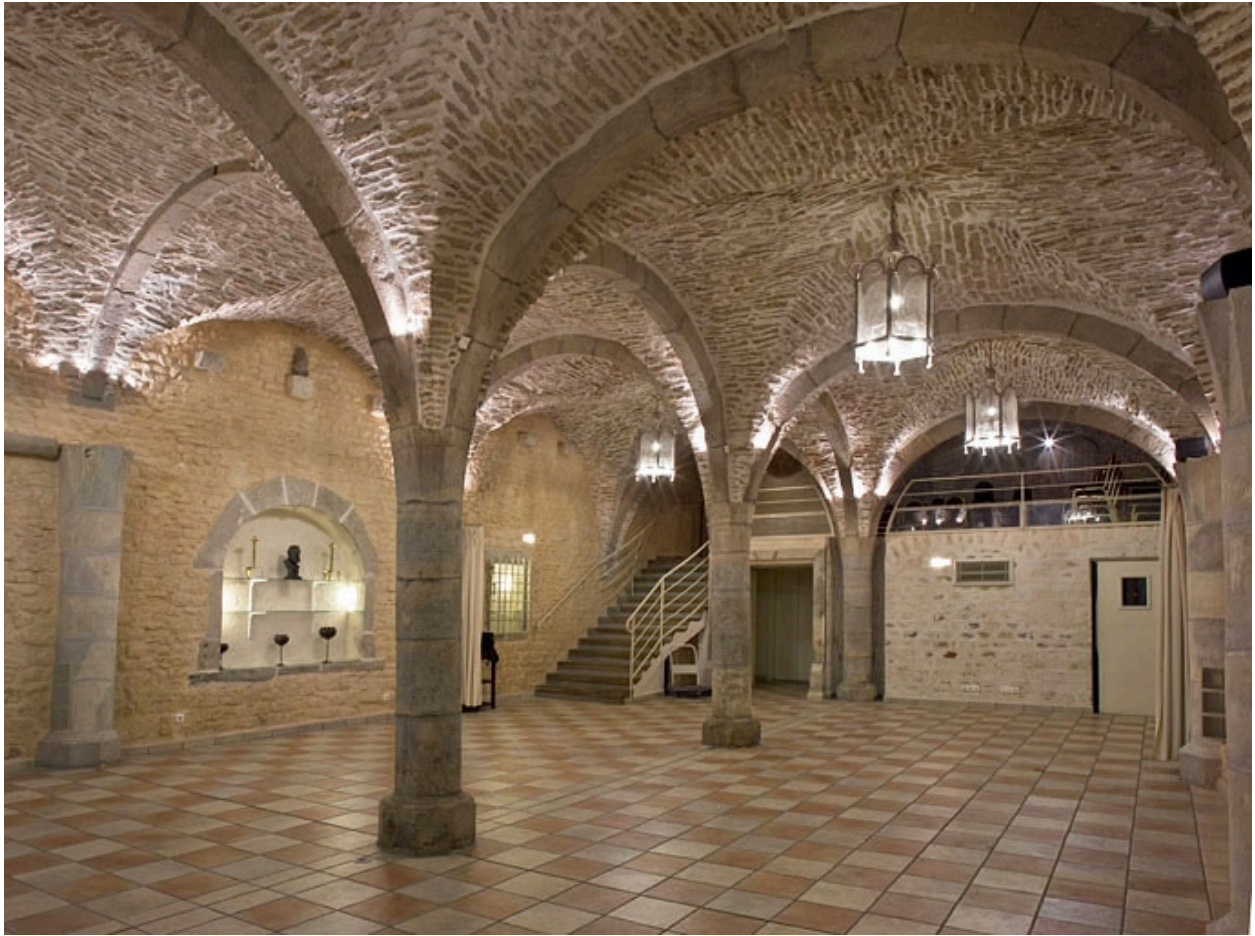
Vue d'ensemble de la cave depuis le fond, de trois quarts droit.