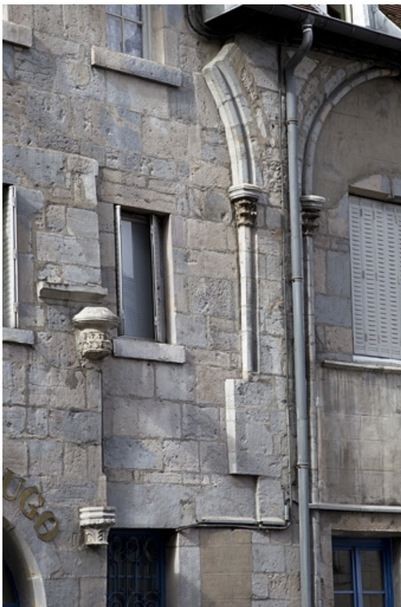
Façade antérieure : détail des arcs et des chapiteaux, de trois quarts gauche.