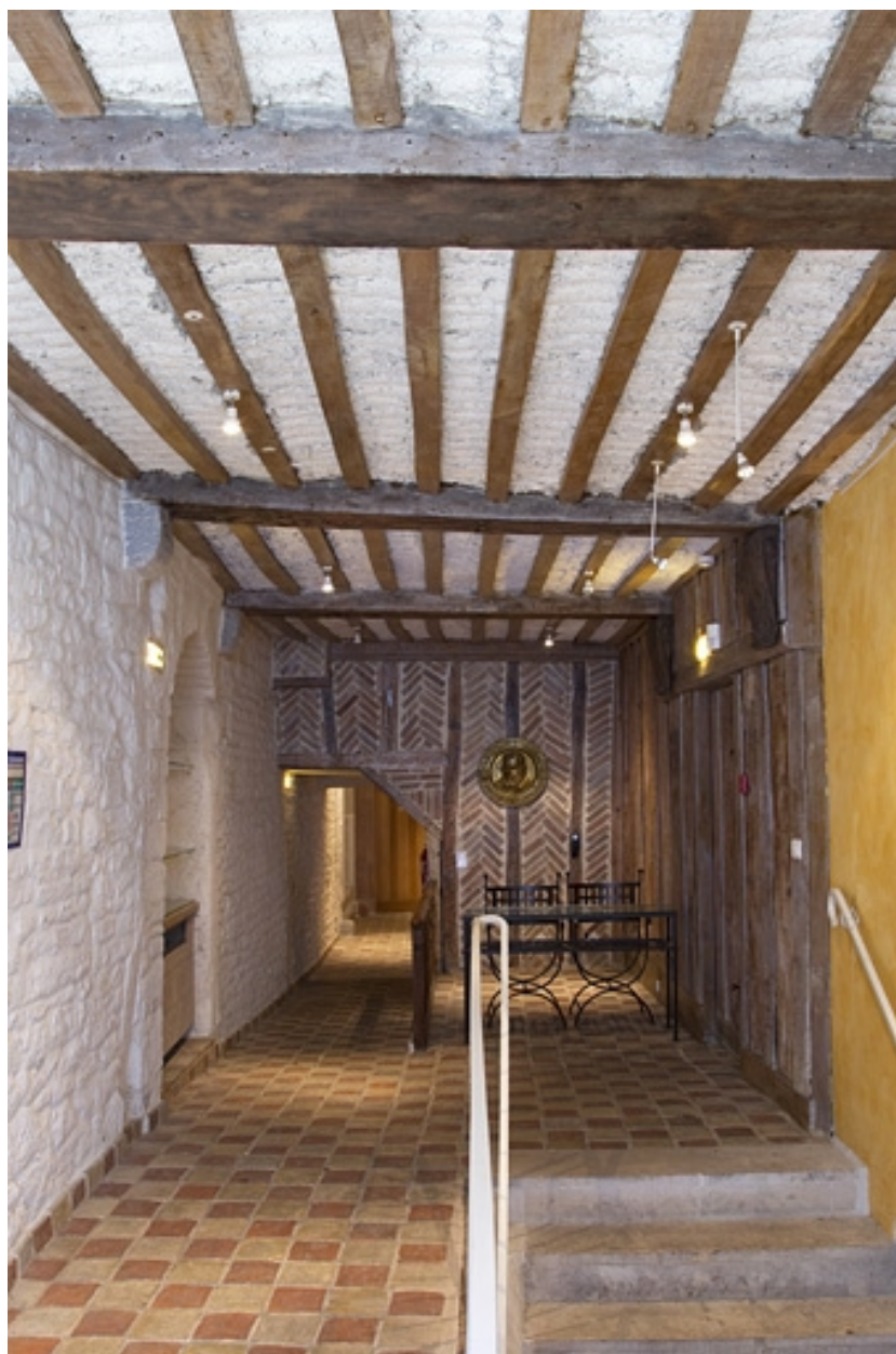
Vue d'ensemble du couloir.