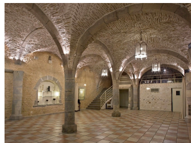
Vue d'ensemble de la cave depuis le fond, de trois quarts droit. IVR43_20112502627NUC2A