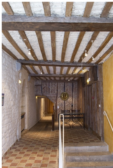
Vue d'ensemble du couloir. IVR43_20112502632NUC2A