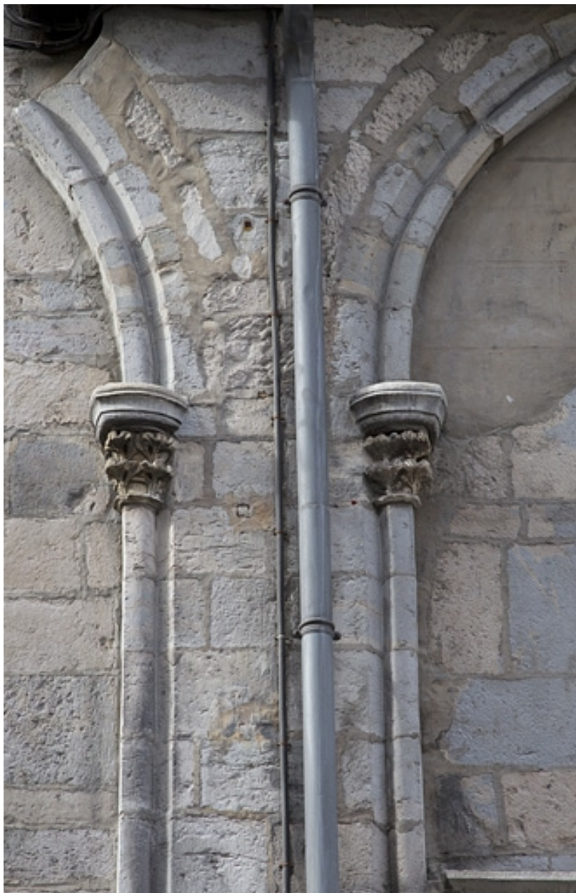
Façade antérieure : détail des arcs et des chapiteaux, vue rapprochée.