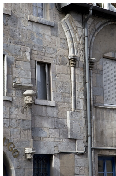
Façade antérieure : détail des arcs et des chapiteaux, de trois quarts gauche.