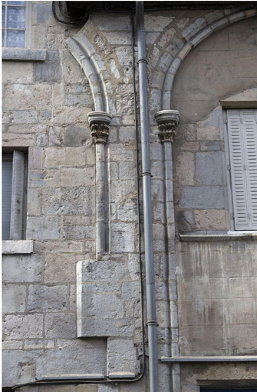
Façade antérieure : détail des arcs et des chapiteaux, vue éloignée.