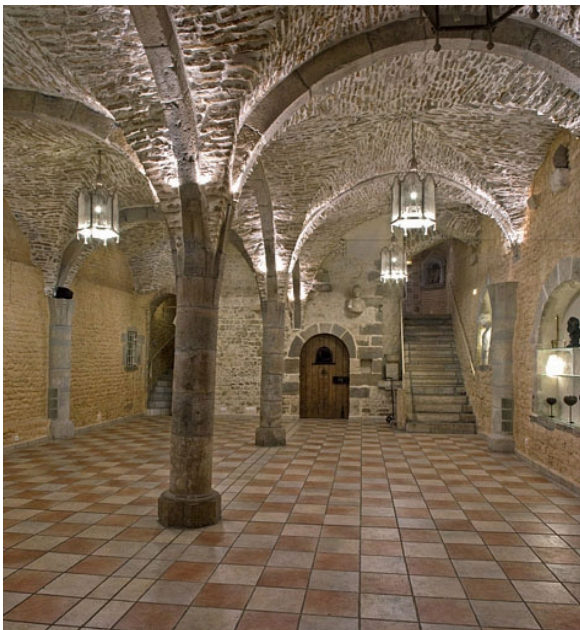
Vue d'ensemble de la cave depuis le fond.