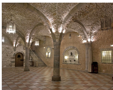
Vue d'ensemble de la cave depuis le fond, de trois quarts gauche.