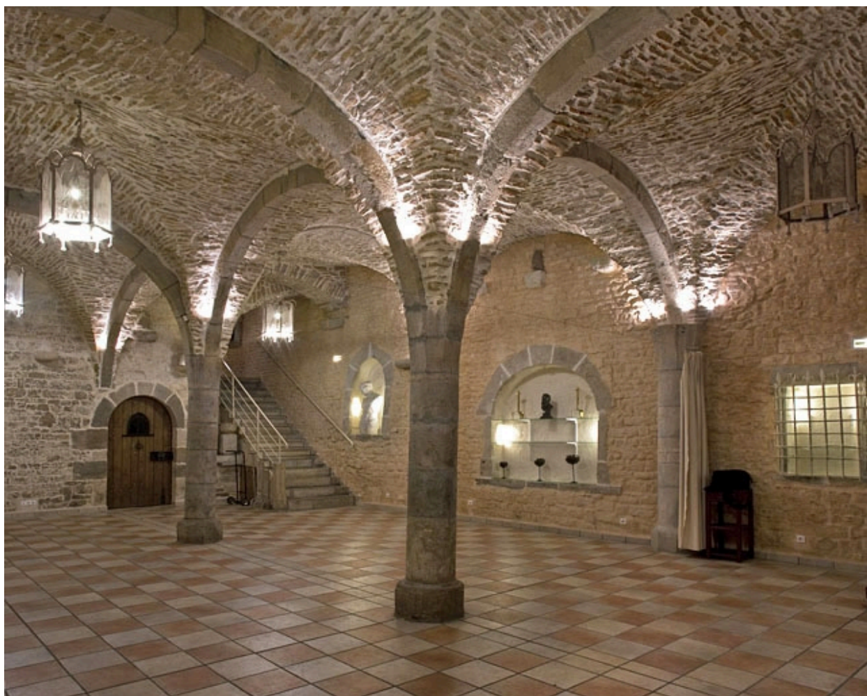
Vue d'ensemble de la cave depuis le fond, de trois quarts gauche.