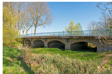
L'ensemble du pont, vu de l'ouest.