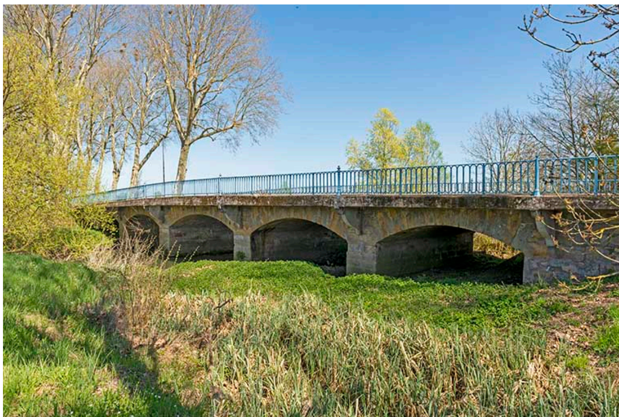
L'ensemble du pont, vu de l'ouest.