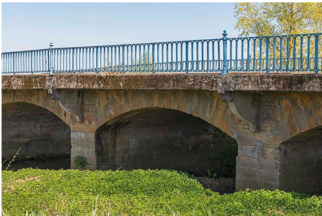
Les arches du pont, depuis l'ouest.