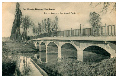
Le pont au début du 20e siècle.