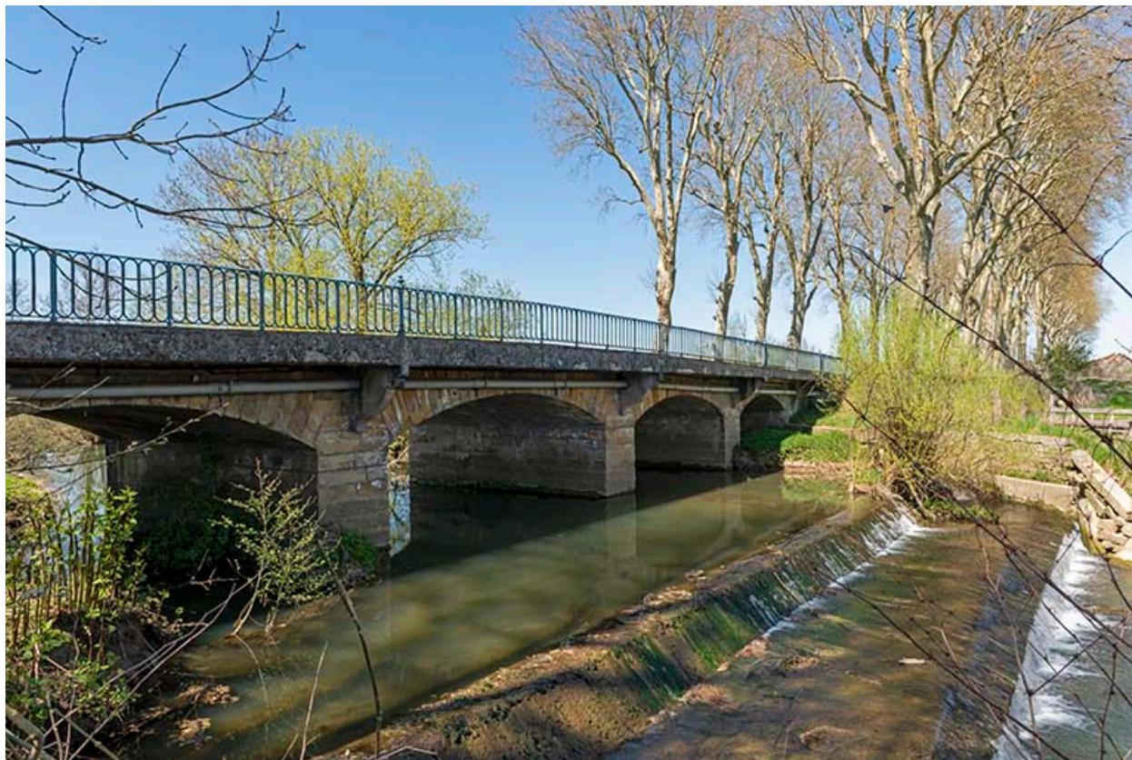
L'ensemble du pont, vu de l'est.