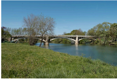
Pont routier sur la D933. IVR26_20107100527NUC2A