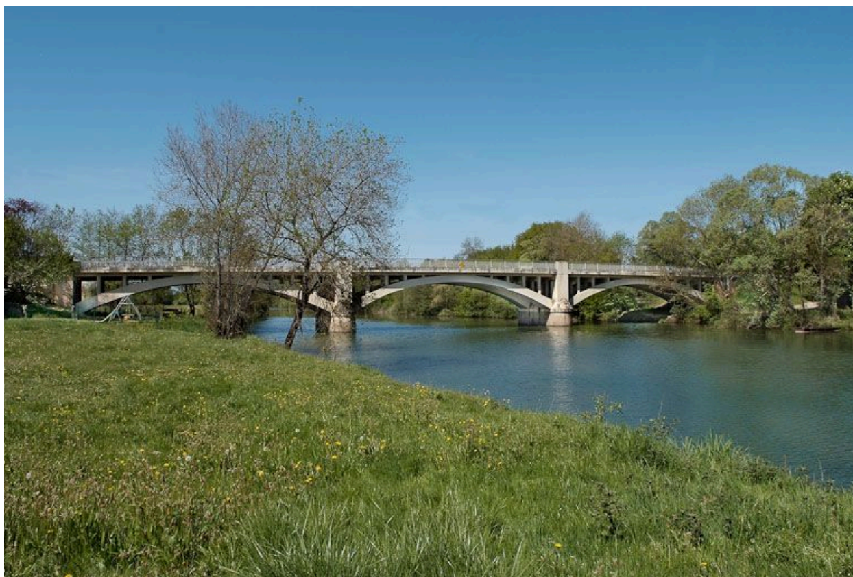
Pont routier sur la D933.