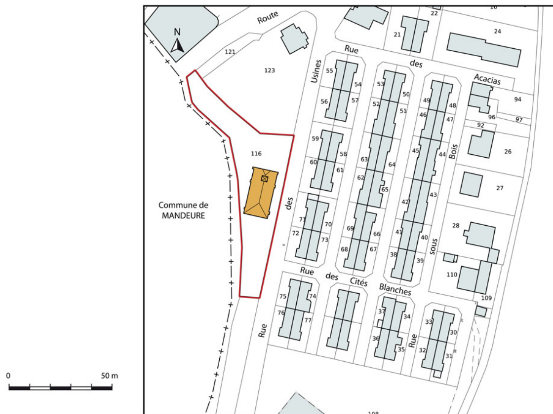
Plan-masse et de situation.