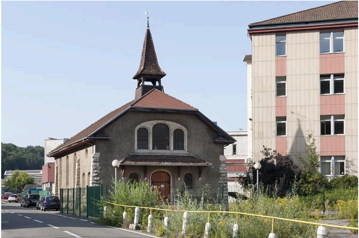
Vue depuis le nord-est.