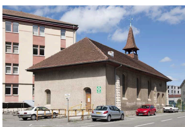
Vue de trois quarts arrière. IVR43_20112502282NUC4A