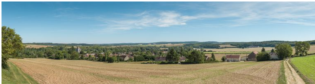
Vue panoramique du village de Lucy : à gauche, l'église et à droite en arrière-plan, le château de Faulin (IA89002012).