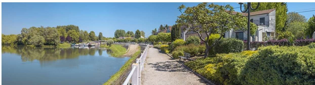
Vue d'ensemble de la digue de halage, en aval du site d'écluse et le long de la commune.