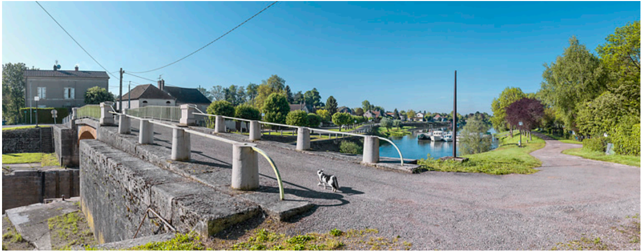
Vue d'ensemble de la commune sur la rive gauche de la Saône. Au premier plan le pont sur le site de l'écluse.