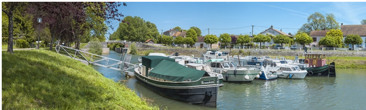
Vue d'ensemble de la halte nautique, en aval du site d'écluse, rive droite.