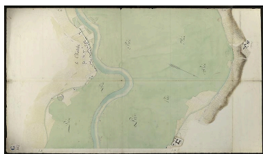
Plan n°16 du cours de la rivière sur les territoires du Châtelet et de Bonnencontre.