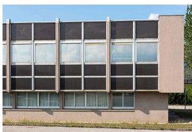
Façade antérieure : extrémité droite.