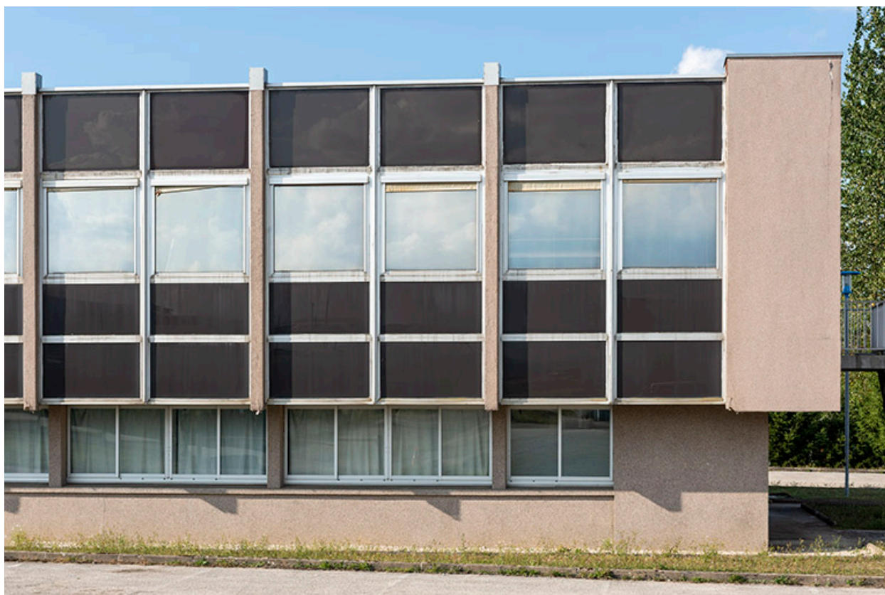
Façade antérieure : extrémité droite.