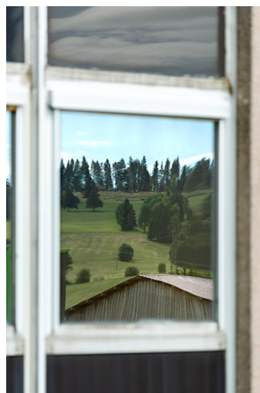
Paysage se reflétant dans l'une des fenêtres.