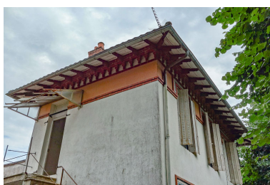
Élévation du pavillon du gardien, fenêtres de l'étage et toiture.