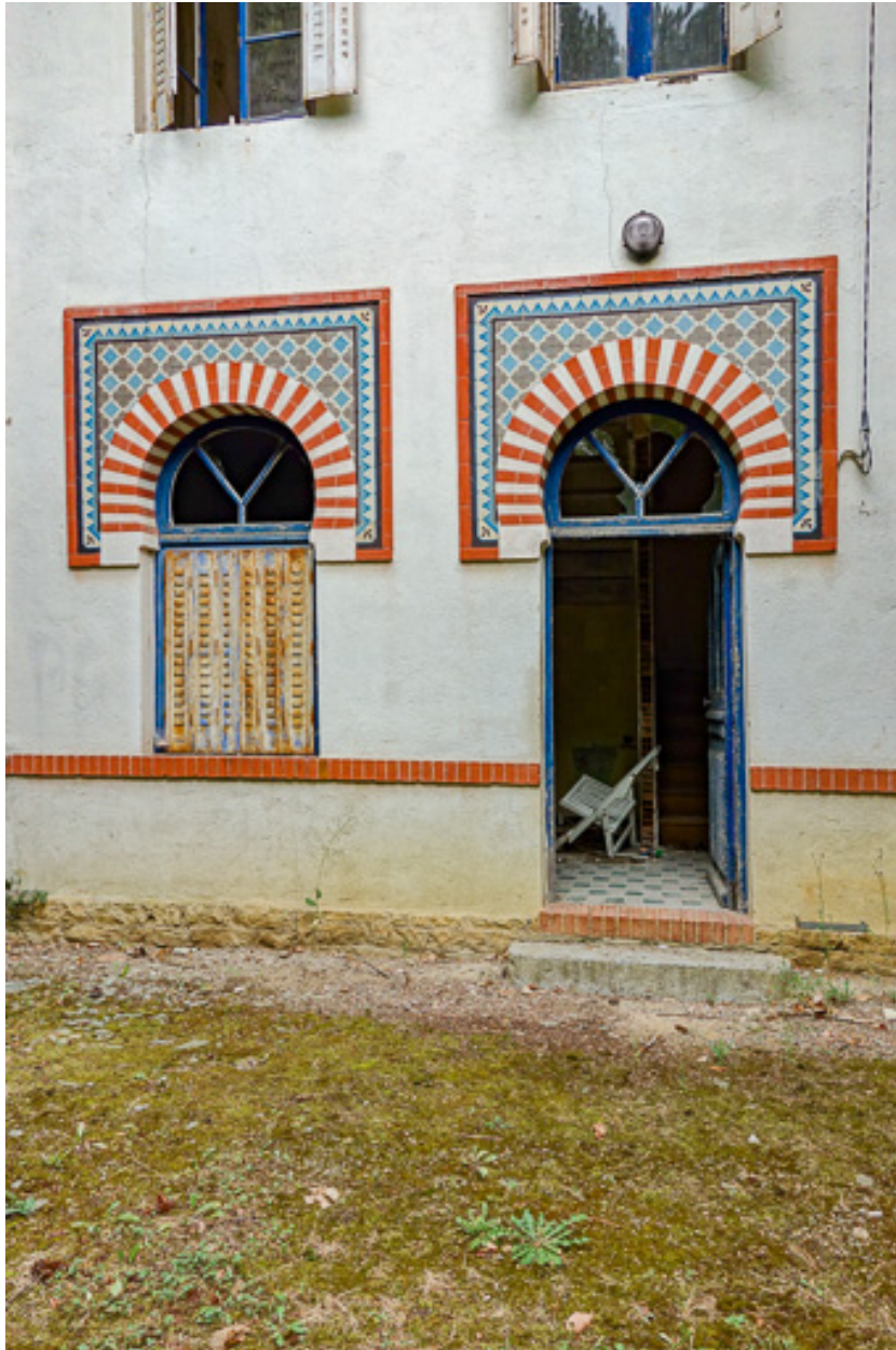
Élévation du pavillon du gardien, façade principale, décor de céramique.