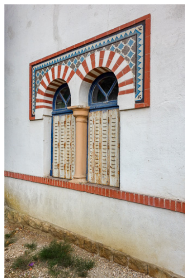
Élévation du pavillon du gardien, baies jumelées du rez-de-chaussée. IVR26_20192100103NUC2A