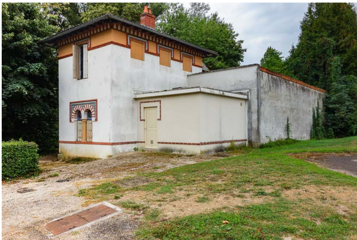
Emplacement du pavillon de la source (détruit et remplacé par une construction tardive).