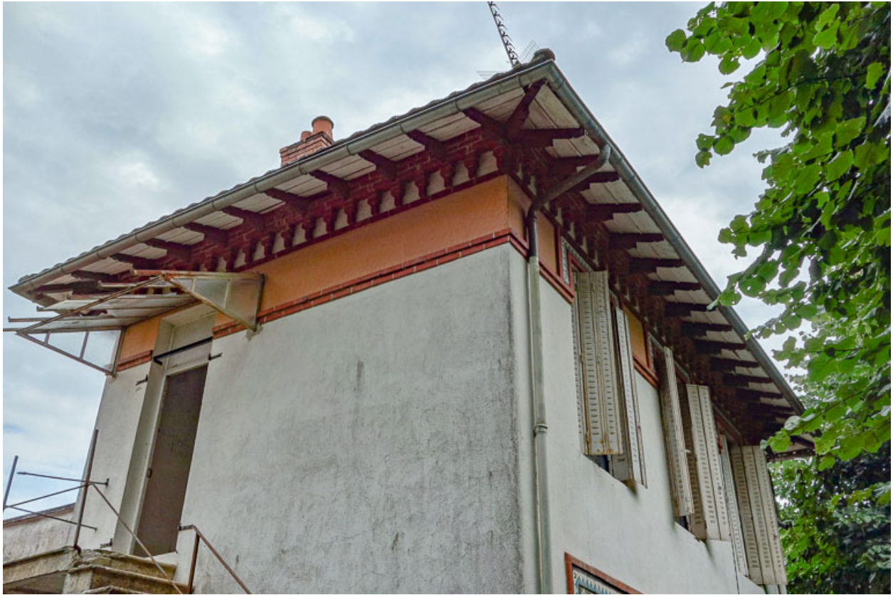
Élévation du pavillon du gardien, fenêtres de l'étage et toiture.