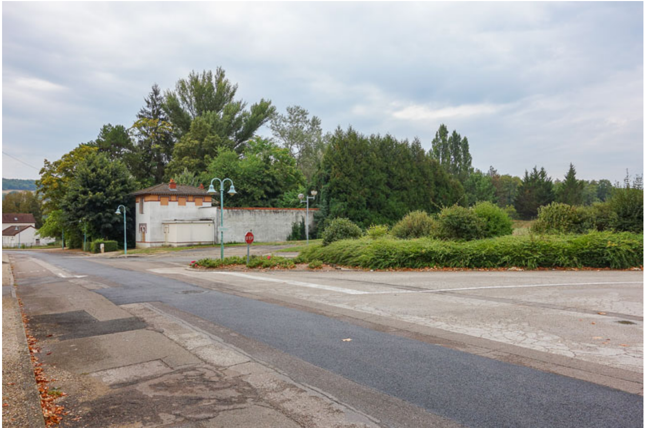
Vue du site avant la construction du nouvel établissement thermal (2018).