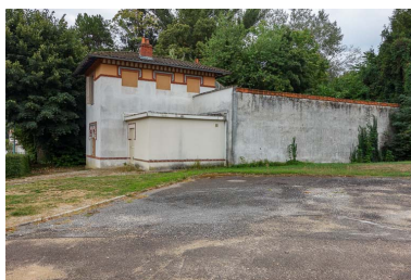
Vue du site avant la construction du nouvel établissement thermal (2018).

Phot. Fabien Dufoulon IVR26_20192100111NUC2A