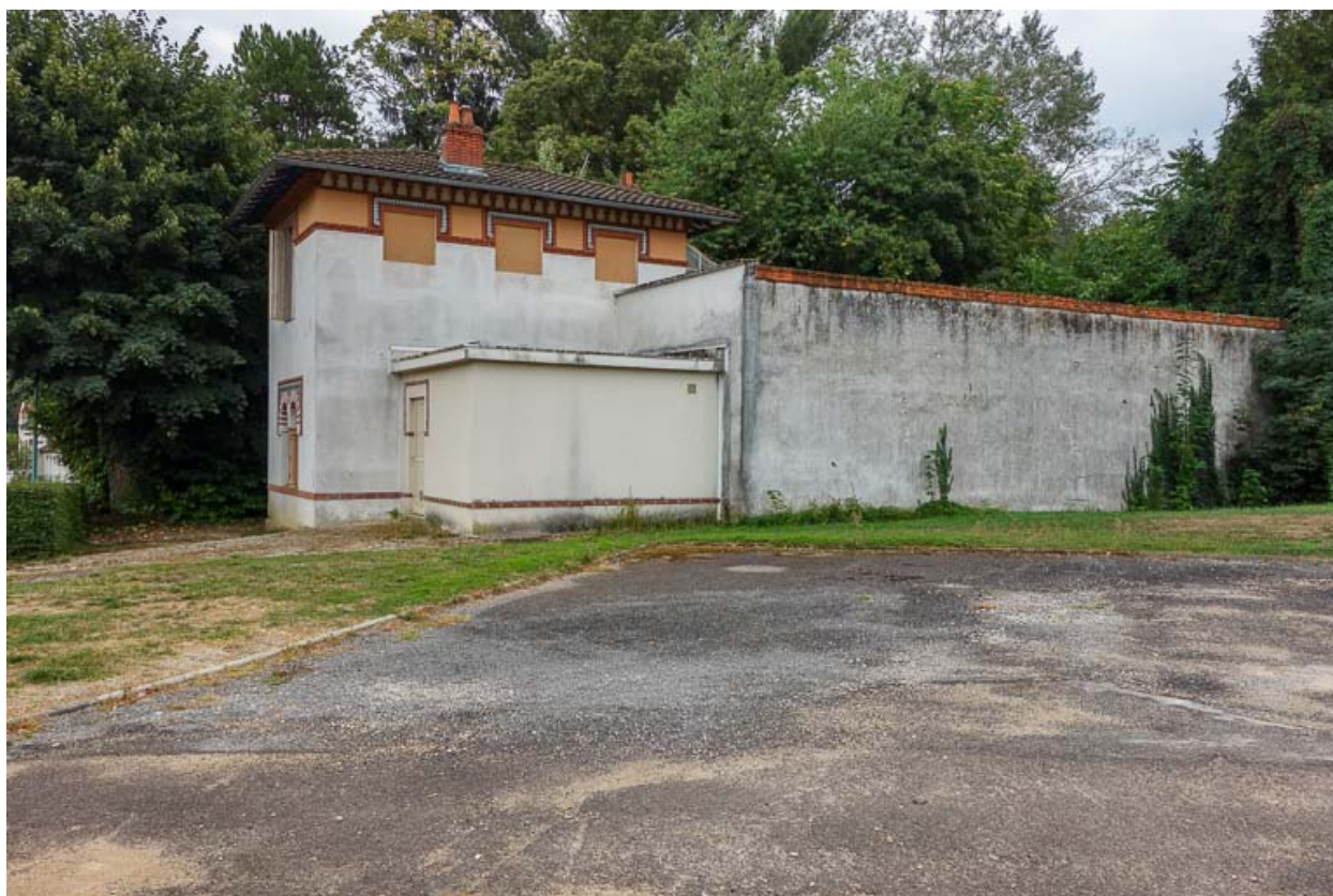
Vue du site avant la construction du nouvel établissement thermal (2018).