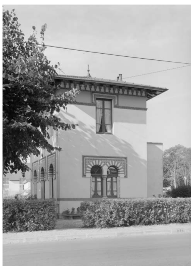
Élévation du pavillon du gardien, vue depuis l'est.

IVR26_20192100102NUC2A