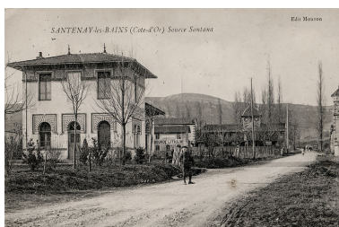
Vue ancienne, depuis le sud-est. IVR26_20202100078NUC4A