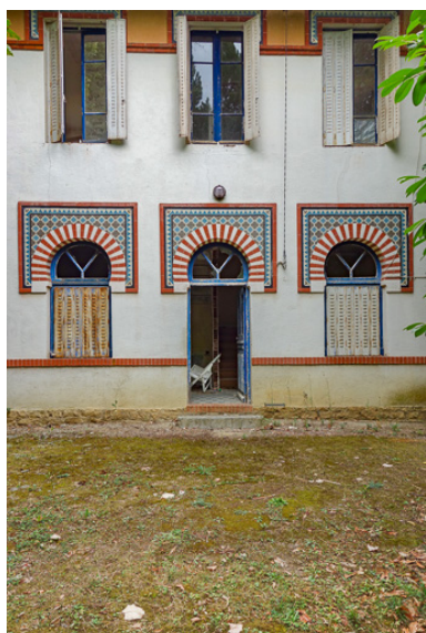
Élévation du pavillon du gardien, façade principale. IVR26_20192100104NUC2A