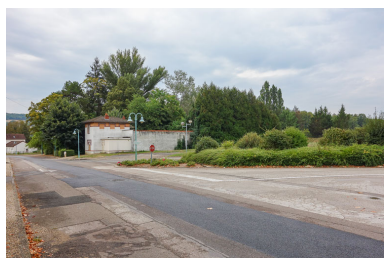
Vue du site avant la construction du nouvel établissement thermal (2018).

Plan-masse et de situation, extrait du plan cadastral (2020). Dess. Pierre-Marie Barbe-Richaud IVR26_20202100151NUDA