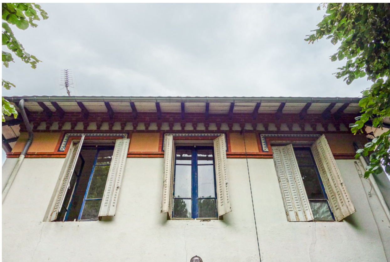
Élévation du pavillon du gardien, fenêtres de l'étage et toiture.