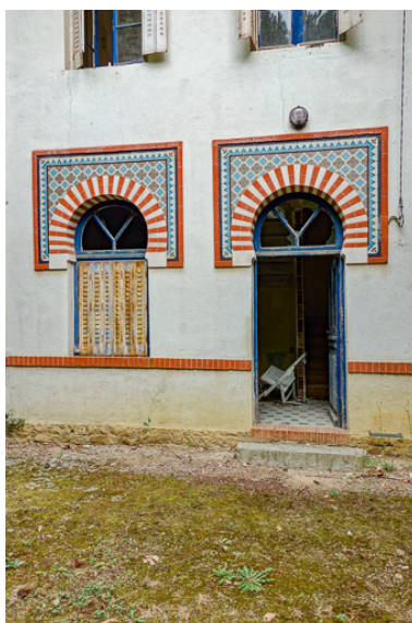
Élévation du pavillon du gardien, façade principale, décor de céramique. IVR26_20192100107NUC2A