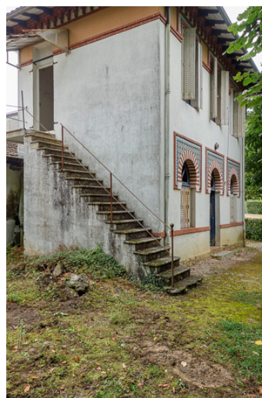
Élévation du pavillon du gardien, vue depuis le sud-ouest.

IVR26_20192100105NUC2A