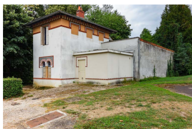
Emplacement du pavillon de la source (détruit et remplacé par une construction tardive).

IVR26_20192100109NUC2A