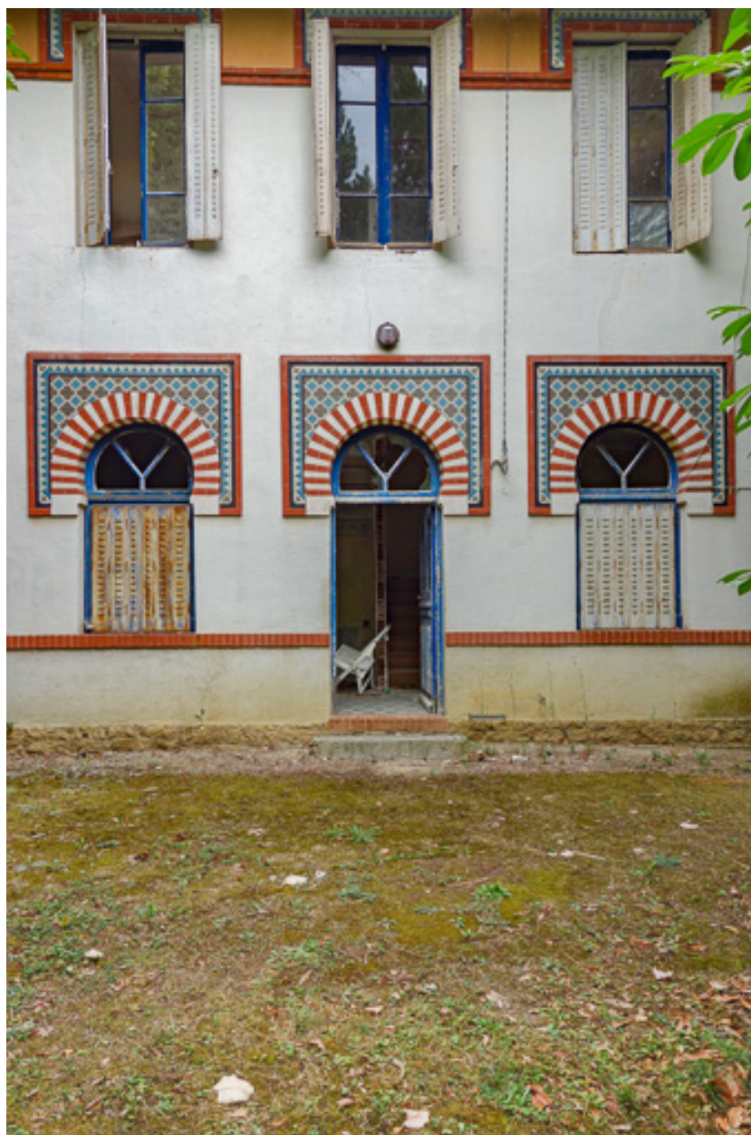
Élévation du pavillon du gardien, façade principale.