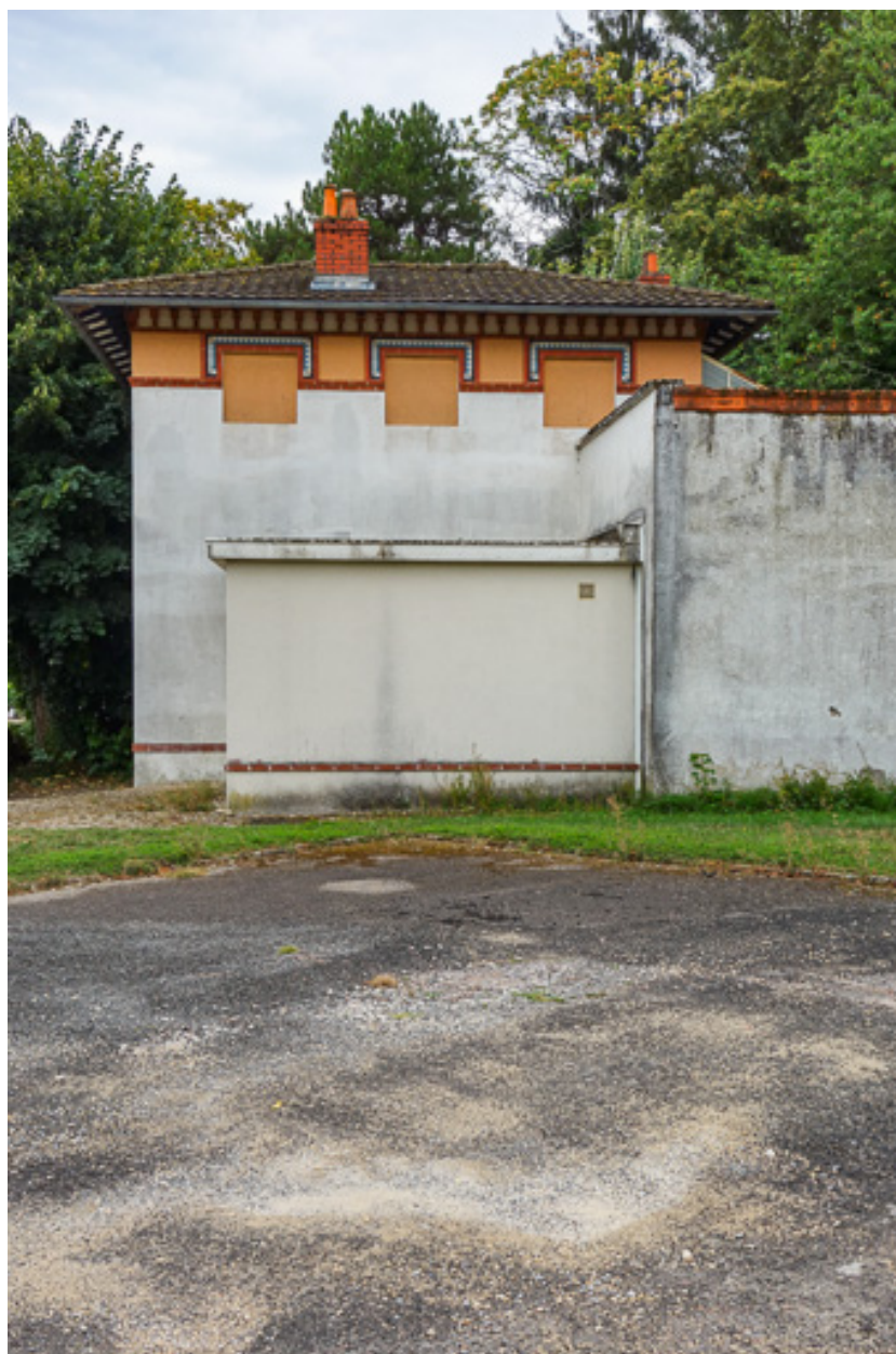
Emplacement du pavillon de la source (détruit et remplacé par une construction tardive).