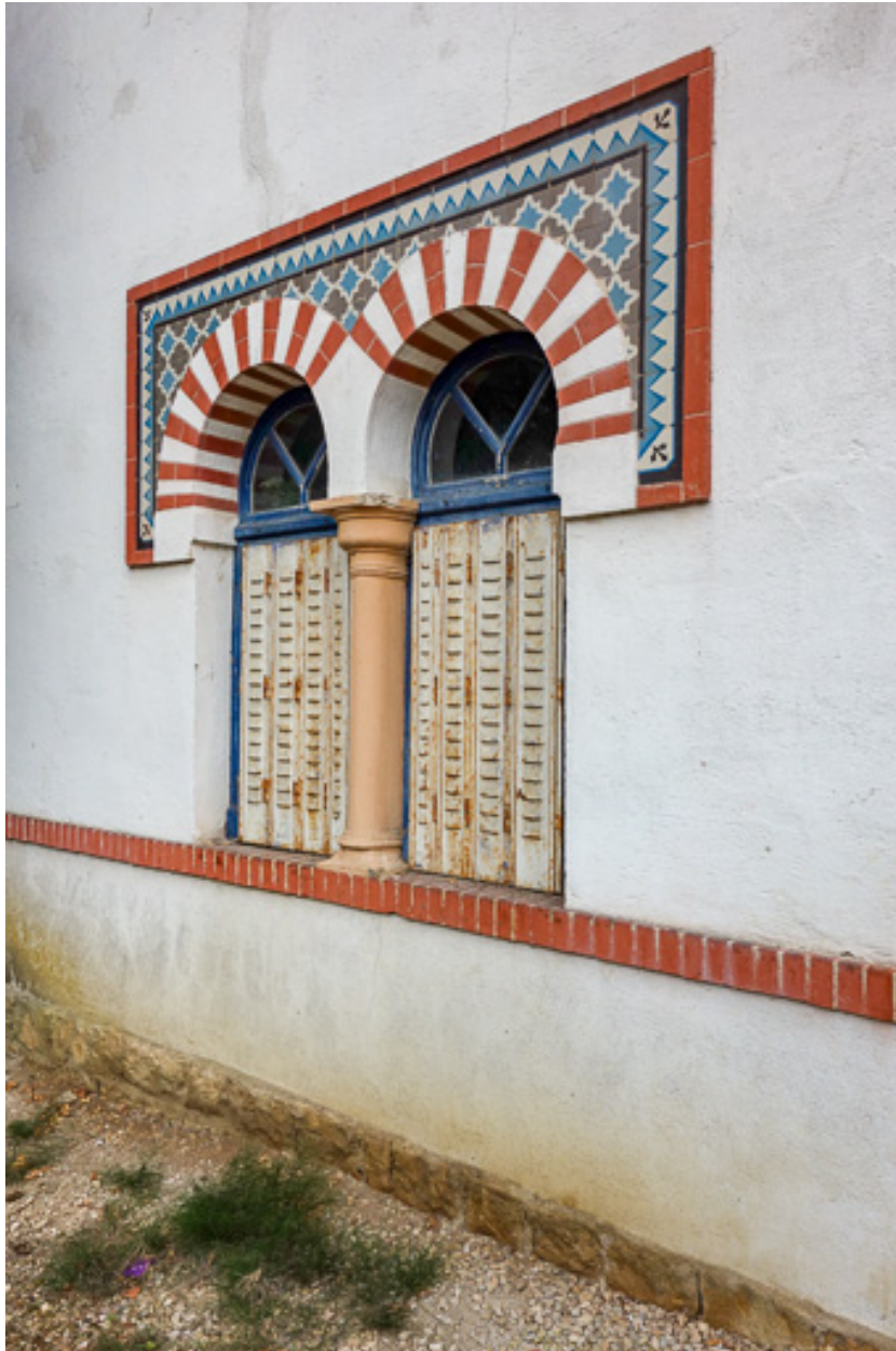
Élévation du pavillon du gardien, baies jumelées du rez-de-chaussée.