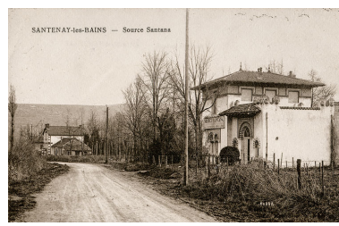
Vue ancienne, depuis le nord-ouest.