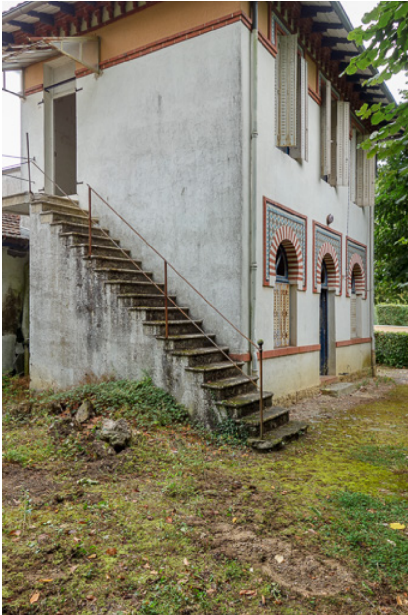
Élévation du pavillon du gardien, vue depuis le sud-ouest.