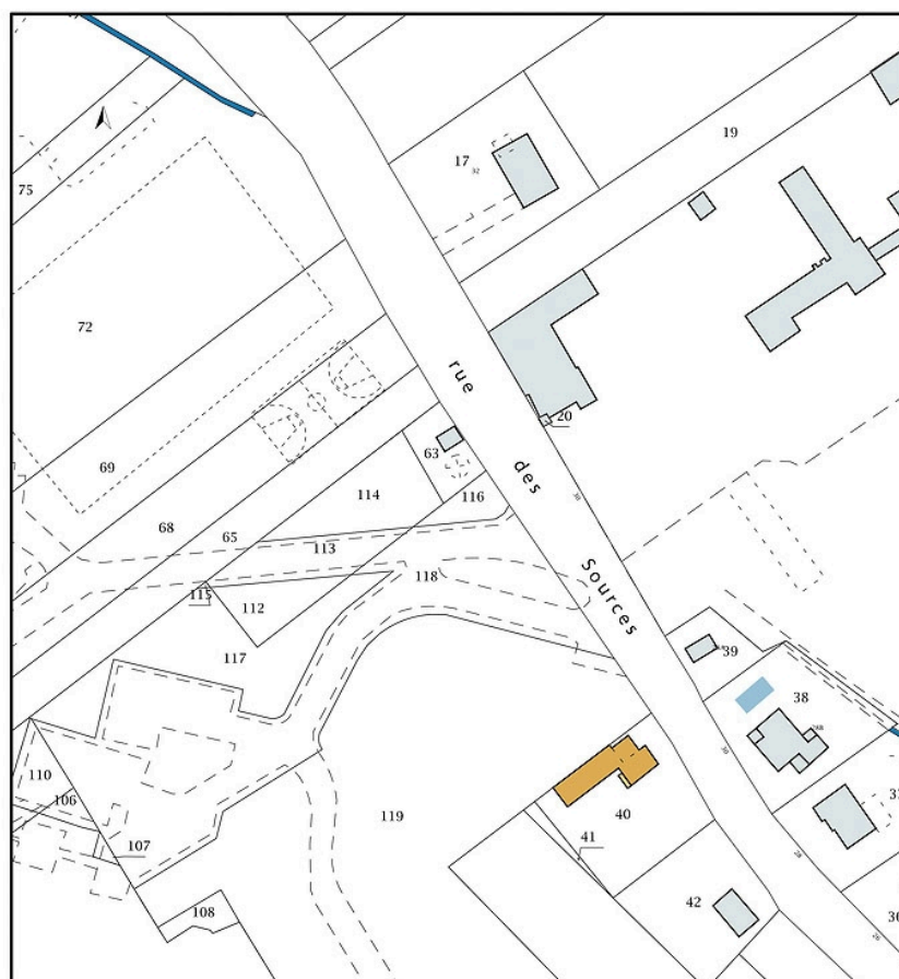
Plan-masse et de situation, extrait du plan cadastral (2020).