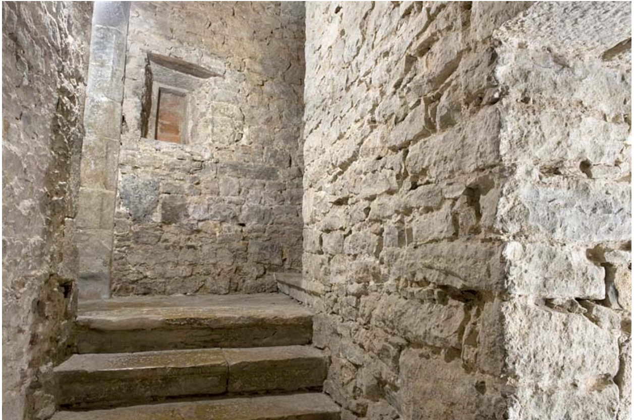
Escalier dans-oeuvre desservant les étages.