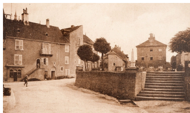
[Vue d'ensemble]. S.d. [milieu 20e siècle]. IVR43_20102500593NUC4A