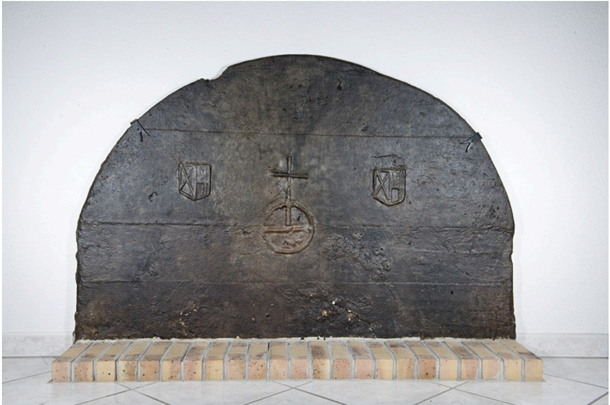
Plaque de cheminée de l'ancienne cuisine.