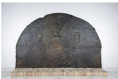
Plaque de cheminée de l'ancienne cuisine. IVR43_20112502371NUC4A