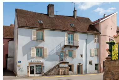
Vue rapprochée. IVR43_20102500672NUC4A