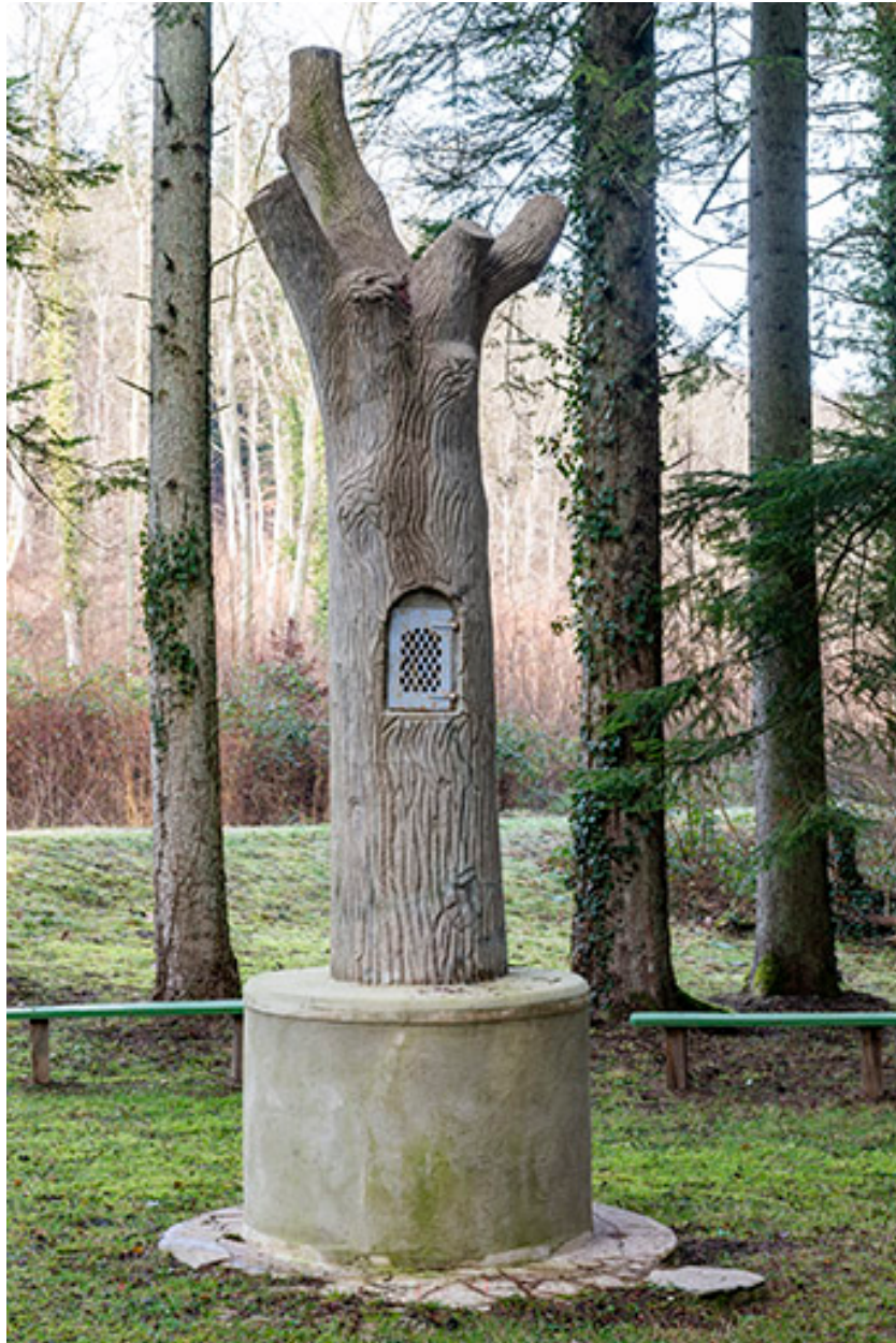
Tronc d'arbre artificiel.