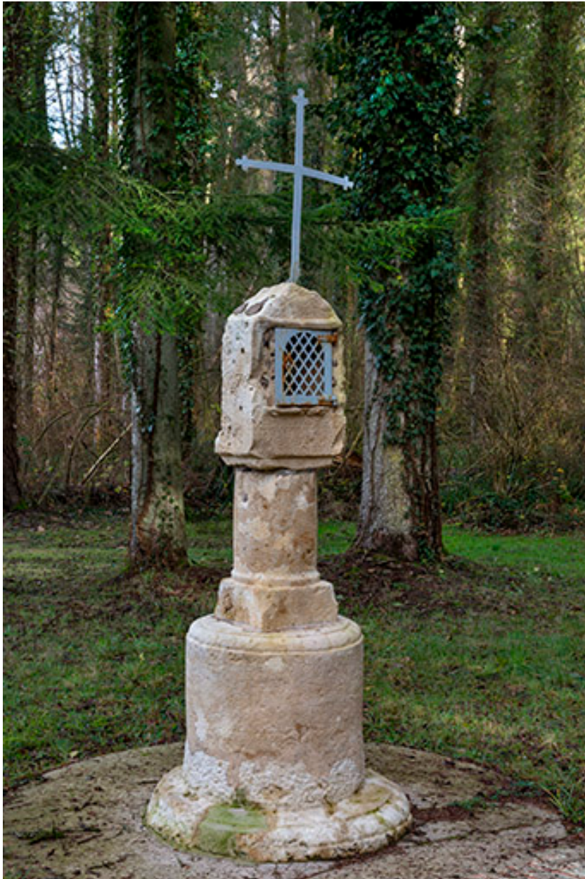
Édicule à niche.