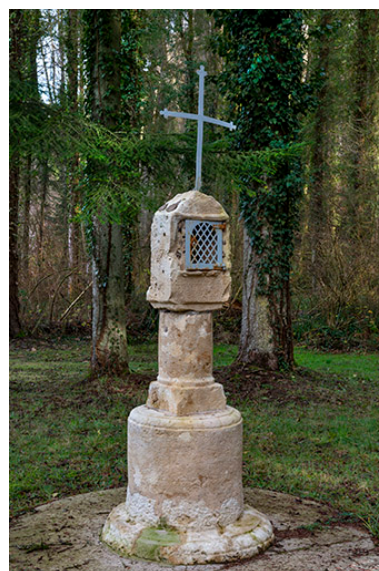
Édicule à niche.