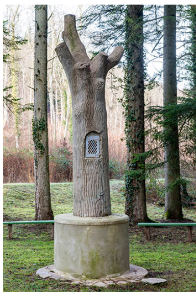
Tronc d'arbre artificiel.