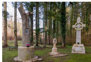
Tronc d'arbre artificiel, édicule à niche et croix monumentale.