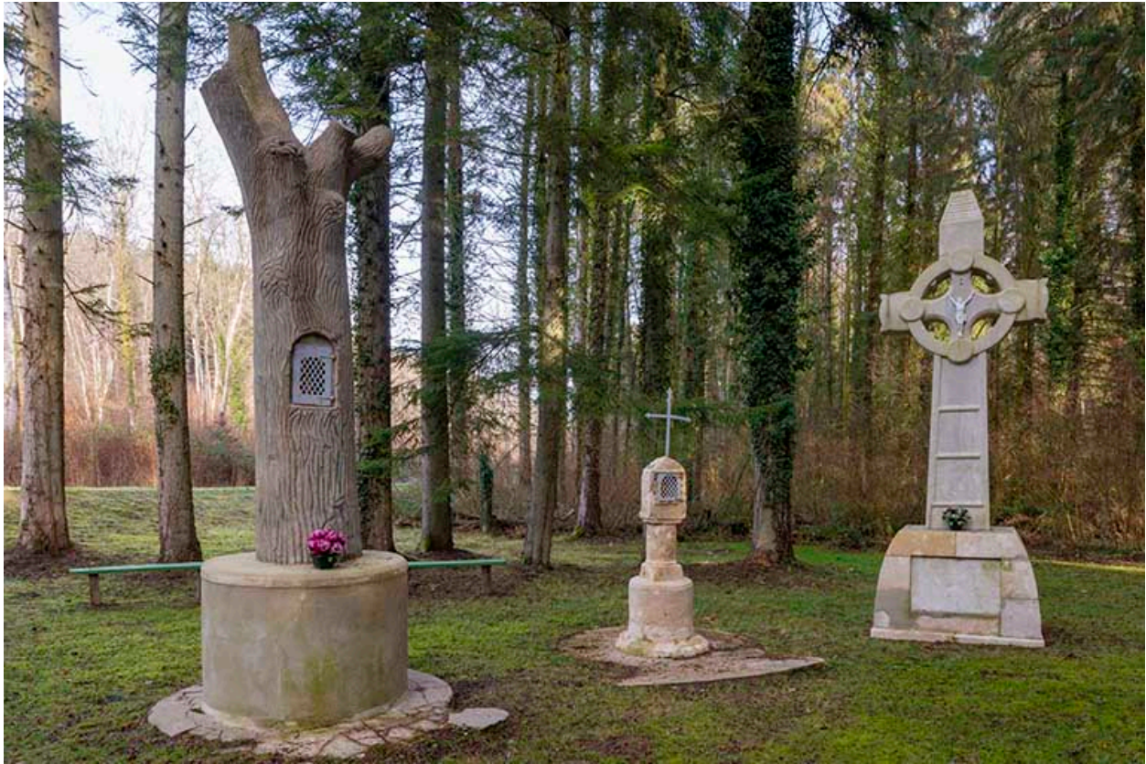
Tronc d'arbre artificiel, édicule à niche et croix monumentale.