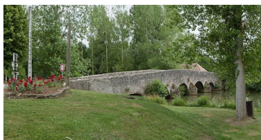
Vue du pont ancien sur l'Ouche prolongeant le pont sur l'écluse 36 du versant Saône.