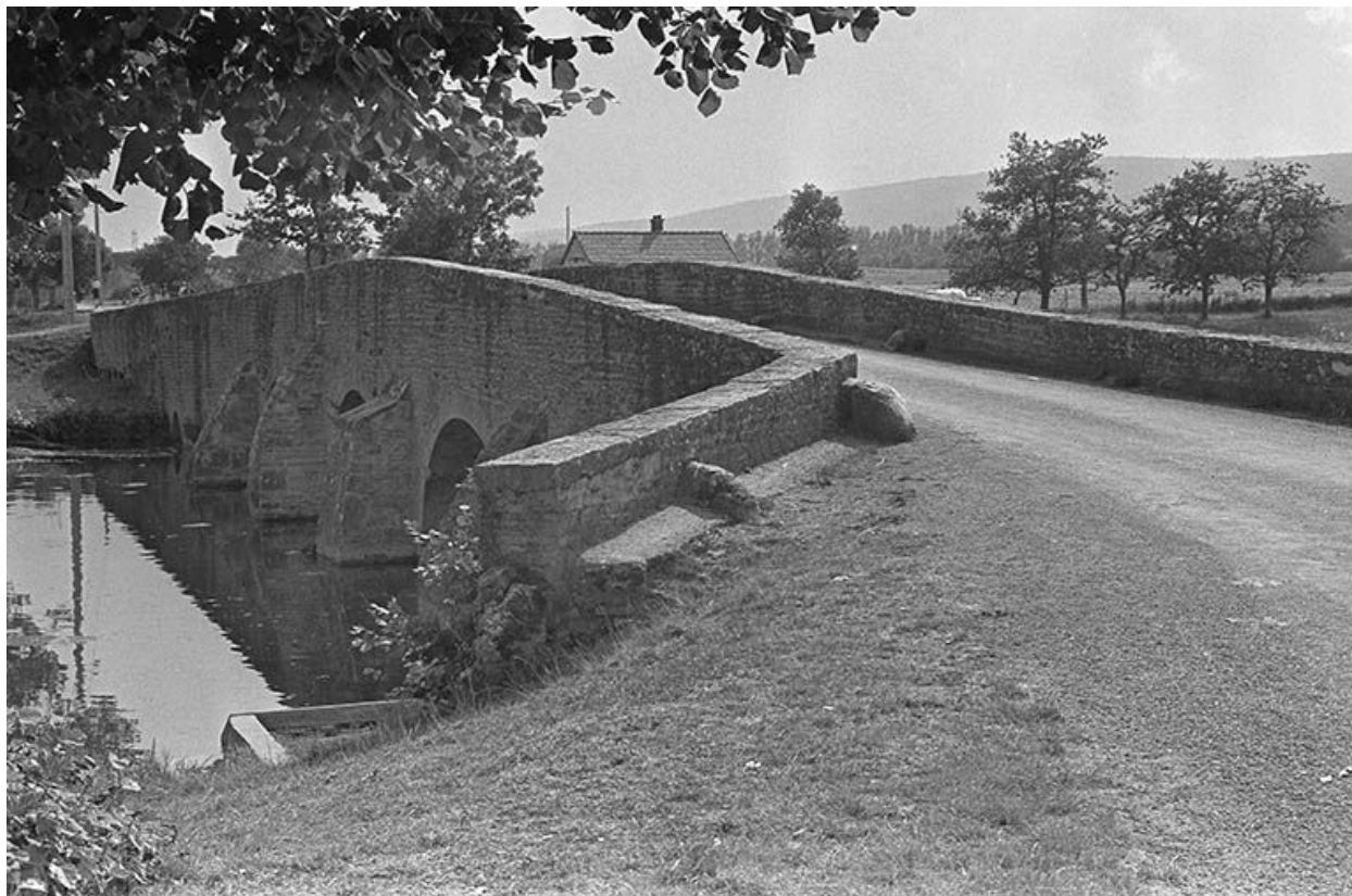
Vue d'ensemble en 1967.