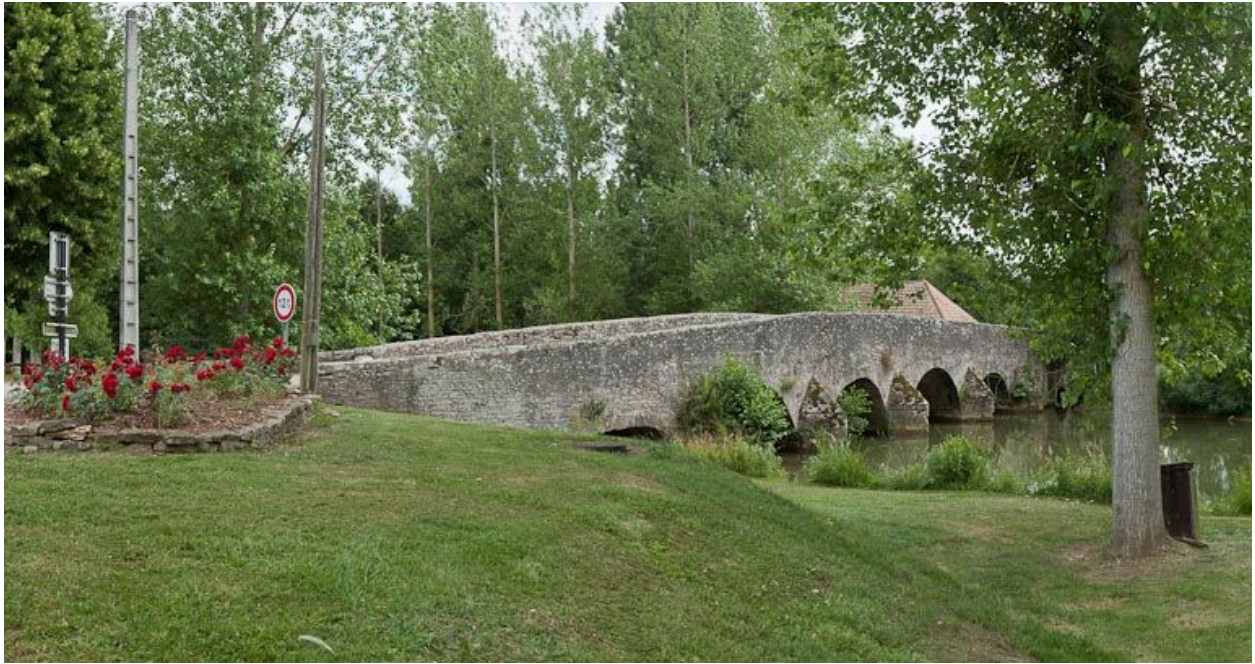
Vue du pont ancien sur l'Ouche prolongeant le pont sur l'écluse 36 du versant Saône.